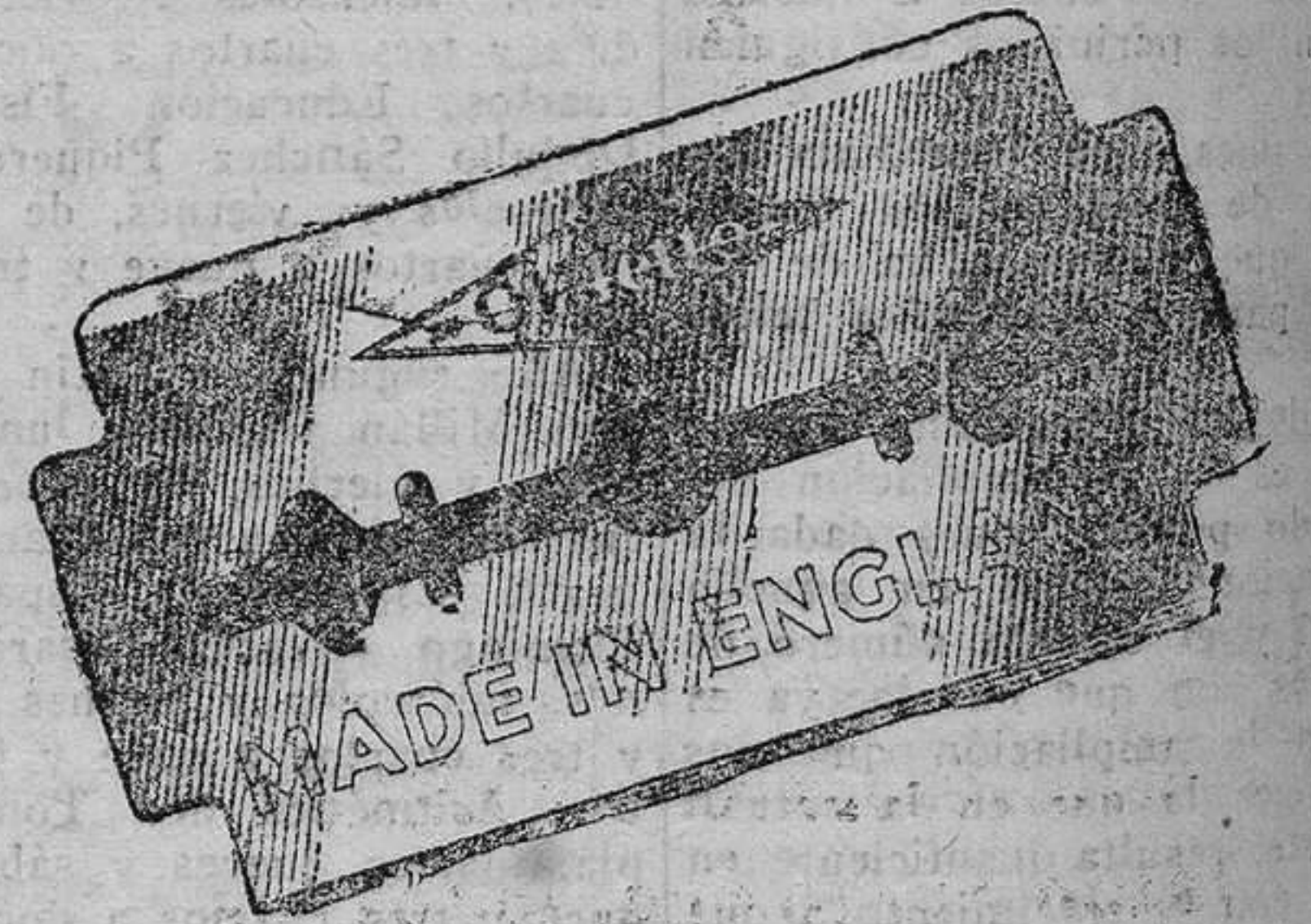
Las nuevas hojas se distinguen por la frase "Made in England" que se lee en la envoltura.