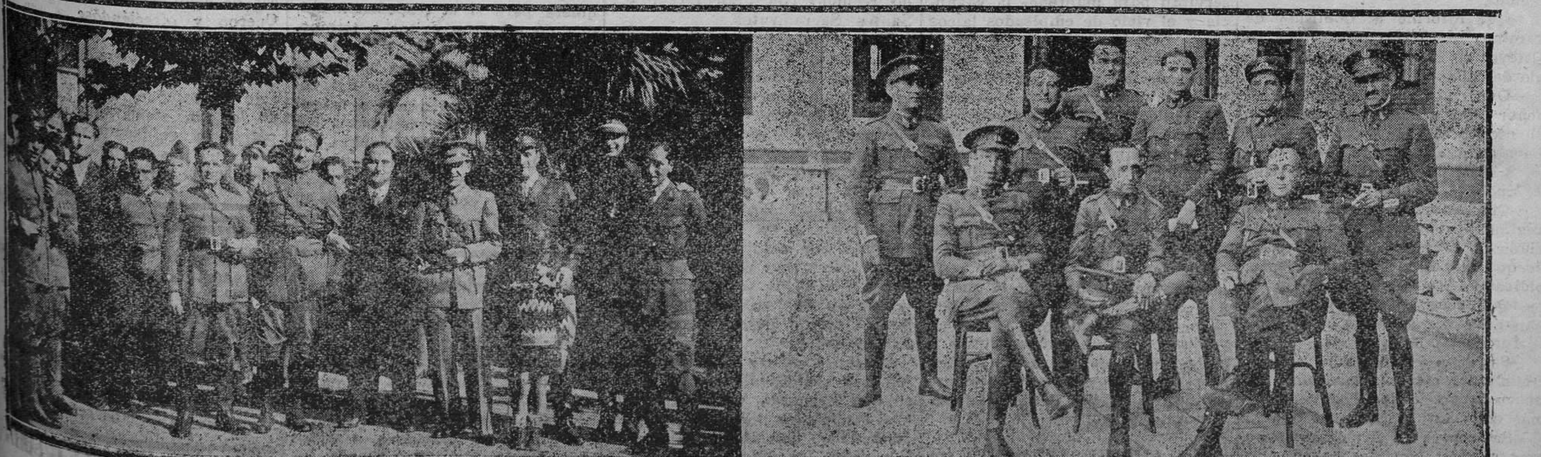
GIJON.—La fiesta del Ejército. Oficiales y suboficiales del batallón de Zapadores.

EN LA CAMPONA: Partido de campeonato entre el Gijón y el Oviedo.