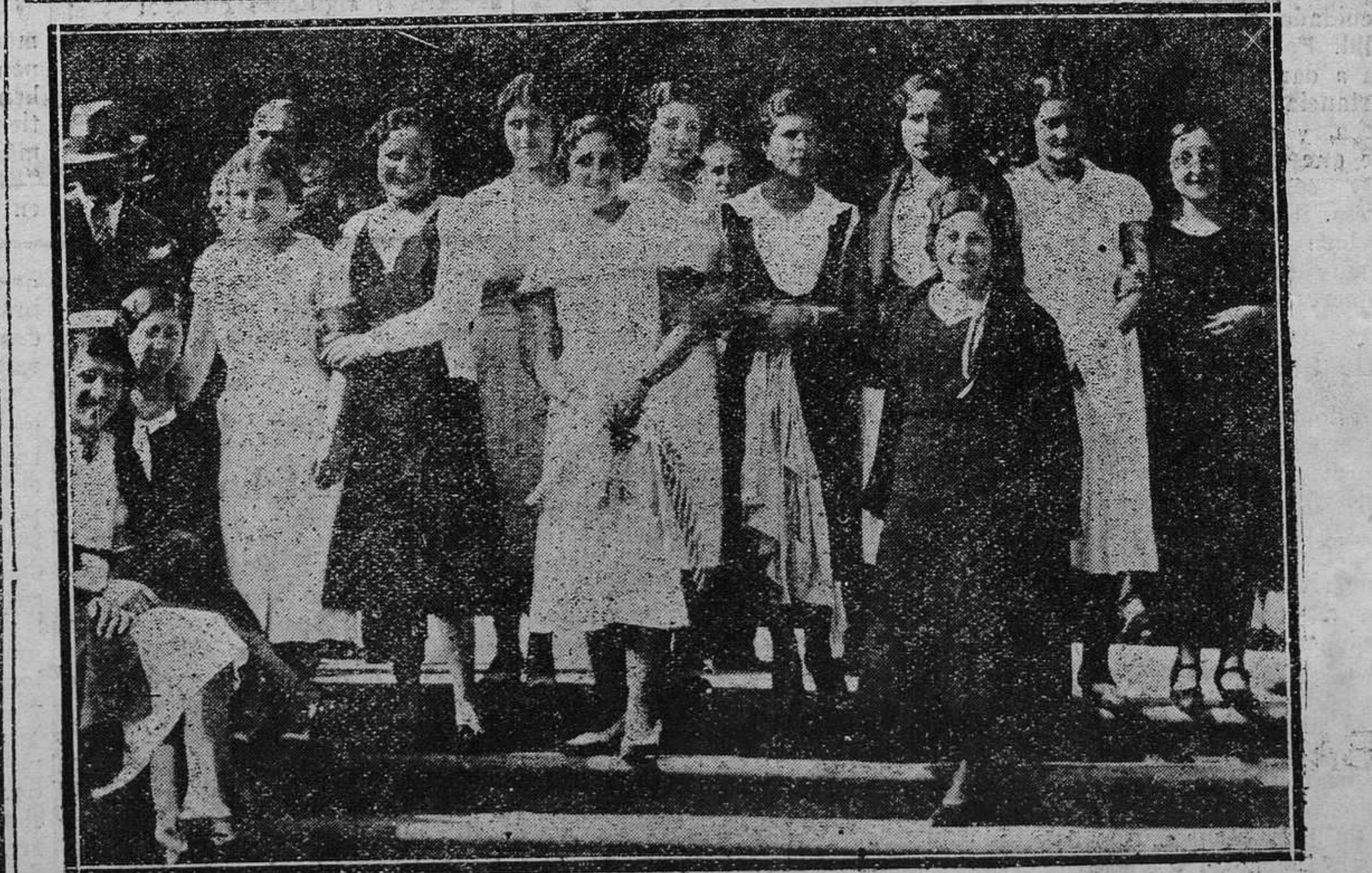
GRADO.—Un grupo de bellísimas mosconas, gala y ornato de la encantadora villa.