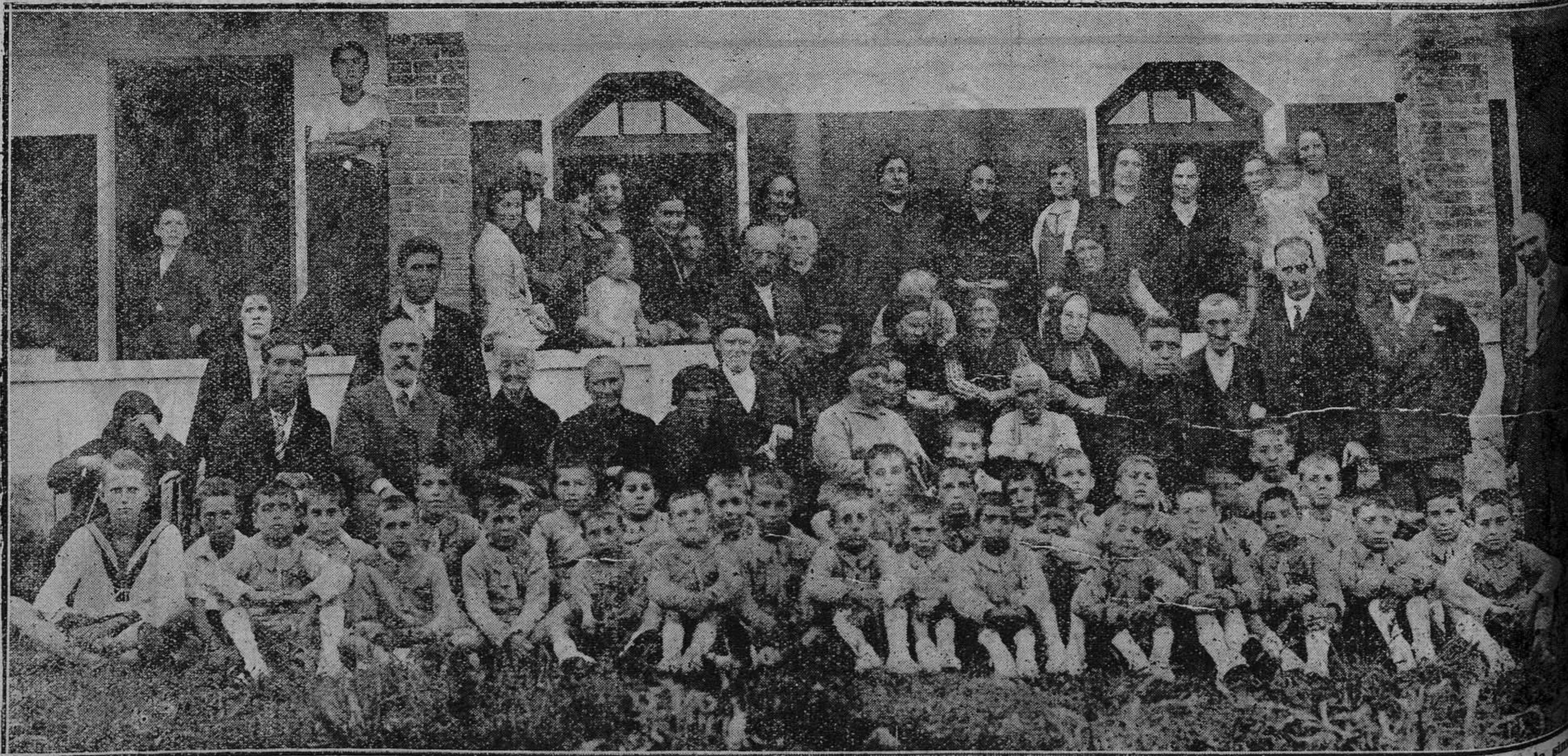
COMENSAJE A LA VEZ CELEBRADO EN LOS "ALBERGUES" DE COLUNGA.—Interesante grupo de colonos, ancianos y otros concurrentes a la fiesta, organizada, como en años anteriores, por la colonia escolar de La Isla, y que unió, en una tarde feliz para todos, el alborar y el ocaso de la vida.

Hay concedidas indulgencias a los que asistan a estos cultos.