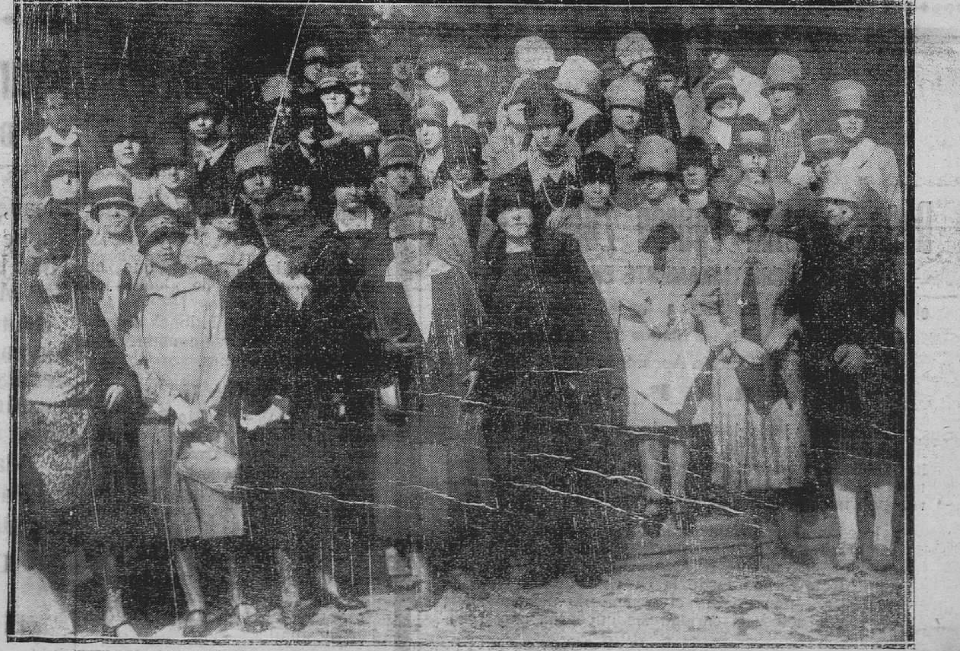
OVIEDO.-Grupo de bellísimas normalistas santanderinas, que han permanecido entre nosotros breve tiempo, en viaje de estudios.