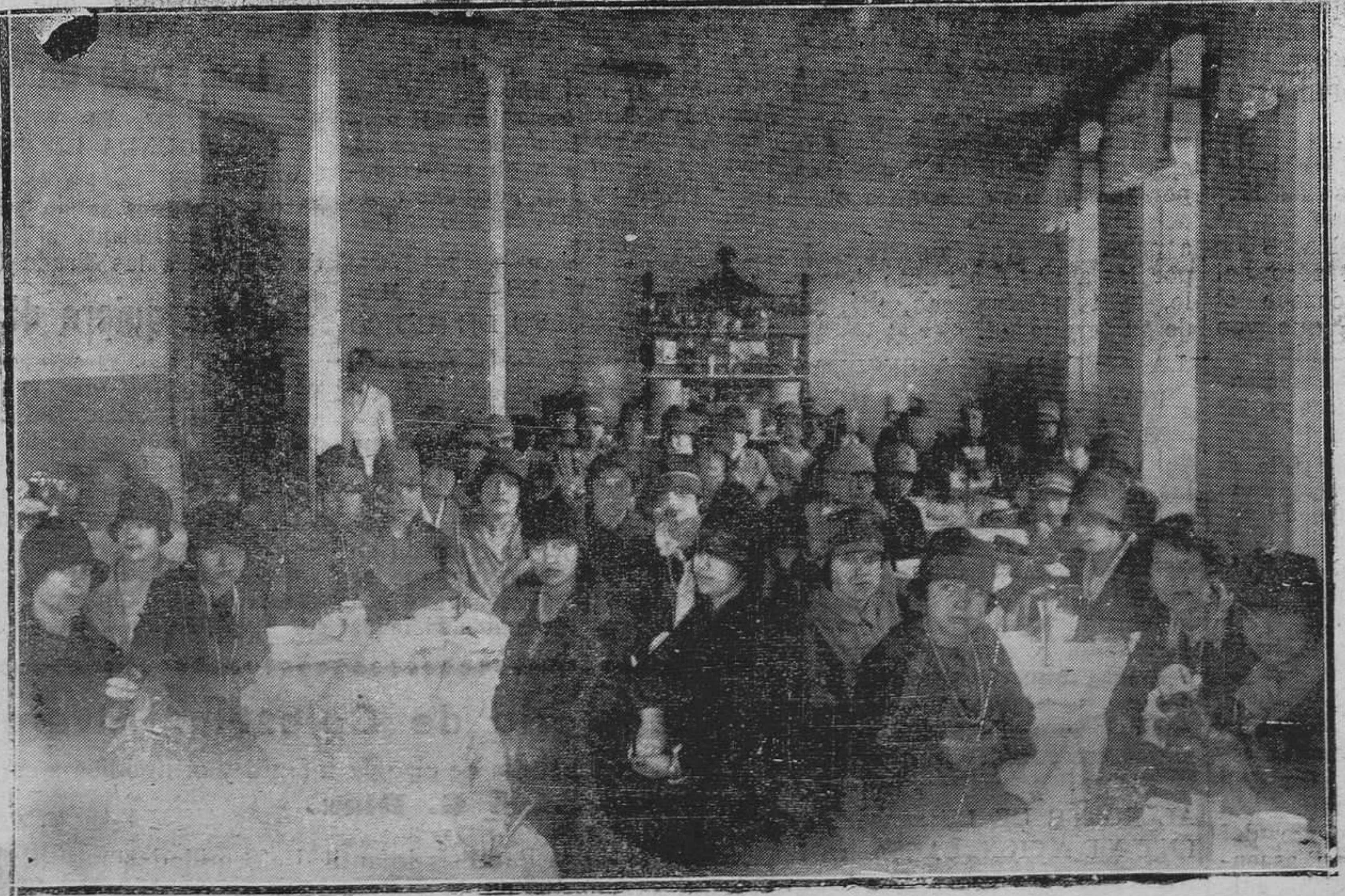
OVIEDO. Un aspecto del comedor del Hotel Inglés, durante la estancia en ésta de las bellísimas normalistas de Santander.