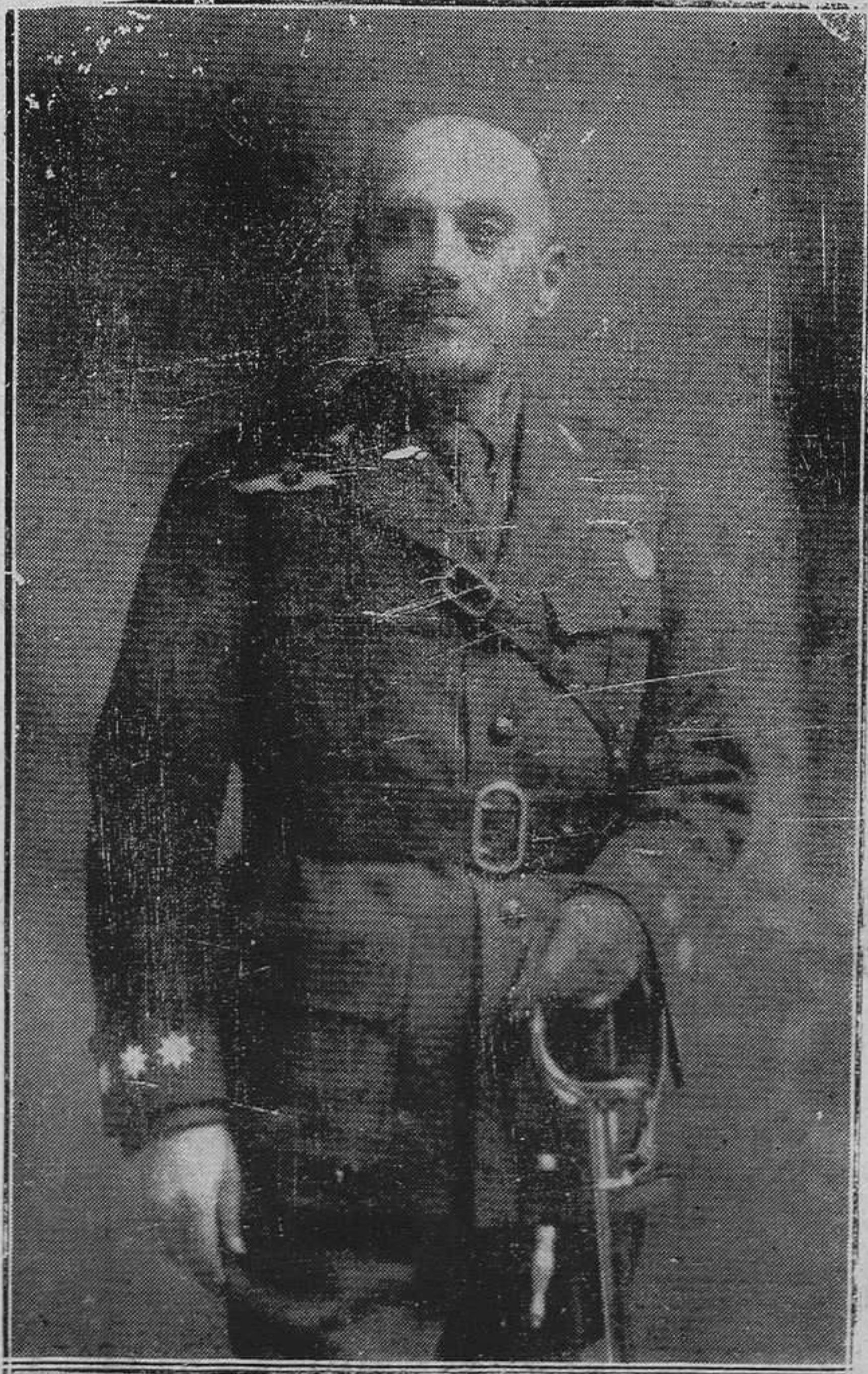
OVIEDO.—El coronel de Ingenieros, jefe del sexto de Zapadores, que ha sido ascendido al empleo inmediato.