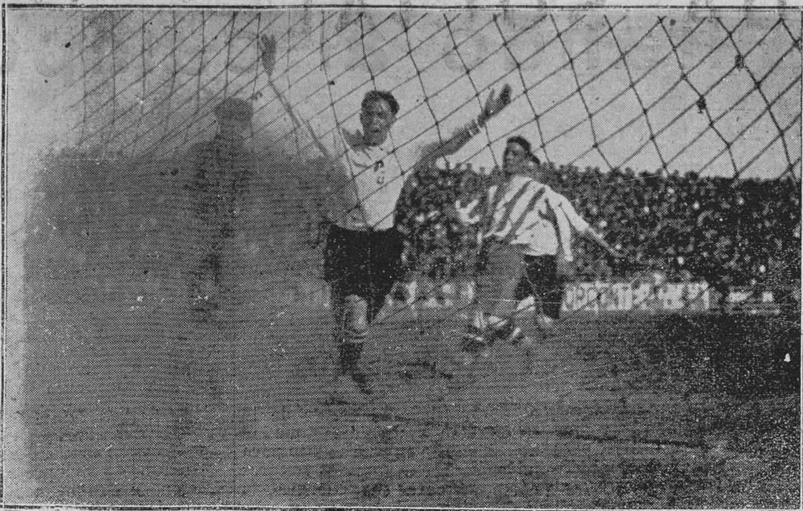
SANTANDER: IRUN-SPORTING.-El primer goal del Irún, en el segundo tiempo.