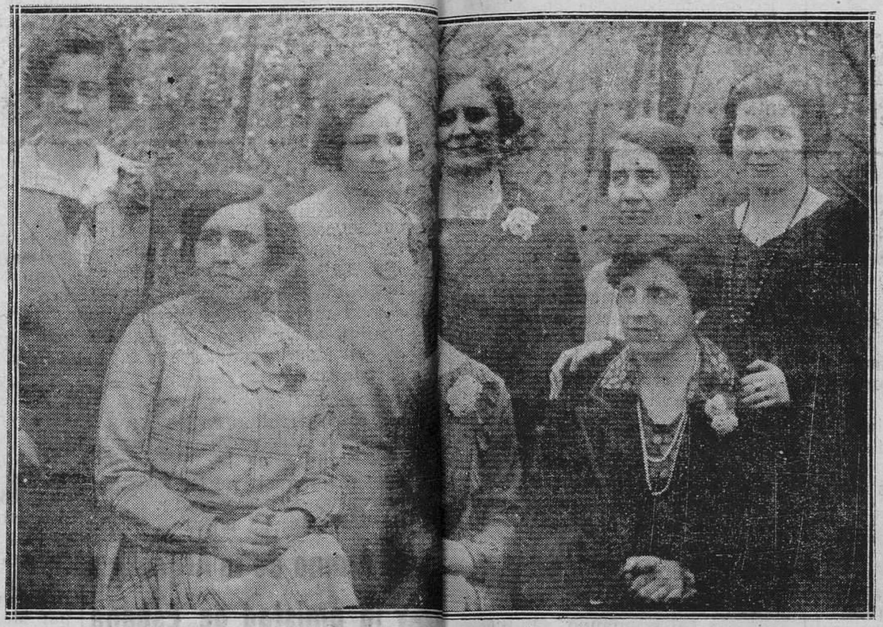
OVIEDO.-Grupo de bellísimas funcionarias de Haasistieron al banquete celebrado recientemente en