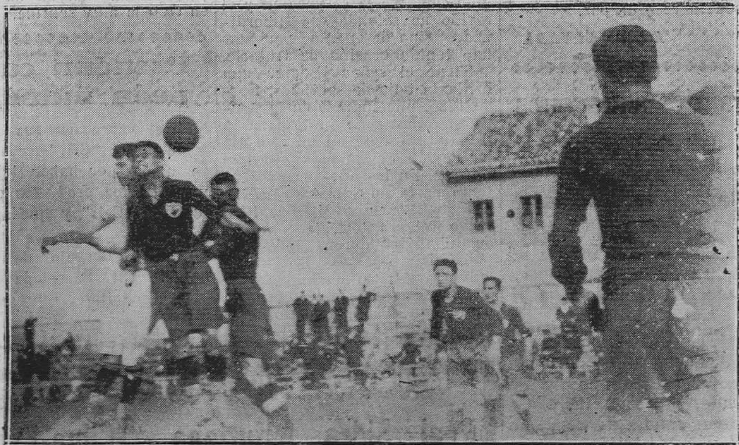
OVIEDO: EL PARTIDO DEL DOMINGO.-Un corner contra los gijoneses.

El señor Cuesta prometió atender, por todo con la diligencia de siempre.