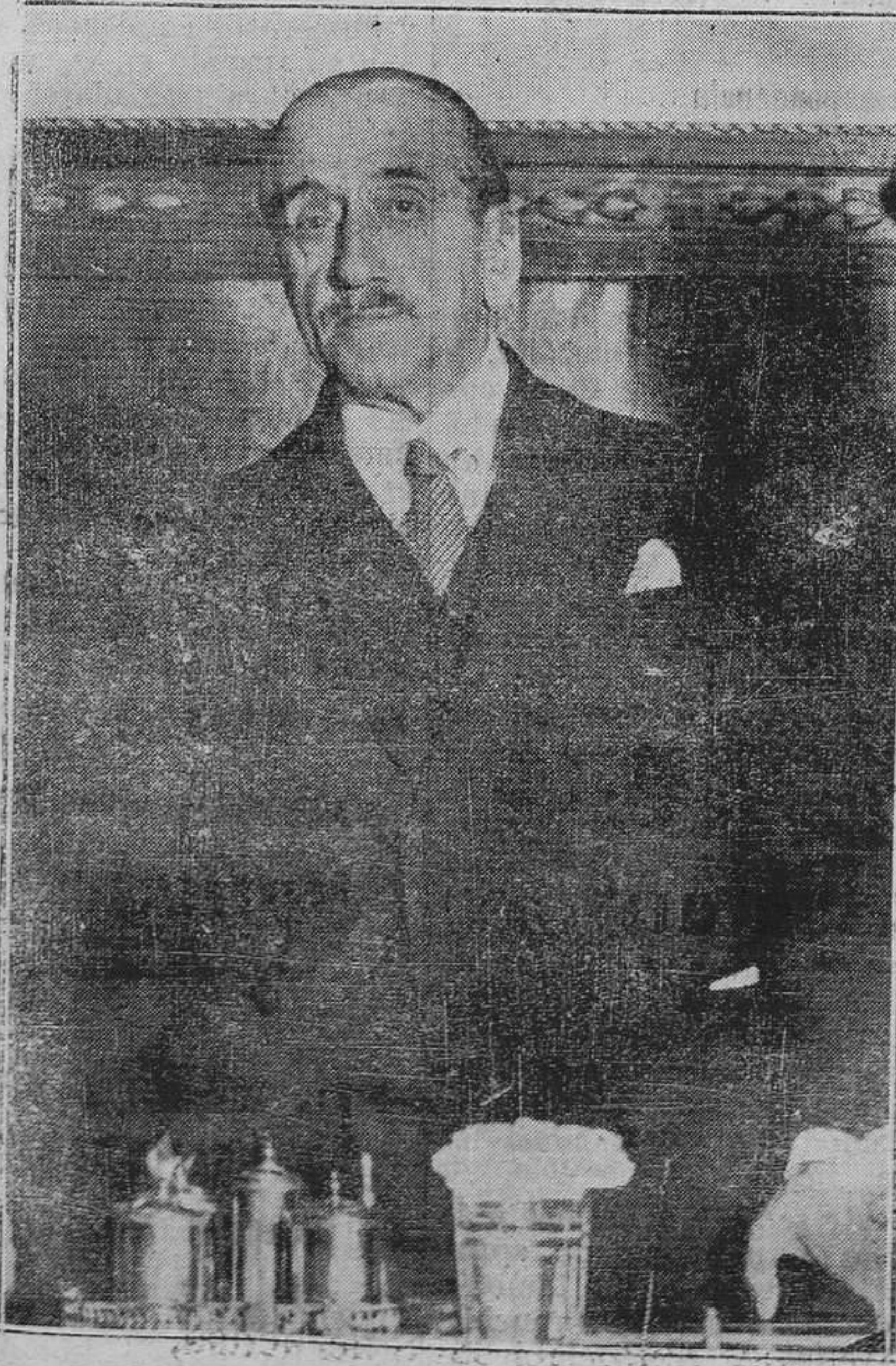
El nuevo alcalde de Madrid, don Manuel Semprún.