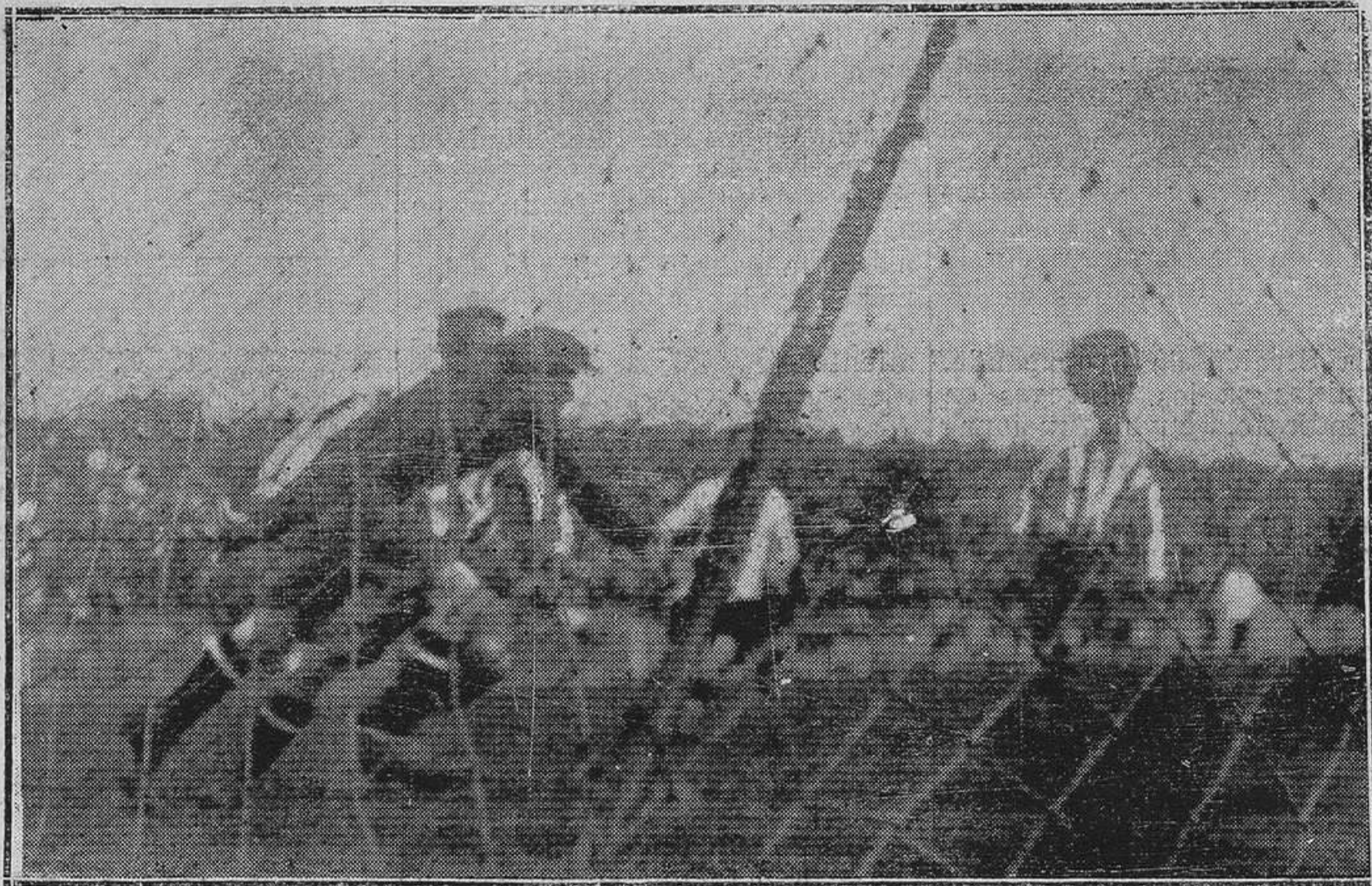
SANTANDER: IRUN-SPORTING.-Una jugada ante la meta asturiana.

Busdongo, 15 mayo, 60 kilómetros, entrenamientos.