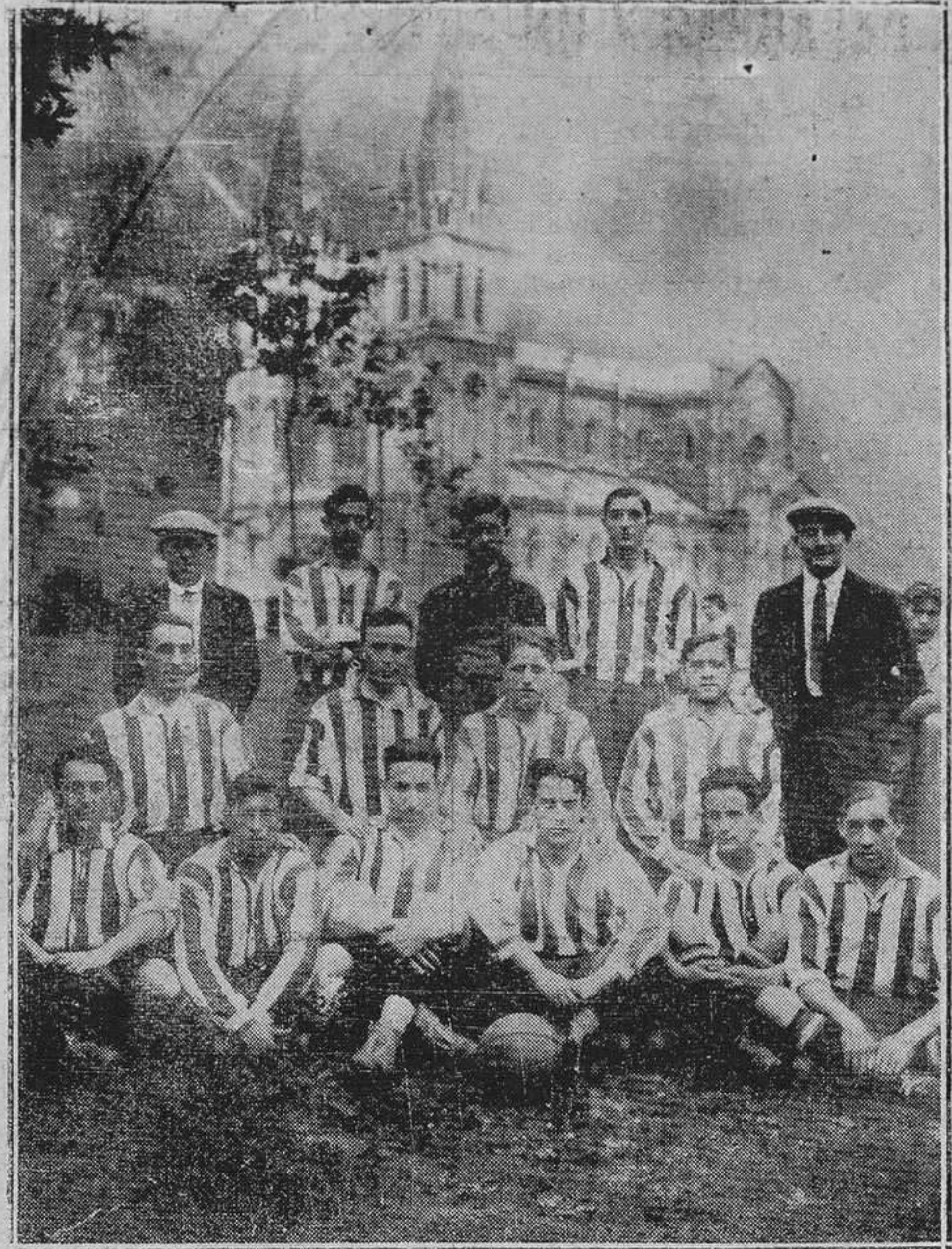
CLADONGA.—Los jugadores del Real Spórting de Gijón, que hoy lucharán en Santander con el Real Unión de Irún.

Agentes: Hermanos García Alvarez ALMACENISTAS - OVIEDO