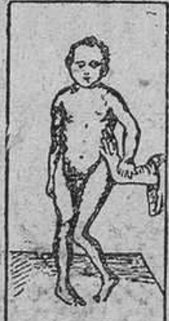
ENFERMEDAD DE LITTE