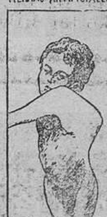
MAL DE POTT Y QUEBRADURA