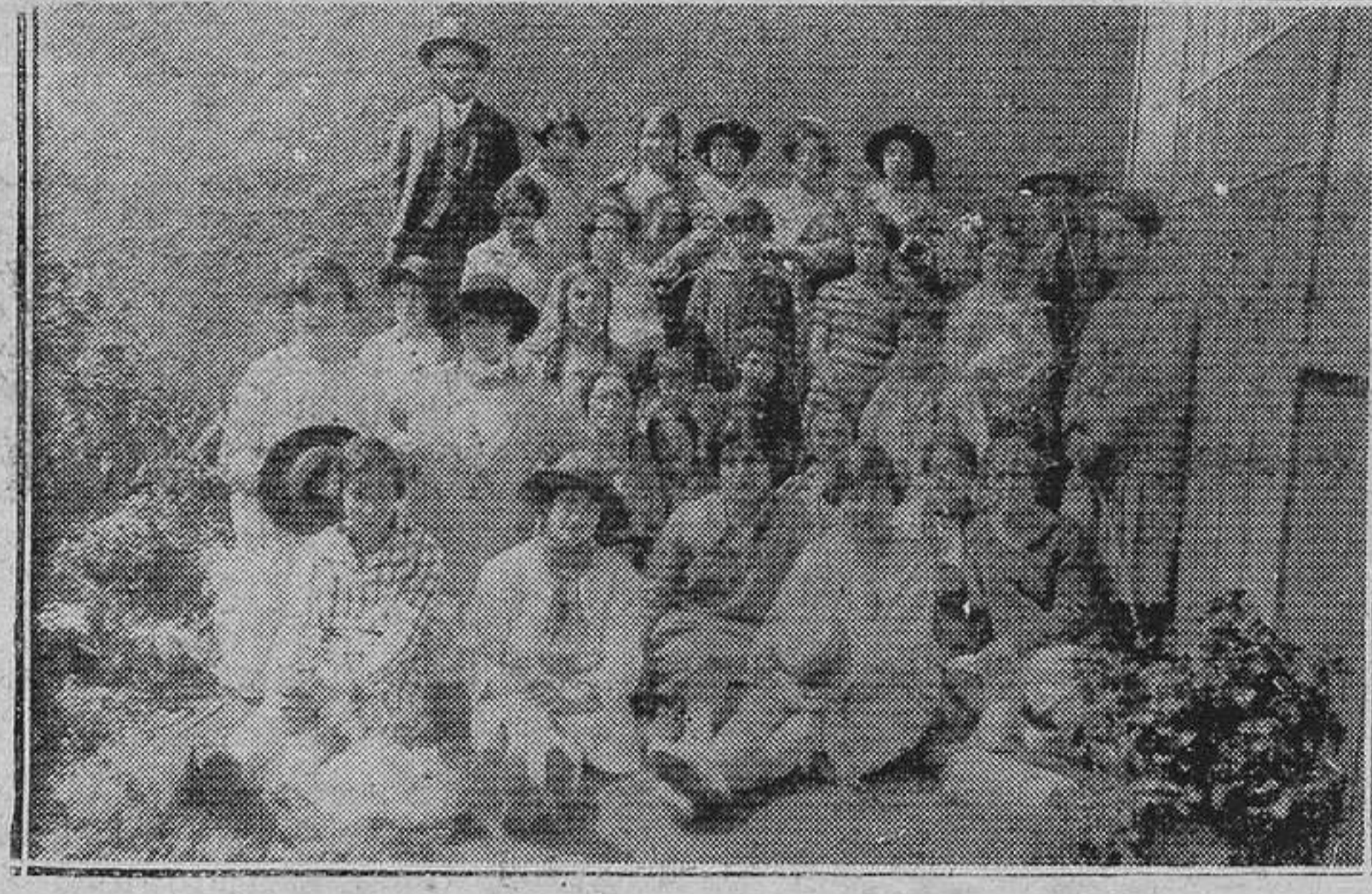
Un grupo infantil de Mieres en horas de sport.