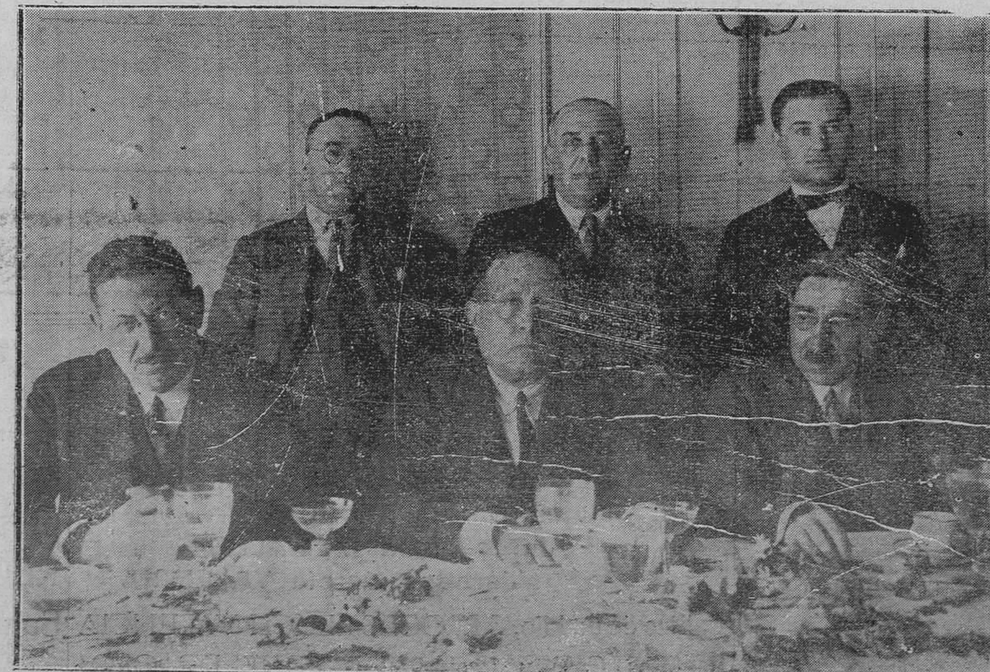
SANTANDER.—Banquete dado en Royalty por la Asociación de la Prensa al ilustre escritor Azorín, por el estreno de su obra "El doctor Death, de 3 a 5".