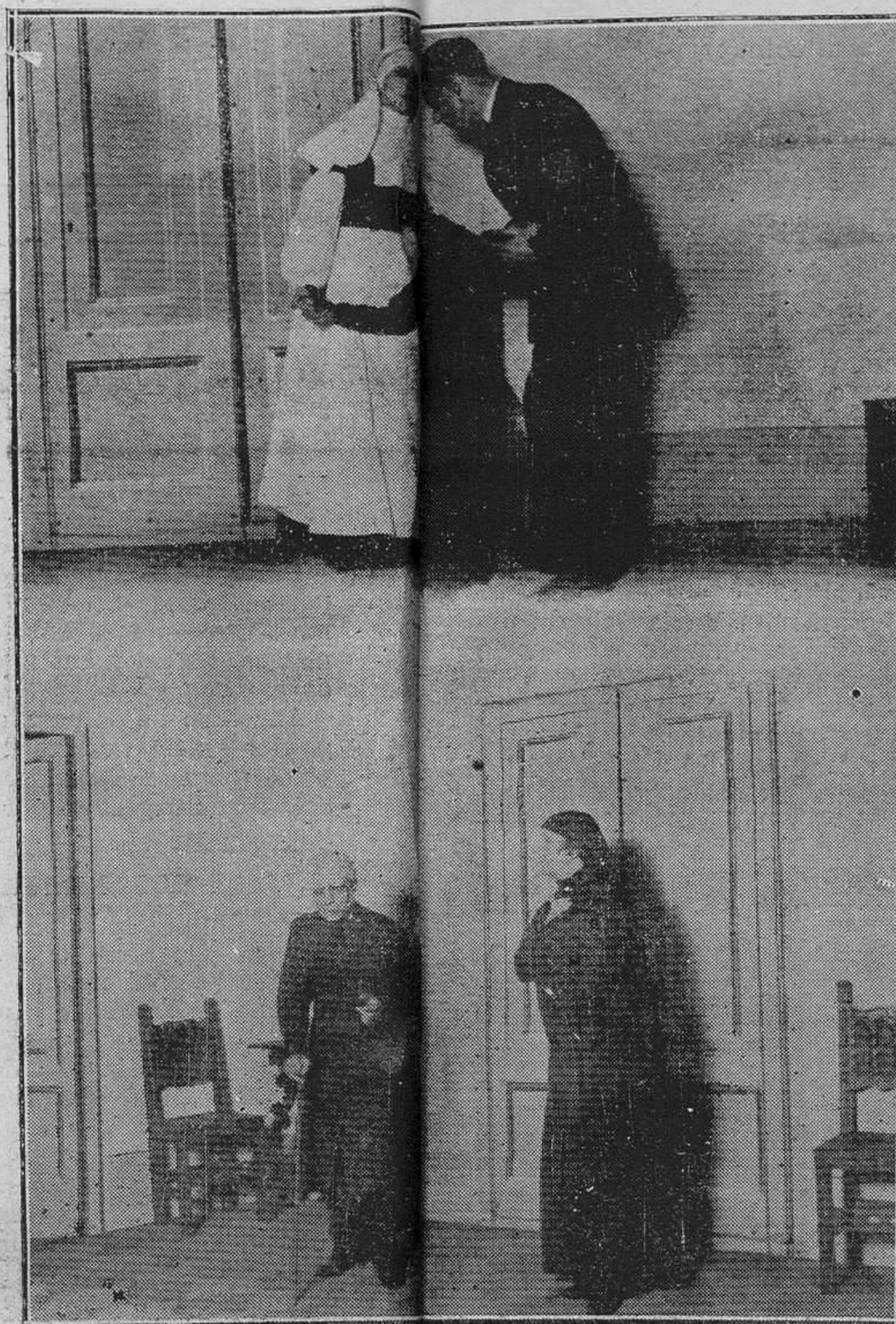
SANTANDER.—Dos escenas de la nueva producción de "El doctor Death, de 3 a 5" estrenada en el teatro Pereda