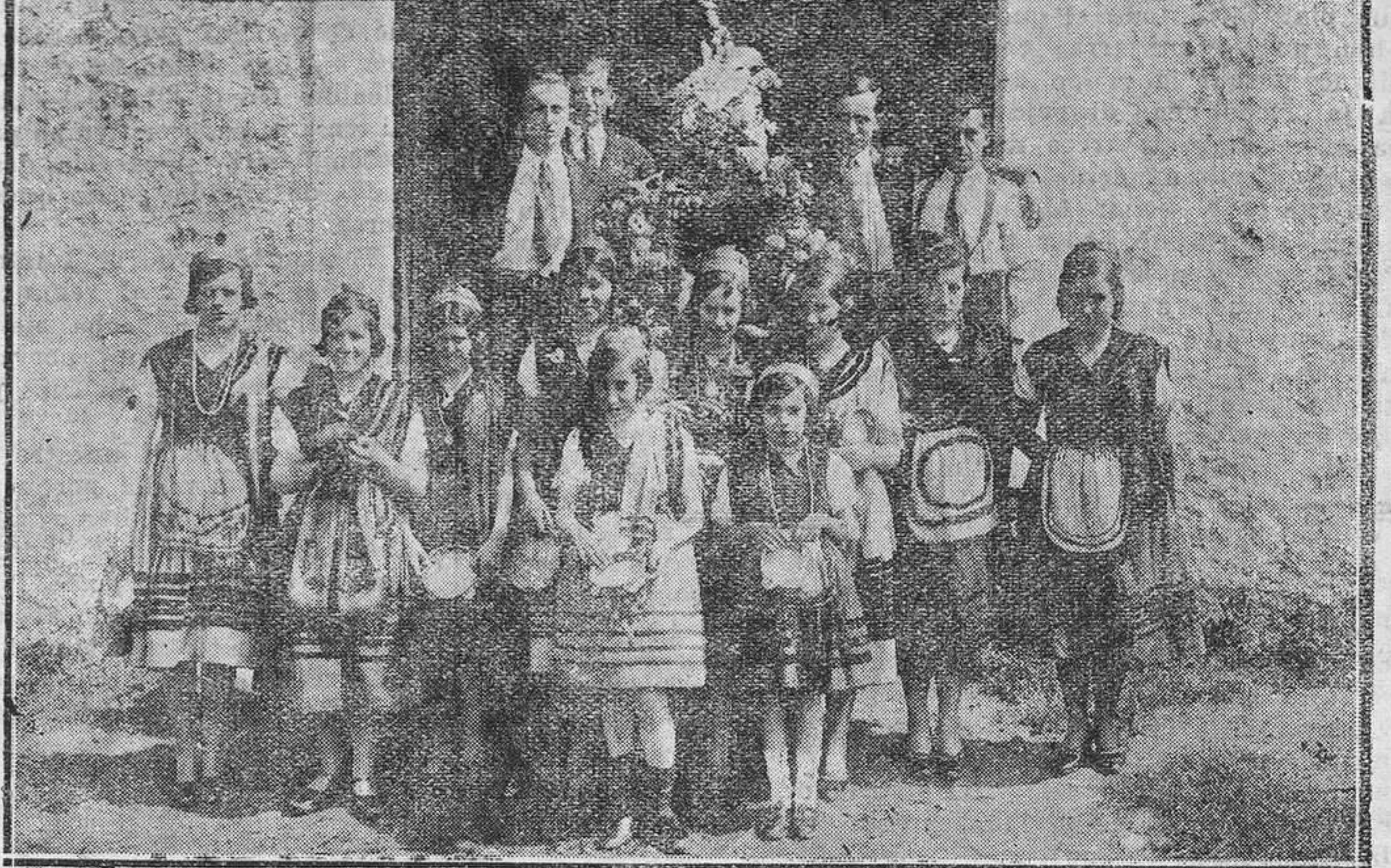
LLANES.—La tradicional romería de San Felipe. Un grupo de "nenas" que se inicia en las costumbres tradicionales y el "ramo" que portan los jóvenes llaniscos. (Fotos Rozas).