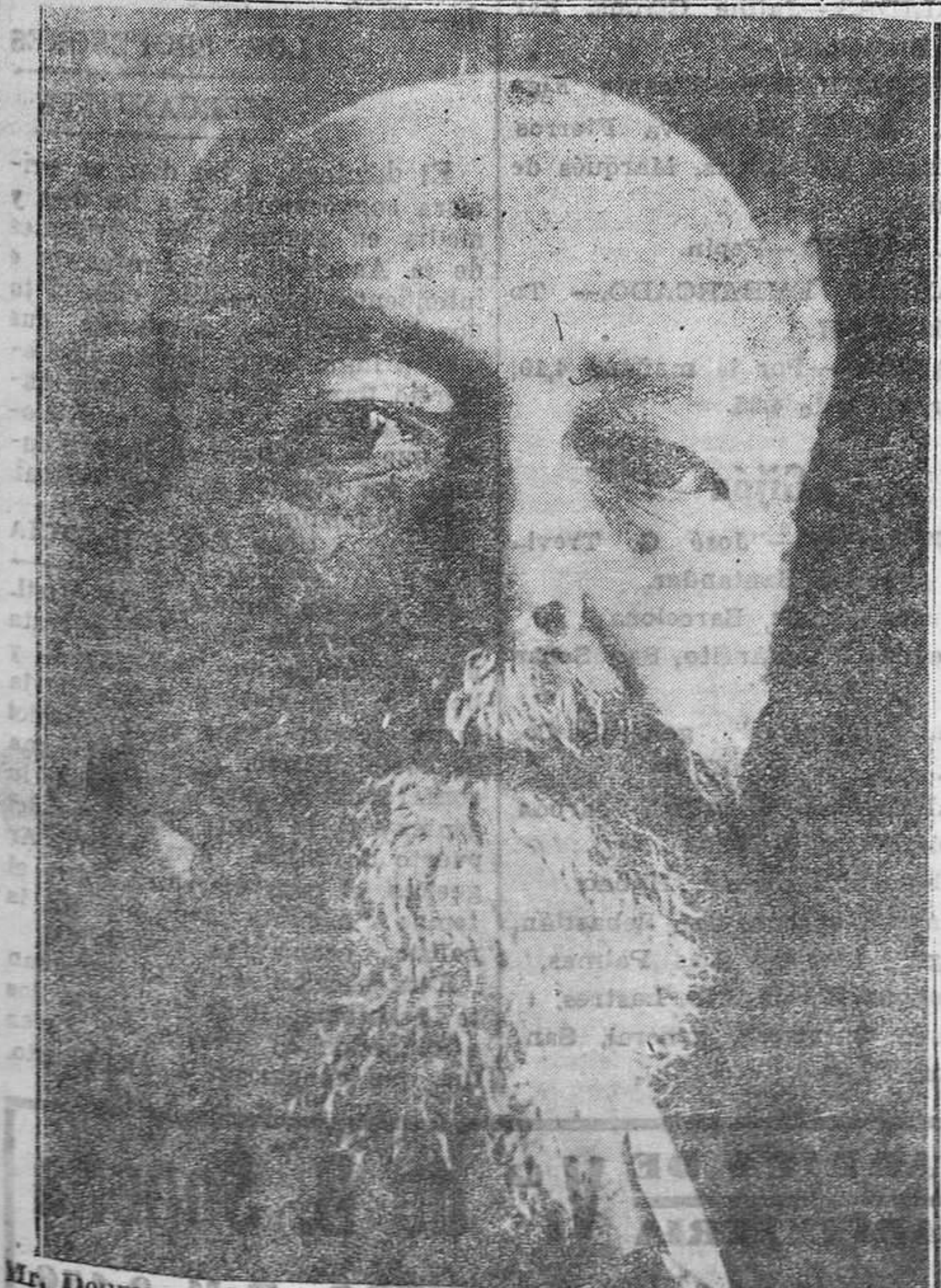
Mr. Doumer, presidente de la República francesa, que ha sido víctima de un atentado criminal.

Ayer, cuando entraba en la Exposición del Libro, celebrada en París, fué agredido por un súbdito ruso Mr. Doumer, resultando herido de tres tiros de pistola. (Amplia información en la página 7).