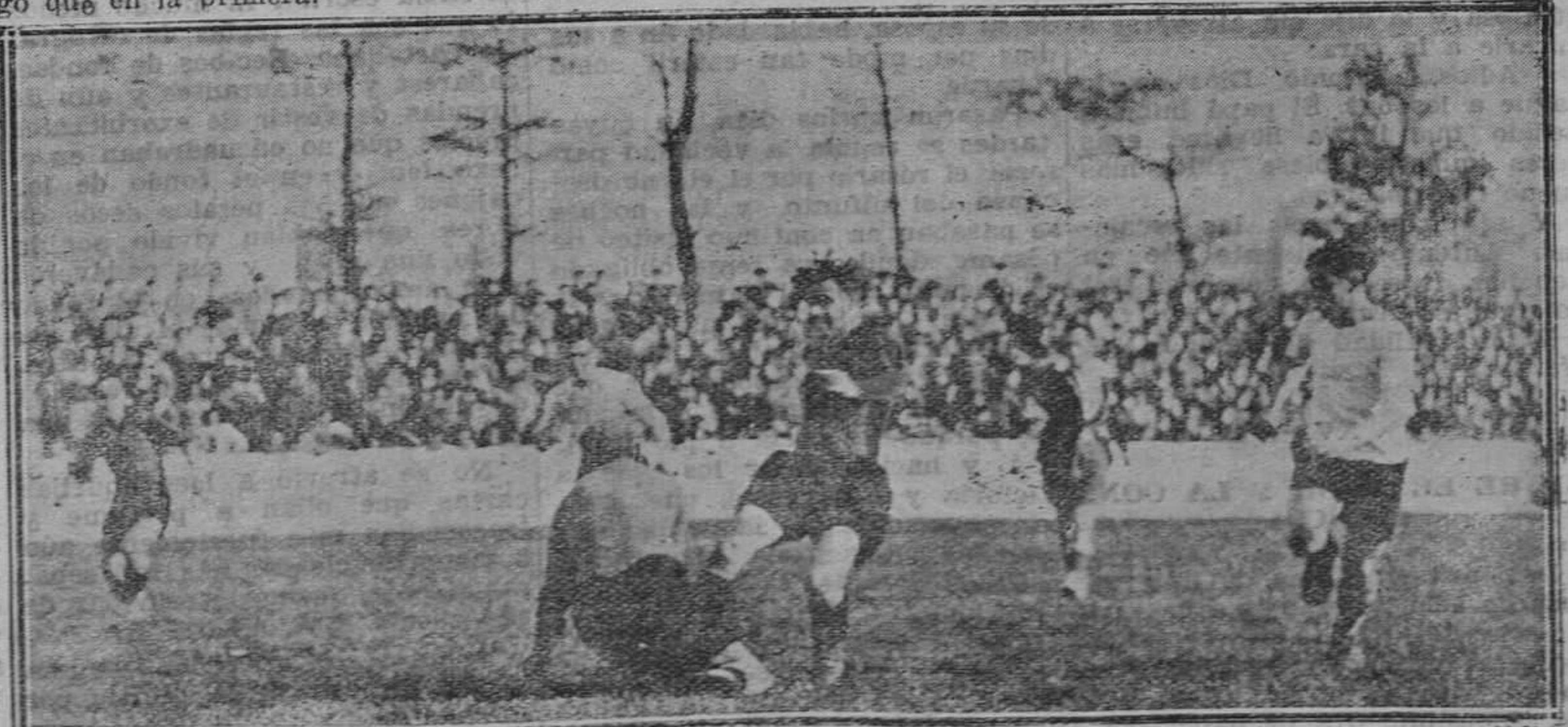
La fotografía da idea del juego duro que se desarrolló en el partido de Bilbao, en el que resultó lesionado de consideración el guardameta Oscar. (Archivo REGION N).

Estos encuentros se jugarán en los campos de los equipos citados en primer lugar y la vuelta en los campos contrarios.