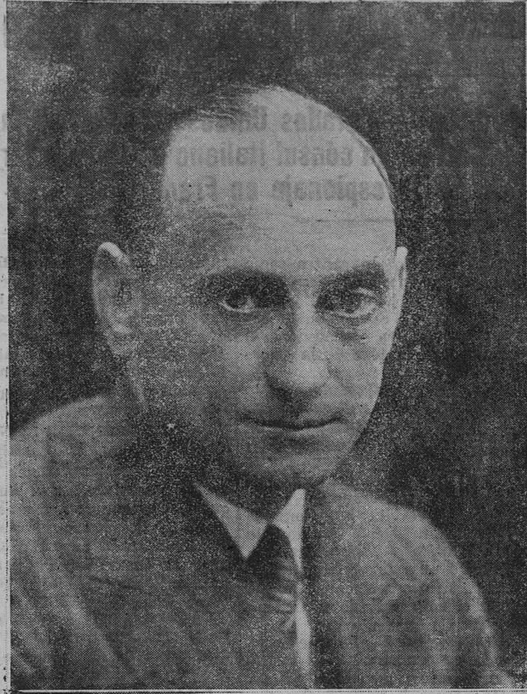
Don Santiago Casares Quiroga.

A las preguntas que se le hicieron, contestó con frialdad y aplomo.