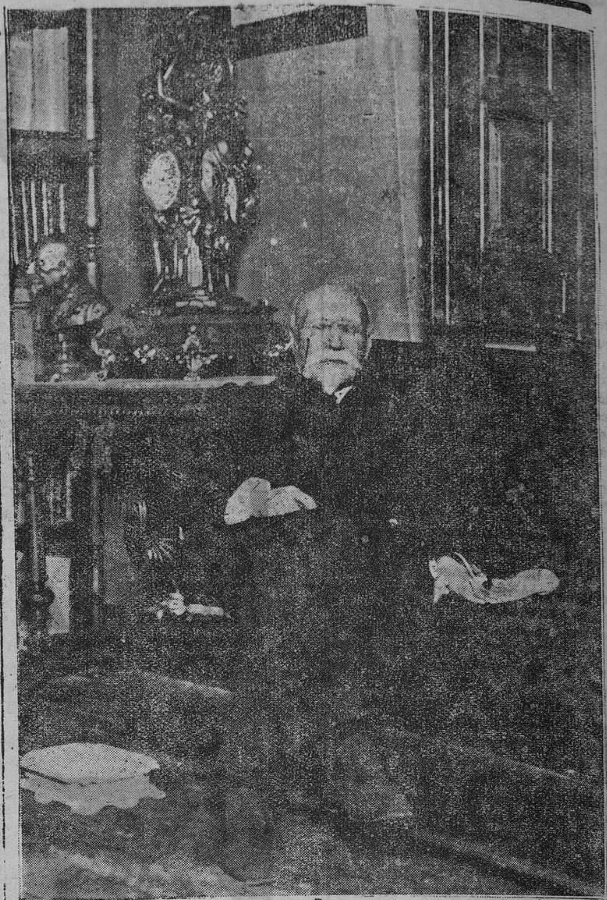
Don José Echegaray, cuyo centenario de su nacimiento se celebró ayer.

En la mañana de ayer, fué descubierto el robo, de que se dió conocimiento a la policía, la cual empezó sus indagaciones para descubrir a los autores de este nuevo atentado contra la propiedad.