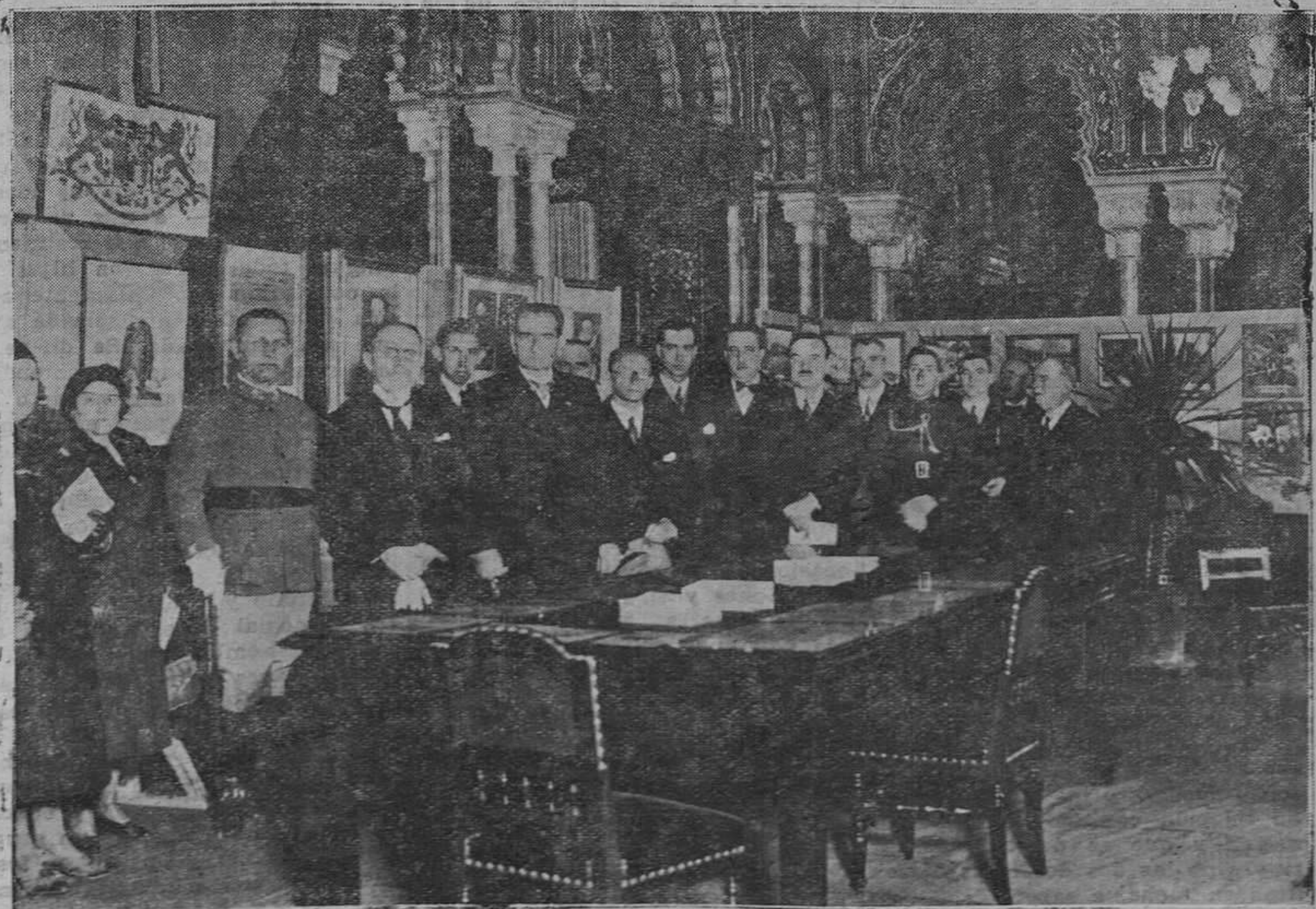
Las autoridades de Bilbao con el ministro de Checoslovaquia, señor Kybal, en el acto inaugural de la exposición de recuerdos españoles conservados en Checoslovaquia, que se celebra en el salón árabe del Ayuntamiento..

No se devuelven los originales ni se sostiene correspondencia sobre los mismos.