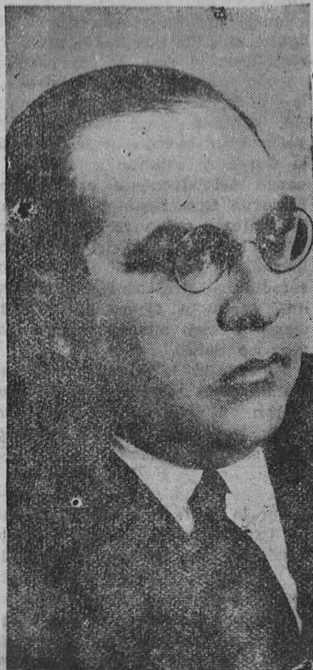
Don Genzalo Estrada, embajador de Méjico en Madrid, que ha presentado sus cartas credenciales al presidente de la República.