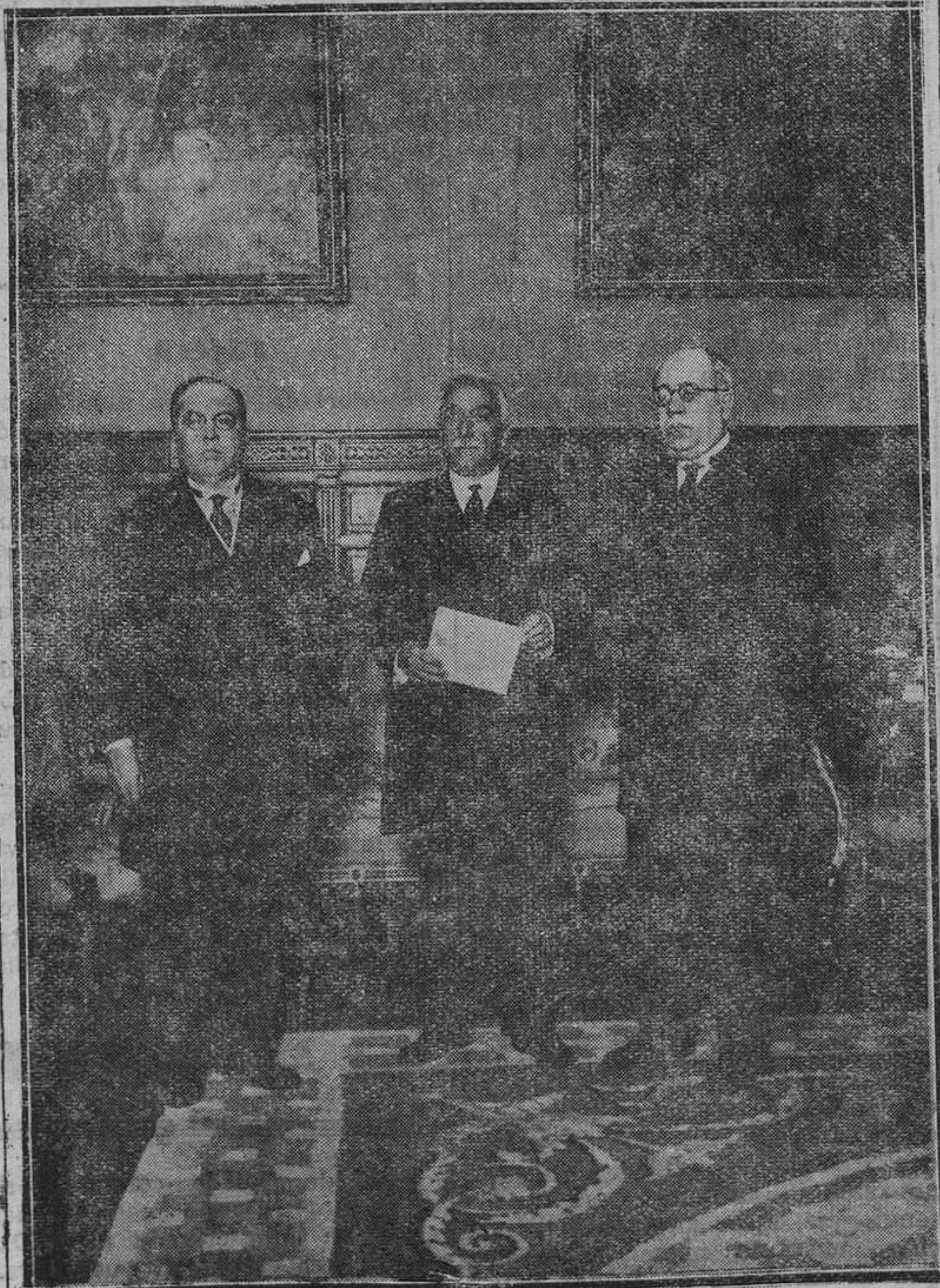
MADRID.—Presentación de credenciales. El presidente de la República con el nuevo embajador de Méjico y el jefe del Gobierno..

dad de los jesuitas la Santa Cueva de Manresa, tan íntimamente asociada con la Compañía, sino del Obispo de la diócesis así como las demás casas que en Manresa ocupamos. Son, por otra parte muchas las residencias que con sus iglesias pertenecen a la respectiva diócesis y de ningún modo a los jesuitas que en ellas viven y trabajan. Salamanca y Tortosa pueden citarse entre las más conocidas; pero hay un gran número de ellas propiedad, como éstas, de la diócesis.