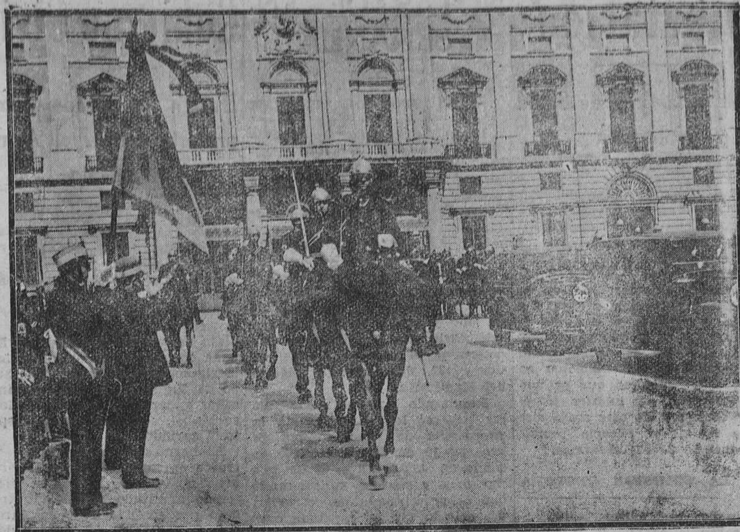
MADRID.—Presentación de credenciales. El automóvil que conduce al nuevo embajador de Méjico al salir del Palacio Nacional rodeado de la escolta presidencial.

A muchos sorprenderá la noticia de que tampoco es propie-