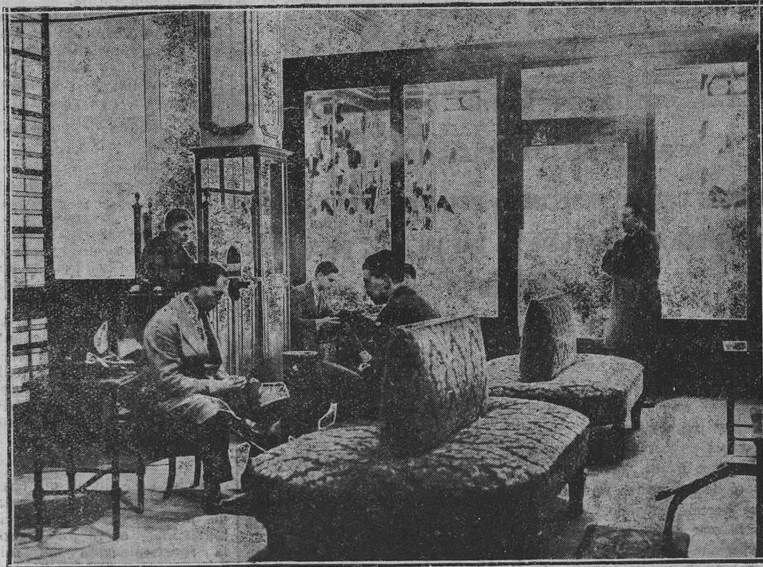
INTERIOR DEL COMERCIO DE CALZADOS "LA REAL"

Nuestras informaciones comerciales vienen obteniendo un señalado éxito, y no por nosotros, sino por la importancia de la industria que intentamos destacar.