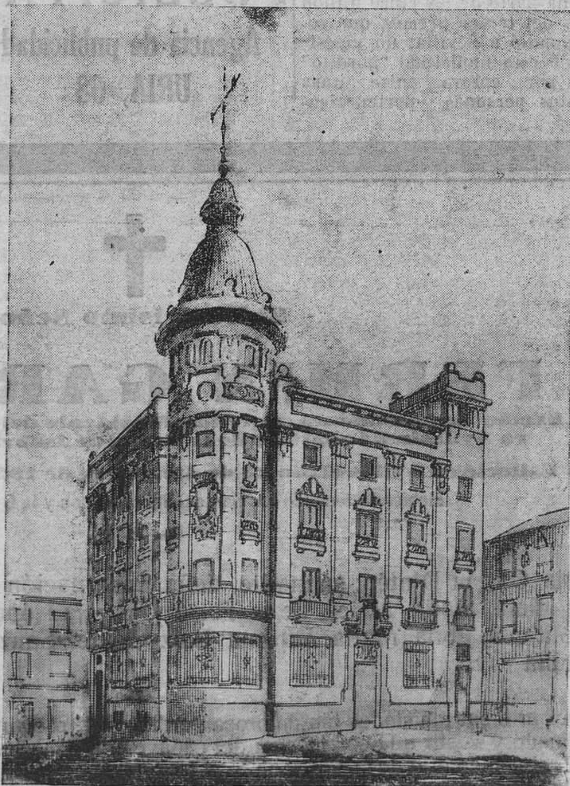
OVIEDO.— Perspectiva del futuro edificio que se levantará en la Plaza de la Constitución, donde se halla el Banco de Oviedo, para sucursal del Banco Español de Crédito. Es autor del proyecto el señor Galán

REGION no depende de ningún partido político ni de ninguna entidad financiera