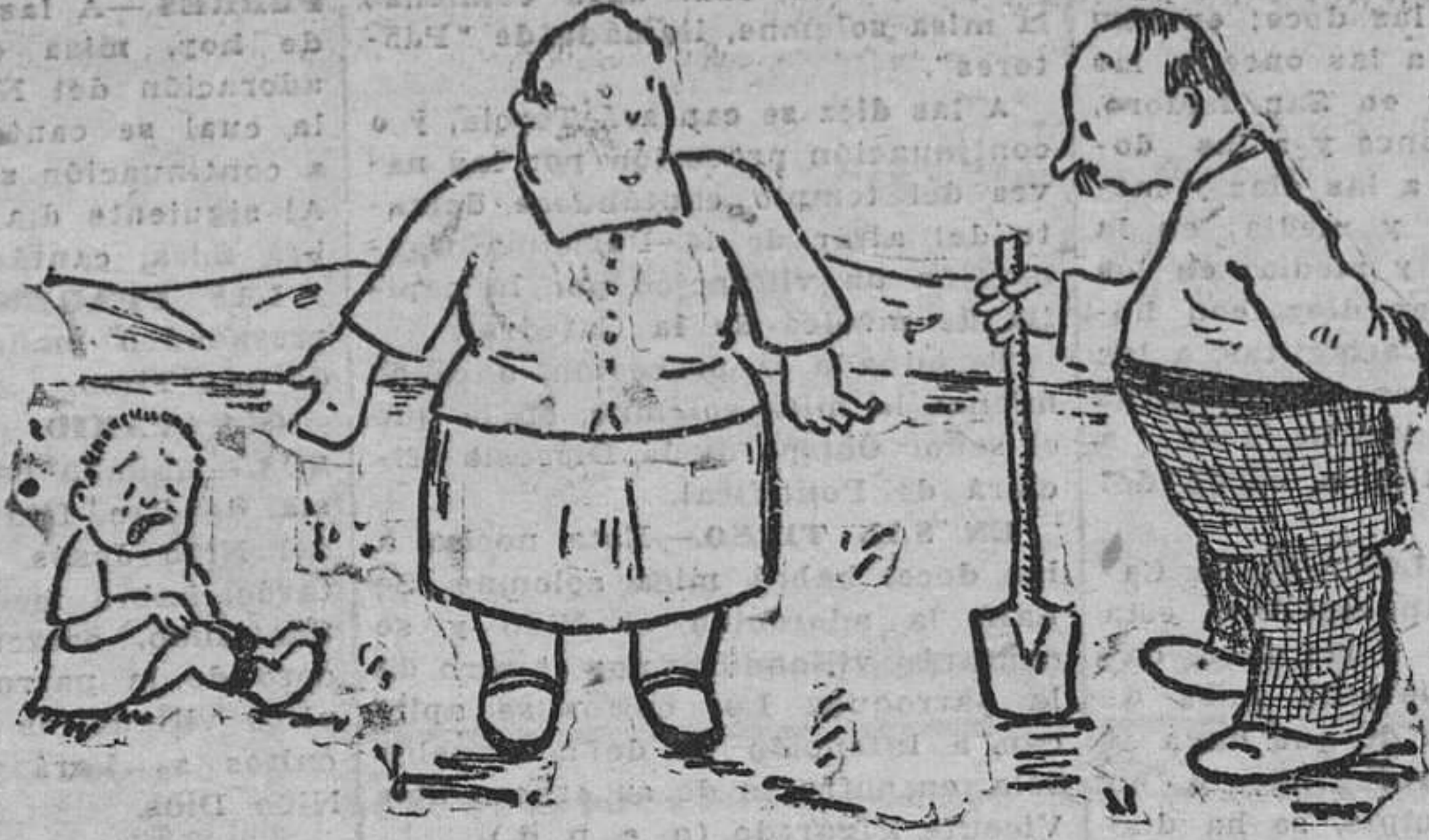
—Por qué llora ese niño?