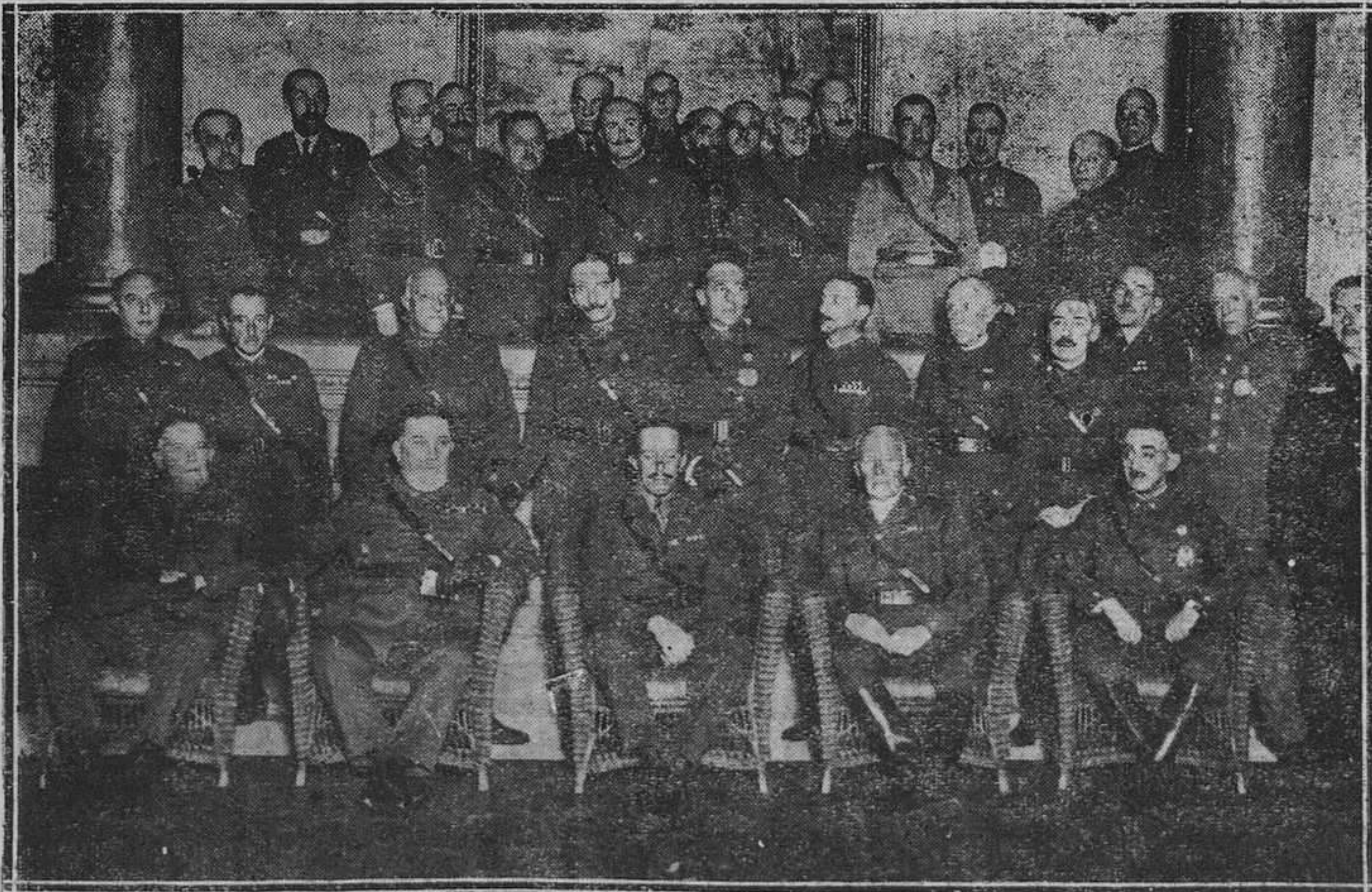
S. M. el Rey don Alfonso, con los generales y jefes de su promoción de Infantería, que le han ofrecido un banquete de compañerismo en el Centro del Ejército y la Armada