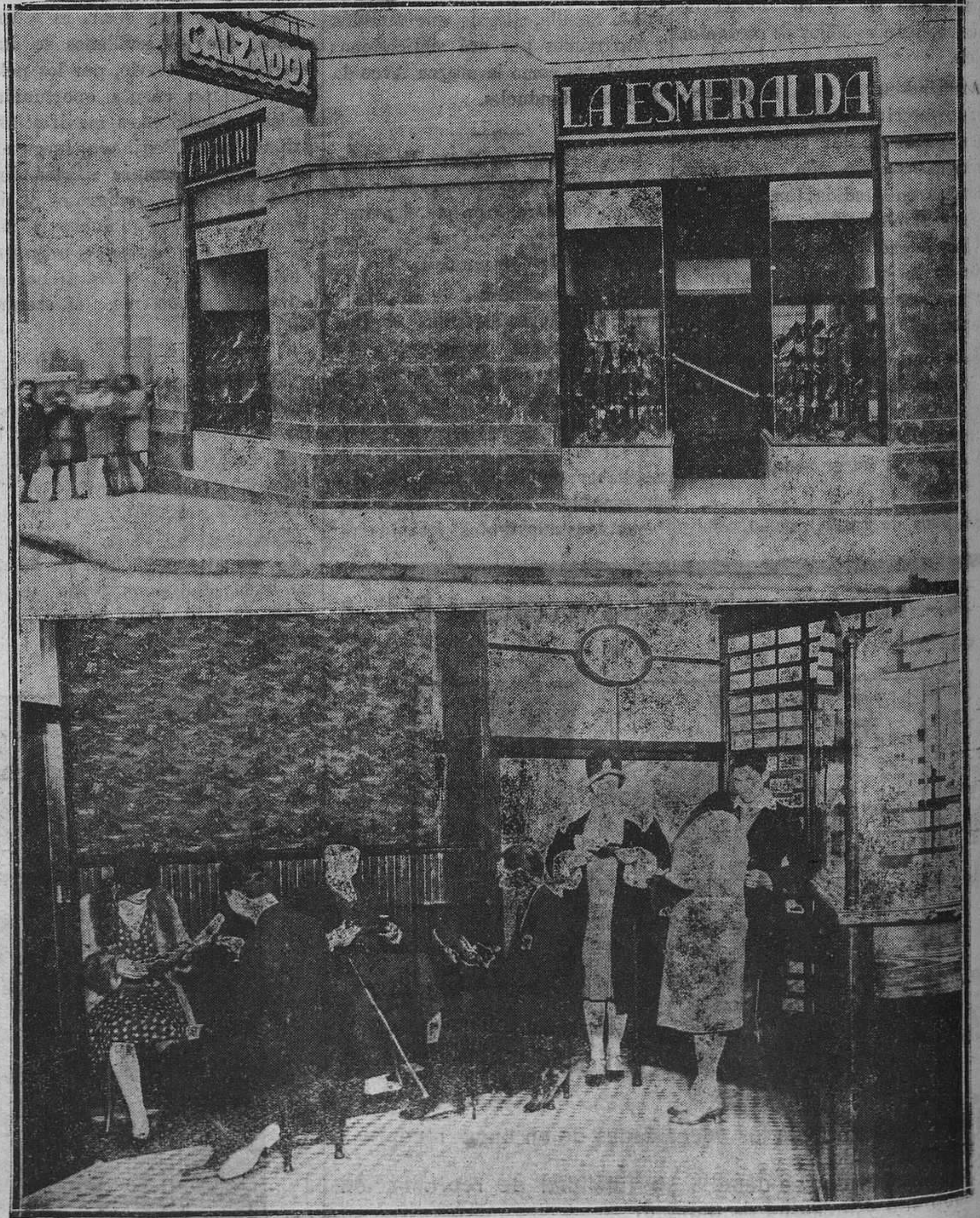
EXTERIOR E INTERIOR DEL ESTABLECIMIENTO.

La presente fotografía pone de relieve la importancia de este establecimiento moderno, inaugurado recientemente en la calle de Melquiades Alvarez y que en el breve tiempo transcurrido adquirió el máximo prestigio y la más alta preponderancia por las novedades que presenta en calzados para señoras y caballeros.