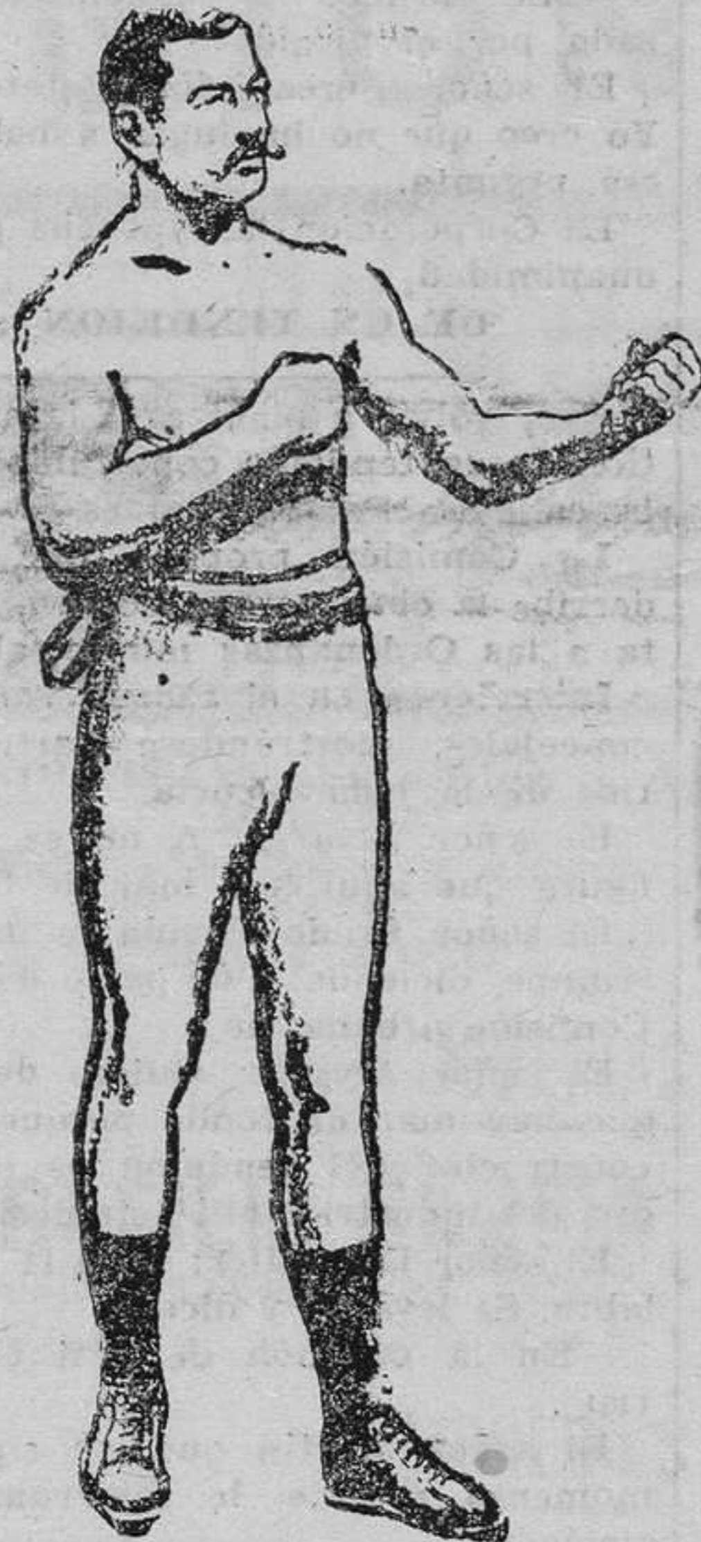
John L. Sullivan, tal como aparecía en su apogeo. Pesaba 87 kilos cuando arrebató el título a Ryan en nueve asaltos.