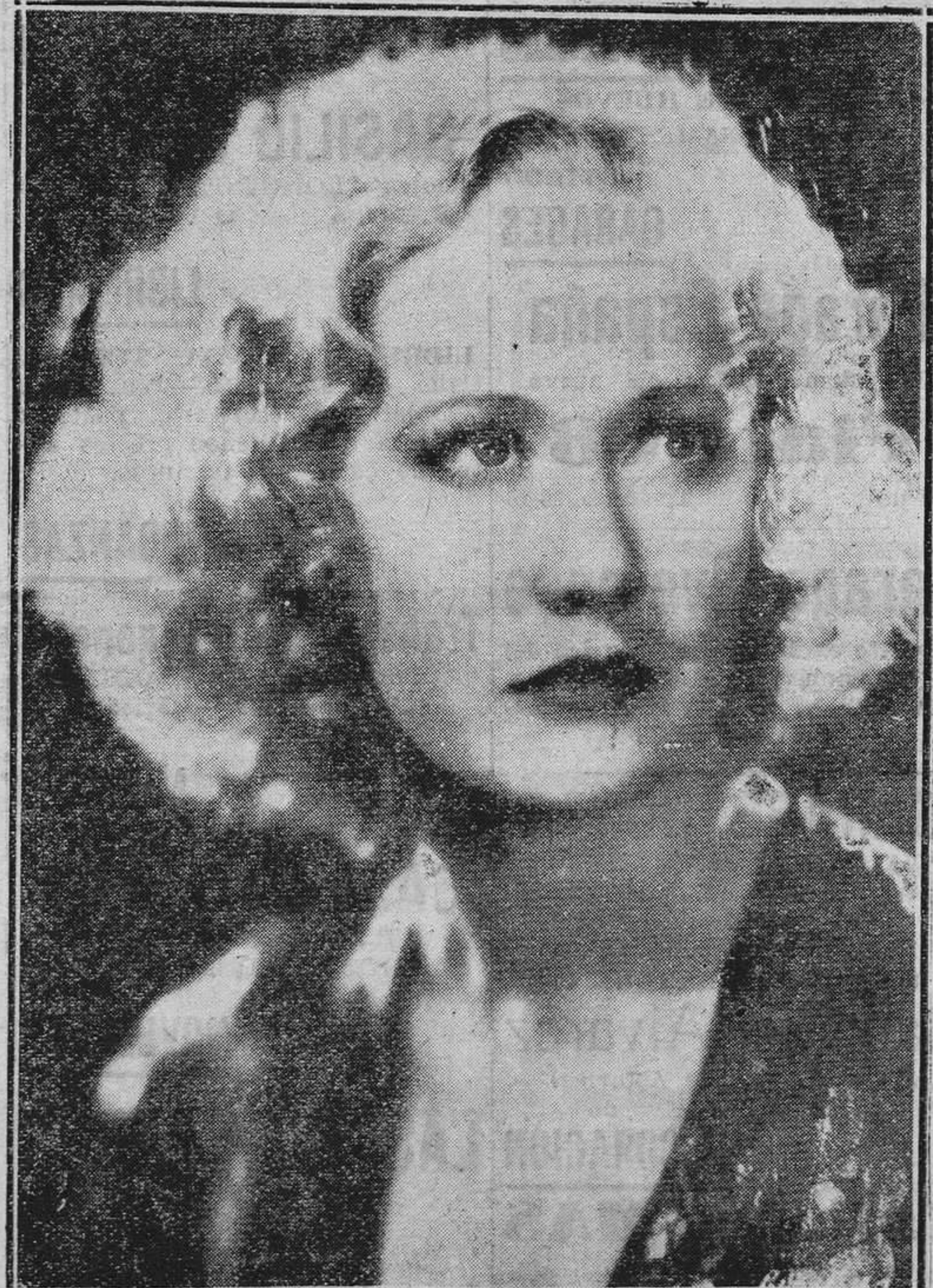
Mirians Hopkins, hasta hace poco desconocida en el mundo de la cinematografía. Su debut lo hizo al lado de Maurice Cheva- lier, en "El Teniente Seductor". Era ella, la princesita ingenua que se dejó prender de las galas del terrible seductor. Después de aquél film, se colocó en la primera fila de "estrellas", y todas sus películas se cuentan por éxitos. Hace pocos días la vimos con Philip Holmes, en "Así es Nueva York". Su última película la ha realizado con el formidable actor George Brancroft.