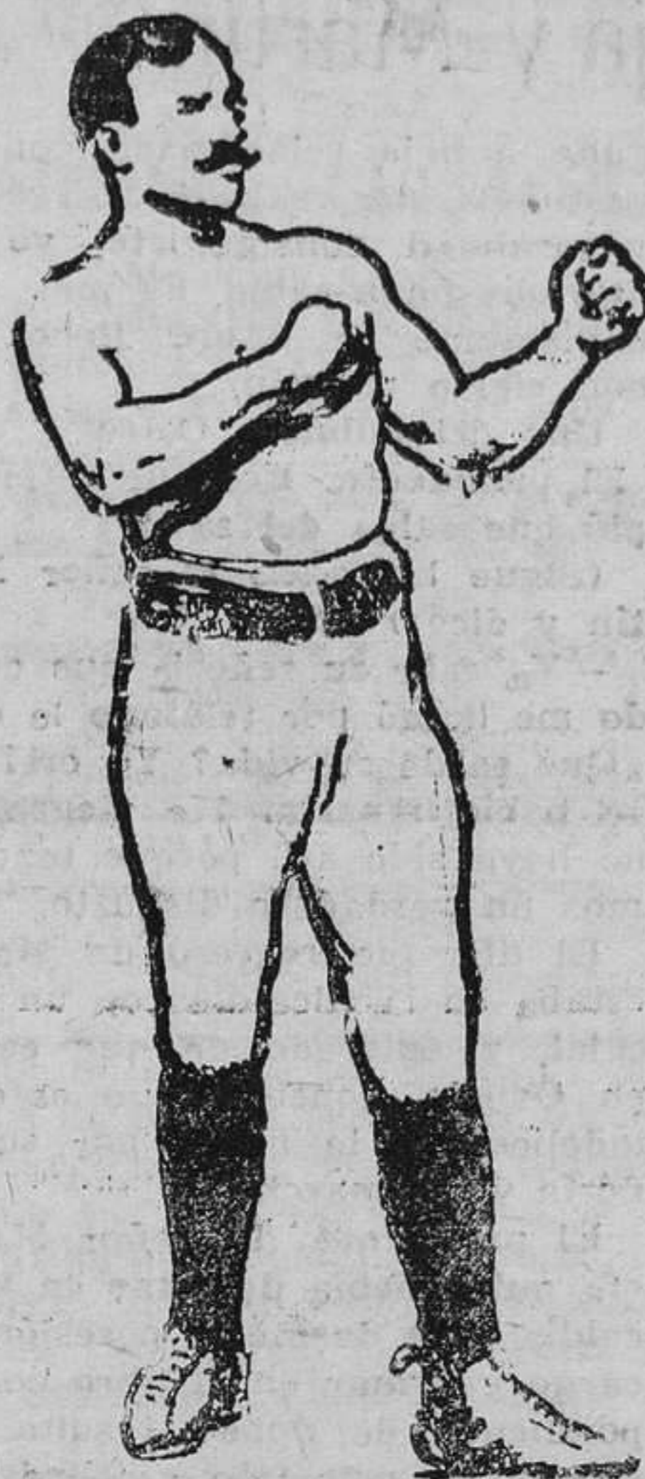
Paddy Ryan, El "match" Ryan-Sullivan, en 1882, fué el primero que llamó la atención en todo el mundo.