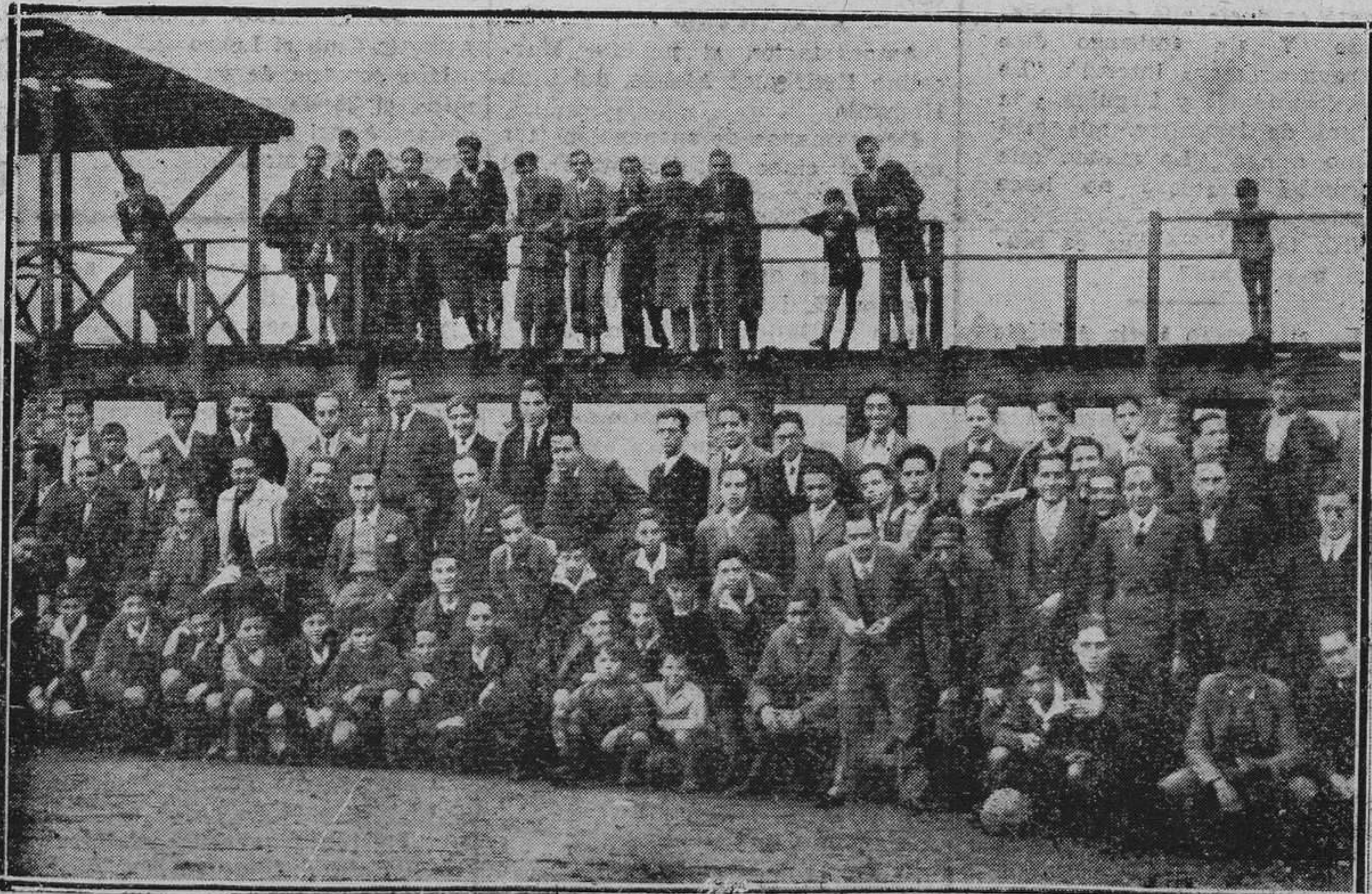
OVIEDO.—Un grupo de estudiantes que asistieron ayer a presenciar el partido de los alumnos de Ciencias y Letras, en Vetusta.

Seguramente que esto es lo que pretende la comisión que nos visitó.