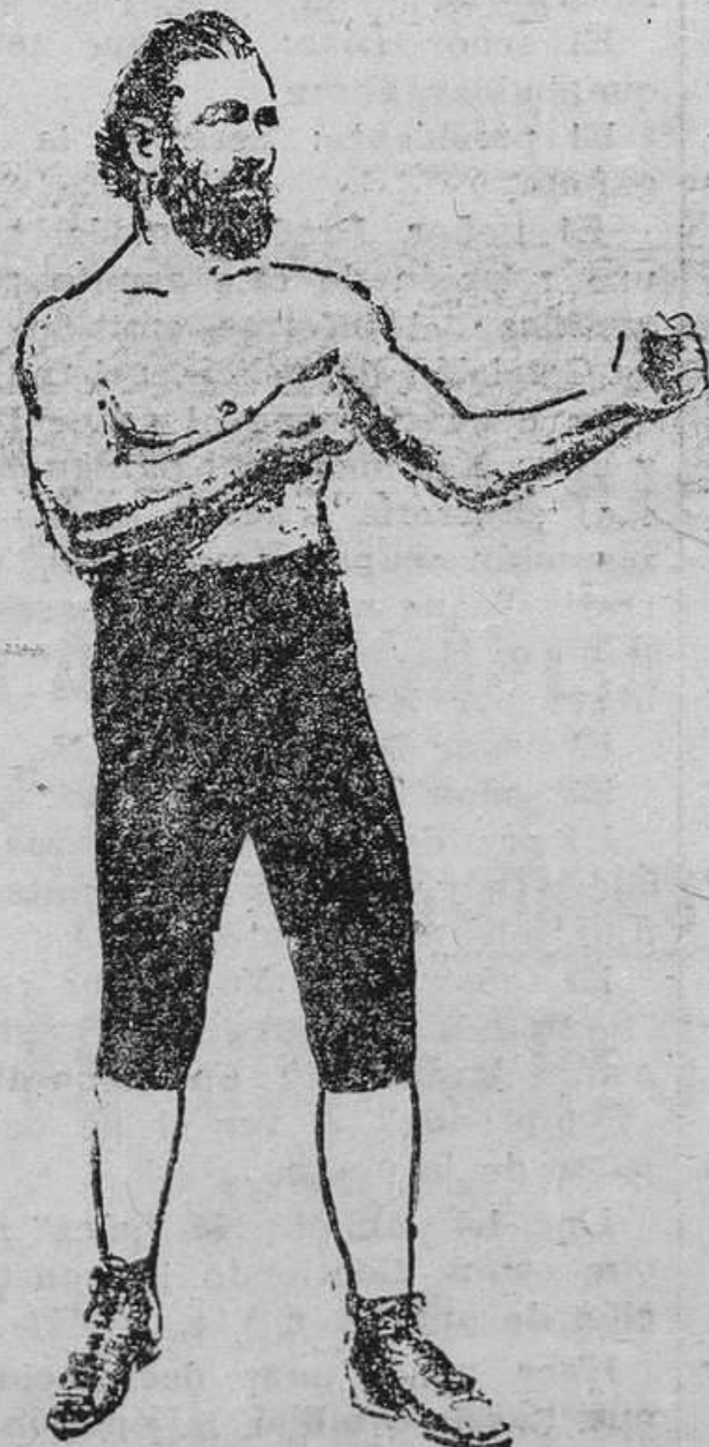
Jacob Hyer, el primer blanco reconocido como campeón del peso completo en los Estados Unidos. Ganó el título derrotando a Tom Beasley en 1816.

Los médicos me han impuesto un paréntesis en mi labor de hilvanar y zurcir. Y han llevado tan lejos su crueldad en velar por mi salud, que no han dudado en condenarme a vivir larga temporada en hogar extraño, que me pareció lejísimo de mi amada Asturias.