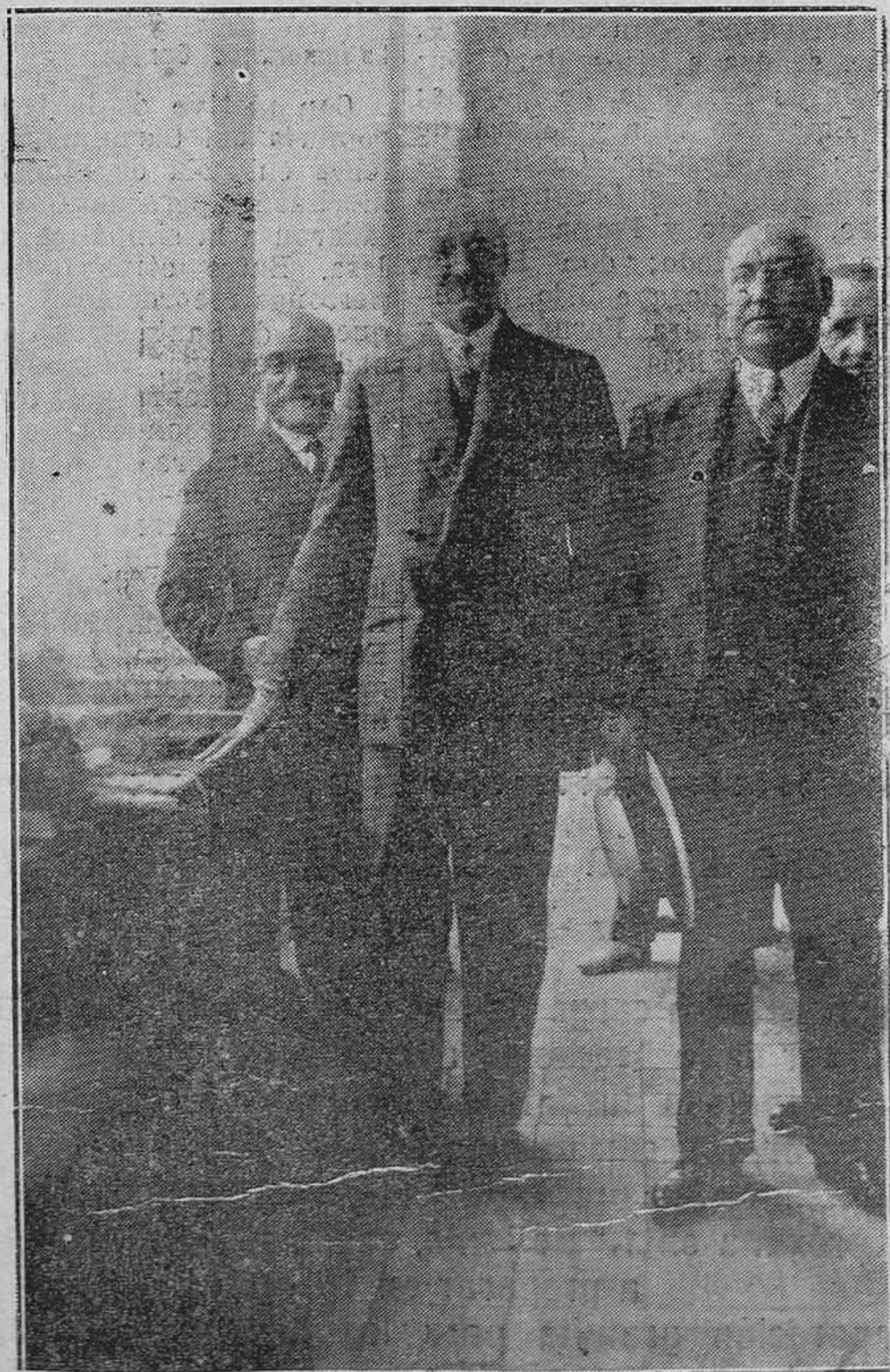
"LOS POSTIGOS".-Las autoridades en el reparto de libretas de la Caja de Ahorros, a los niños menores de siete años, socios de Santa María la Real de la Corte.