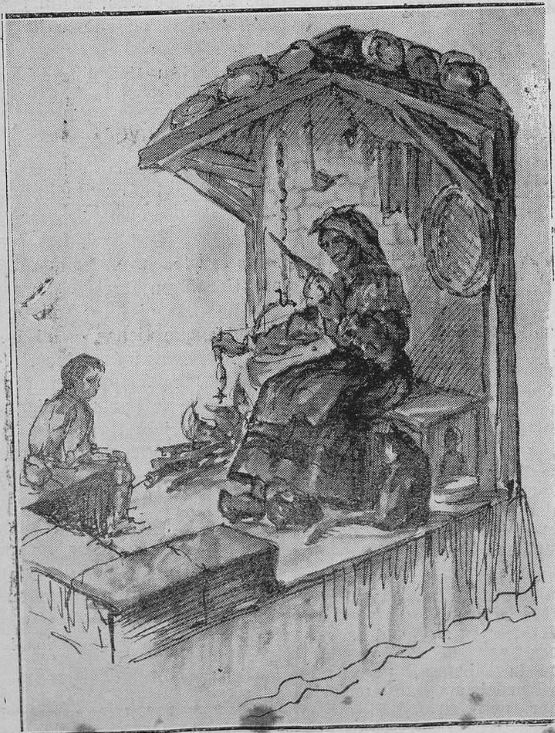
OVIEDO.-Bonita carroza de la Sociedad benéfica de "Los Postigos", que recorrió nuestras calles con motivo de la fiesta del "bollu". (Dibujo de Bataller)