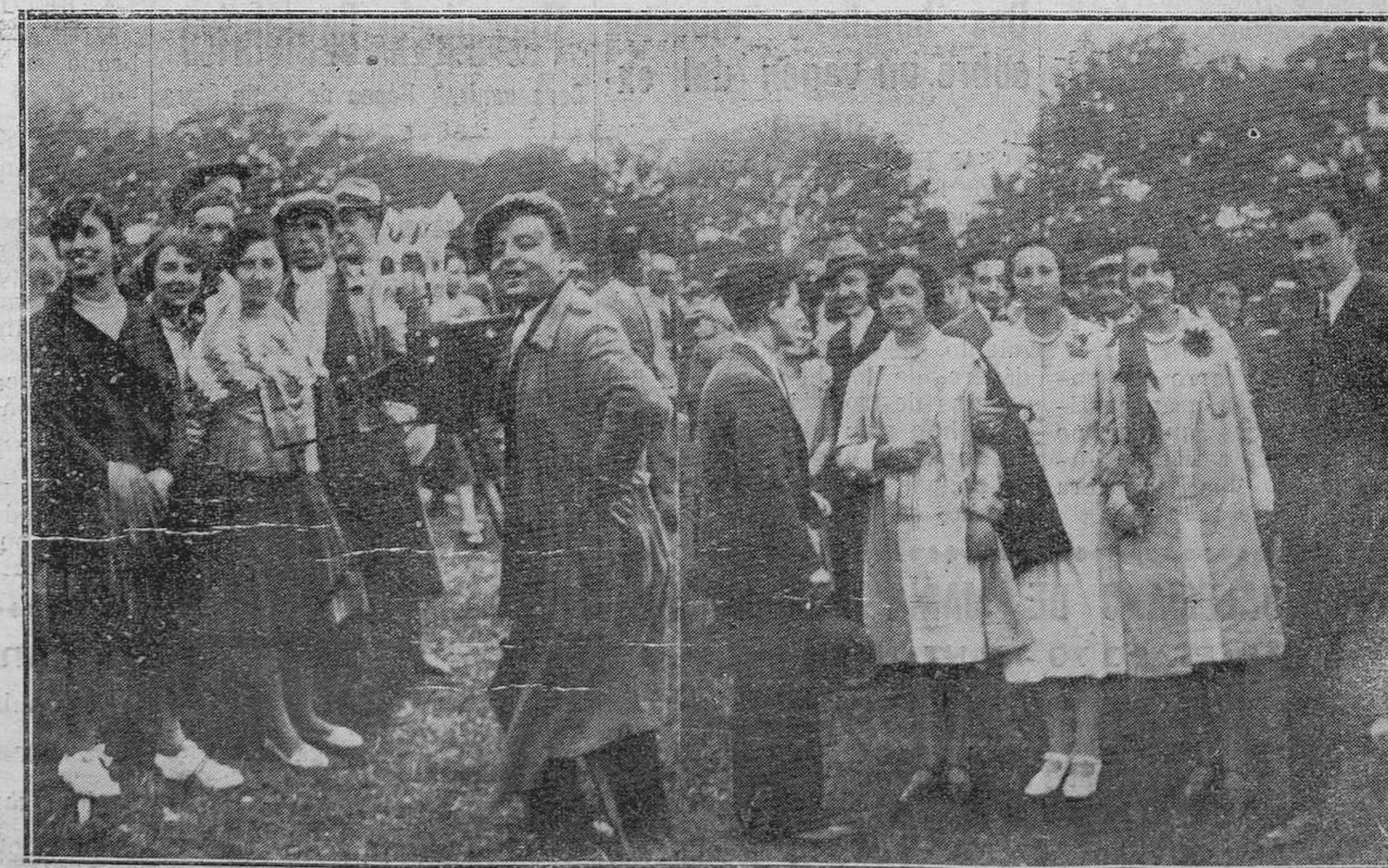
POLA DE SIERO: LA ROMERIA DEL CARMIN.—Un detalle de la fiesta.