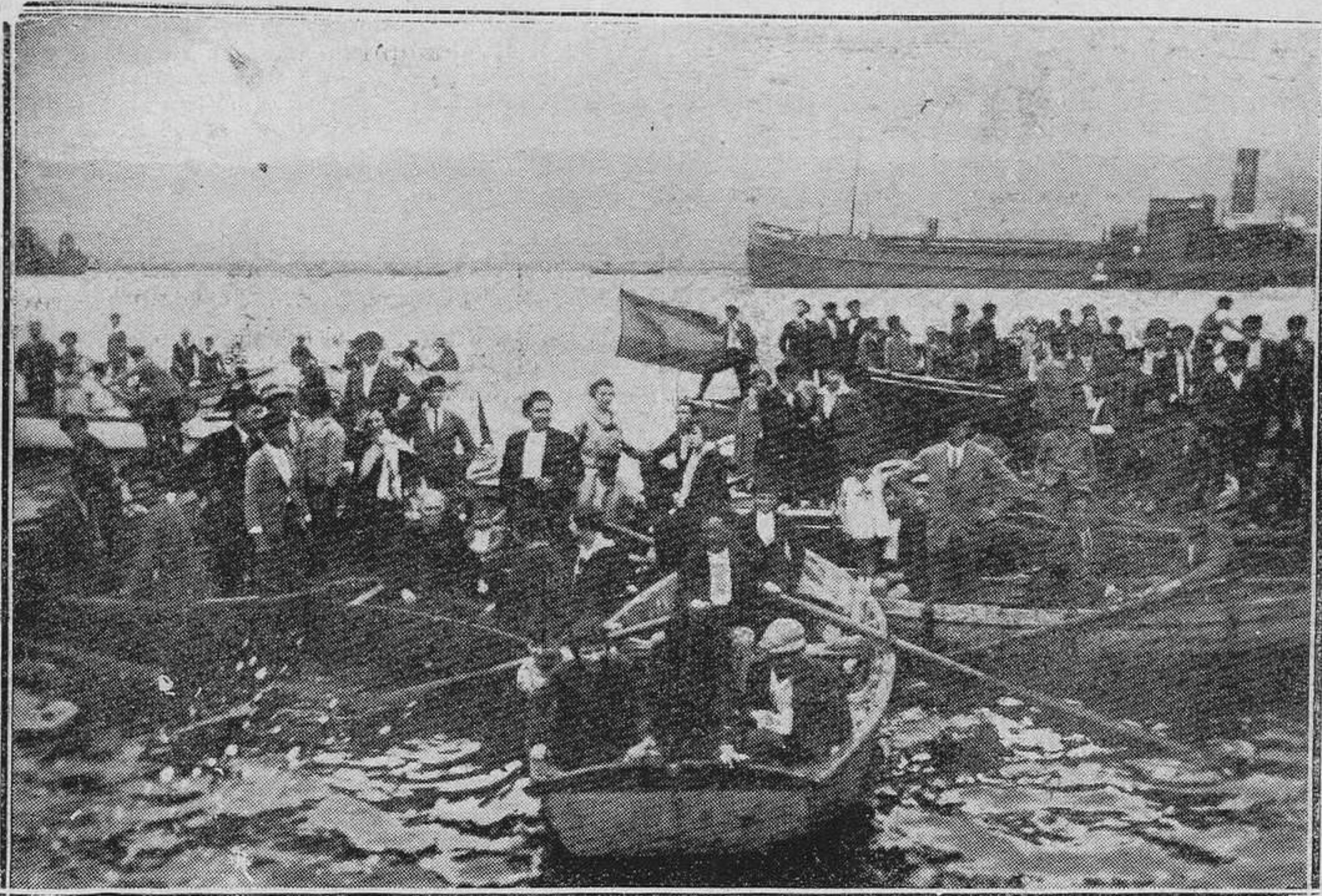
SAN ESTEBAN DE PRAVIA.-En la fiesta del domingo.

Se adjudicó a don José Sors la subasta de las obras para saneamiento del Monte de Santo Domingo, donde van a ser emplazadas las casas municipales. Importarán las obras 22.000 pesetas.