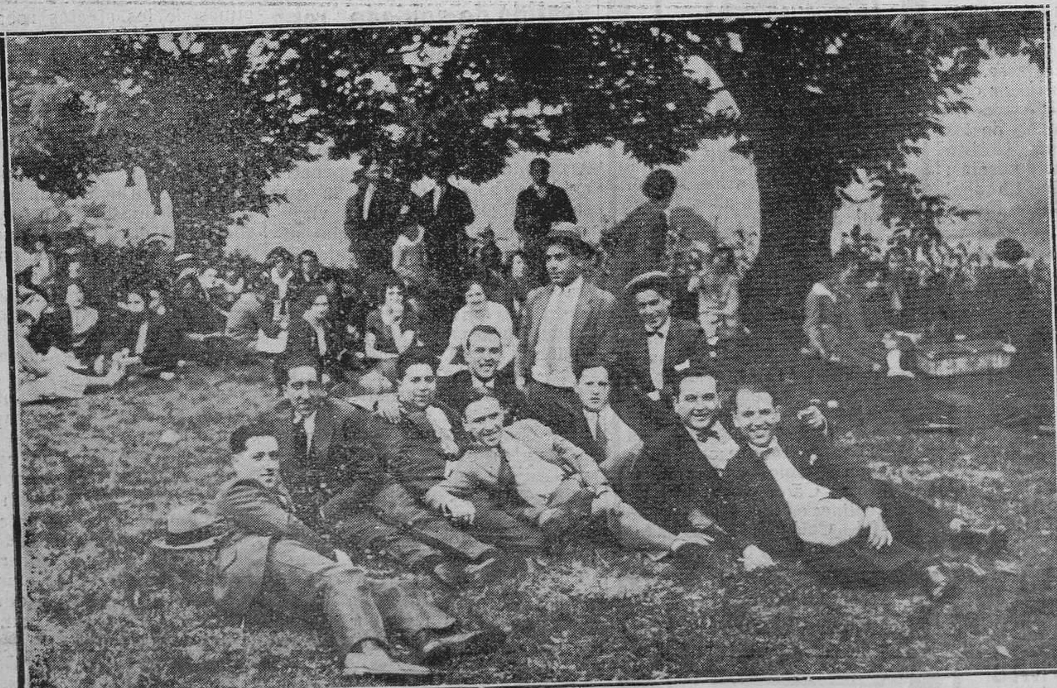
POLA DE SIERO: LA ROMERIA DEL CARMIN.—Un grupo de romeros.