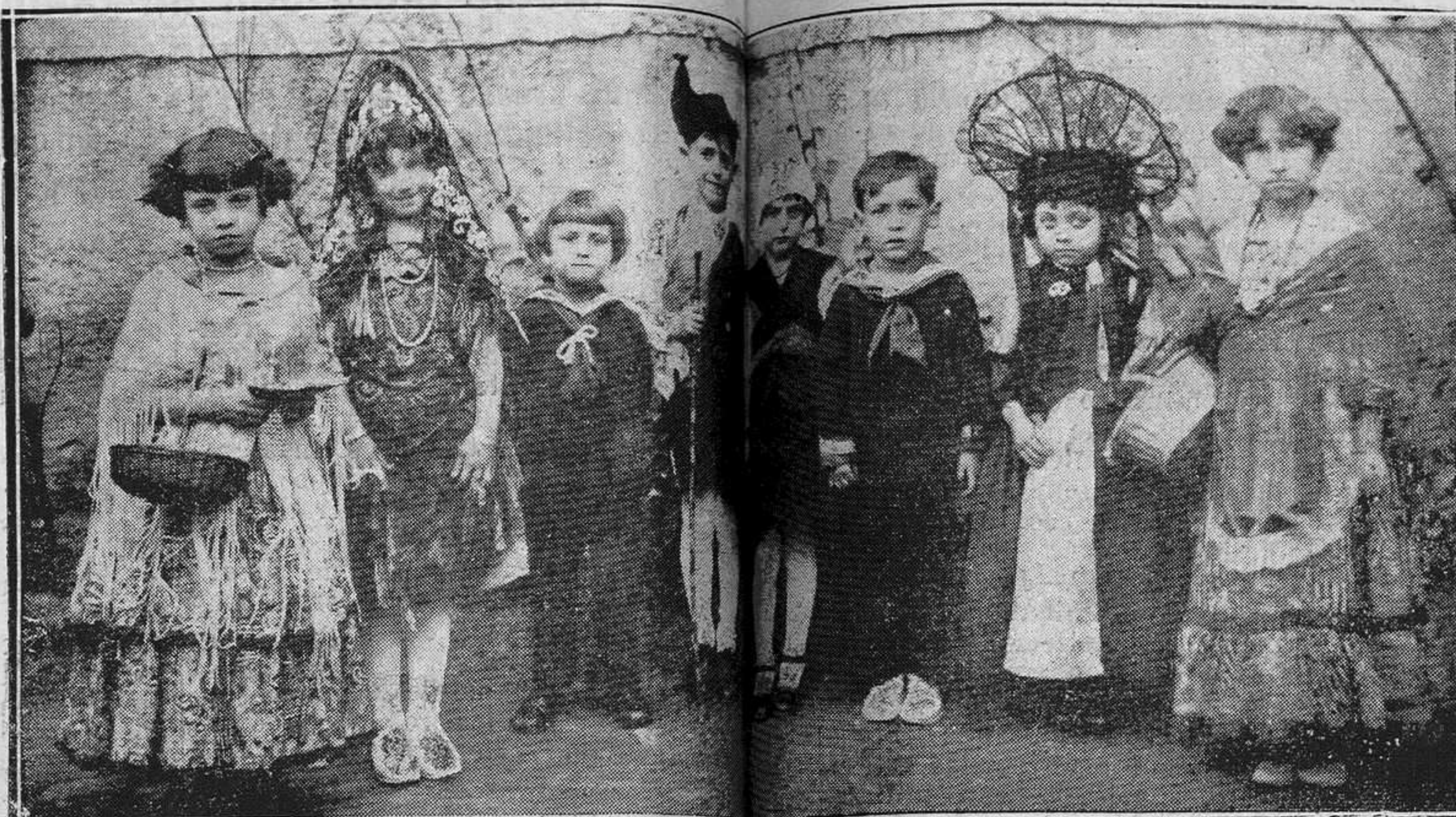
«LOS PASTIGOS.»—Niños que figuran en la carroza.

Ello servirá de recompensa de satisfacción para el que hoy es honrado, y de estímulo y acicate para otros compañeros, que llevan la misma valentía en el corazón y el mismo arrojo en el pecho.