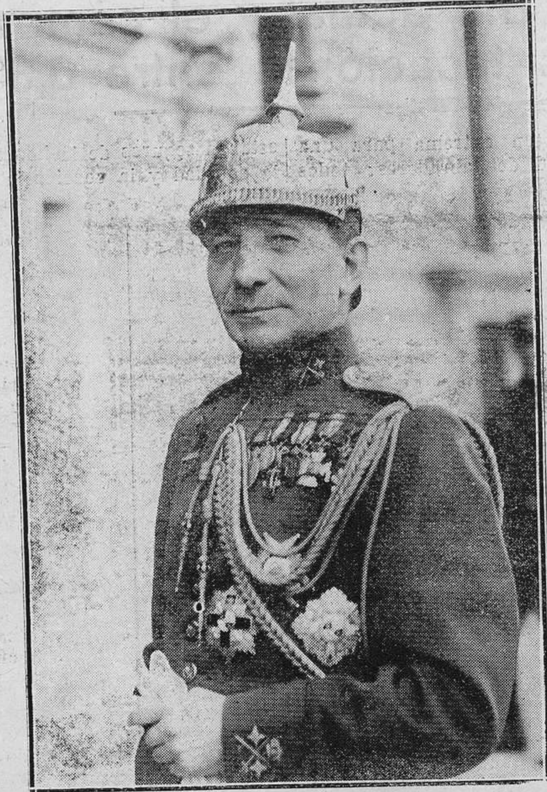
El general Barrera, capitán general de Cataluña, a quien la ciudad de Burgos ha rendido homenaje, nombrándole hijo predilecto

Los Ayuntamientos limítrofes cambiaron su orientación suprimiendo el impuesto de