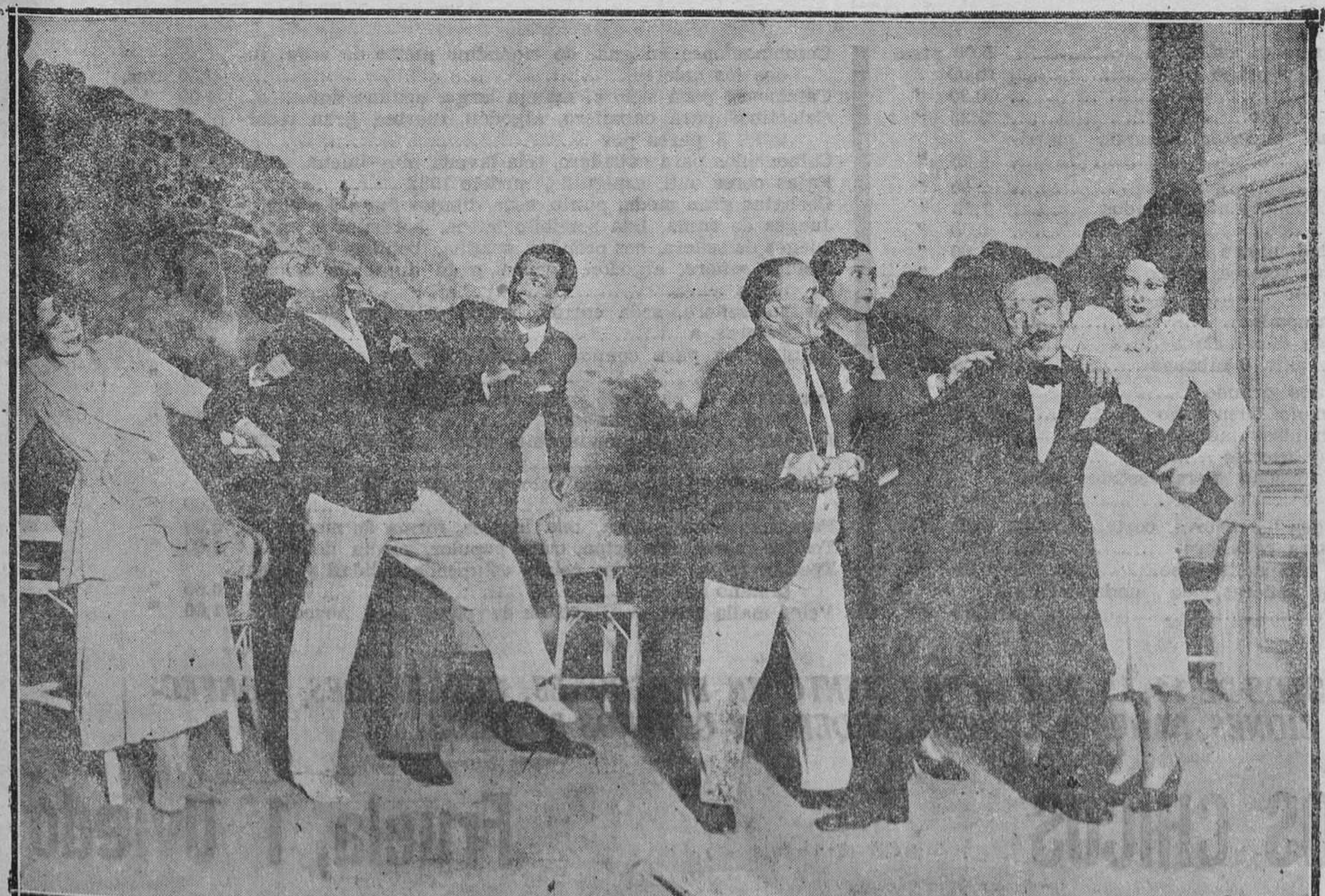
MADRID.—Una escena del juguete cómico "El pacto de don Sebastián", estrenado con éxito, en el teatro Cómico.