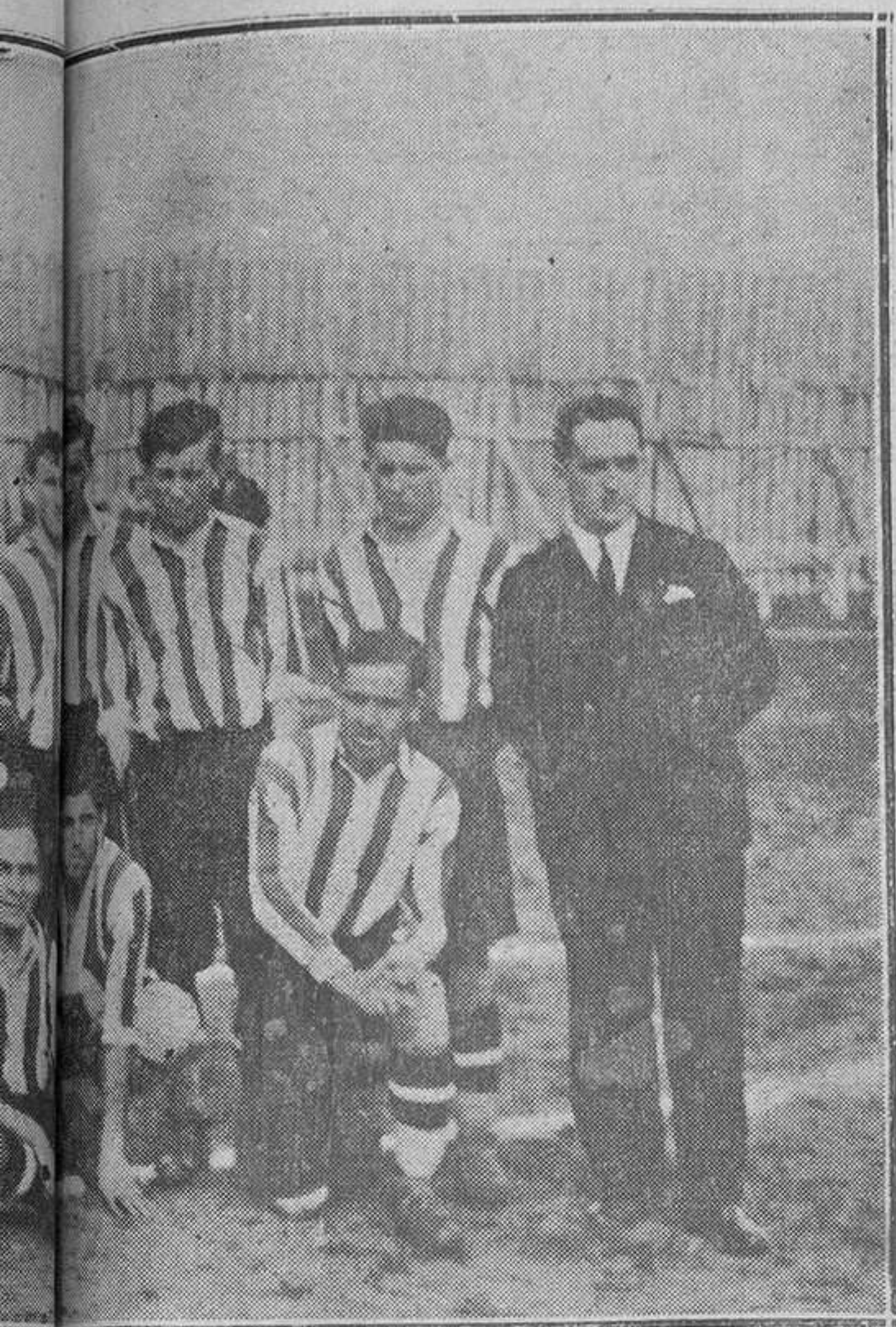
quesado domingo, en Teatros.