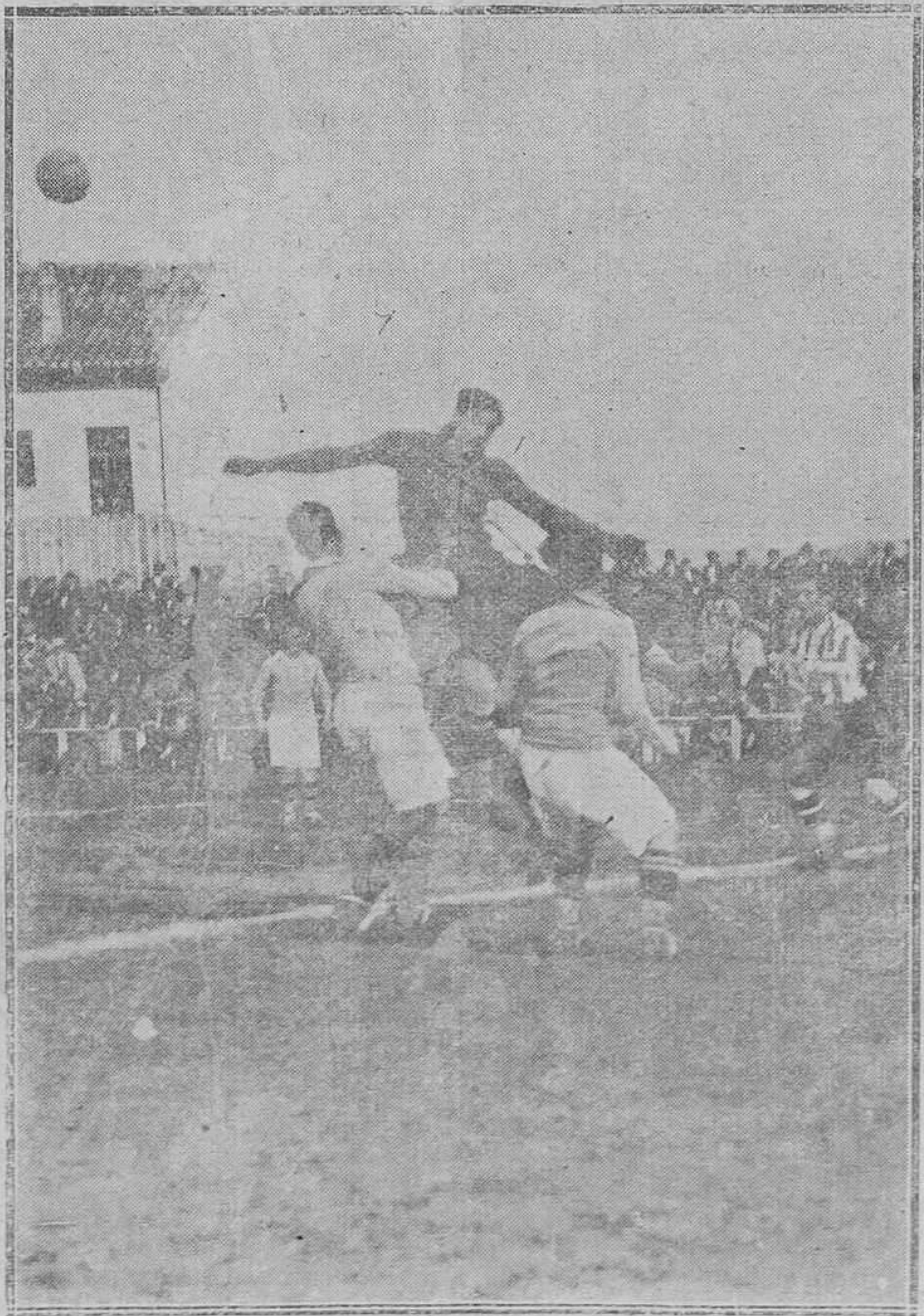
MIEDO.-Del partido Oviedo-Valladolid.-El portero del equipo forastero, despejando un corner.

—En compañía del doctor Pimentel, infatigable campeón del