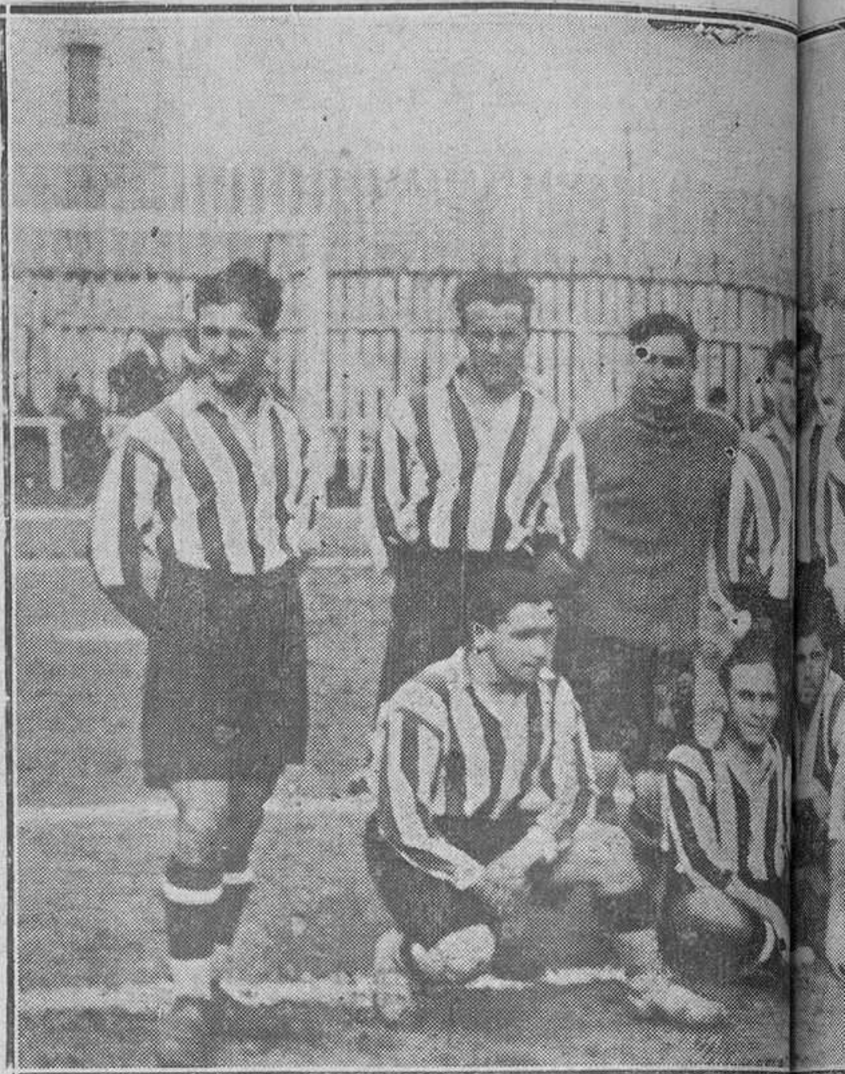
La Real Unión de Valladolid, que esado

La Deontología quizá no salga bien librada con estas noticias.