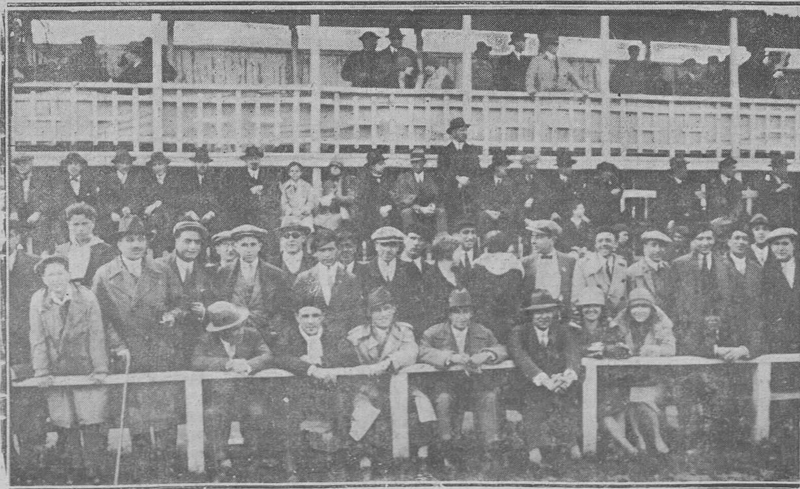
Del partido Oviedo Valladolid.-Un aspecto de la localidad de preferencia.

alimentación. Elimine de su dieta las grasas, las as y los dulces, éstos sobre todo. No coma carne que una vez al día en todo caso, y completamen- n grasa. Coma muchas legumbres y frutas frescas a de seis a ocho vasos de agua diariamente. meioría se notará en una semana.