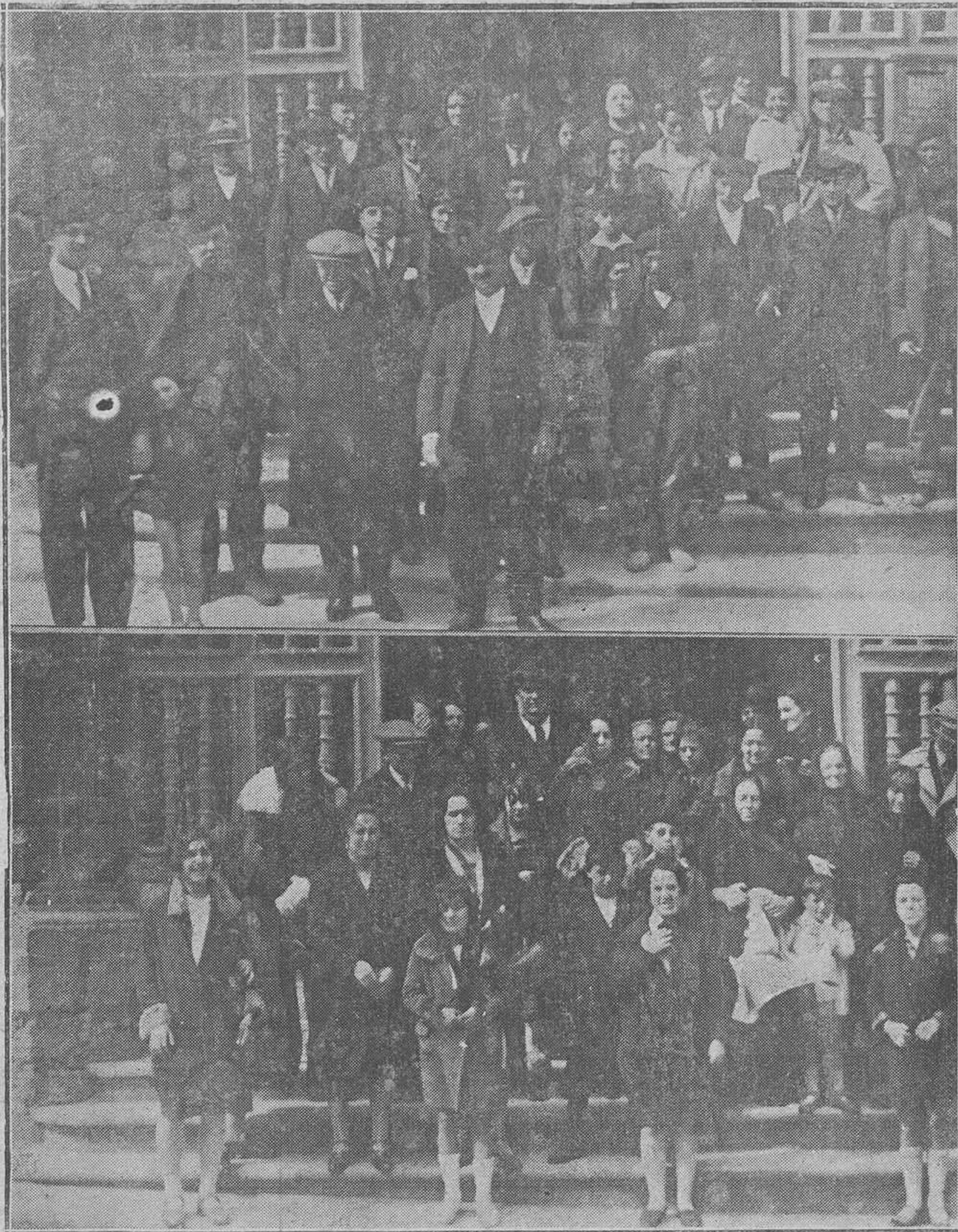
OVIEDO.- Dos grupos de fieles concurrentes a la procesión de nuestra Señora de la Soledad.