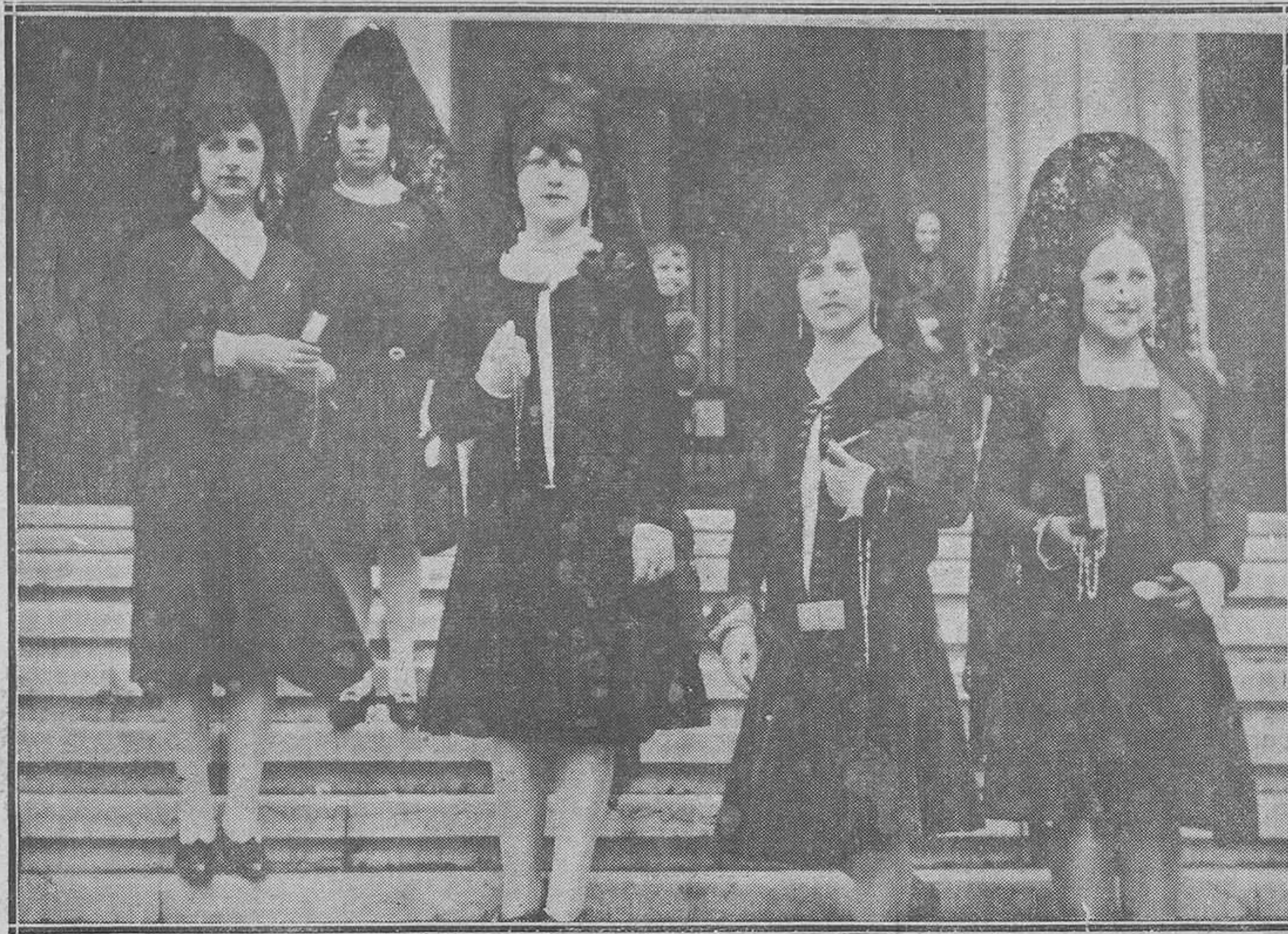
Avilés.-Un grupo de lindísimas señoritas con mantilla, en los días clásicos.

ALEJANDRO G. ALVAREZ Paris, Abril, 1928.