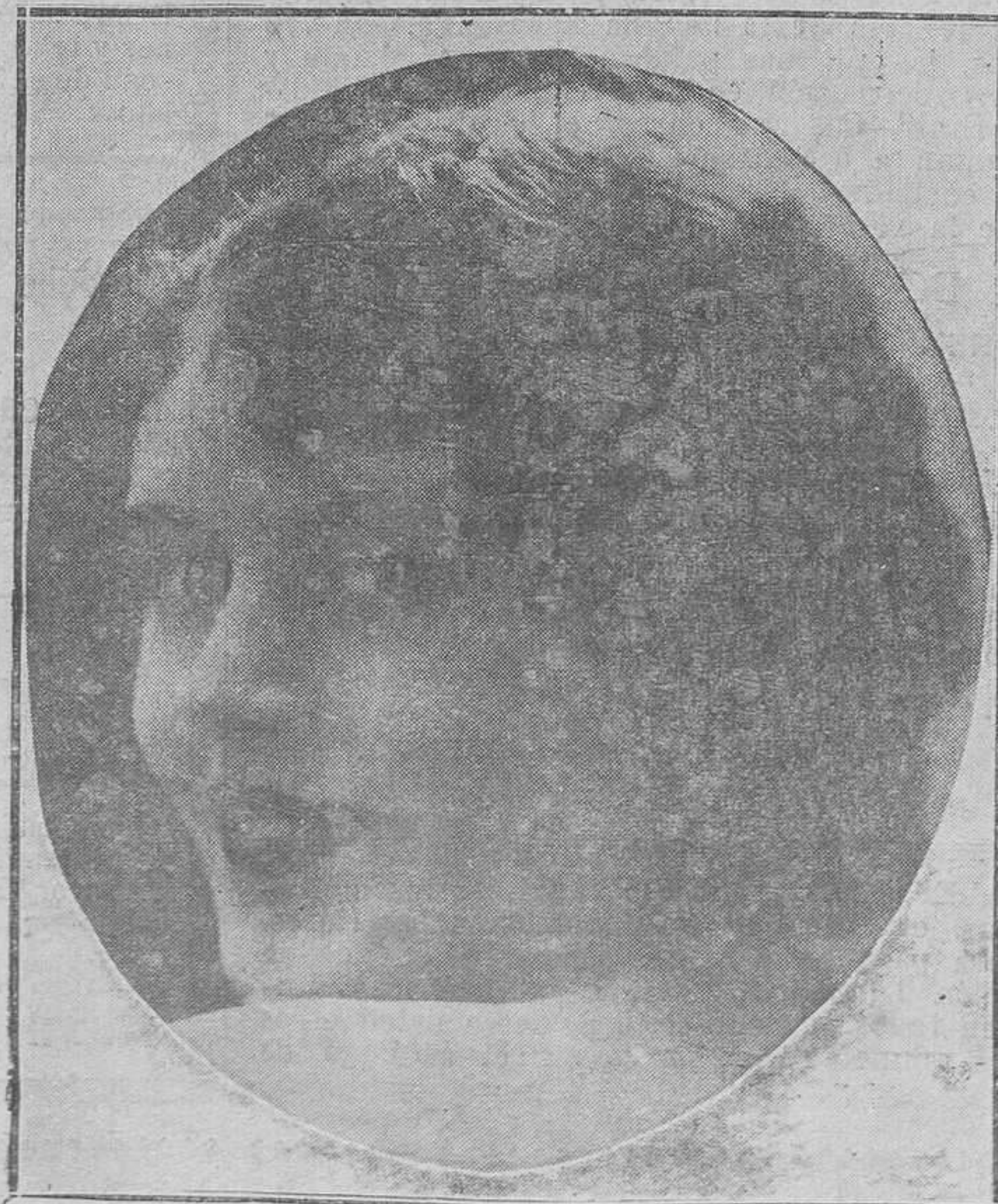
DE LA VIDA DEL CINE—June Collyer, artista cinematográfica seleccionada por la Asociación Wampas, con "Baby Star", para 1928, y que siguiendo la costumbre tomará parte en el concurso público de fin de año.