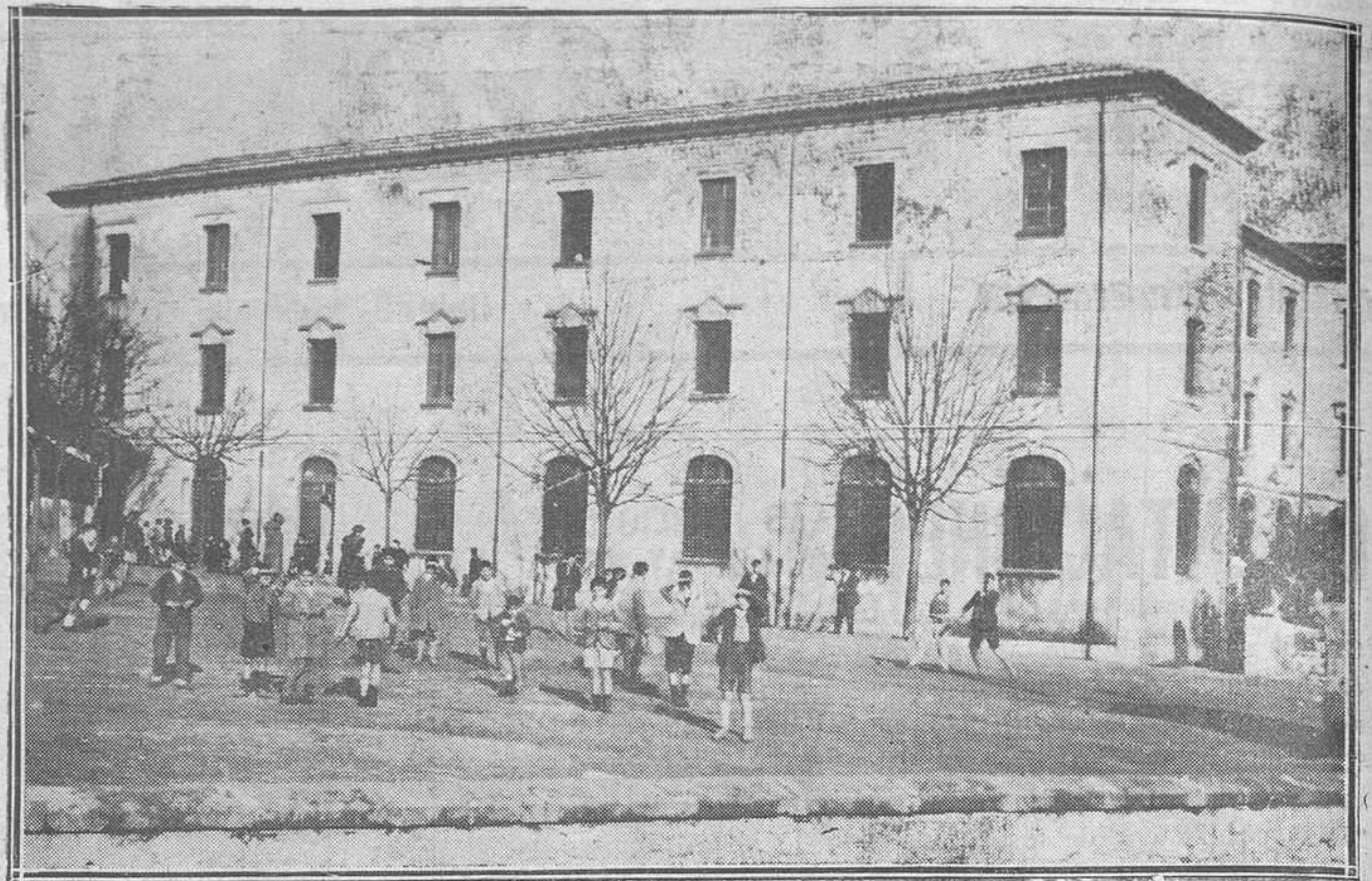
OVIEDO. — En el Asilo de Huérfanos del Fresno a la hora de recreo.

Las entidades aseguradoras a que se refiere el párrafo anterior quedarán extinguidas al fallecimiento de su actual propietario, debiendo procederse a la liquidación de todas sus operaciones por los herederos de aquél con intervención directa de la Subdirección de Seguros y Ahorro, y