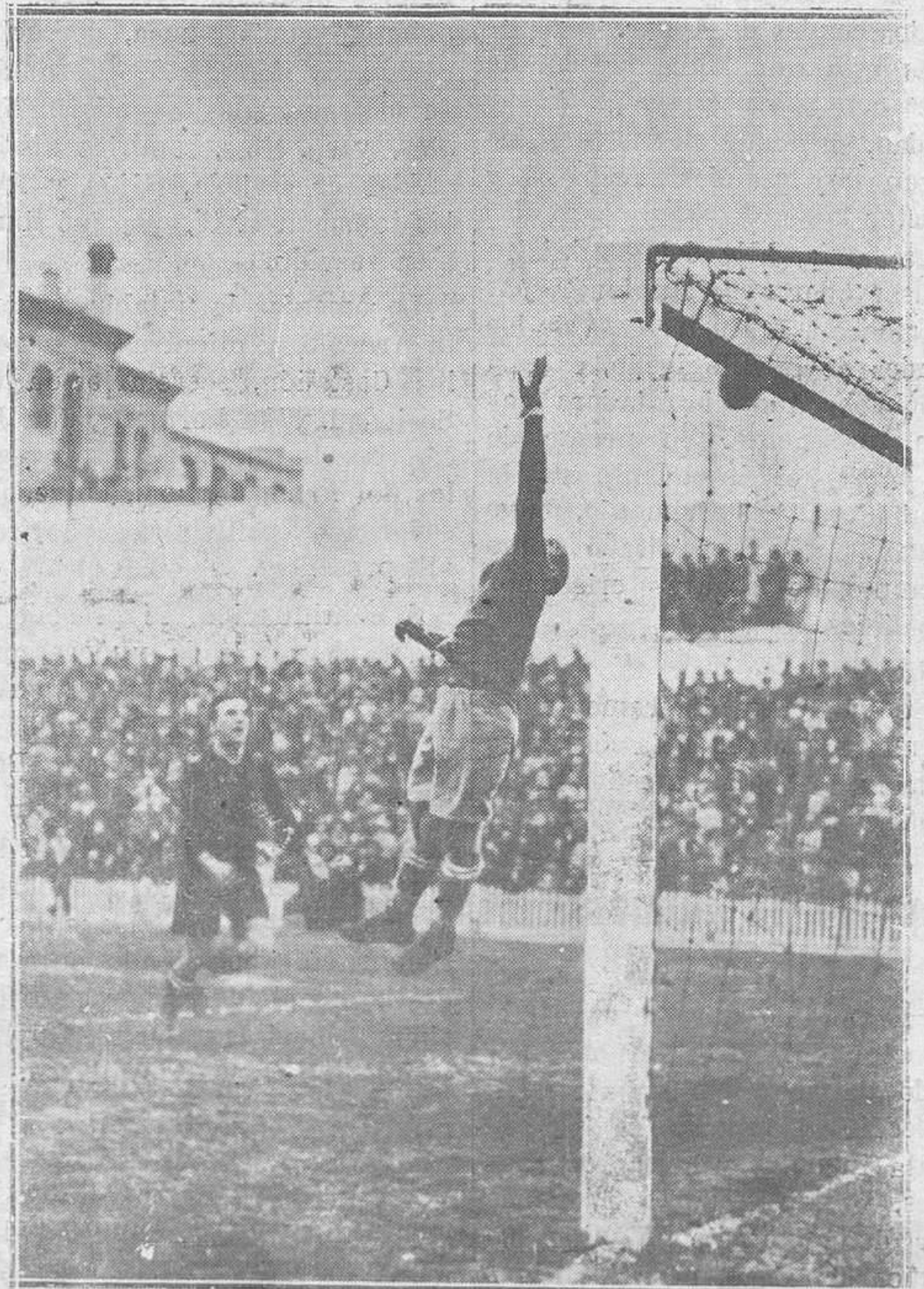
MADRID. — Un momento del partido entre el "Real Madrid" y el "Racing", en el que venció el primero por 3-1.