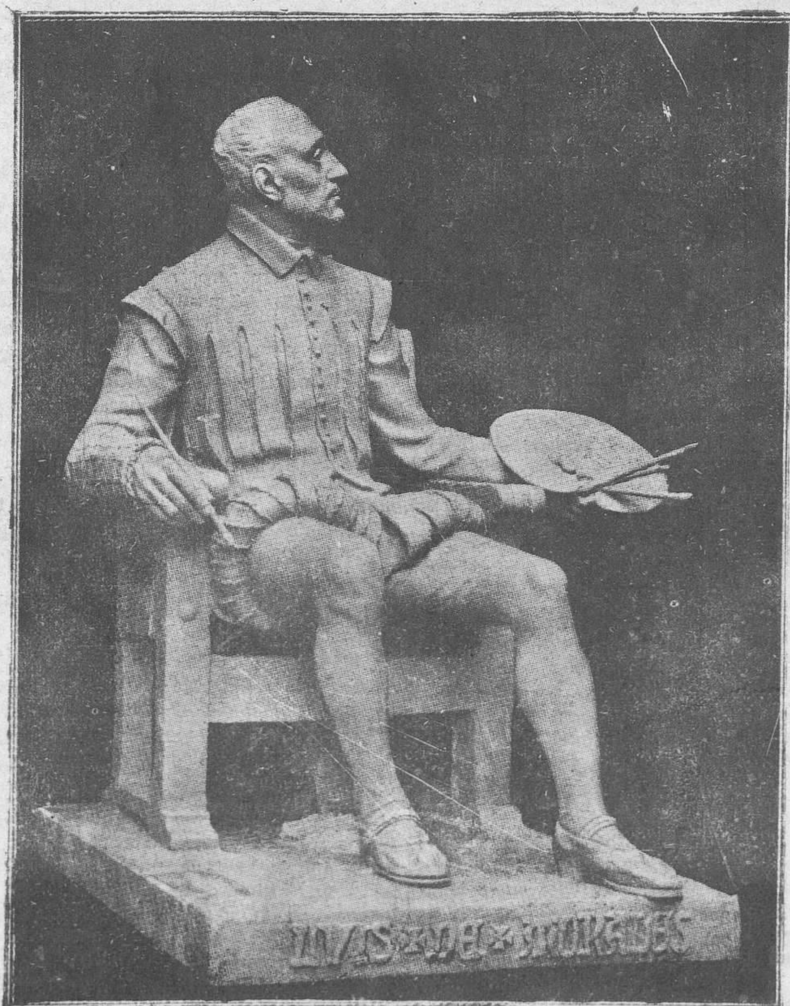
Luis de Morales", escultura de Gabino Amaya, que será levantada en Badajoz para memoria del célebre pintor

Entre sus obras más famosas se cuenta la llamada "Virgen del Pajarito", que según una pía tradición ejecutó poco antes de morir, recobrando la vista apenas