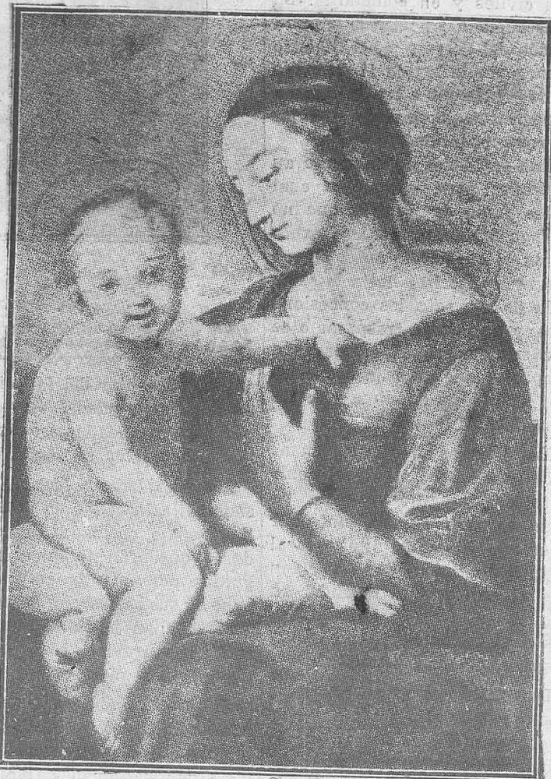
"La Virgen y el Niño", cuadro de Rafael, adquirido por Mr. Andrew Mellon, en la cantidad de doscientas mil libras esterlinas.

Con los debidos respetos al encargado de practicar entre nosotros la censura gubernativa, tenemos que manifestarle el disgusto que nos ocasiona la excesiva rigurosidad que le sir-