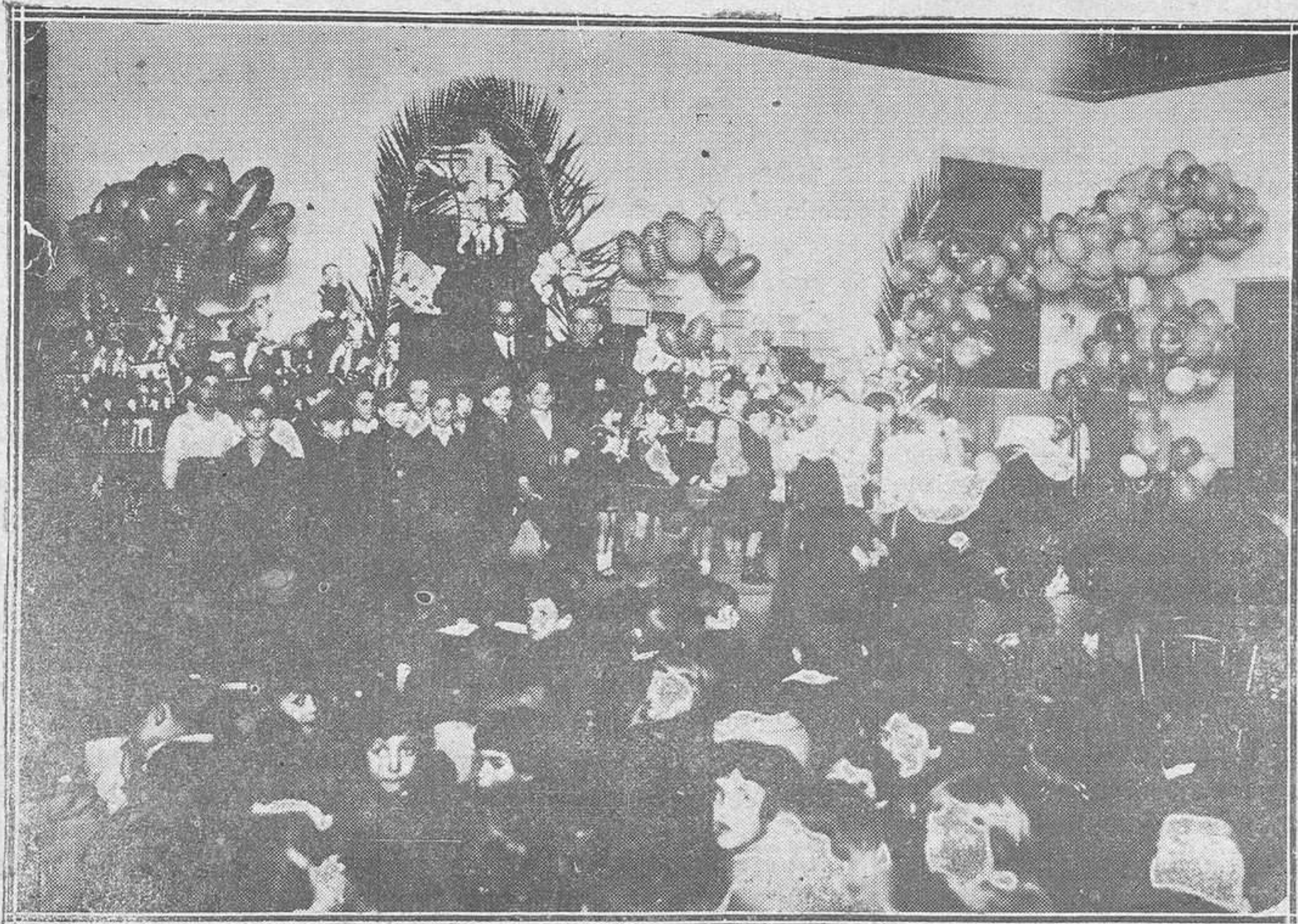
GIJON. — Reparto de juguetes el "Día de Reyes", en el Asilo de Pola por la Junta de Protección a la Infancia.—El director y capellán del Asilo entre los niños que trabajaron con motivo de dicha fiesta.

Califica el hecho de un delito de homicidio por imprudencia temeraria, habiendo incurrido el procesado en la pena de