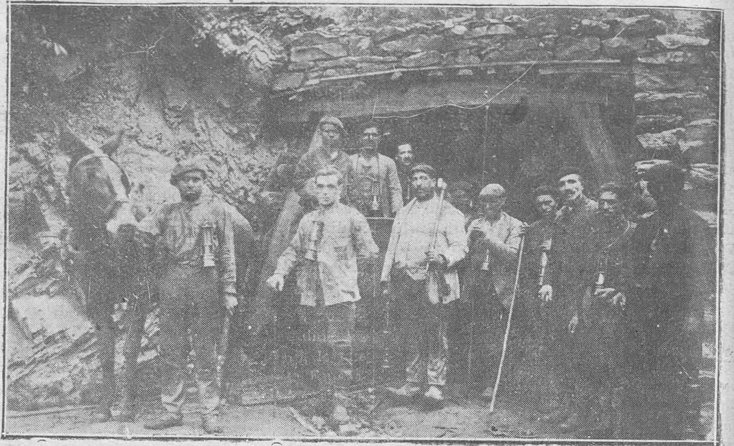
MOREDA. — A la terminación de la faena en las minas.