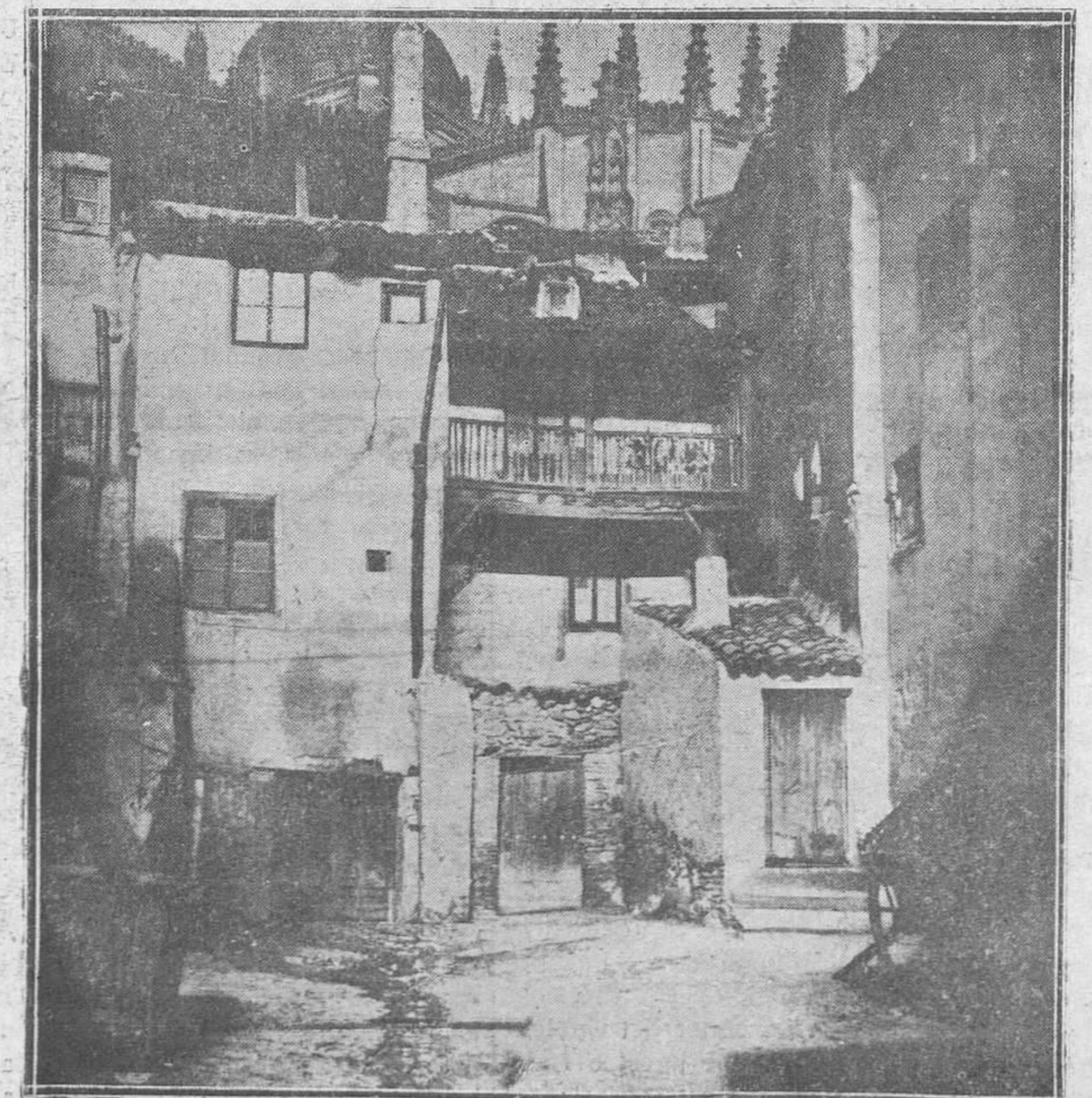
Rincón llamado el Rastrillo, en Segovia