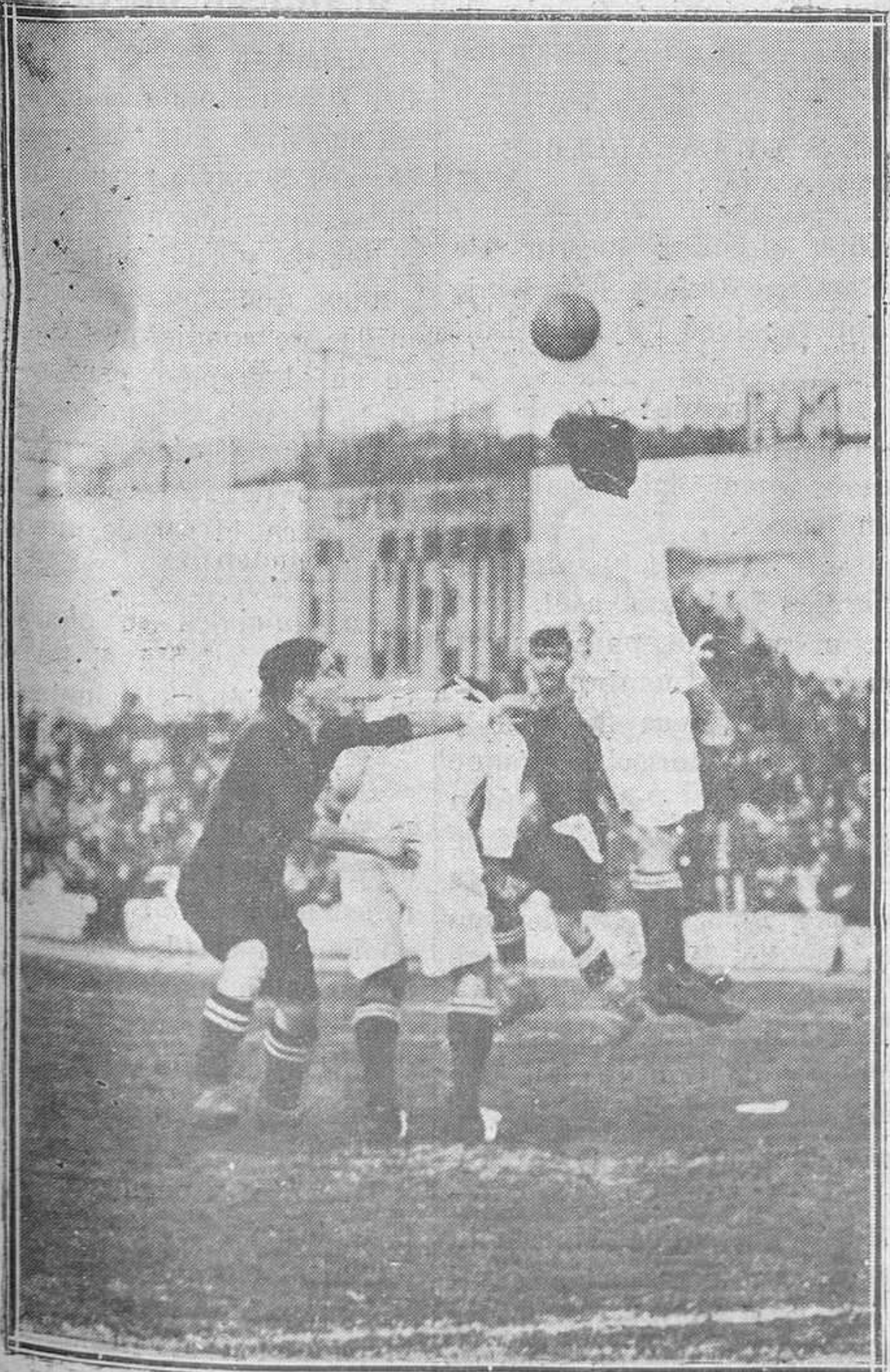
MADRID. — Otro momento del partido entre el "Real Madrid" y el "Racing", en que ganó el primero por 3-1.