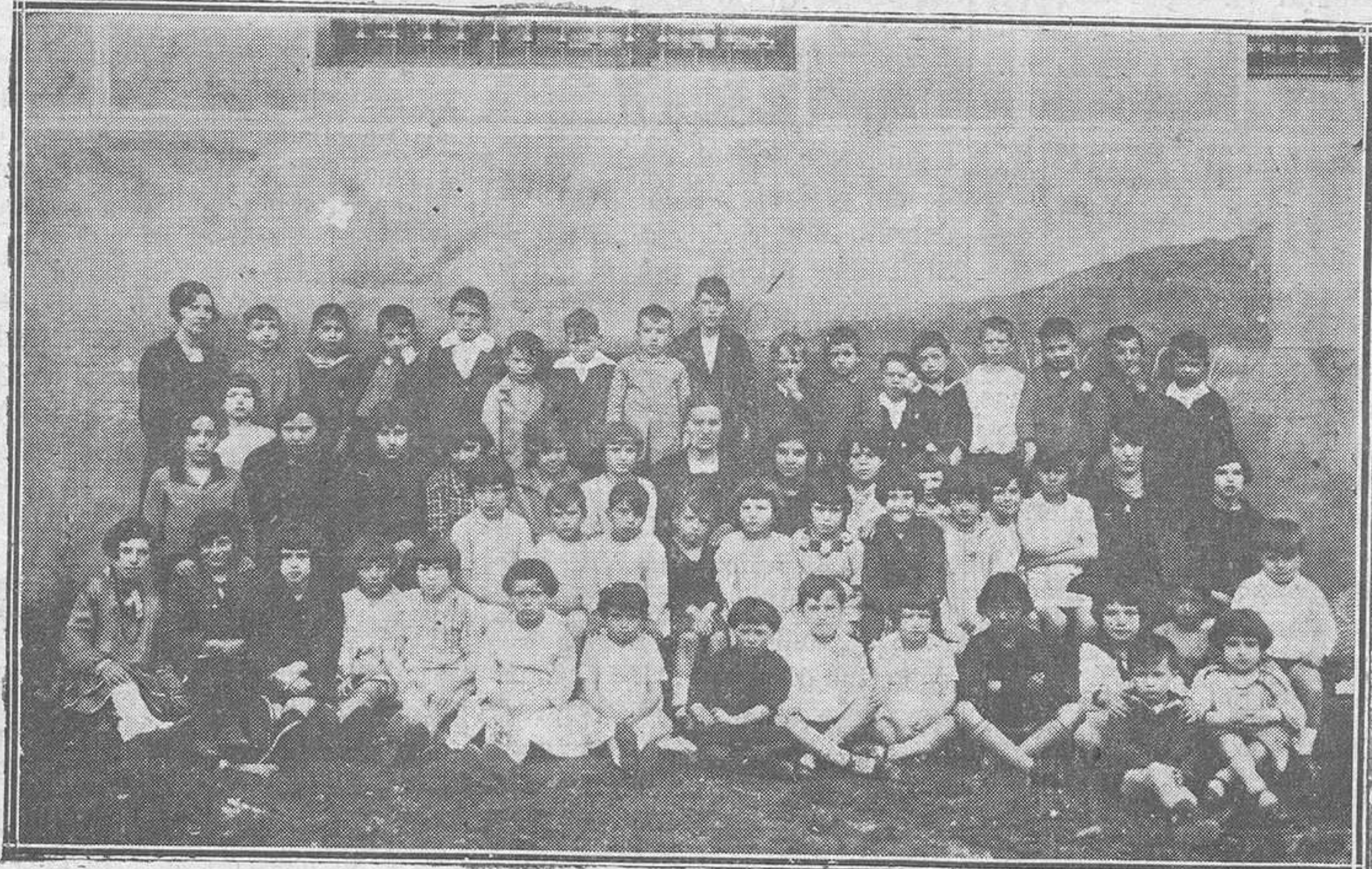
MOREDA. — Maestra y alumnos posan para REGION.

Y terminarlos bastante antes de los cuatro años que se estipu- lan en el pliego de condiciones de subasta.