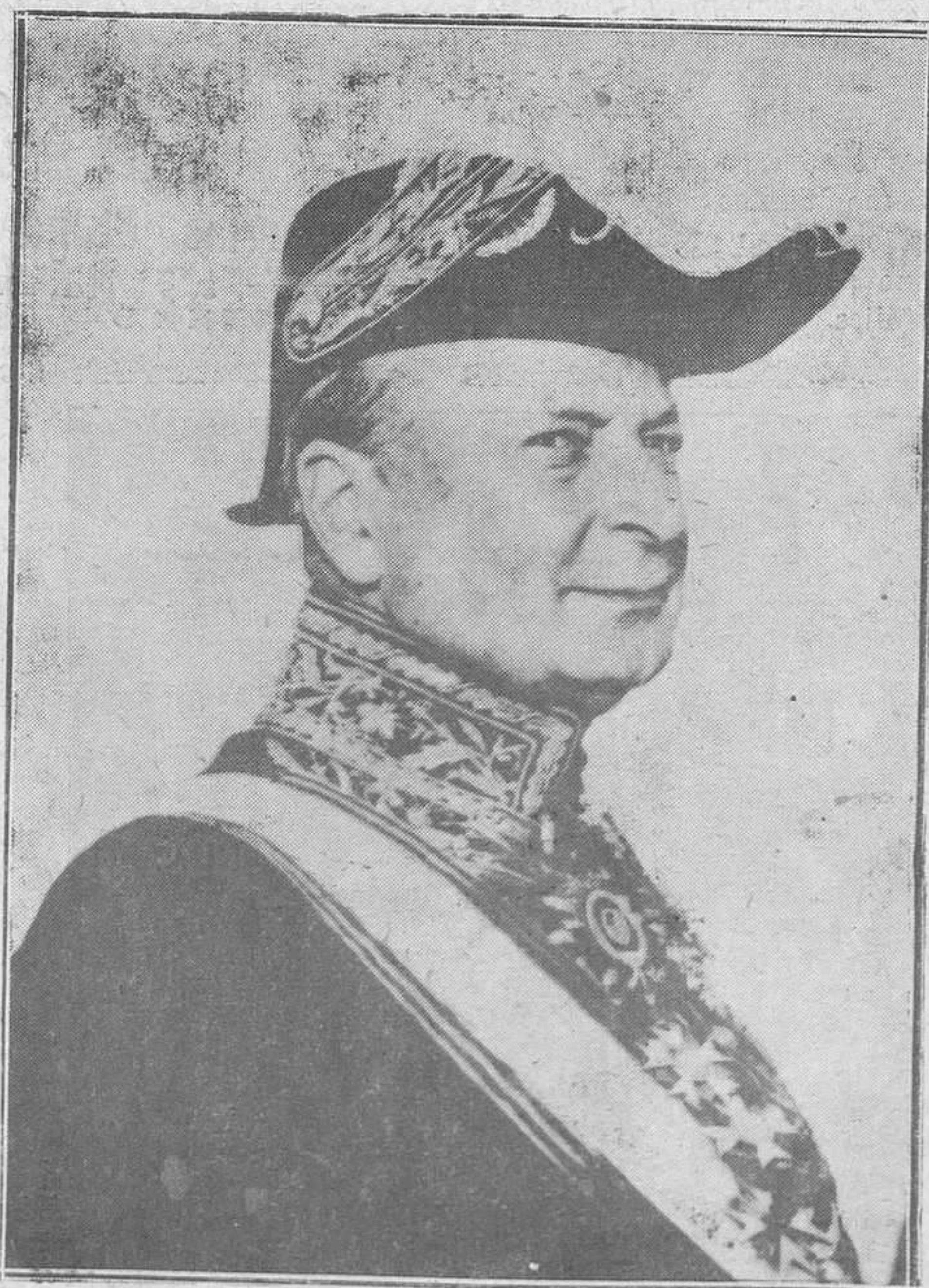
Mr. Lucien Saint nuevo residente general de Francia en Marruecos, nombrado como sustituto de Mr. Steeg, que ha sido destituido.