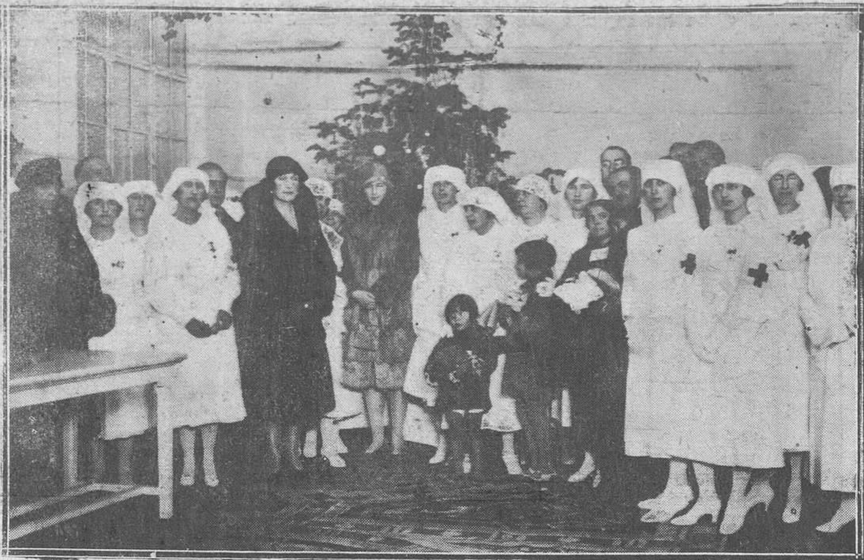
EL DIA DE REYES EN MADRID. — SS. MM. las Reinas doña Victoria y doña María Cristina y S. A. la infanta doña Cristina, en el Hospital de la Cruz Roja después del reparto de juguetes y meriendas a los niños.

Retransmisión de la música que se interpretará en el Principado, gran teatro cinem.