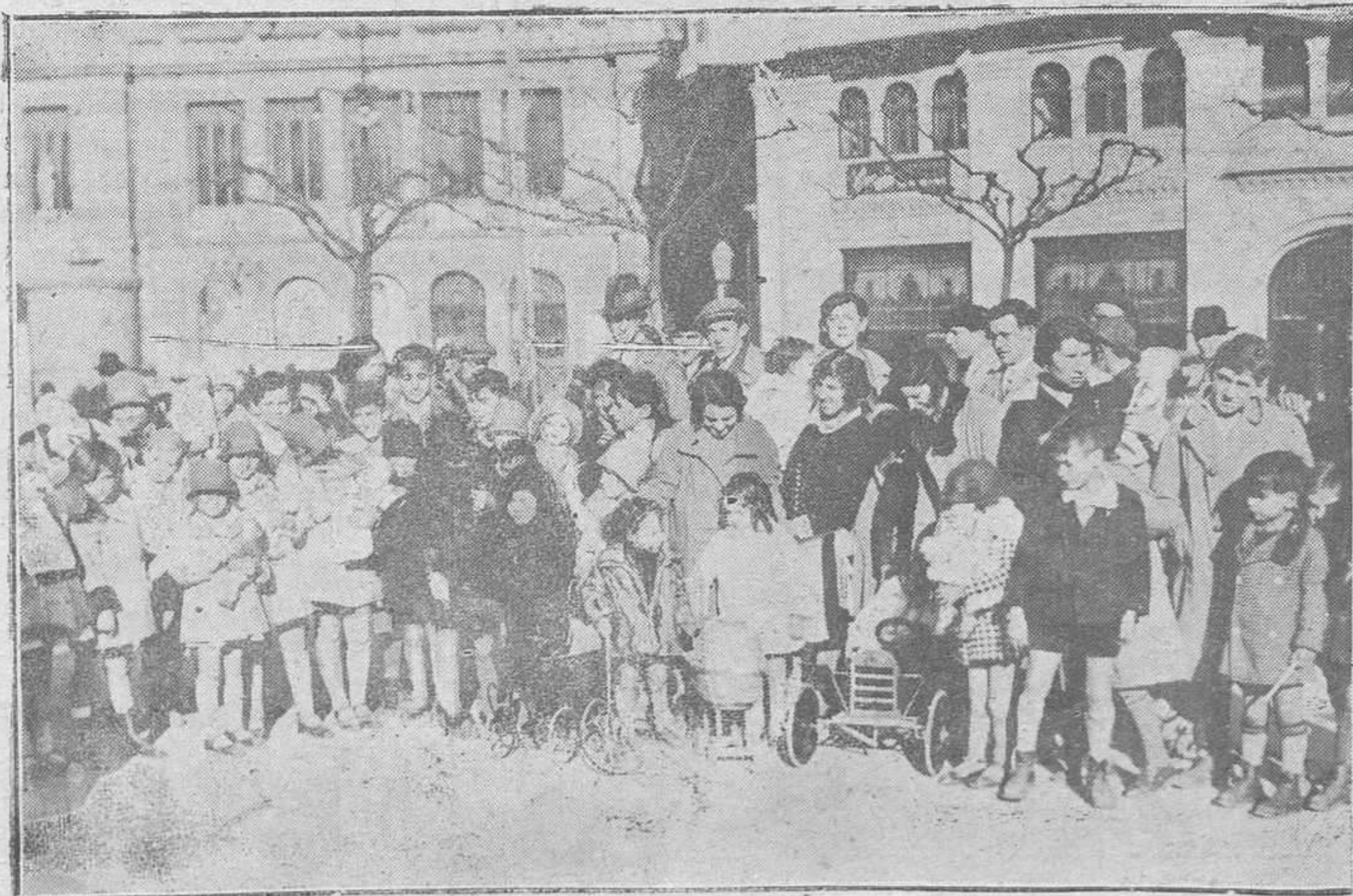
OVIEDO. -- Los niños luciendo los juguetes, regalo de los Reyes Magos, en su paseo matinal en la Escandalera.

Será dirigido por reverendos padres Paúles, pudiendo asistir al mismo cuantos señores sacerdotes los deseen practicar, aunque no pertenezcan a la Unión Apostólica.