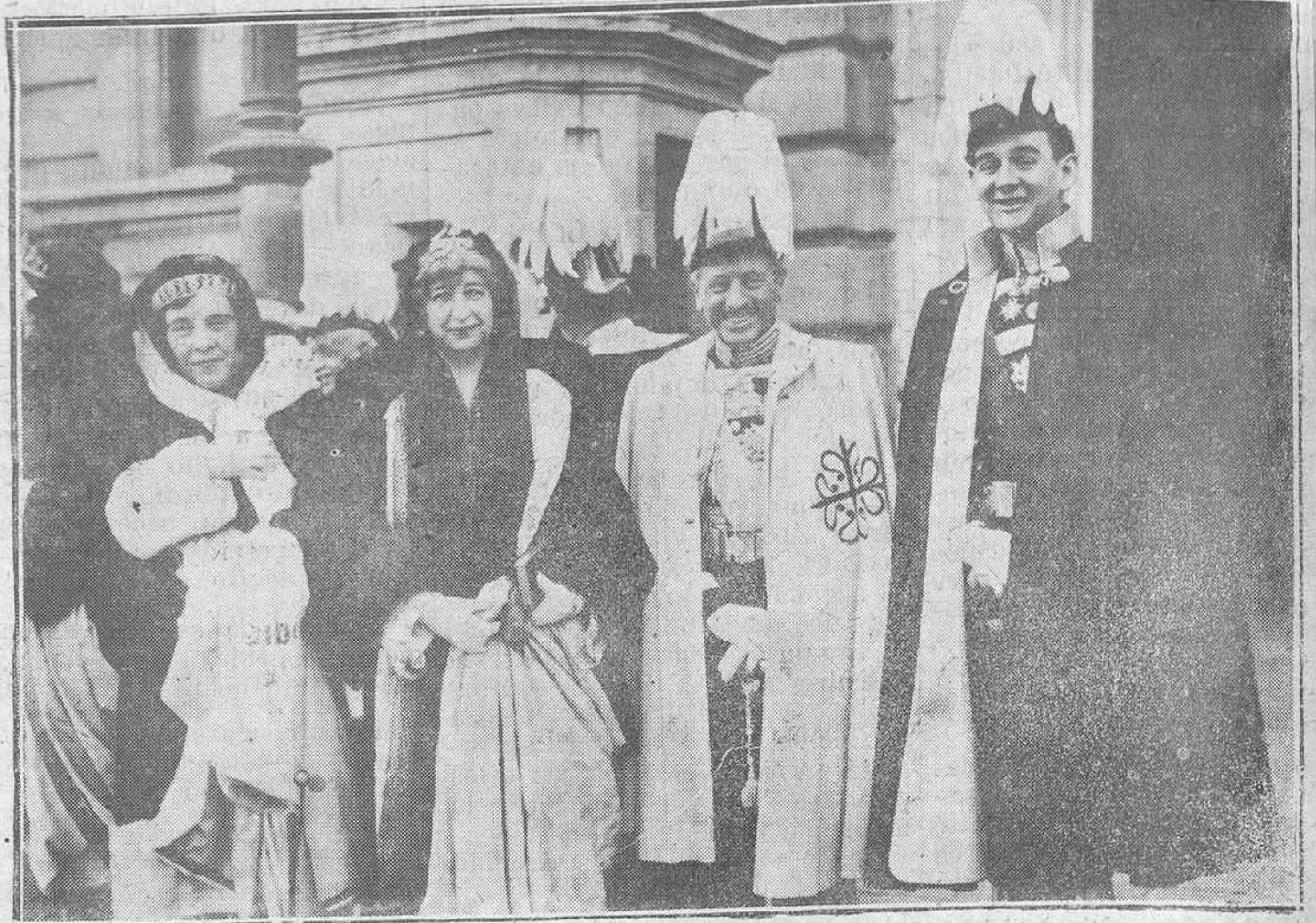
MADRID. — Damas de la Reina y grandes de España a la salida de la Capilla Pública, celebrada en Palacio, con motivo de la festividad de los Reyes.

También se pudo advertir que estaba cortado el mando.