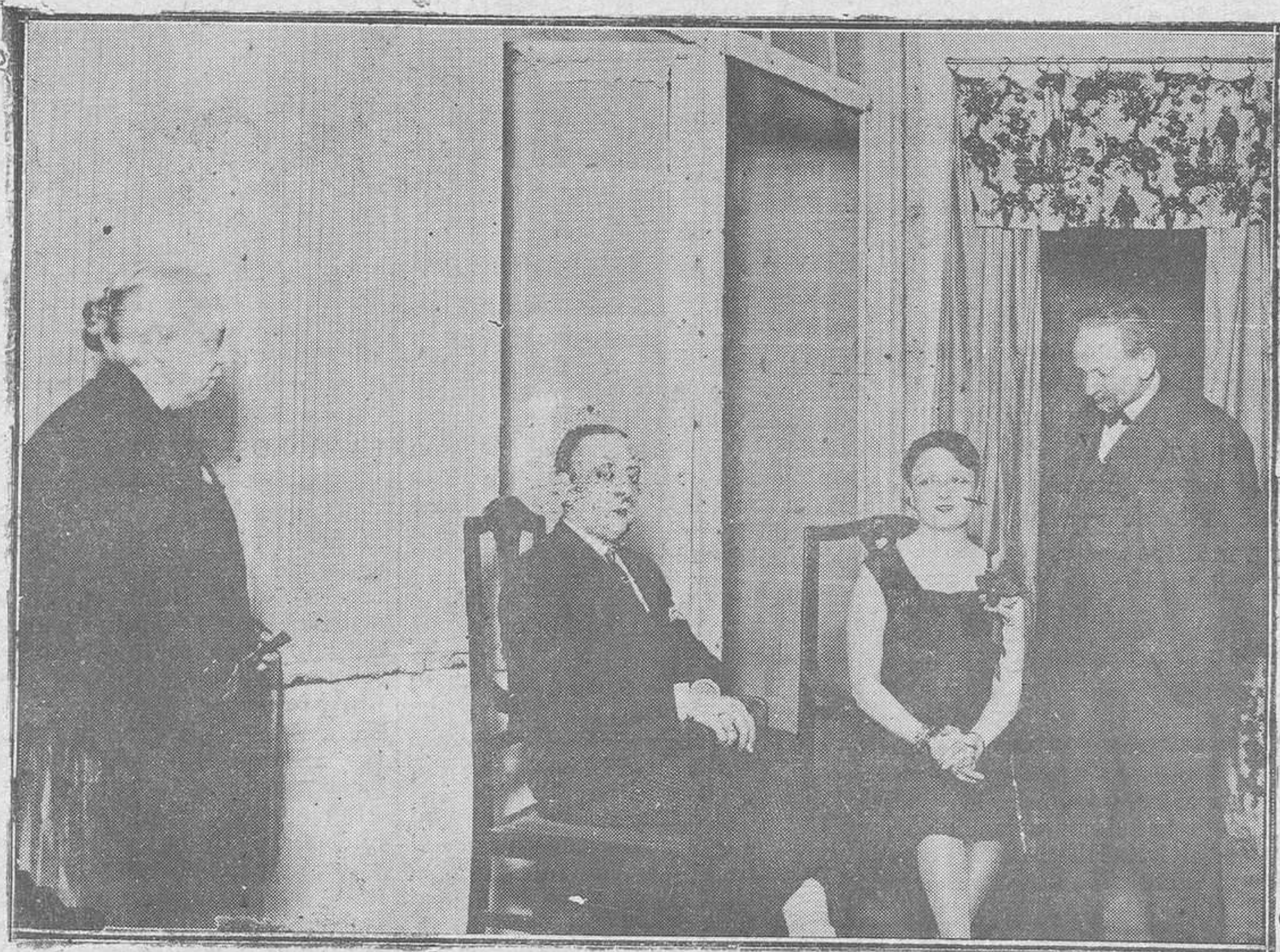
OVIEDO. — De la función a beneficio de la Asociación de la Prensa ovetense. Una escena de Cristalina, por la Compañía Meliá-Cibrán.

Camas turcas, a 55 pesetas Esta Casa es la que más barato vende en Asturias