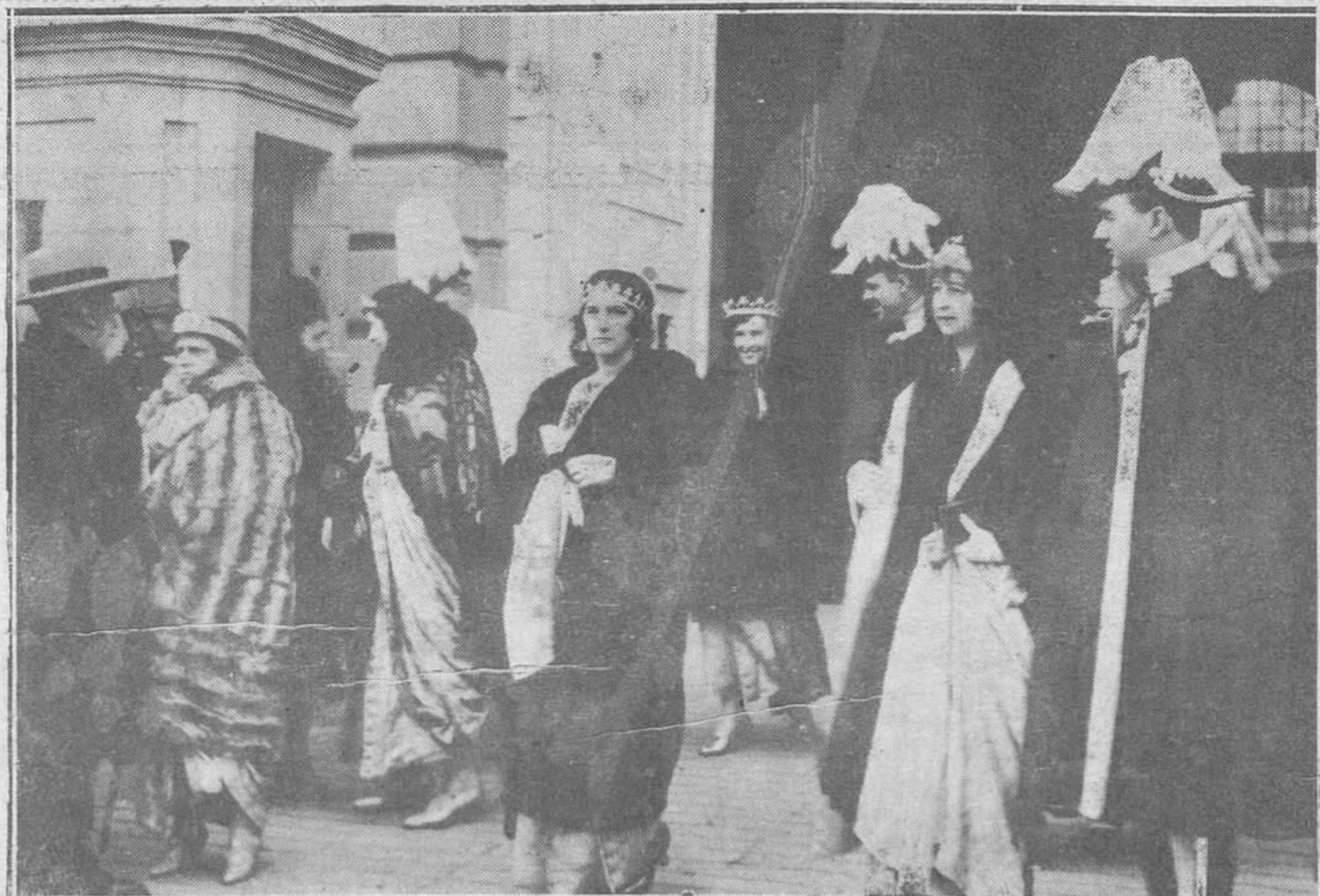
MADRID. — Damas de la Reina saliendo de la Capilla Pública de Palacio, celebrada con motivo de la festividad de Reyes.

También en la noche de Reyes se celebró en el palacio del marqués de la Ródriga, una fiesta brillantísima como suelen serlo en la morada de aquel ilustre prócer.