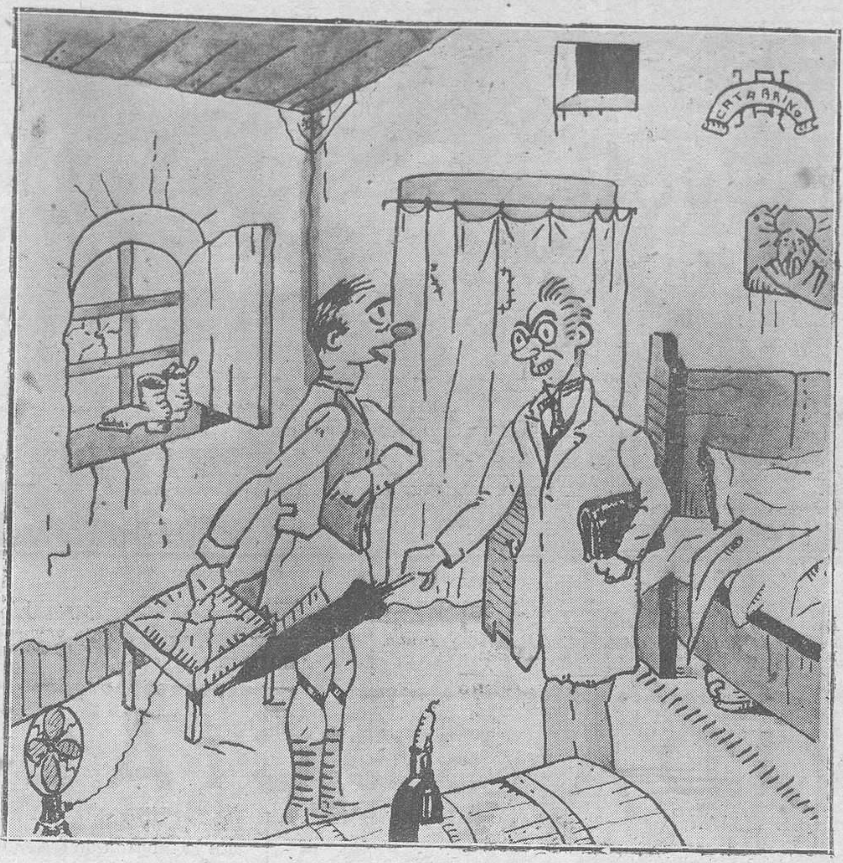
EL REGALO DE REYES

Números premiados en el sorteo del 7 de enero de 1929. Con cien pesetas el número, 9.665. Con cincuenta pesetas el número, 5.025. Con veinticinco pesetas el número, 12.086. Con diez pesetas los números, 678, 1.144, 1.551, 2.151, 2.181, 3.345, 3.781, 4.653, 4.766, 4.881, 6.400, 8.035, 7.178, 9.903, 10.558, 10.961, 12.039, 12.746, 13.096, 13.243, 830