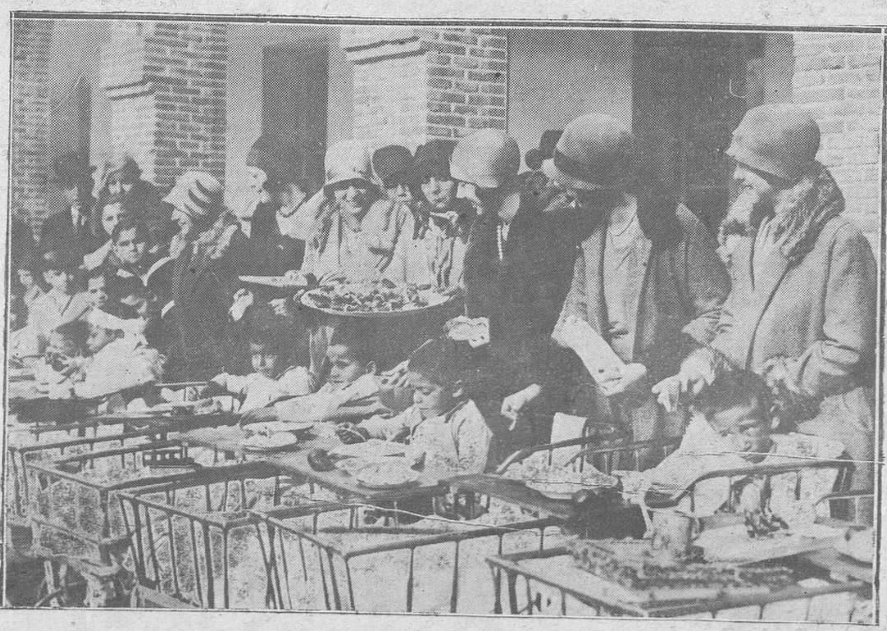
MADRID. — Reparto de juguetes y comida extraordinaria a los niños del Asilo de San Rafael con motivo del Día de Reyes.