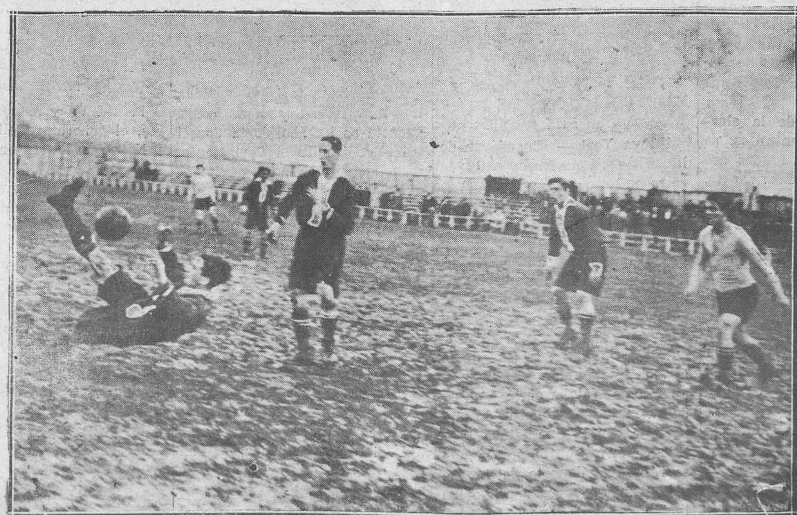
EN TEATINOS.-He aquí al equipier del Racing de Mieres en un malabarrismo que bien pudiera "firmarlo" el gran Sami

La victoria ha enardecido los ánimos de los hombres de la temida secta, que retan a todos los clubs no federados de Asturias, por si alguno hubiese que con ellos quiera medir sus fuerzas.