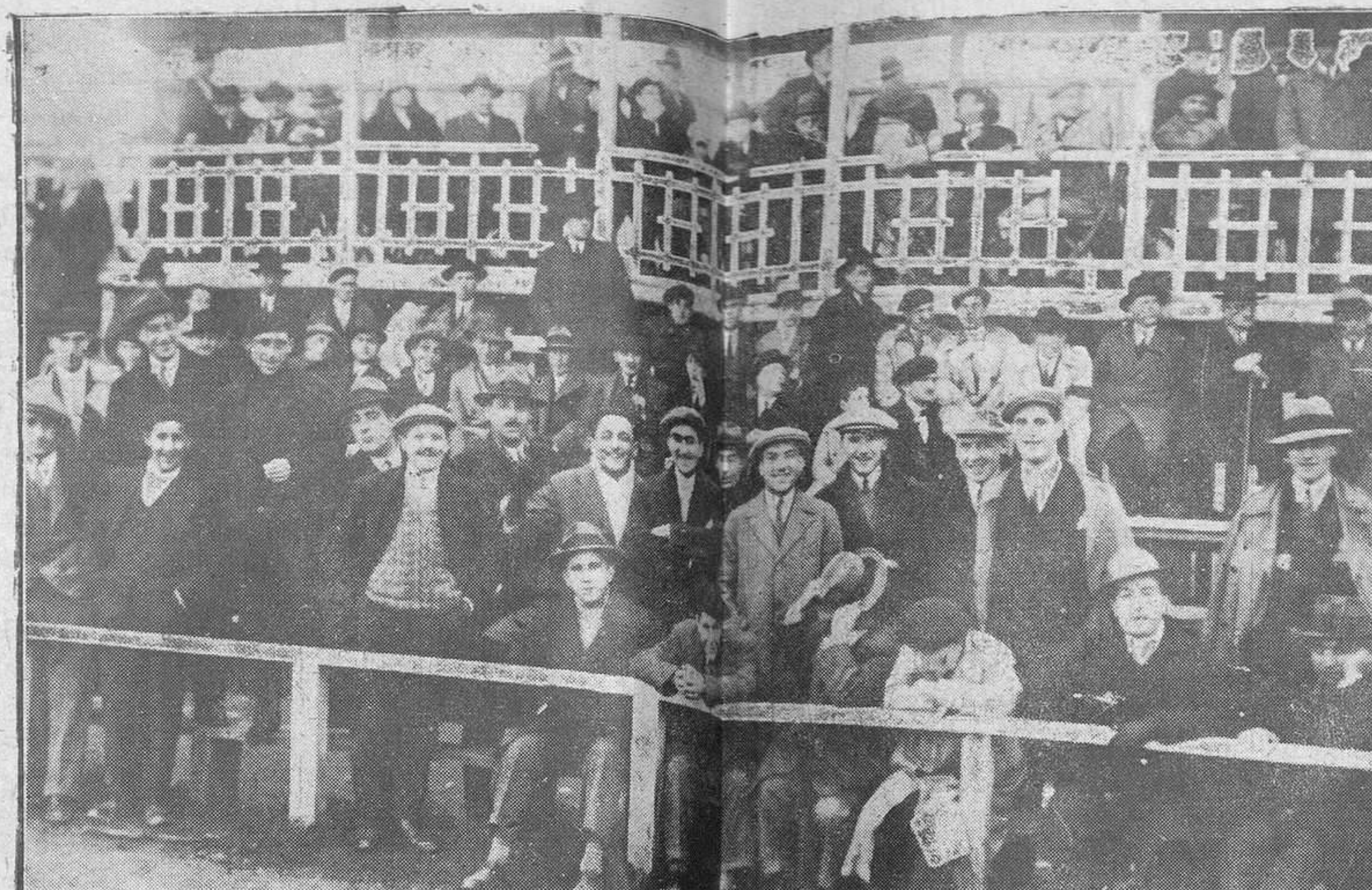
EN TEATINOS.-Un grupo de aficionados durante el encuentro Oviedo-Racing de Mieres. Como verá el lector, quien más quien menos, todos han procurado tener el físico de los días de conquista

Ahora ignoramos la fecha en que se celebrará nuevamente el encuentro.