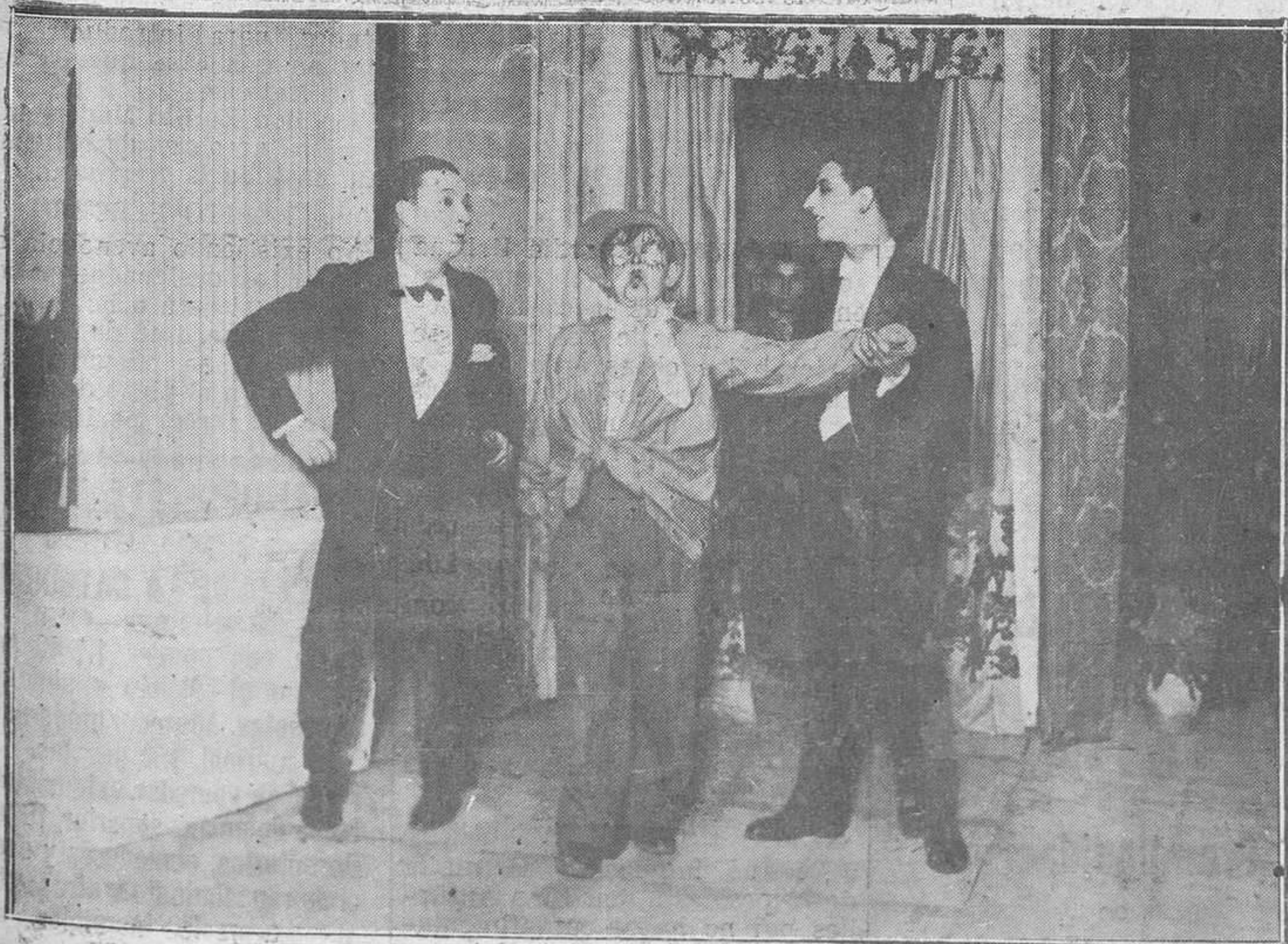
OVIEDO. — De la función a beneficio de la Asociación de la Prensa ovetense. Un número del Fin de Fiesta con que terminó dicha función.

Peña Castillo, carbón, Coruña. Diciembre, ídem, Zumaya. Magdalena, ídem, Santander. Carmen, ídem, ídem. San Leandro, ídem, Coruña.