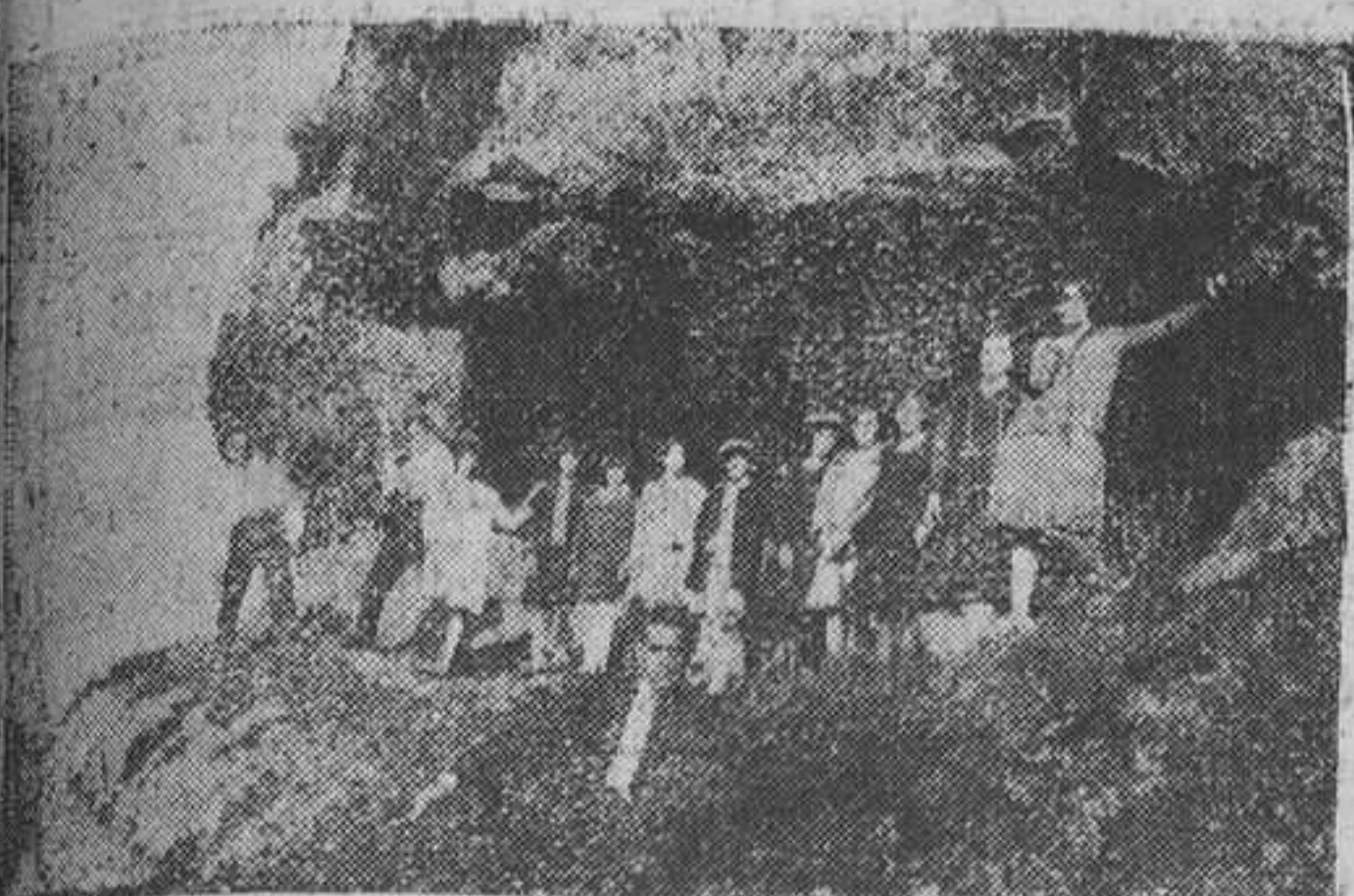
SAN MARTIN DE ANES.—Recuerdos de antaño. Modistillas de La Madera de excursión por las cuevas de la "Peñona" en 1926.