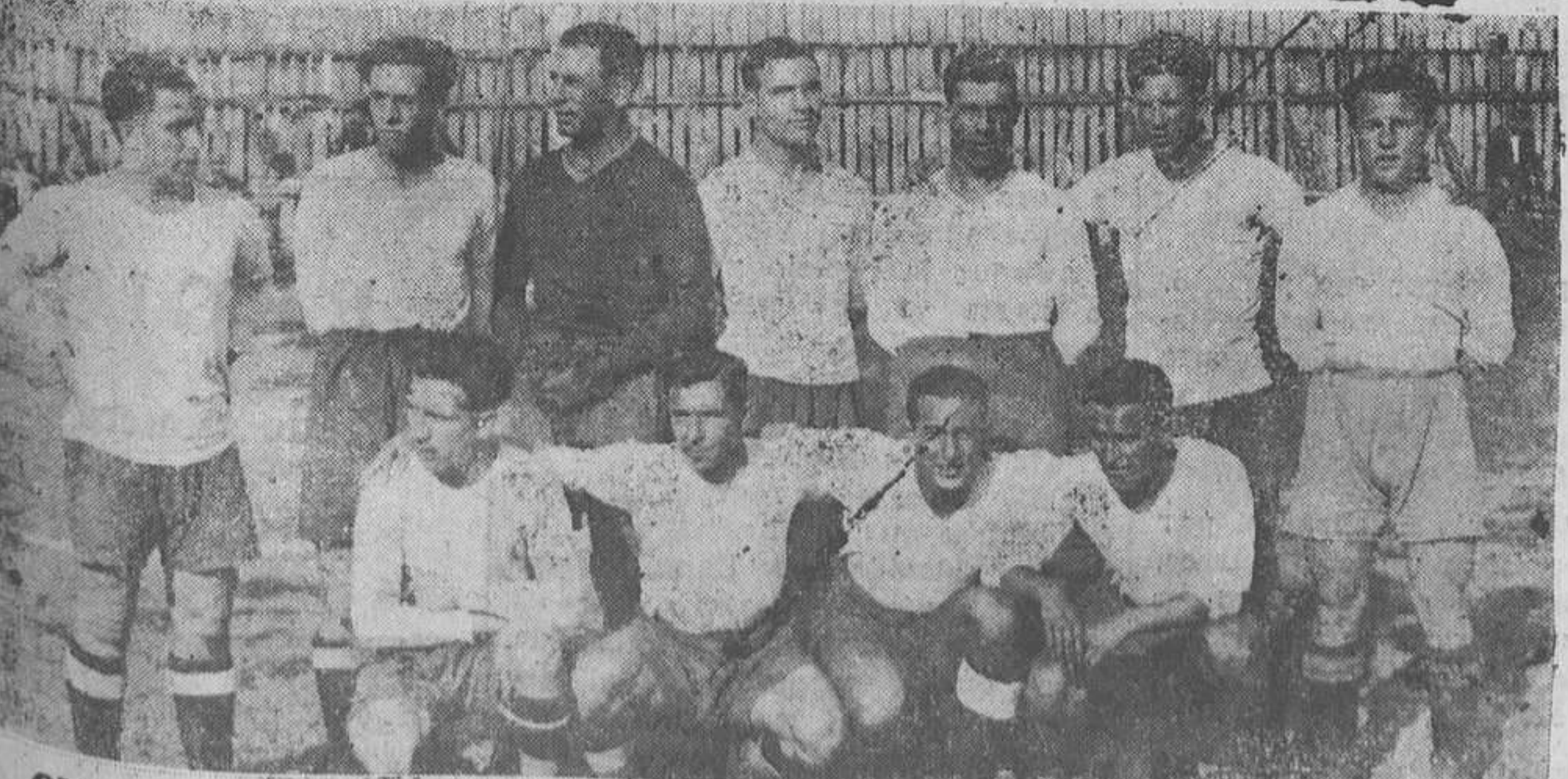
OVIEDO.—Equipo del Oviedo que ganó el domingo al Athletic de Madrid, en Teatinos.