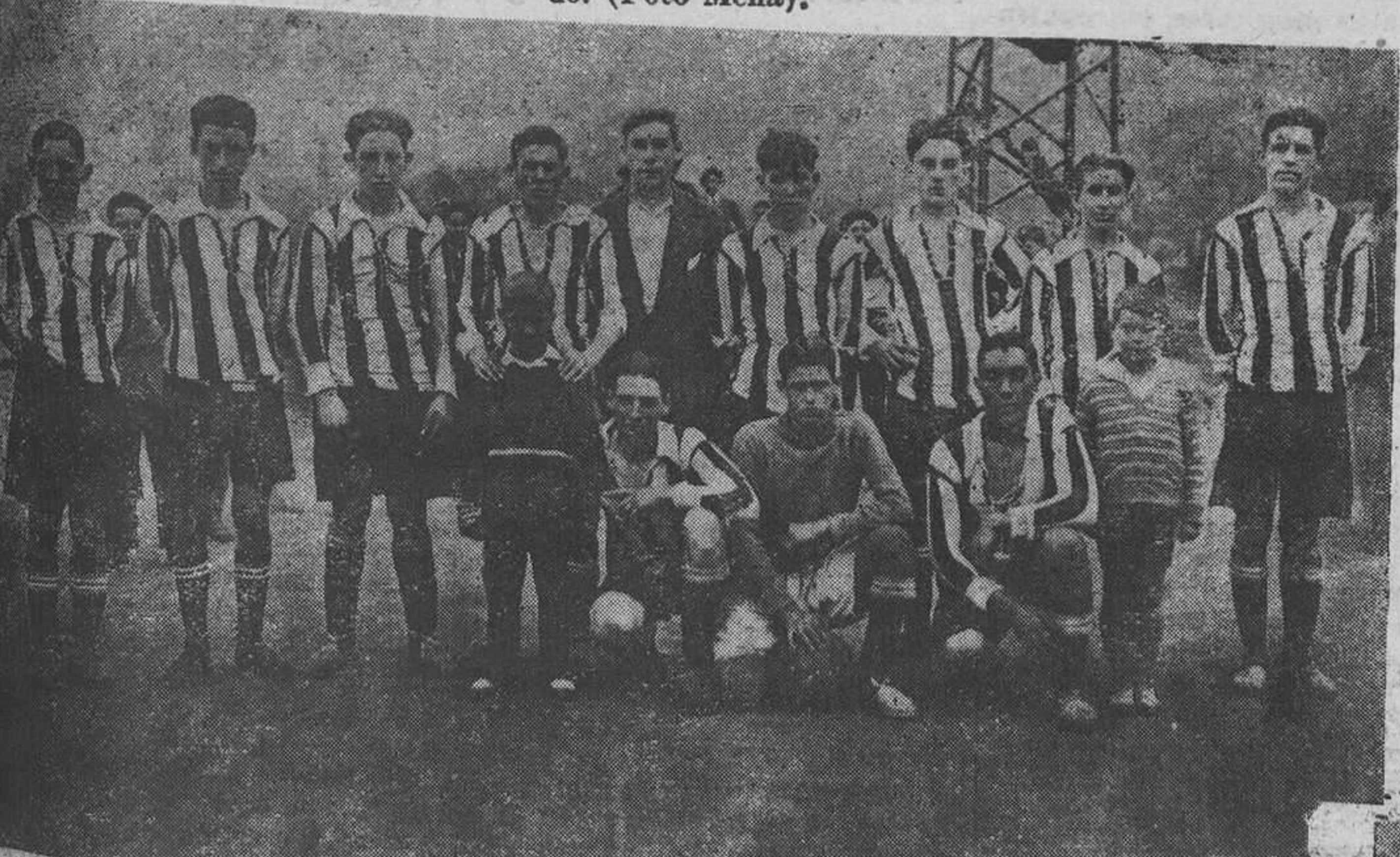
CASO SANTA ANA.—El equipo de fútbol de esta localidad, que el pasado domingo obtuvo una brillante victoria sobre un equipo gijonés.