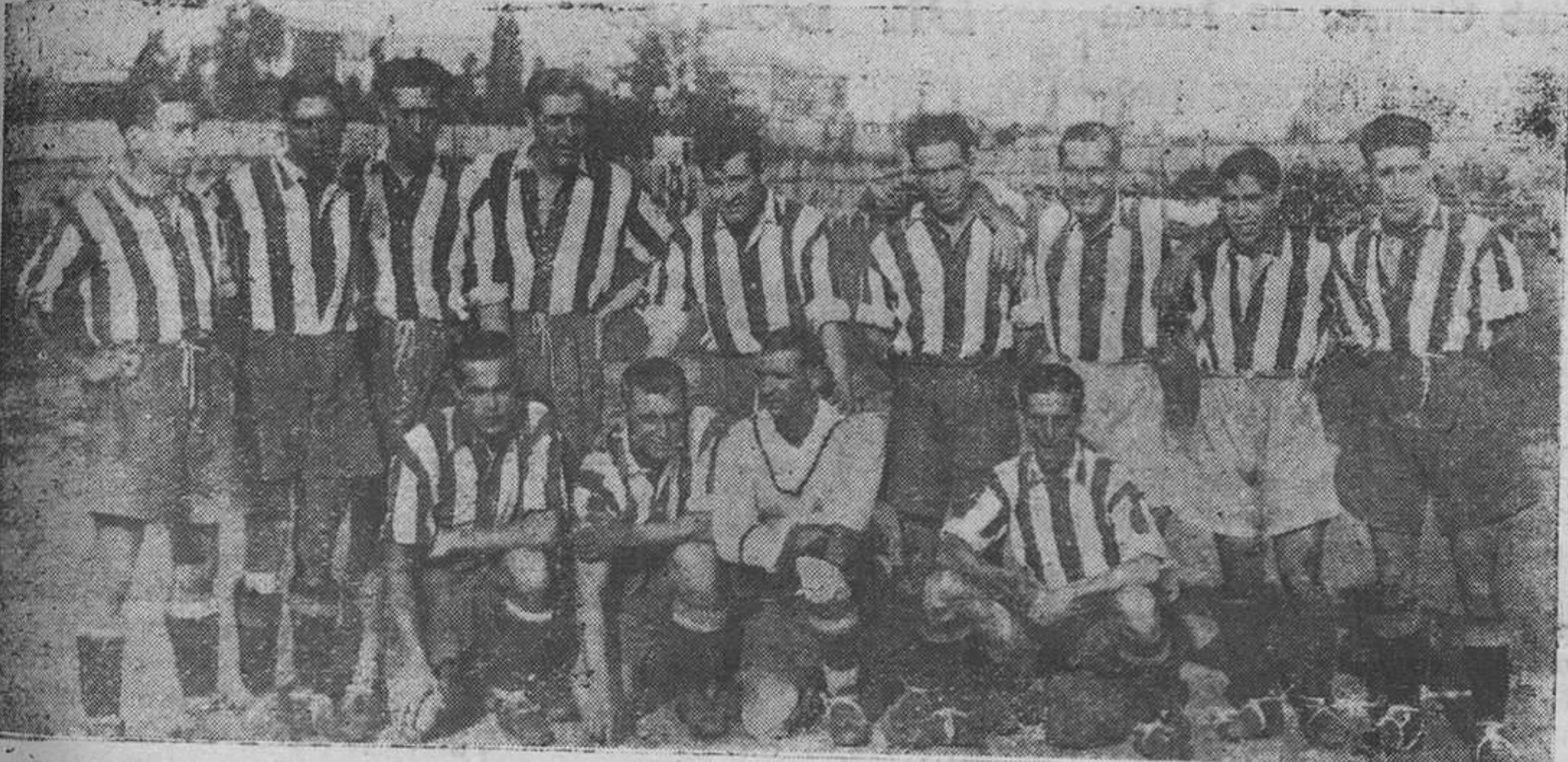
OVIEDO.—El Athletic de Madrid, que el domingo perdió en Teatinos, frente al Oviedo.