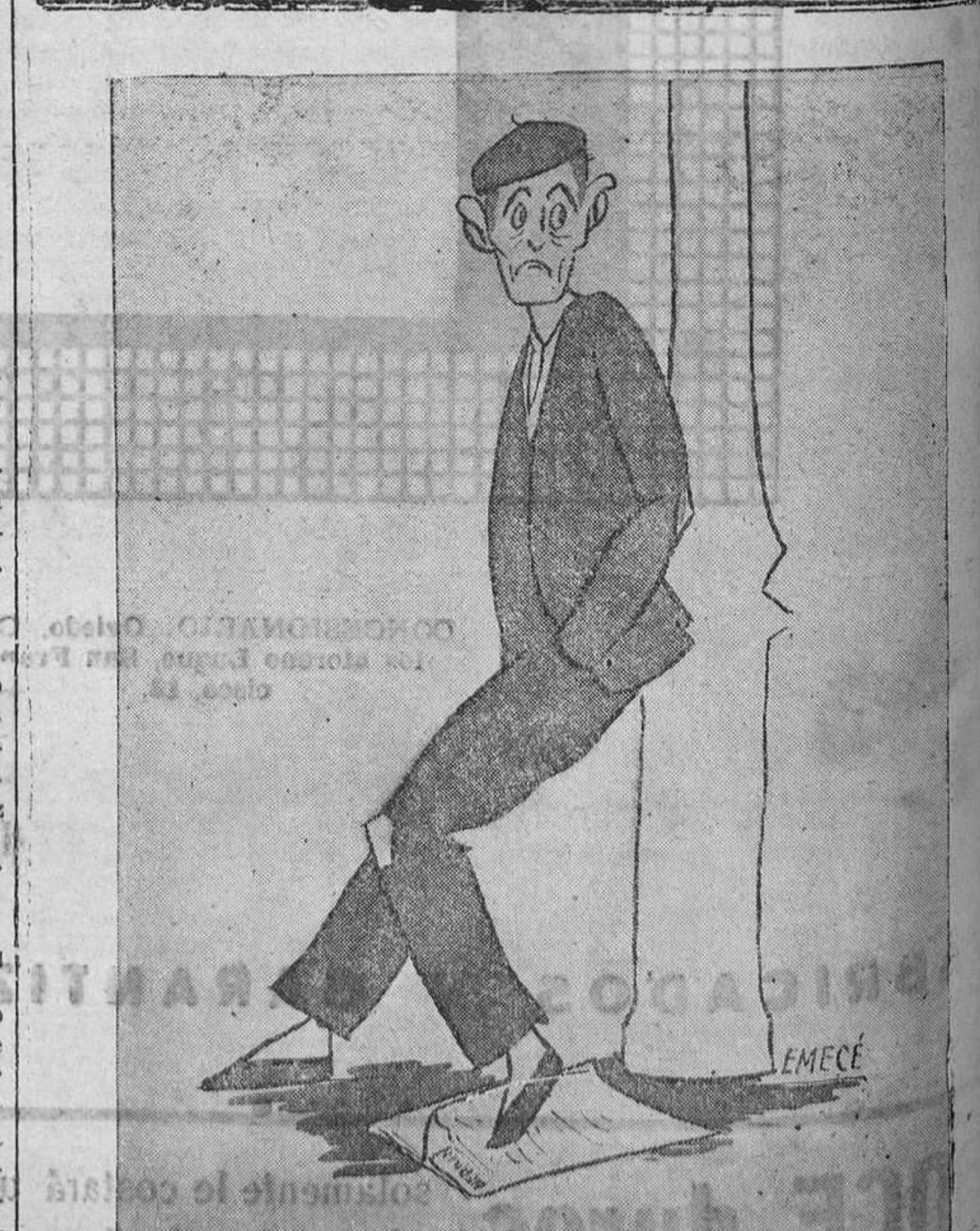
EL OBRERO PARADO.—Mucha libertad, mucha democracia, mucho liberalismo y muchas responsabilidades; pero, ¿qué voy ganando yo con todo eso?

Todo lo cual no obsta a que me reputo infalible como historiador aún de los que he presenciado. Hay tantas cosas que nuestros ojos han visto y que, sin embargo, niega el corazón!