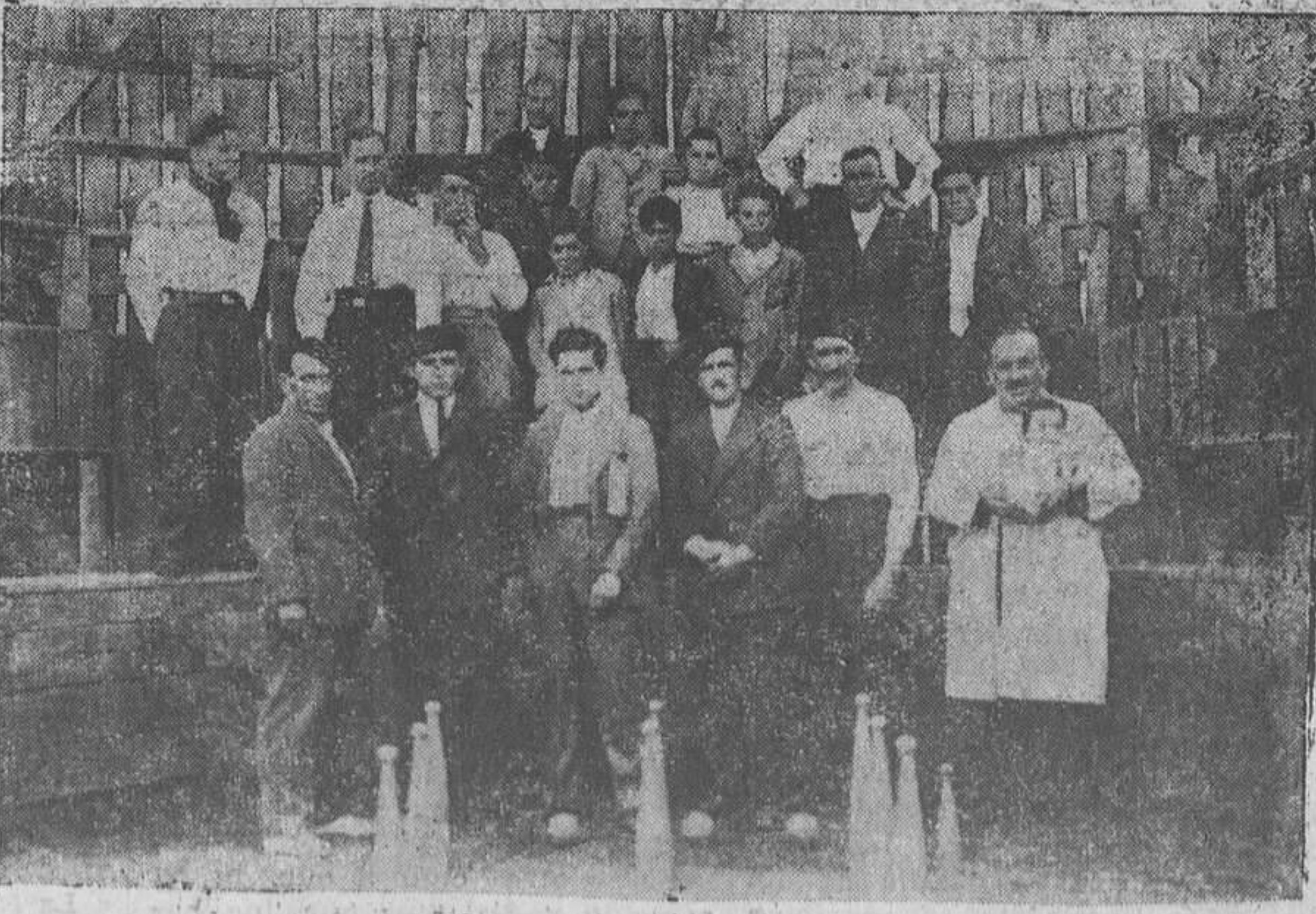
LANGREO.—La Junta directiva de la notable partida "La Prueba" presenciando una partida celebrada en su bolera de El Lugarín (La Felguera).