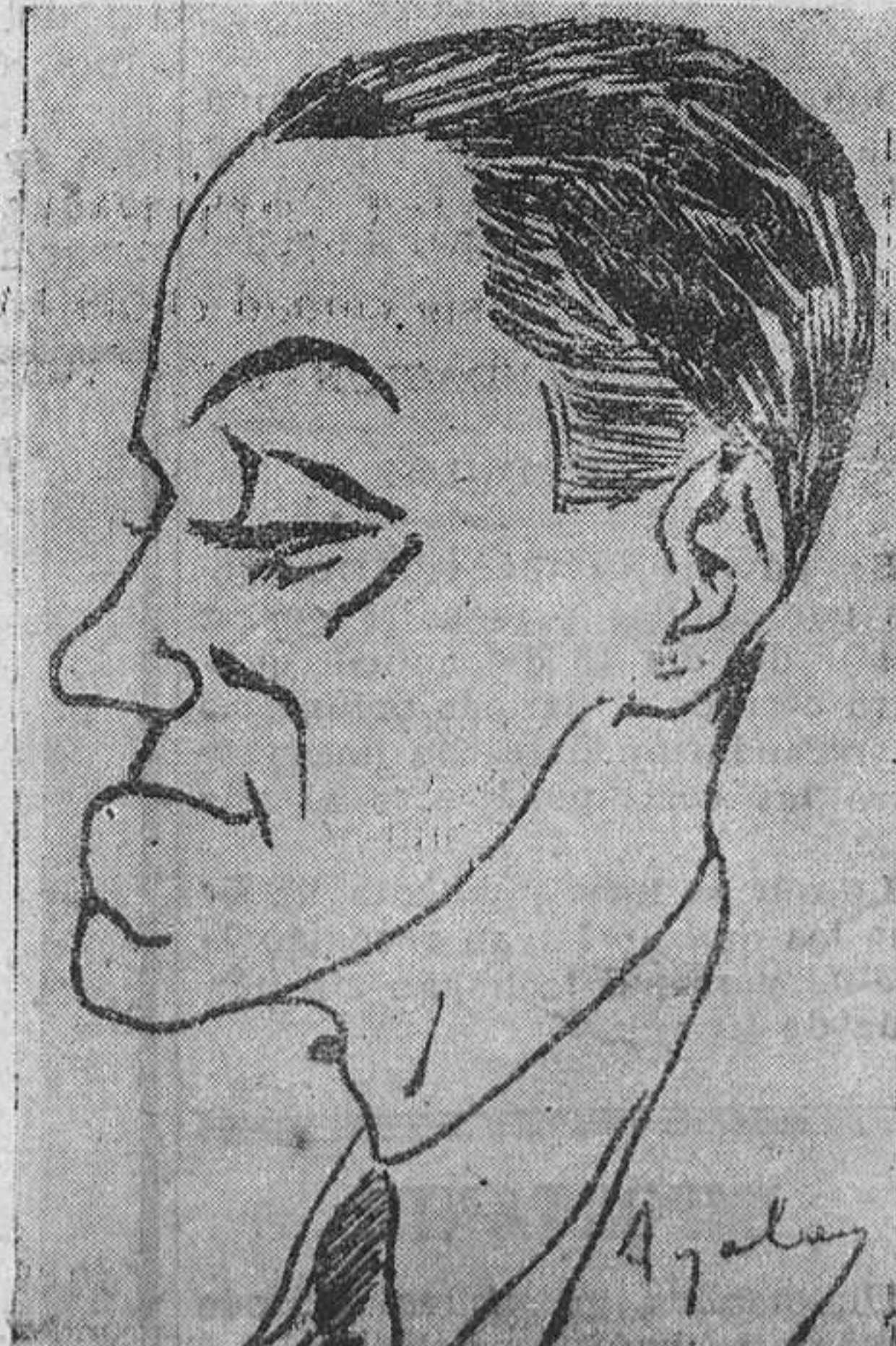
Ahora que está, desdichadamente, de actualidad D. Ramón Pérez de Ayala, publicamos una autocaricatura del autor del esperpento "A. M. D. G."