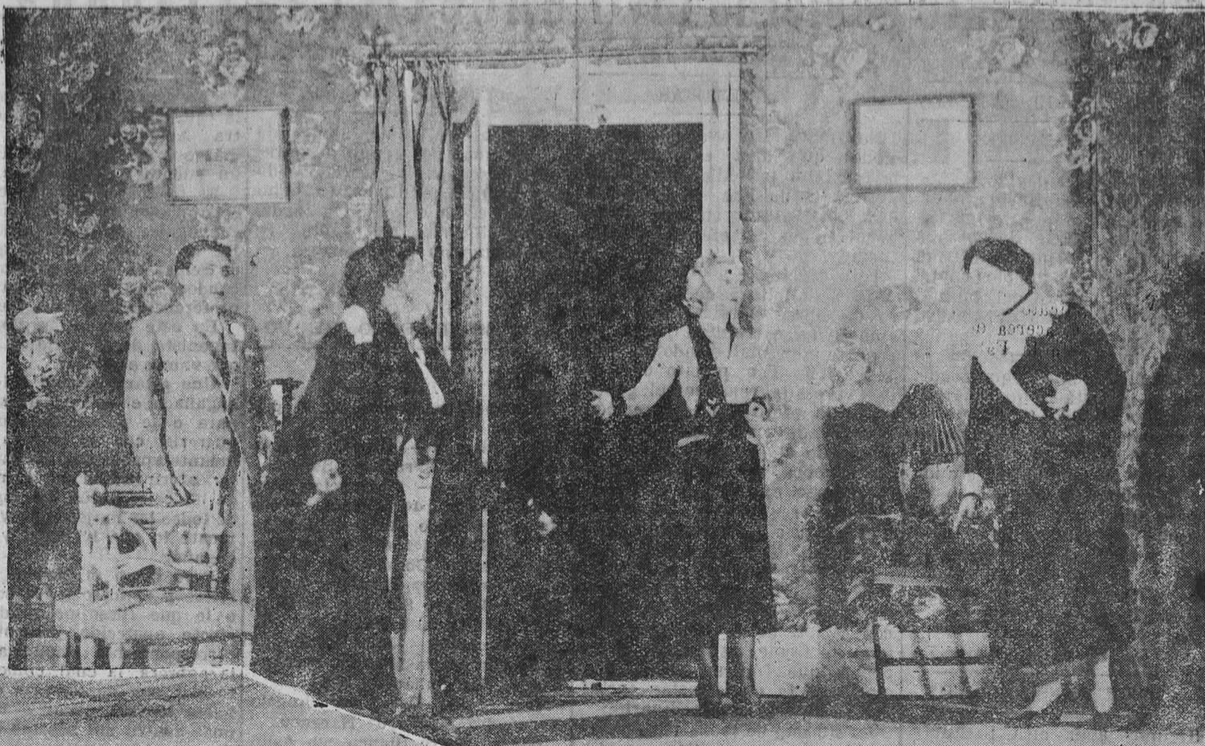
Una escena de la comedia "Viejo de ilusiones", original de Con Carlos Arniches, estrenada en el teatro Lara.