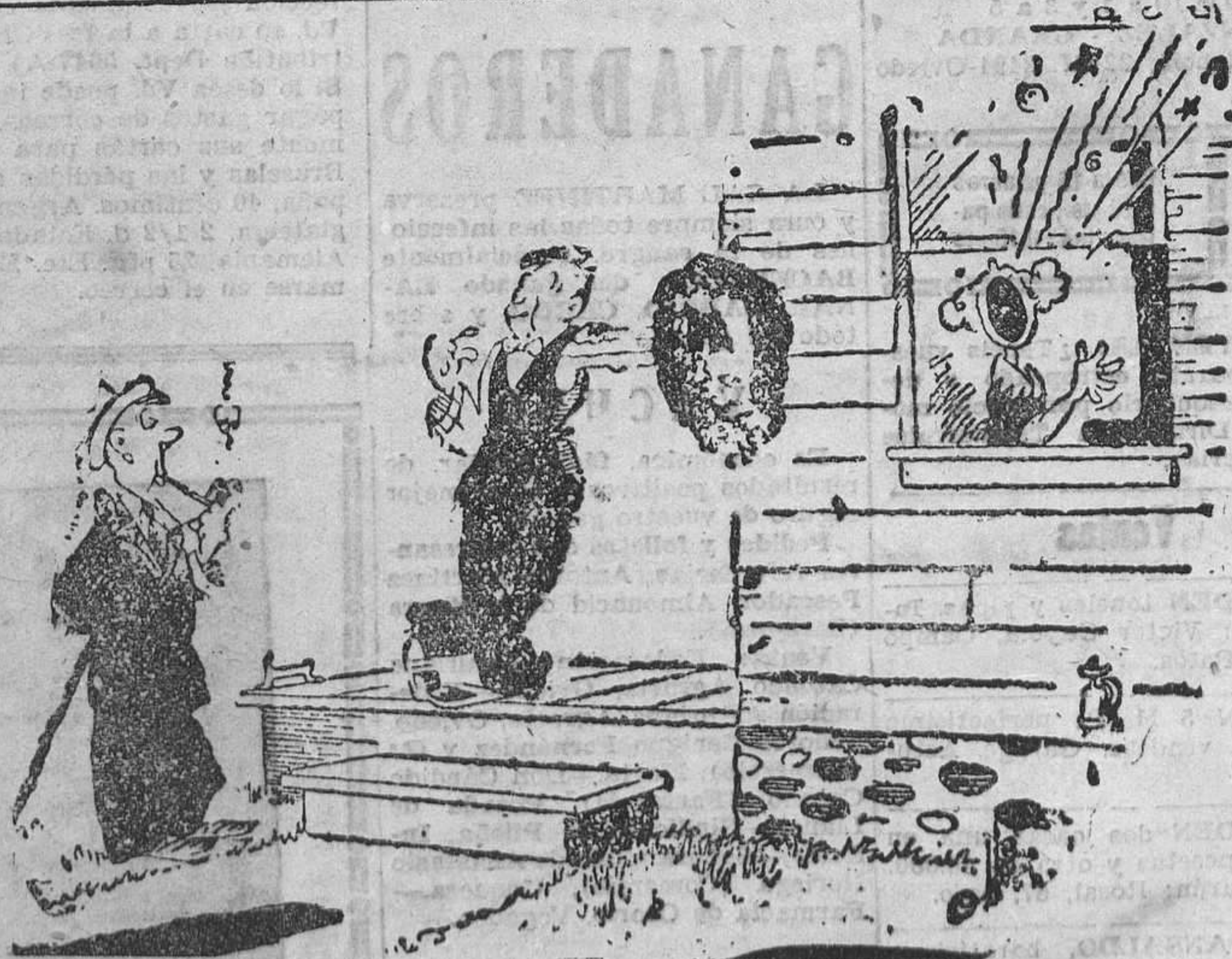
—Me he salido aquí para que no crean los vecinos que la estoy matando.

EDITORIAL GRAFICA Melquiades Alvarez 7 OVIEDO