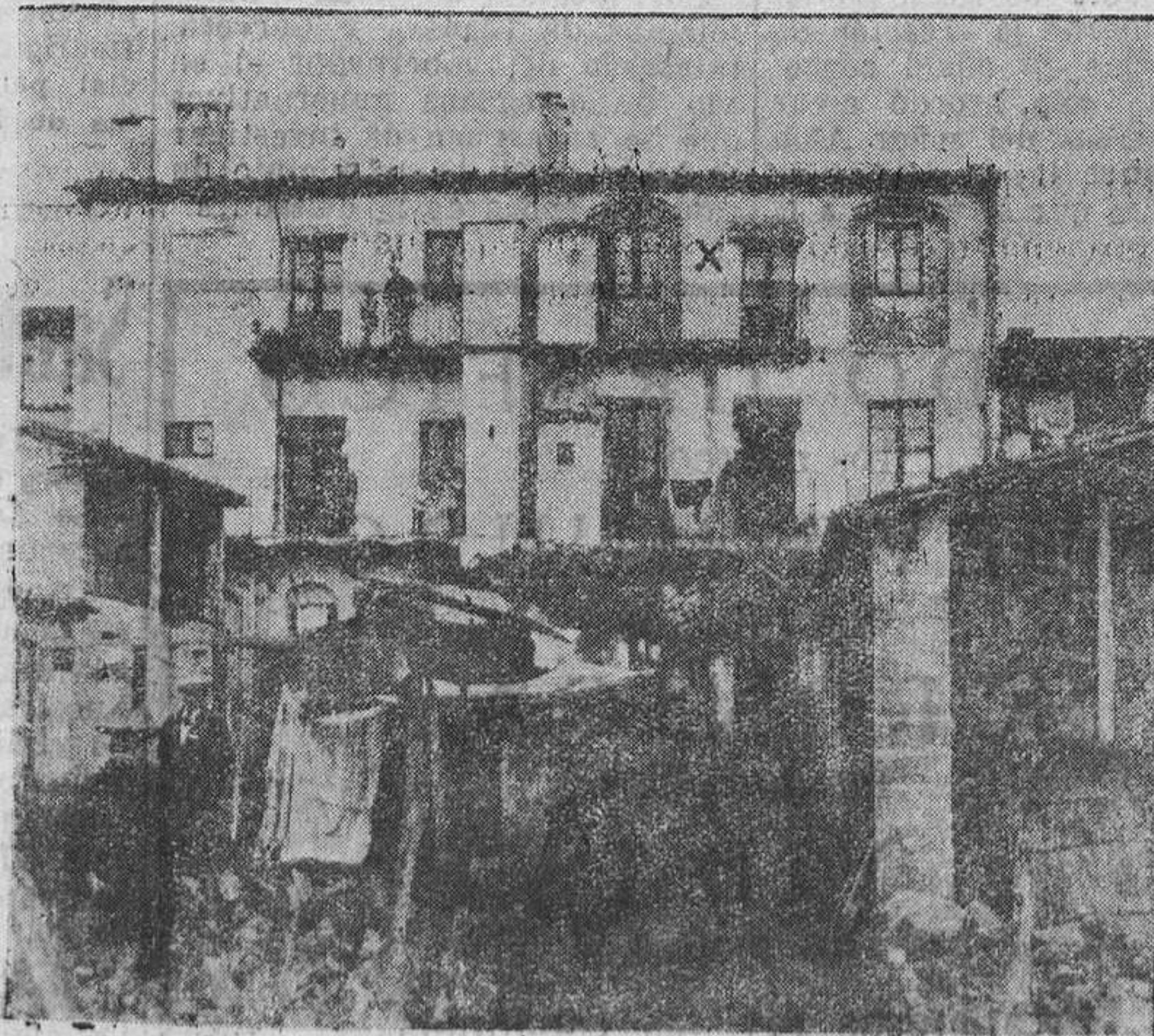
OLOT (Gerona).—La casa (X) donde habitaba Elvira Roca, asesinada por unos desconocidos, que penetraron en su domicilio, apoderándose de 250 pesetas que guardaba la infortunada en una caja.