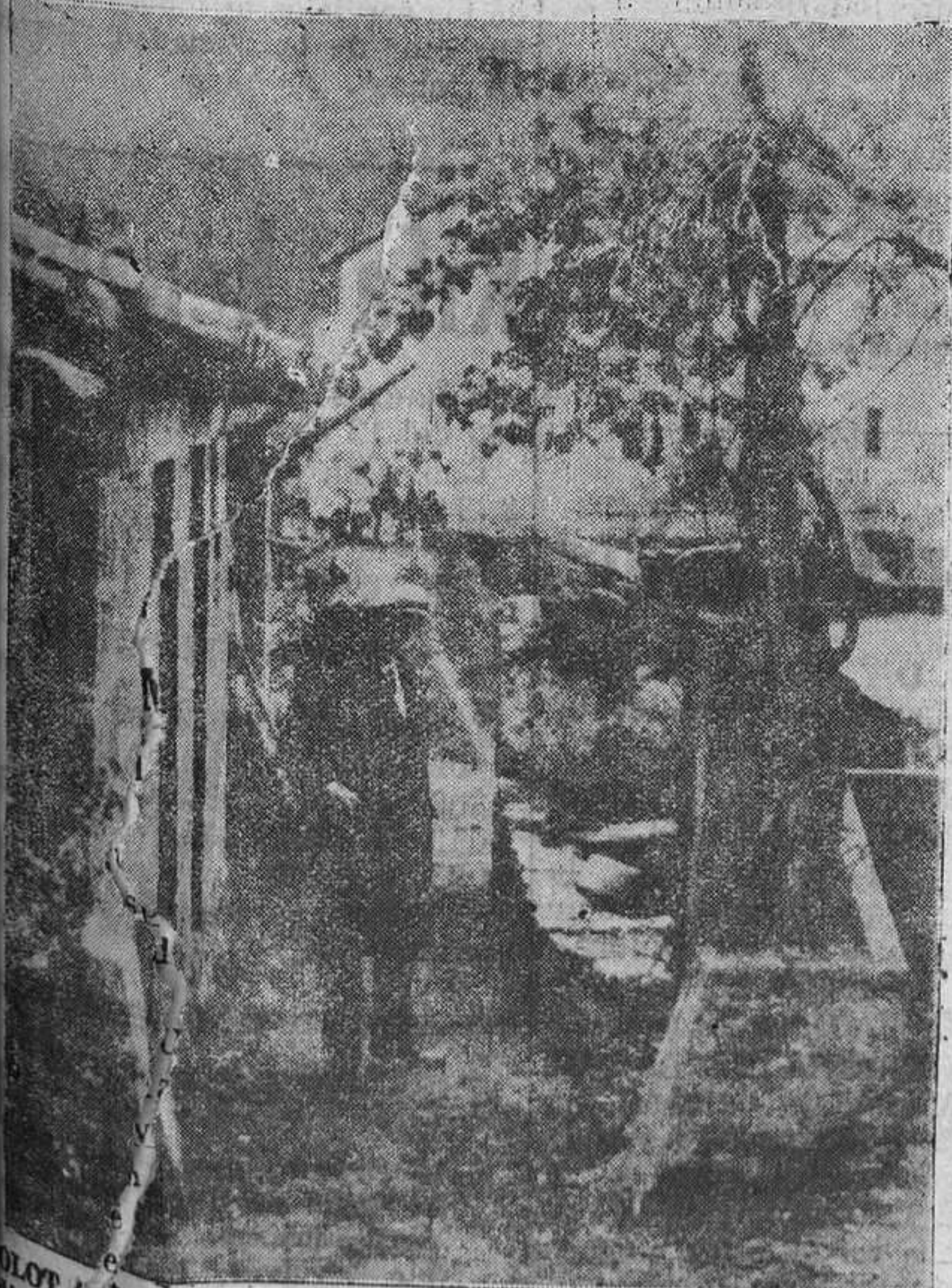
OLOT (Gerona).—Lugar donde fue encontrado el cadáver de Elvira Roca, asesinada por unos desconocidos.