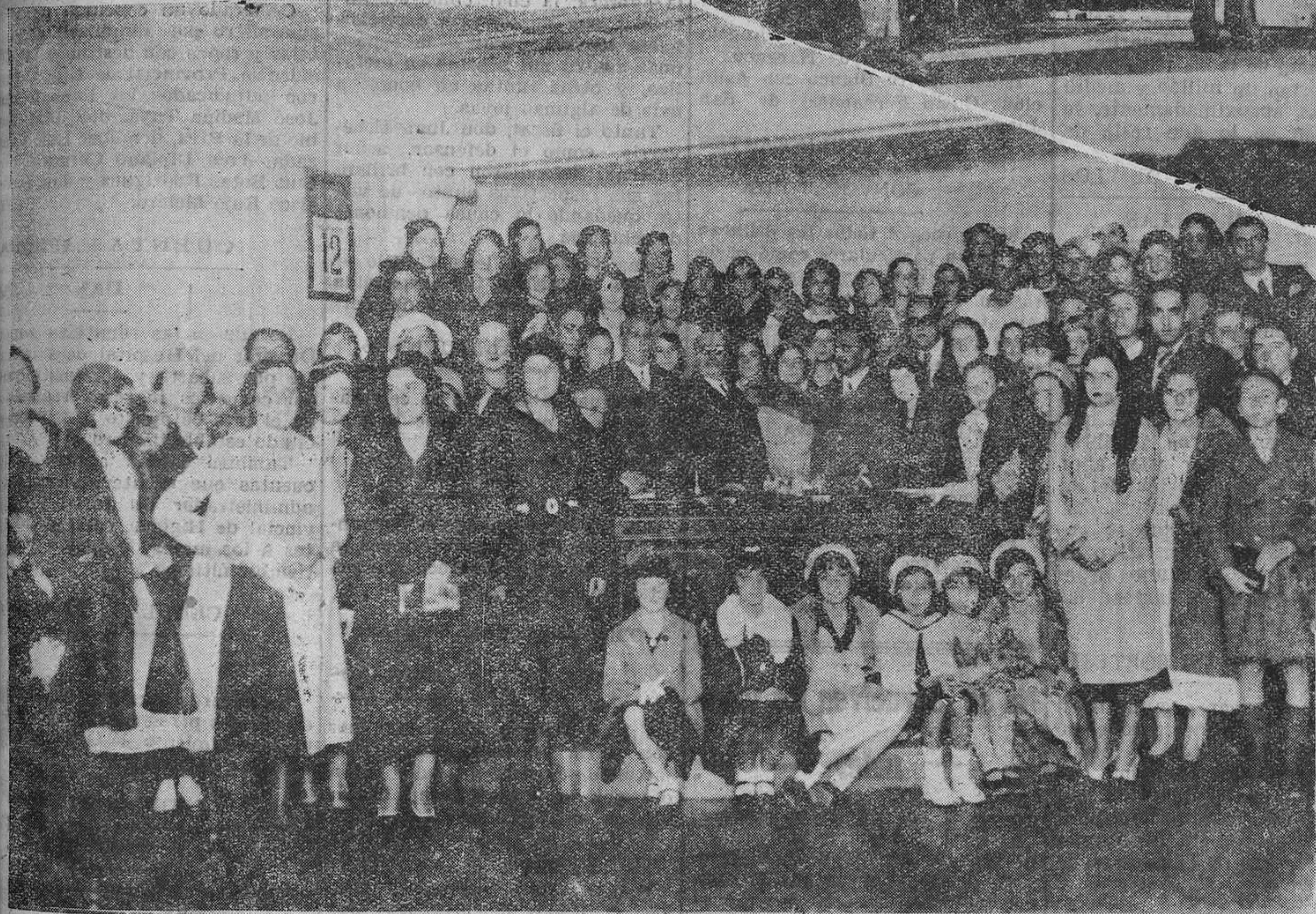
MADRID.—En la Asociación de la Prensa. Inauguración de clases del curso 1931-32.