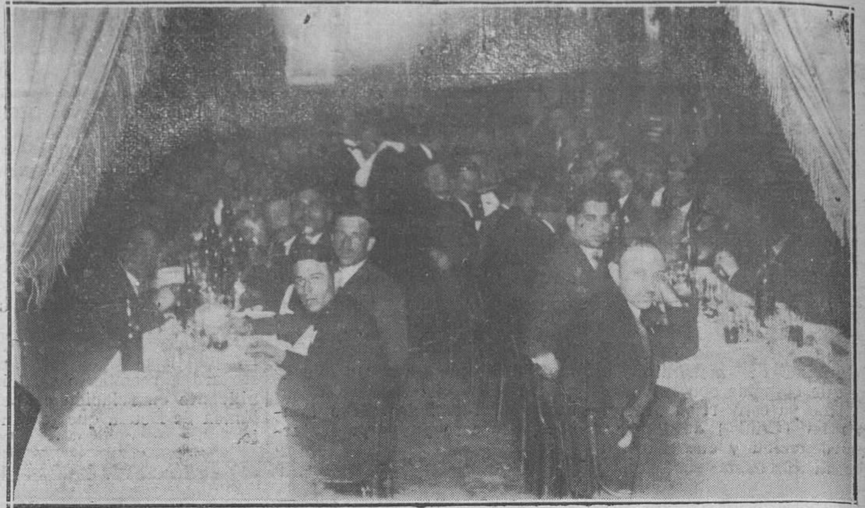
OVIEDO; EL BANQUETE DE LOS FERROVIARIOS.-Un aspecto del comedor del restaurant del Campoamor.

Y, por último, al restaurant del Campoamor, por su excelente servicio y exquisitez en la confección del menú.