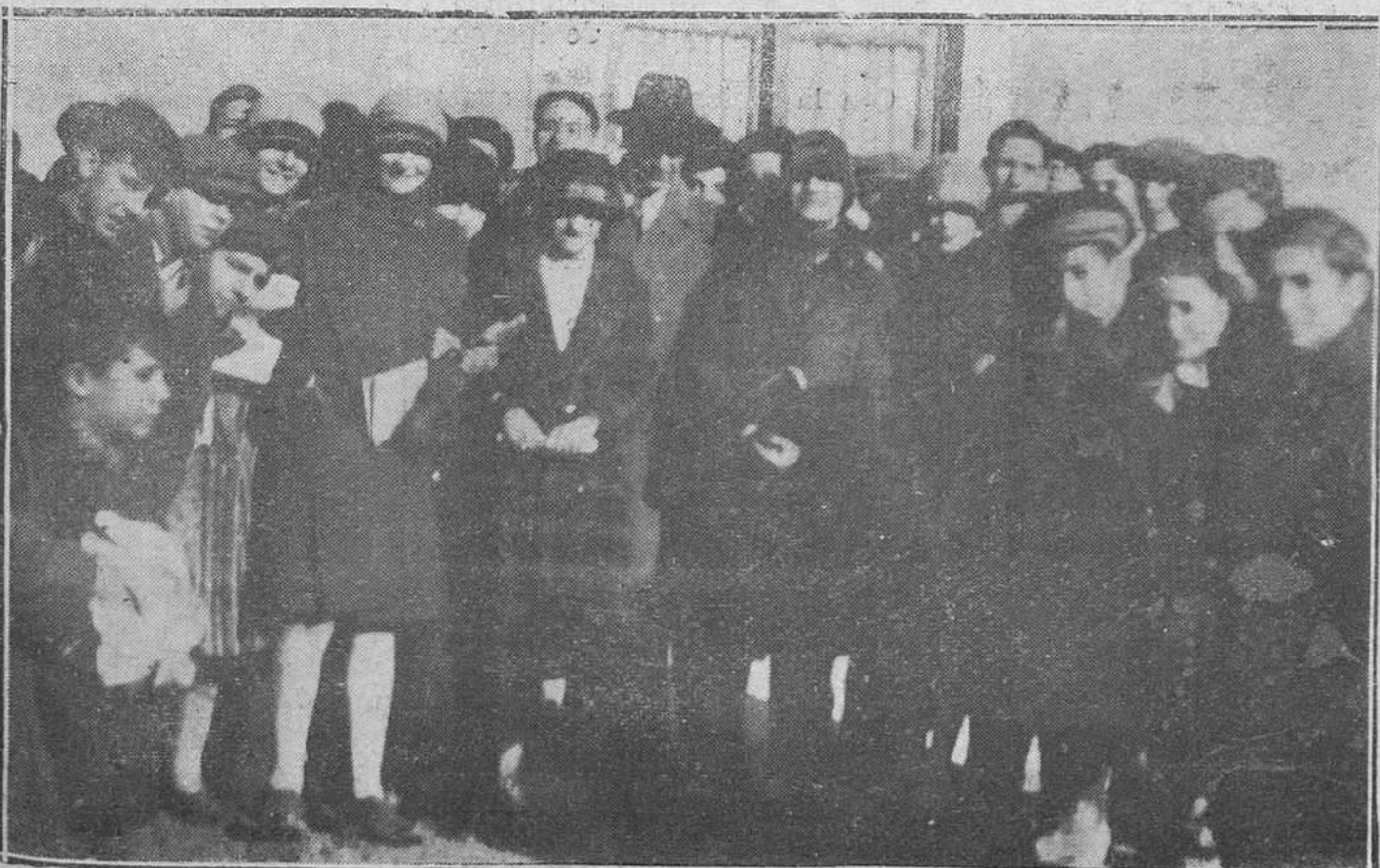
OVIEDO.—Un grupo de bellas alumnas de Ciencias, acompañadas de su catedrático, a la salida del Instituto.

Magdalena, 26, 1.º izquierda (antiguo Gobierno militar)