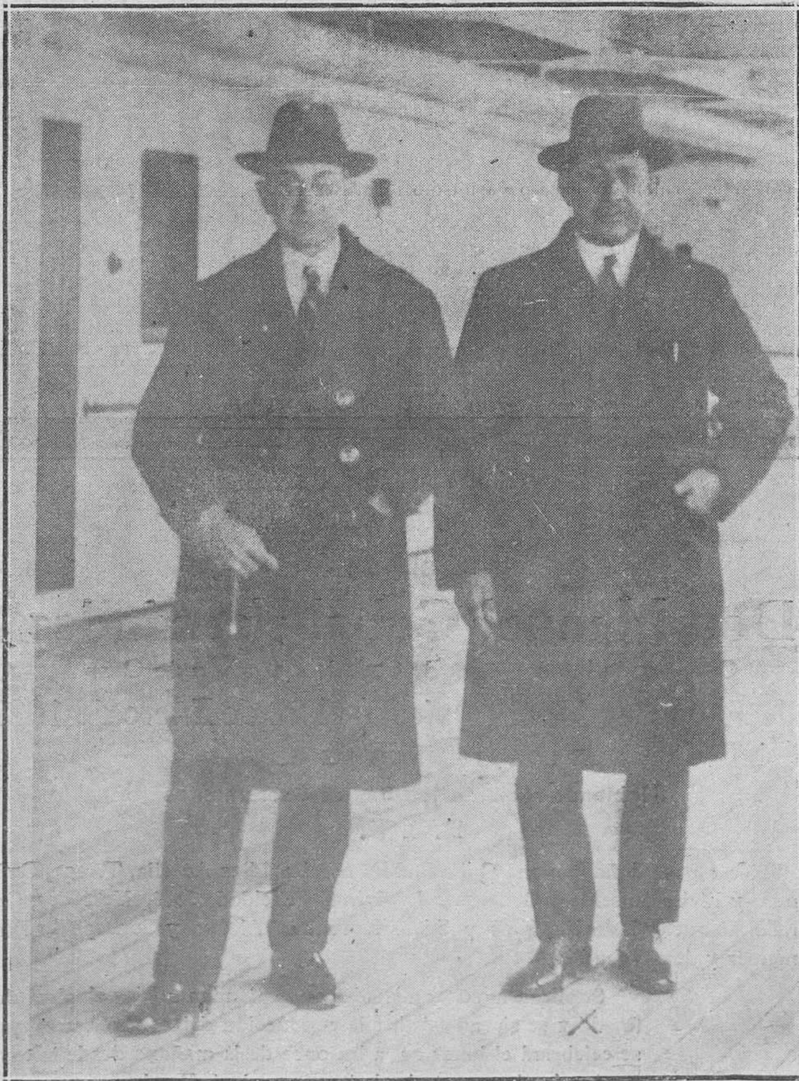
SANTANDER.—El ministro de Nicaragua señor Chamorro, en la cubierta del Orbita acompañado del secretario del Gobierno civil, señor Dórga, que acudió a cumplimentar en nombre de Gobierno español. Este señor Chamorro ha sido dos veces presidente de su país.