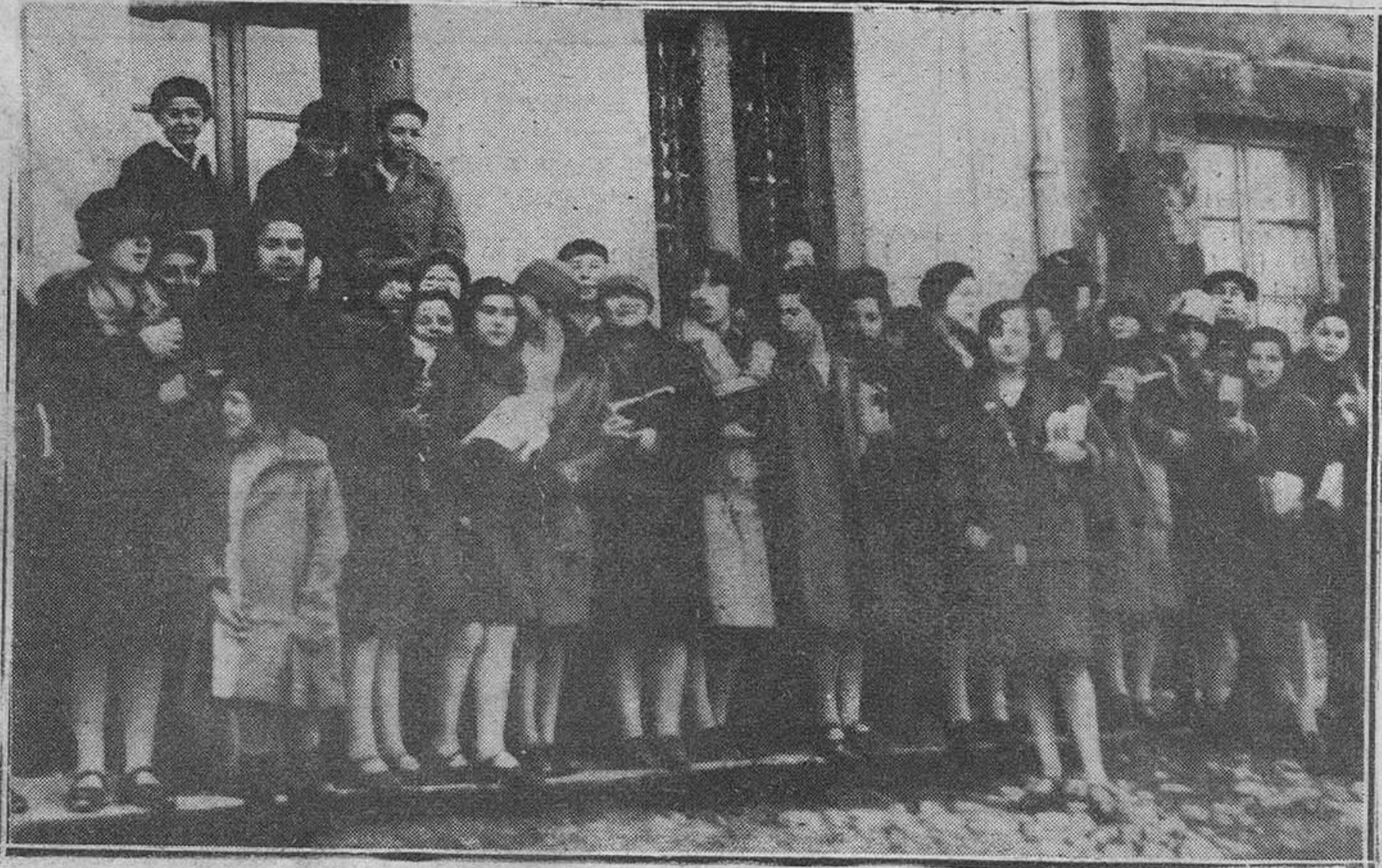
OVIEDO.—Un grupo de lindas estudiantes a la salida de clase.

Lo que no existe forma de averiguar es la fecha en que la Jefatura de Obras públicas dispondrá el arreglo de las demás carreteras provinciales, algunas de las cuales se hallan de todo punto intransitables.