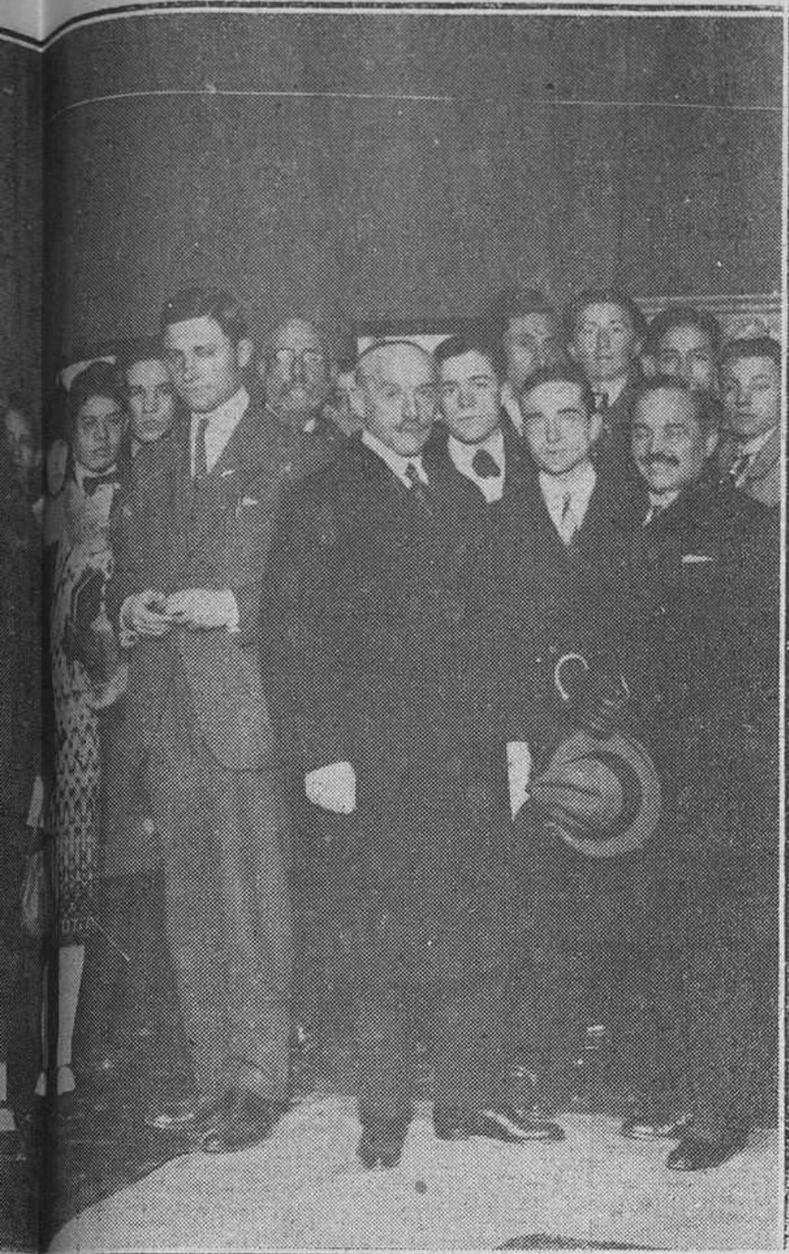
Los pensionados en la Alhambra.