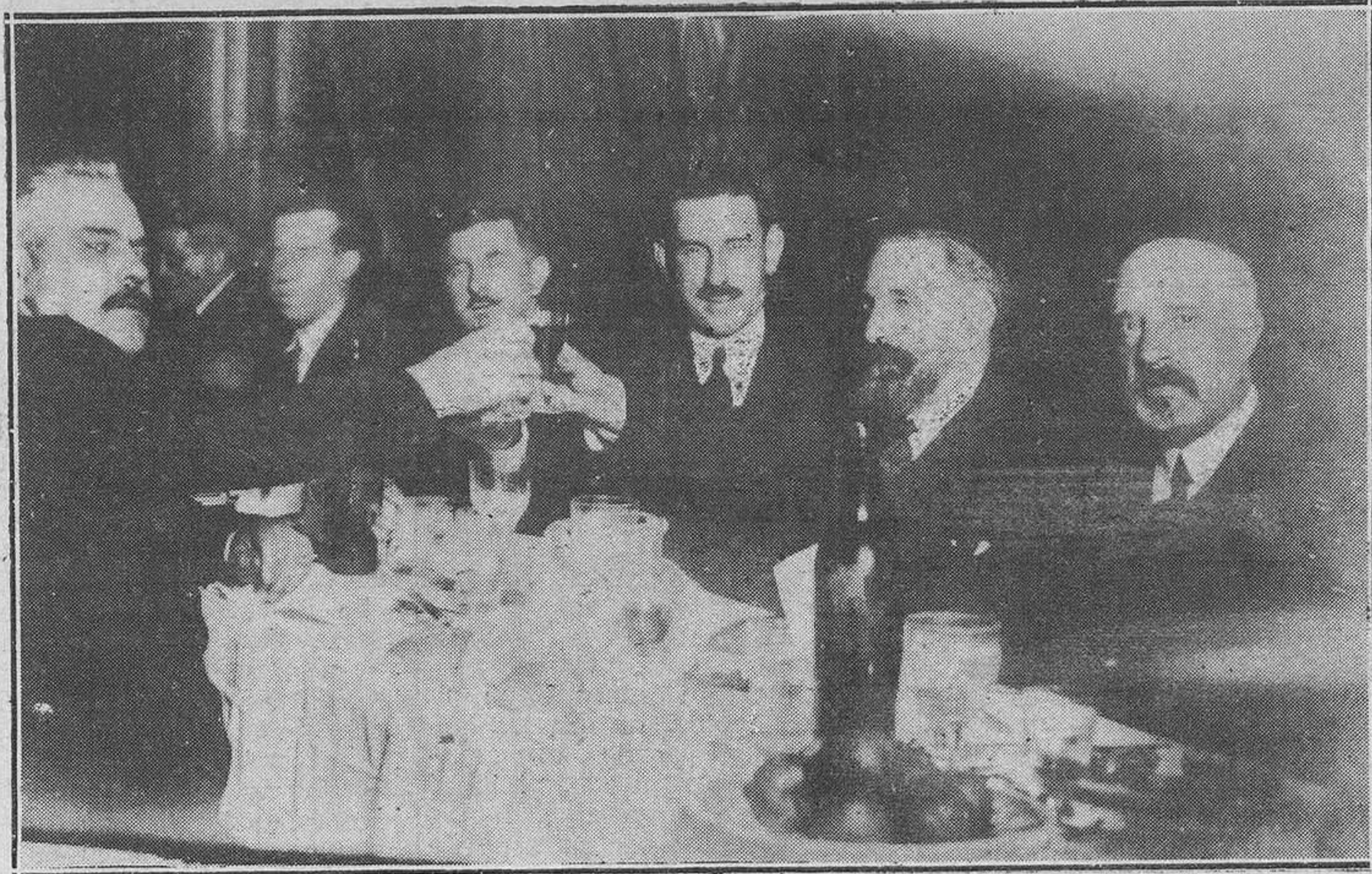
OVIEDO; EL BANQUETE DE LOS FERROVIARIOS.-Un grupo de comensales.

Se ofrece de lleno a la Asociación para trabajar por ella en cuanto esté al alcance de sus fuerzas. Cree que hoy es la Asociación más fuerte y por eso la admira y desea para ella grandes prosperidades.