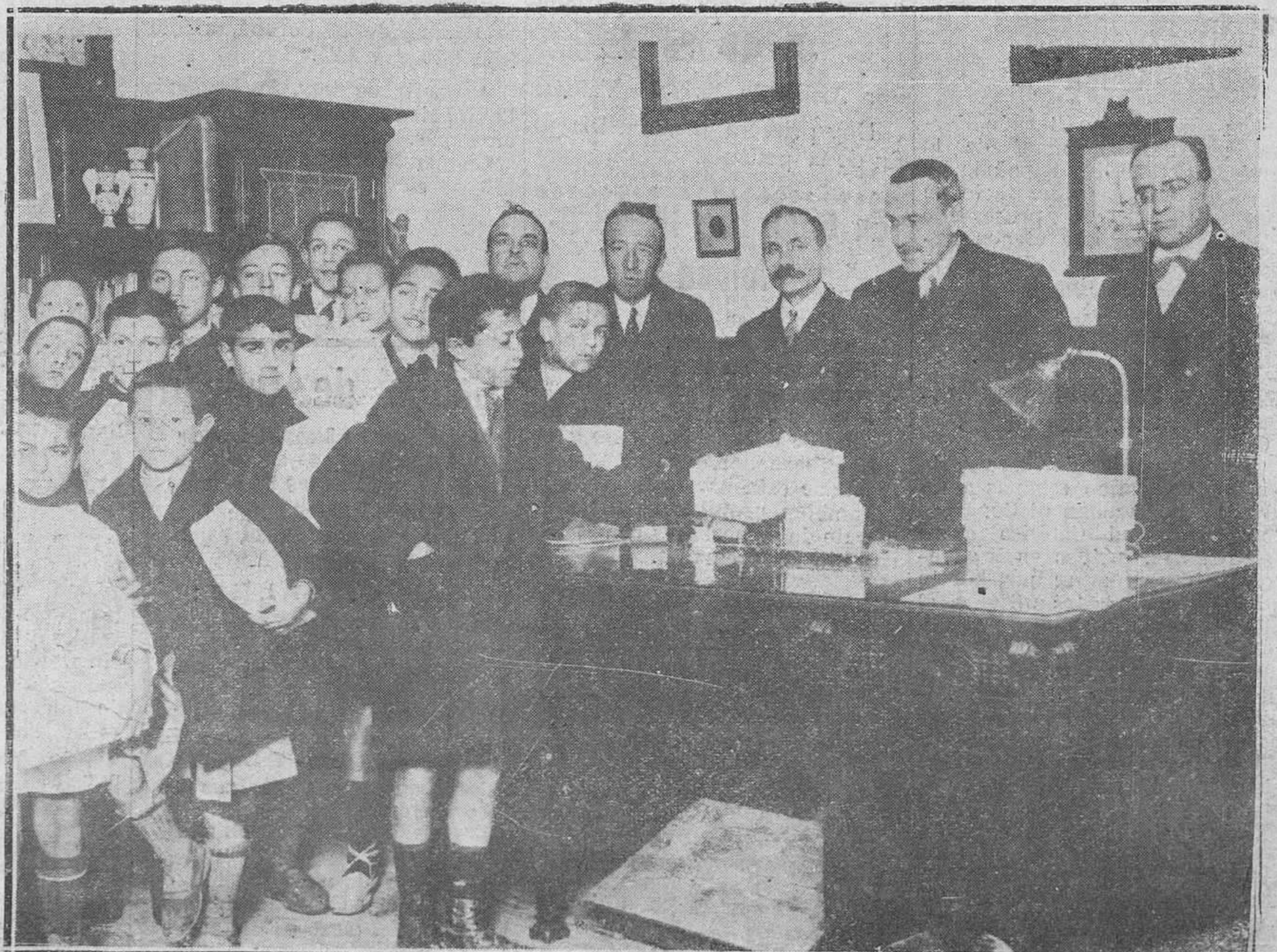
11A RID.-Reparto de cazado a los huérfanos, en la Escuela Graduada de la Florida.