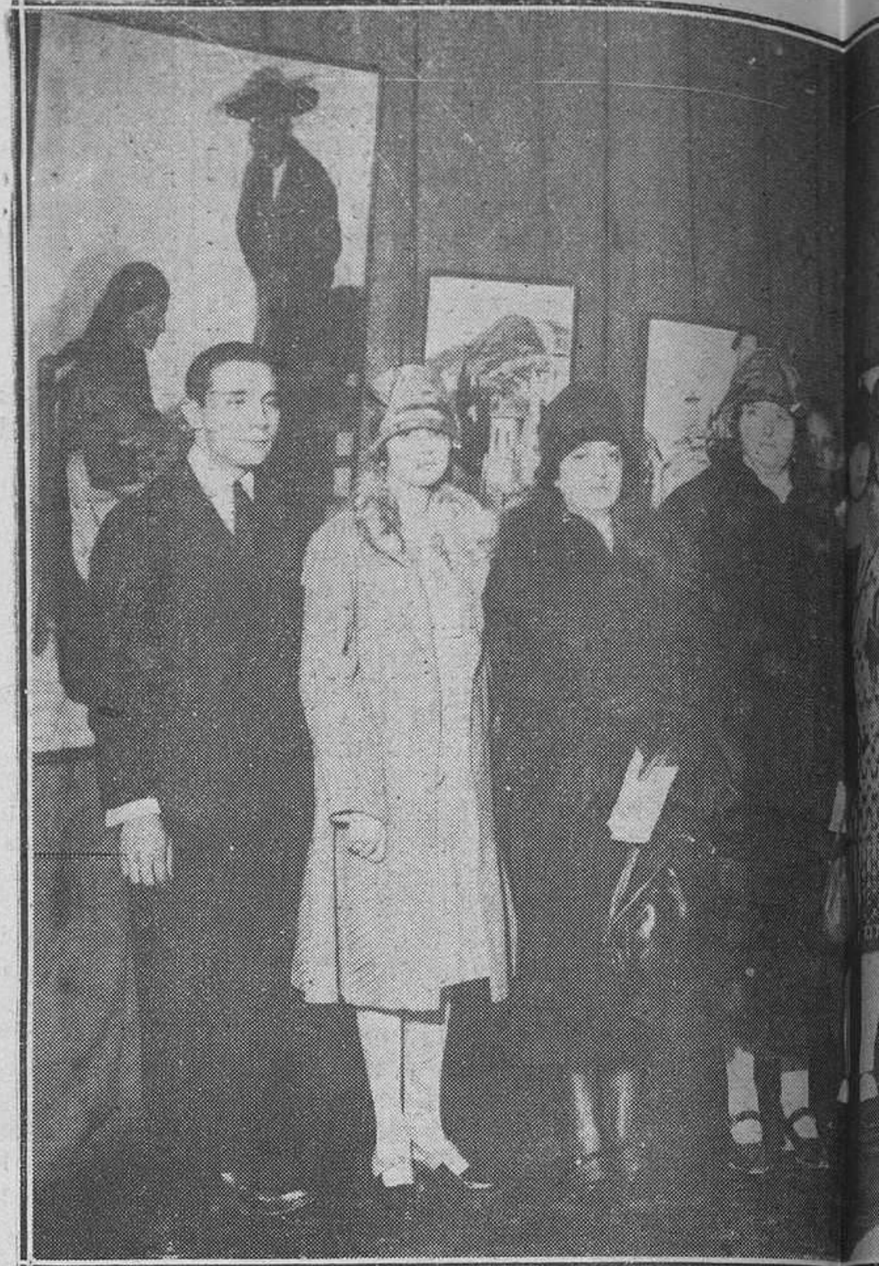
MACRID. Inauguración de la Exposición de cuadros