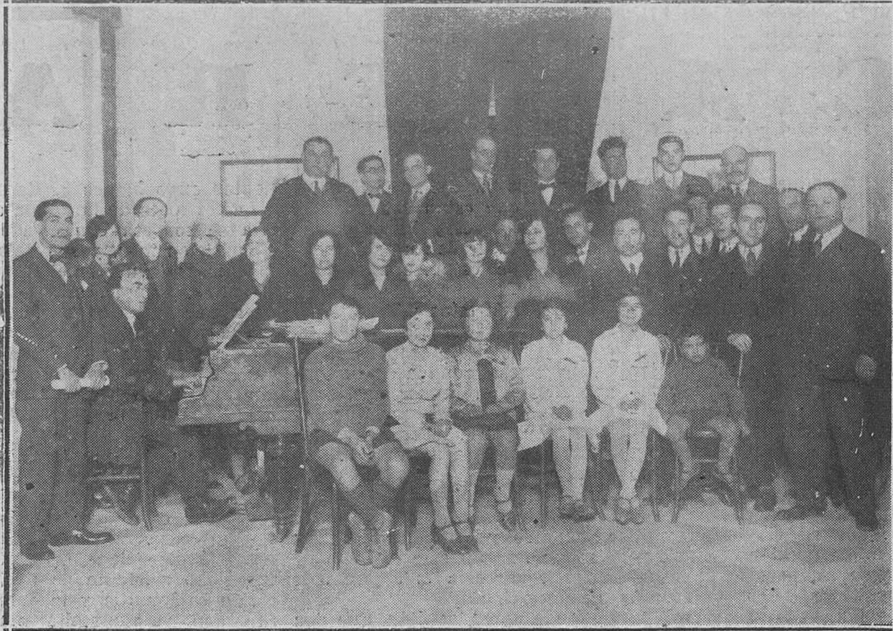
MADRID. El Correo del "Casal Catalá" durante un ensayo dirigido por el maestro Ribera.