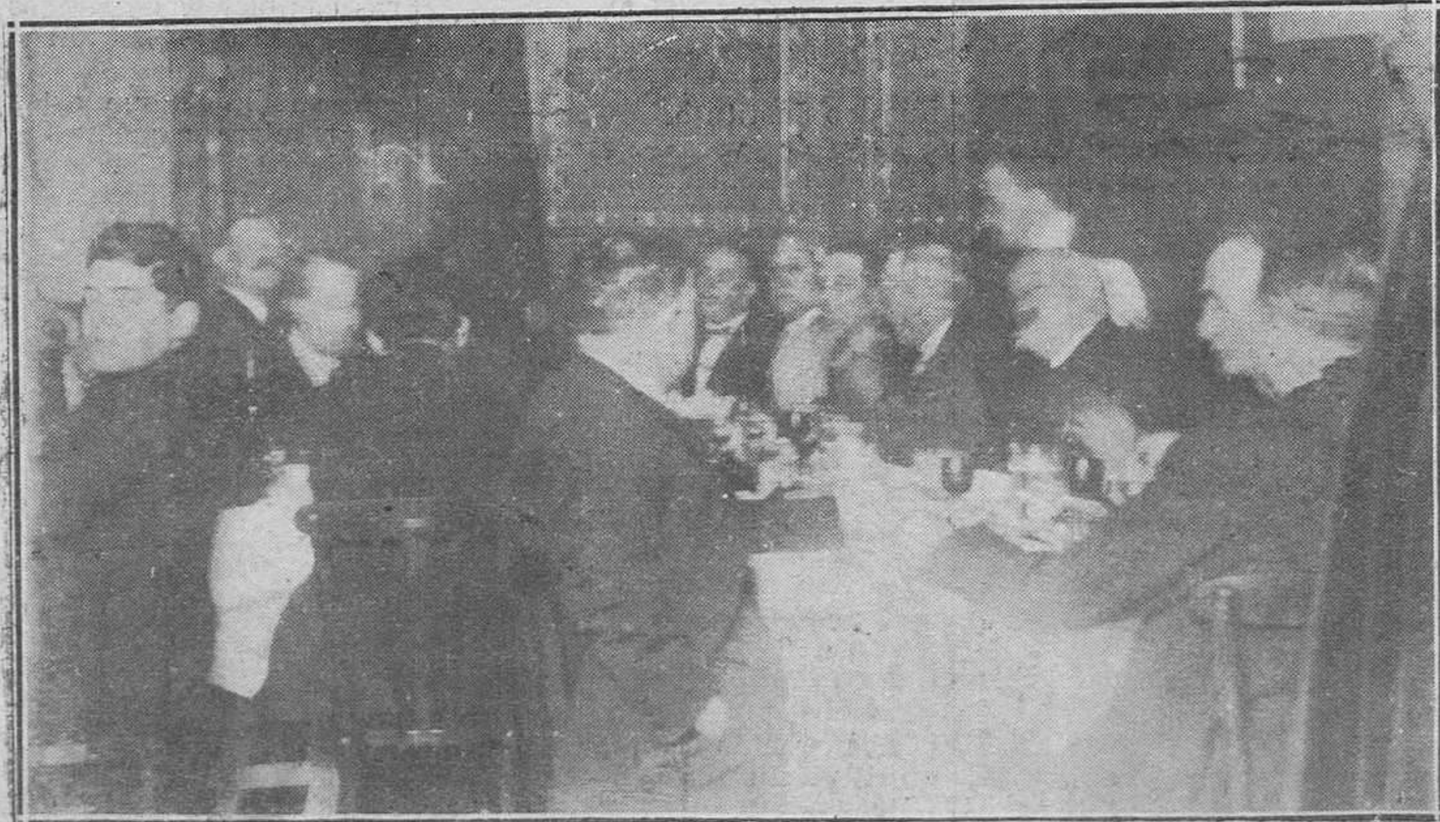
OVIEDO; EL BANQUETE DE LOS FERROVIARIOS.-La presidencia del acto.