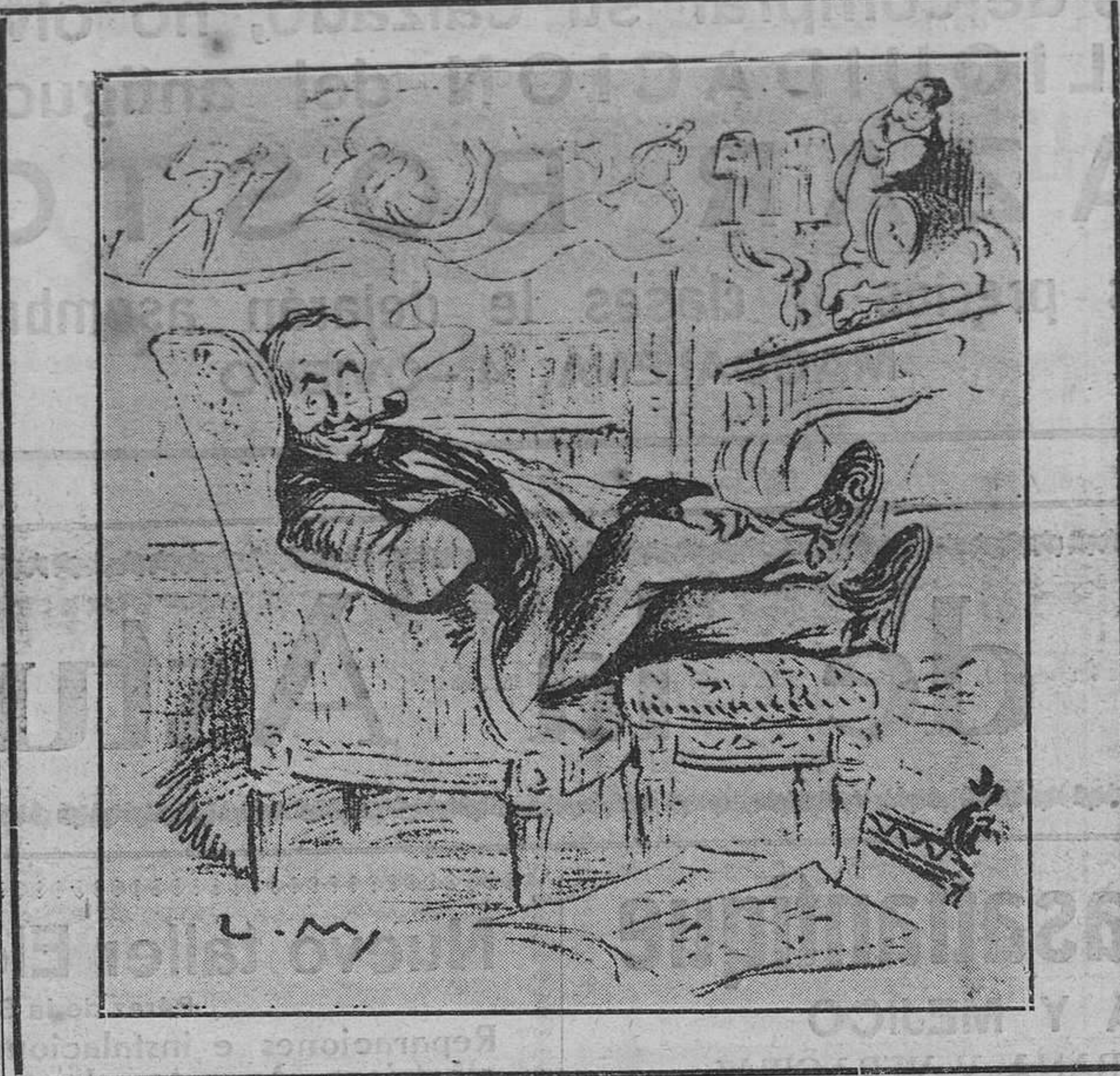
—Será todo lo antiguo que se quiera; pero la verdad es que no hay deporte de invierno como éste.