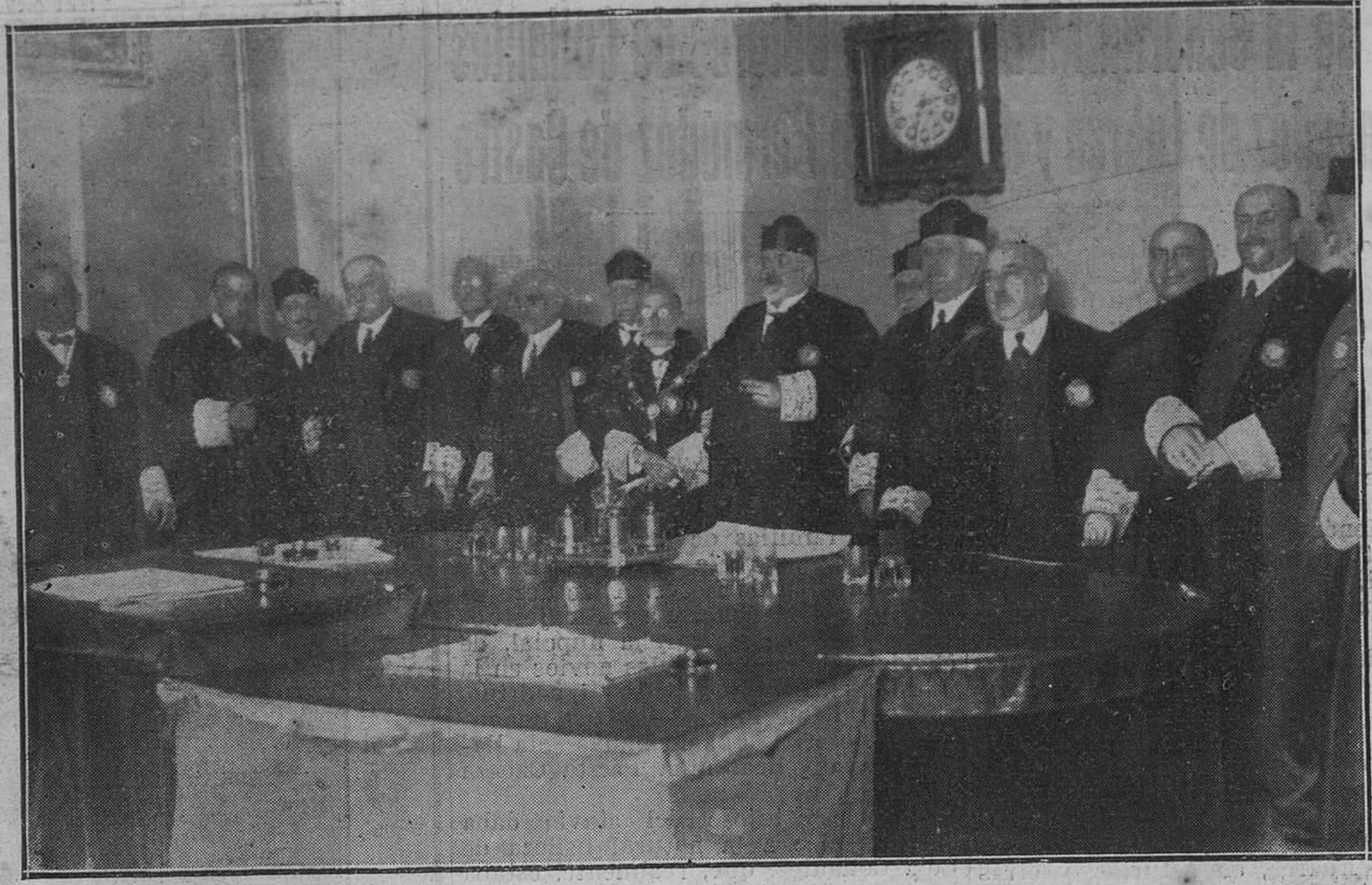
MADRID.--D. Andrés Tornos en el acto de tomar posesión de la presidencia del Tribunal Supremo.

Consomé diplomático, huevos nacionales, lubinas a la sultana, escalopes de ternera mariscal, jamón a la inglesa, helado Tosca, biscuit mussolina.