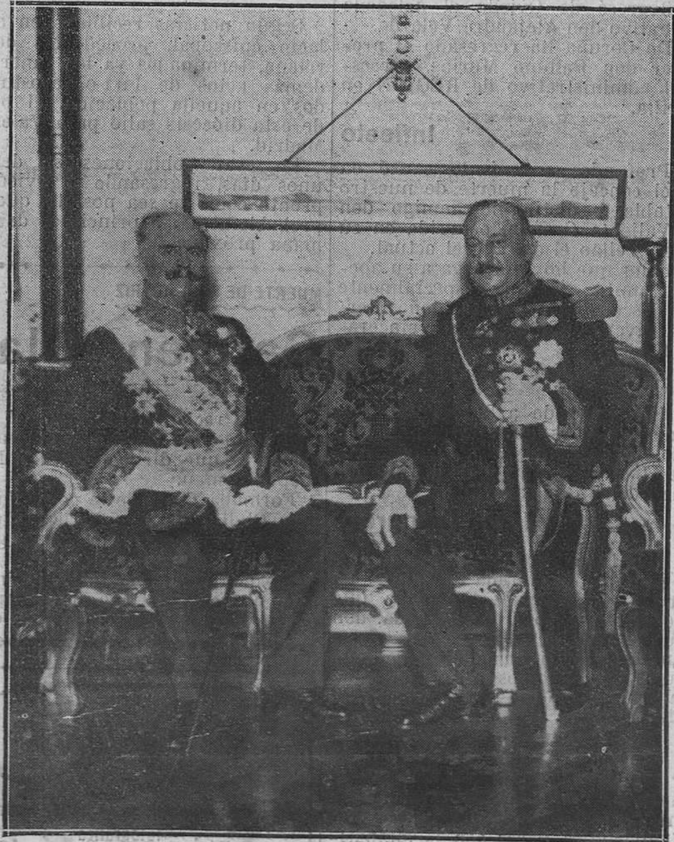
MADRID.—El nuevo embajador de Francia, vizconde de Fontenay, en su primera visita oficial al presidente del Directorio, general Primo de Rivera.

No hay cosa más necia que imitar a otro. No hay cosa más segura para alcanzar personalidad que parecerse siempre uno a sí mismo.