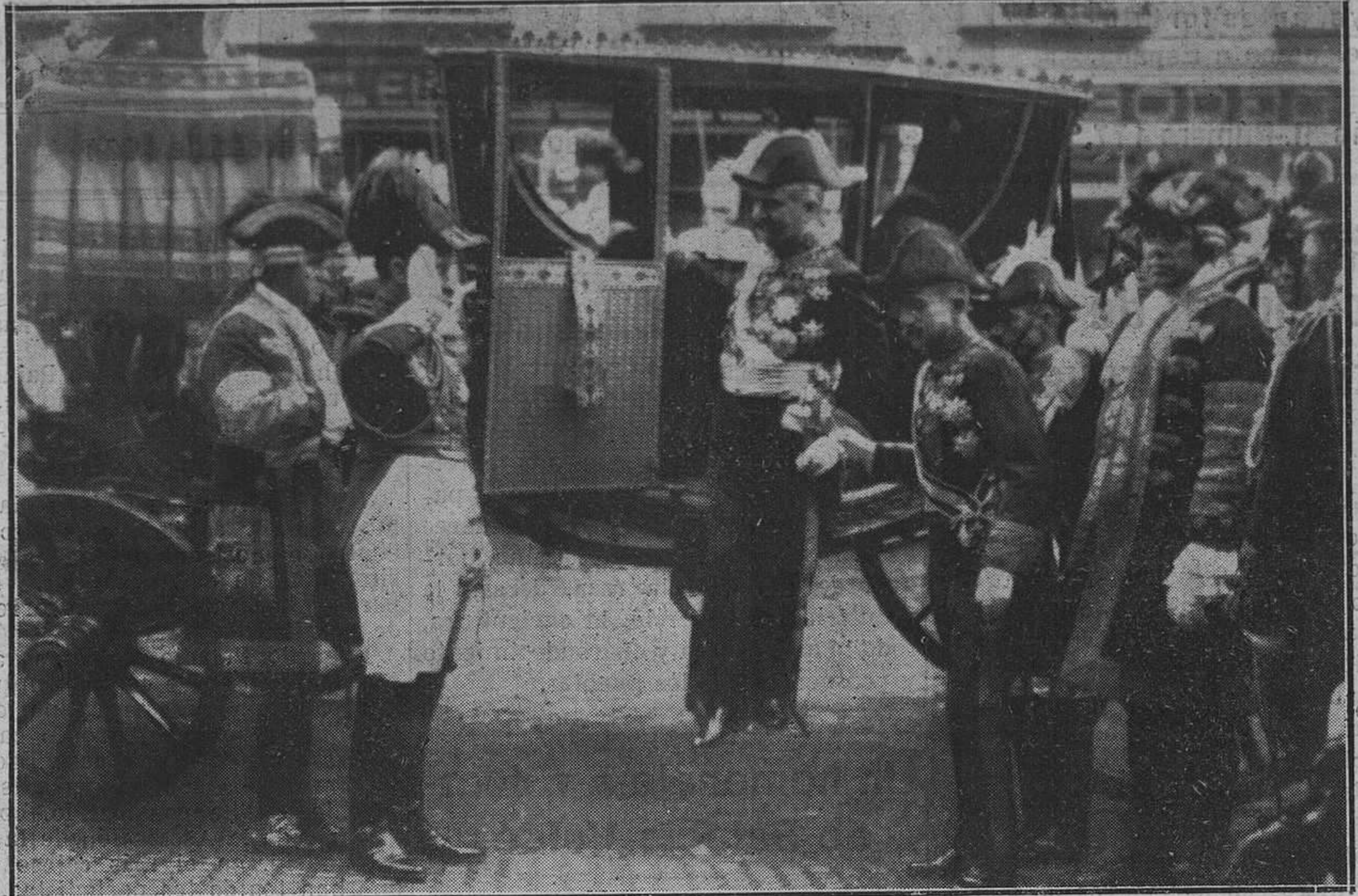
MADRID.--El nuevo embajador de Francia, vizconde de Fontenay, al regresar a la Embajada, después de la presentación de sus cartas credenciales al Rey.

Pídanse presupuestos REGION - Apartado 42 - Oviedo