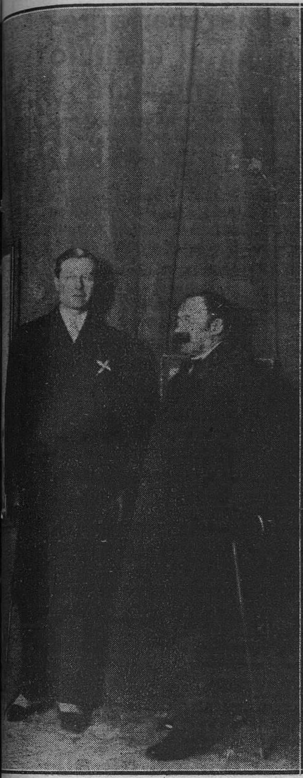
El príncipe Constantino de Hohenzollern (x) acompañando a D. Mariano Benlliure en la visita a su Exposición.