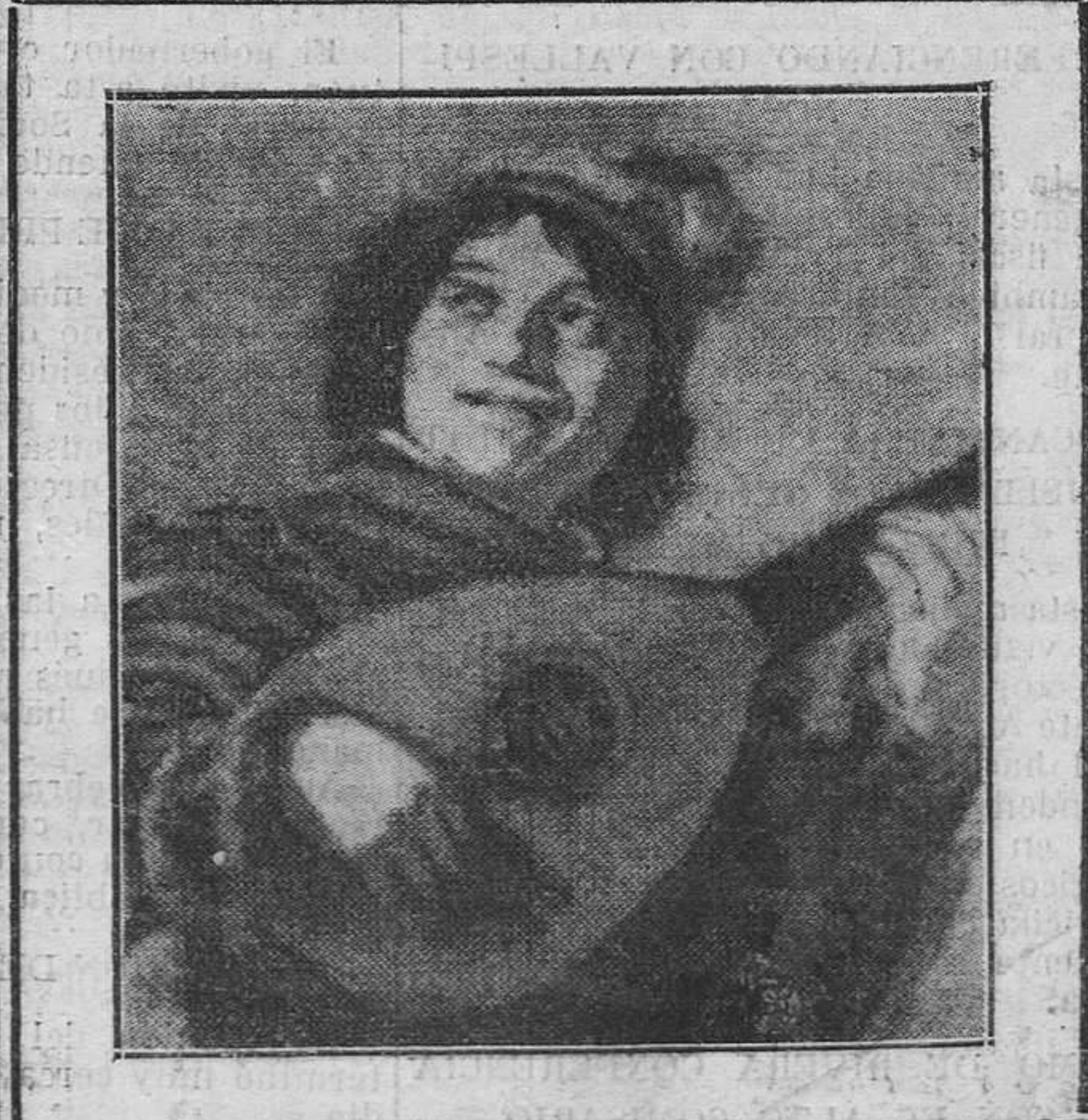
"El loco tocando la mandolina", cuadro de Franz Hals, adquirido por un millonario yanqui en la cantidad de cinco millones y medio de francos.