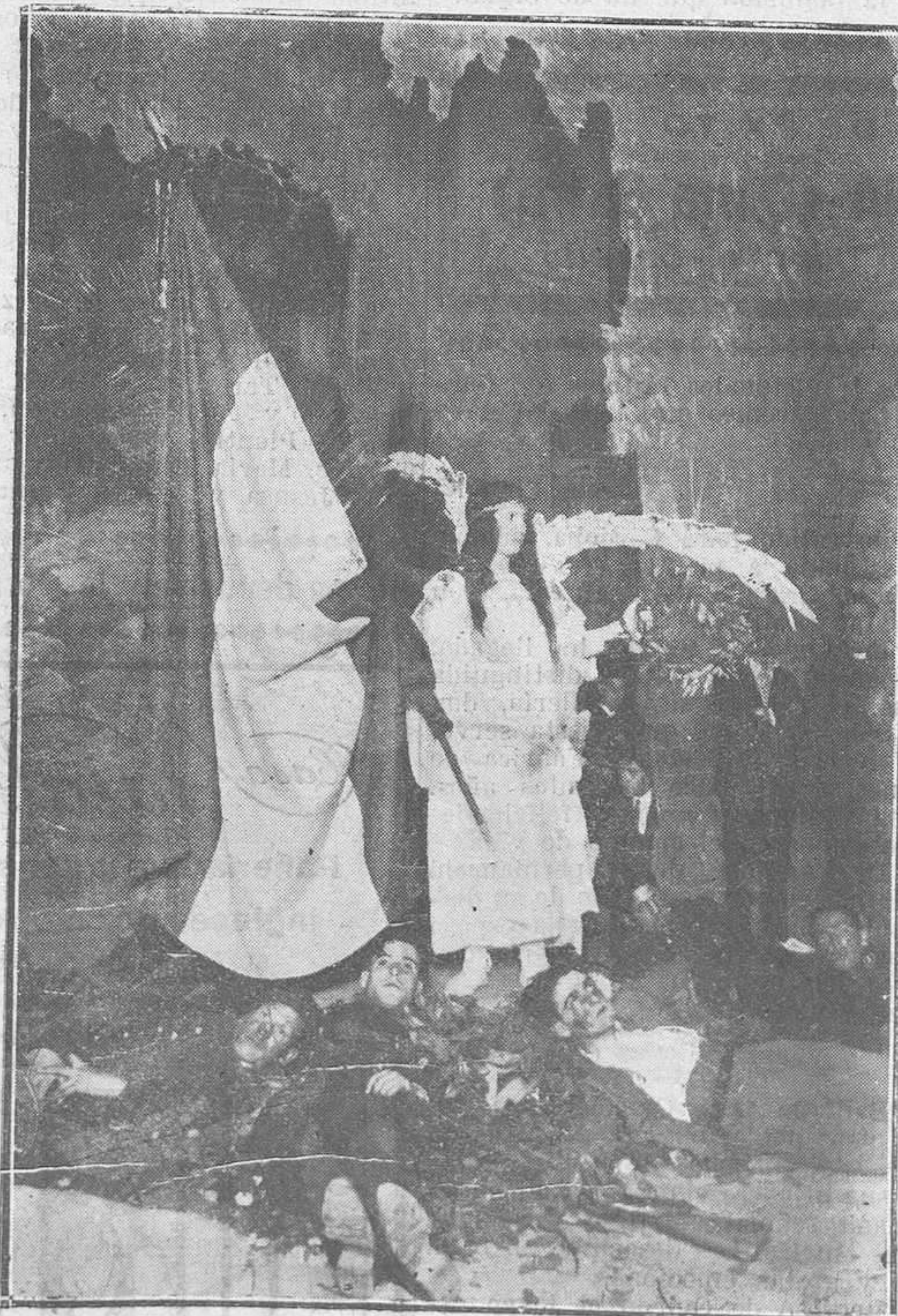
EN EL CAMPOAMOR: DE LA FIESTA DADA EL LUNES POR LAS DAMAS CATEQUISTAS.—Cuadro final de "Hogar y Patria".

Hay muchas clases de estafadores. Algunos de éstos andan sueltos, y alternan con las personas decentes: son los que dejan incumplida su palabra, cuando pueden burlar la ley. Si los conoces, no les concedas la misma estimación que a los hombres honrados.