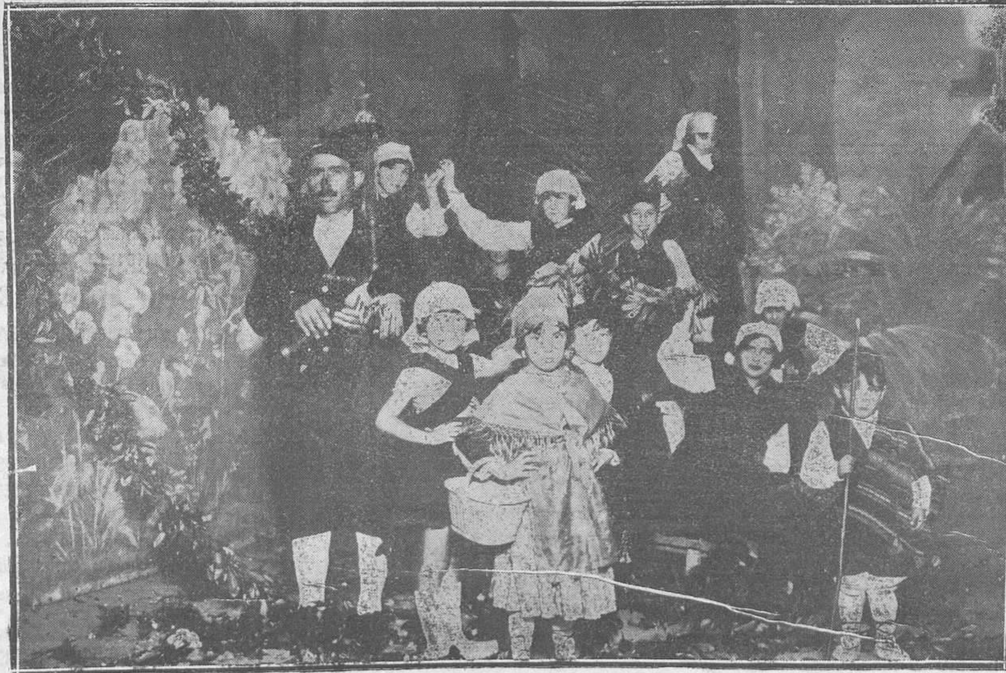
EN EL CAMPOAMOR.—Cuadro plástico "La Tierrina", que se presentó en el festival organizado el lunes.

La ponencia nombrada en la Asamblea del 11 de mayo terminó los estudios a ella encomendados y convoca a nueva Asamblea para el 15 del actual en el salón de la Diputación.