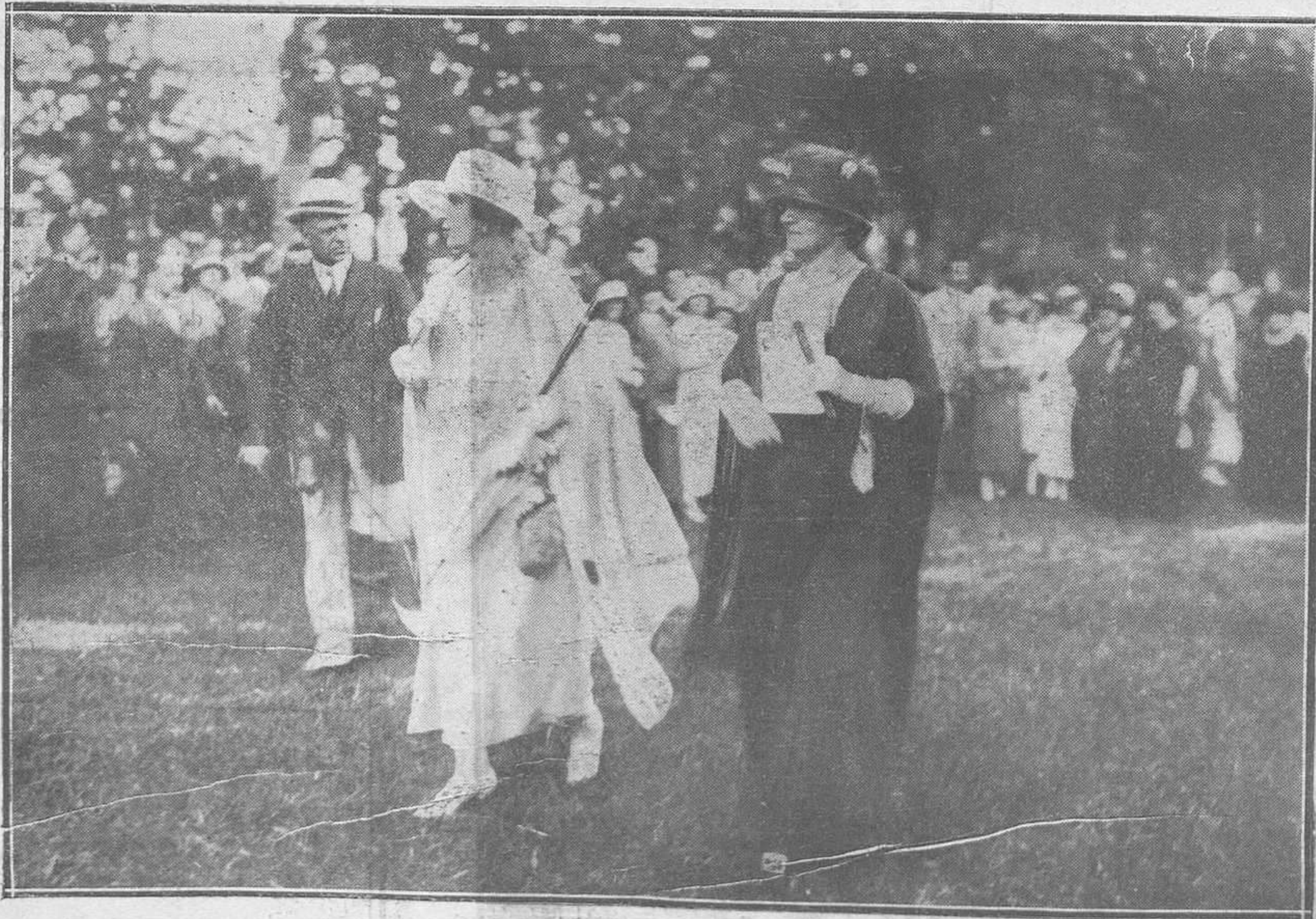
ARANJUEZ: EN EL HIPÓDROMO.--Las Reinas de España e Italia paseando por el "Stand".

Nos congratulamos de la aparición de "Avilés Gráfico" al que deseamos una larga y próspera vida, y enviamos a sus fundadores nuestra enhorabuena, que hacemos particularmente extensiva a nuestro querido amigo el inspirado poeta "Lumen", a cuyo cargo está la Dirección.