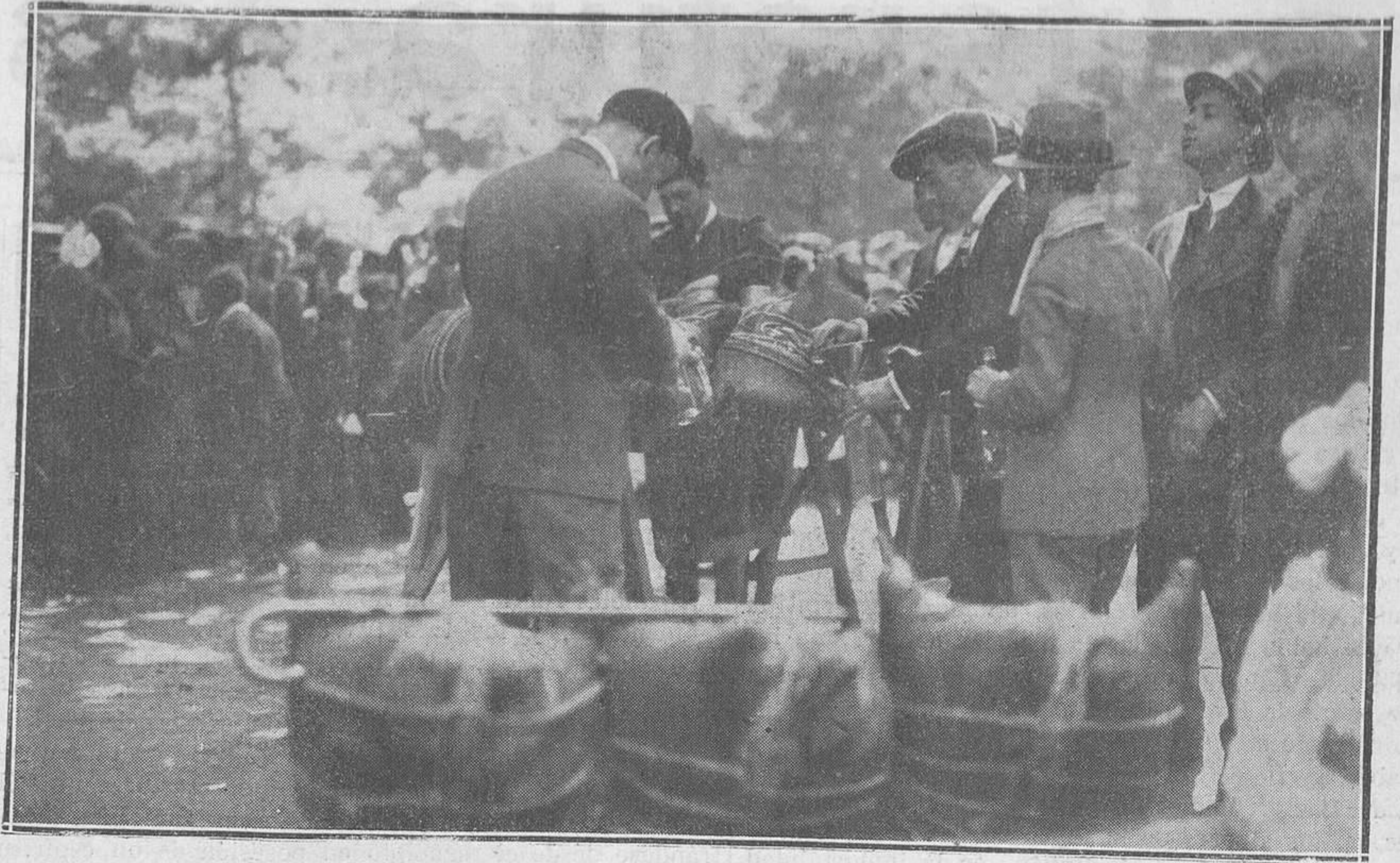
LA BALESQLIDA.--Un detalle del reparto del bollo y del vino, efectuado ayer en el Campo de San Francisco.