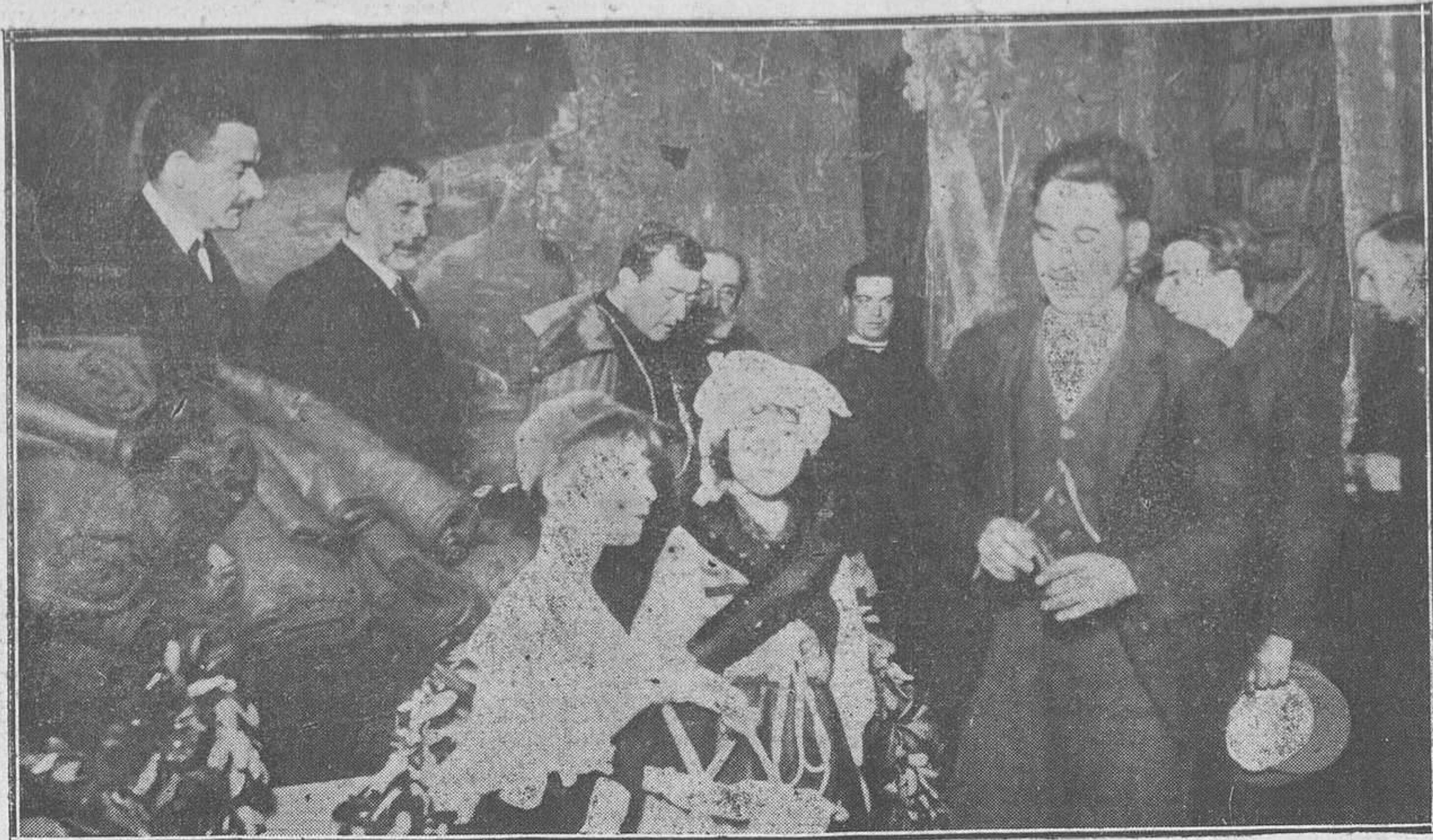
EN EL CAMPOAMOR.—El señor Obispo y las autoridades locales durante el reparto de premios hecho por las Damas Catequistas.