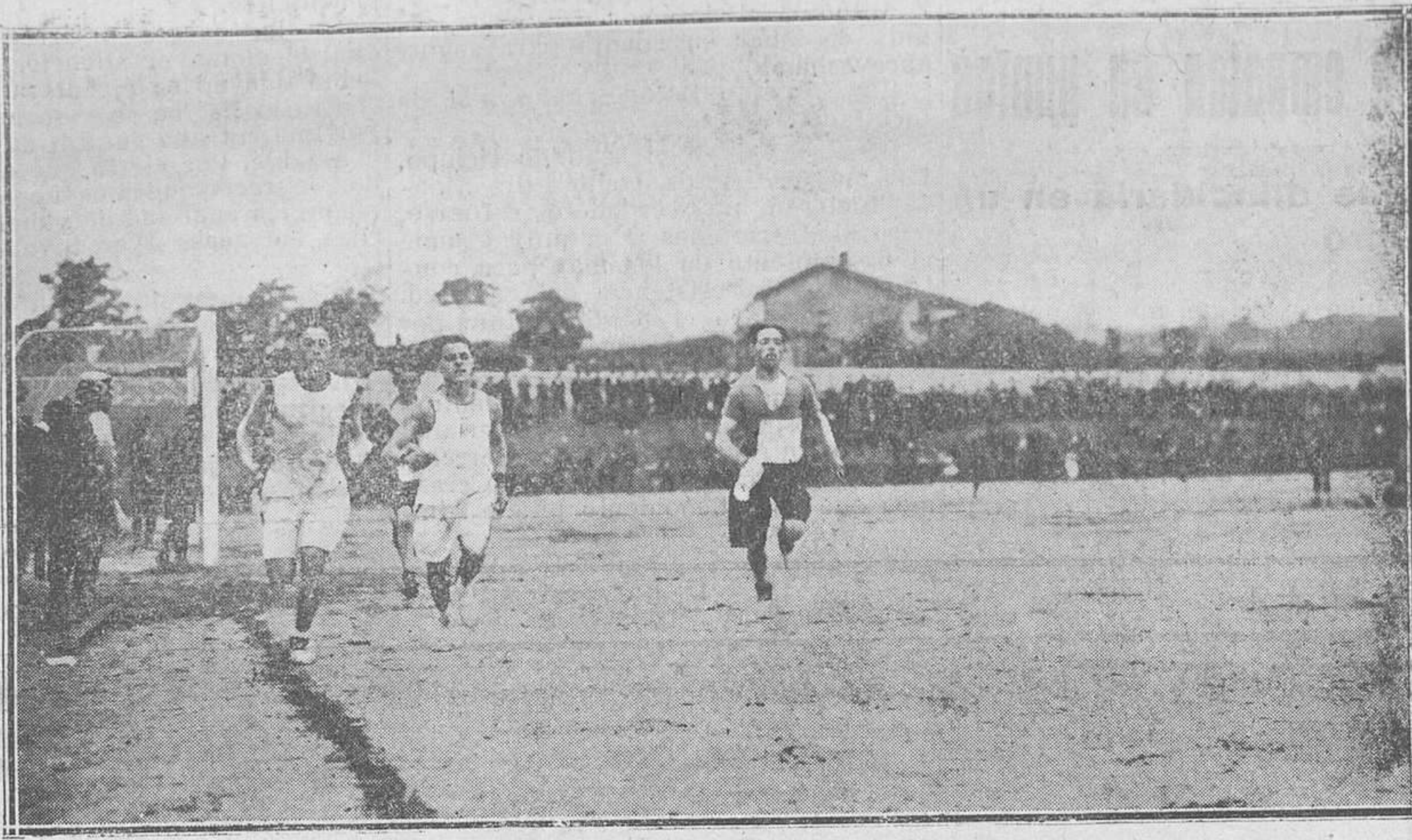
OVIEDO: CROSS ATHLETIC.--El pelotón de cabeza, llegando a la meta

El detenido es fogonero en la citada Empresa, y actualmente se encuentra en huelga.