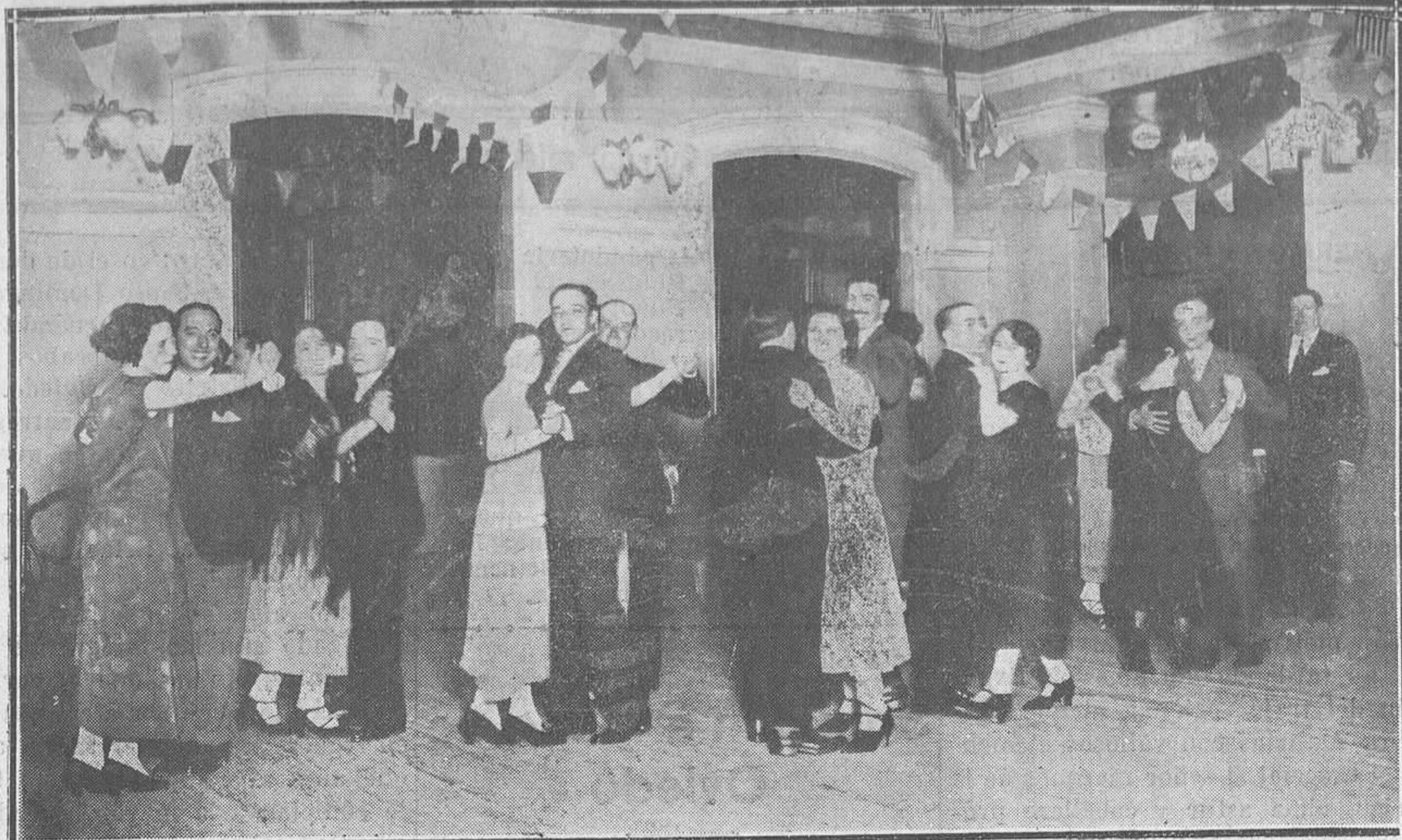
EN EL CASINO.--Aspecto que ofrecía el salón principal durante la fiesta dada la noche del lunes.