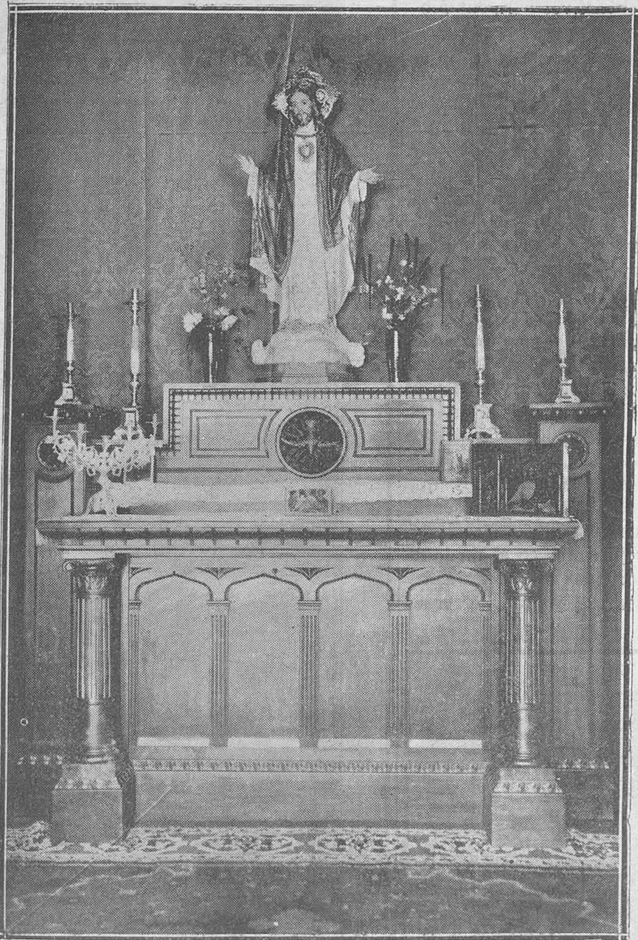
Modelo de Altar, para entronizar en casa el Sagrado Corazón de Jesús, que presenta la "Casa del Río".

Volvemos hoy a dedicar esta sección a la única que ha dado la nota semanal.