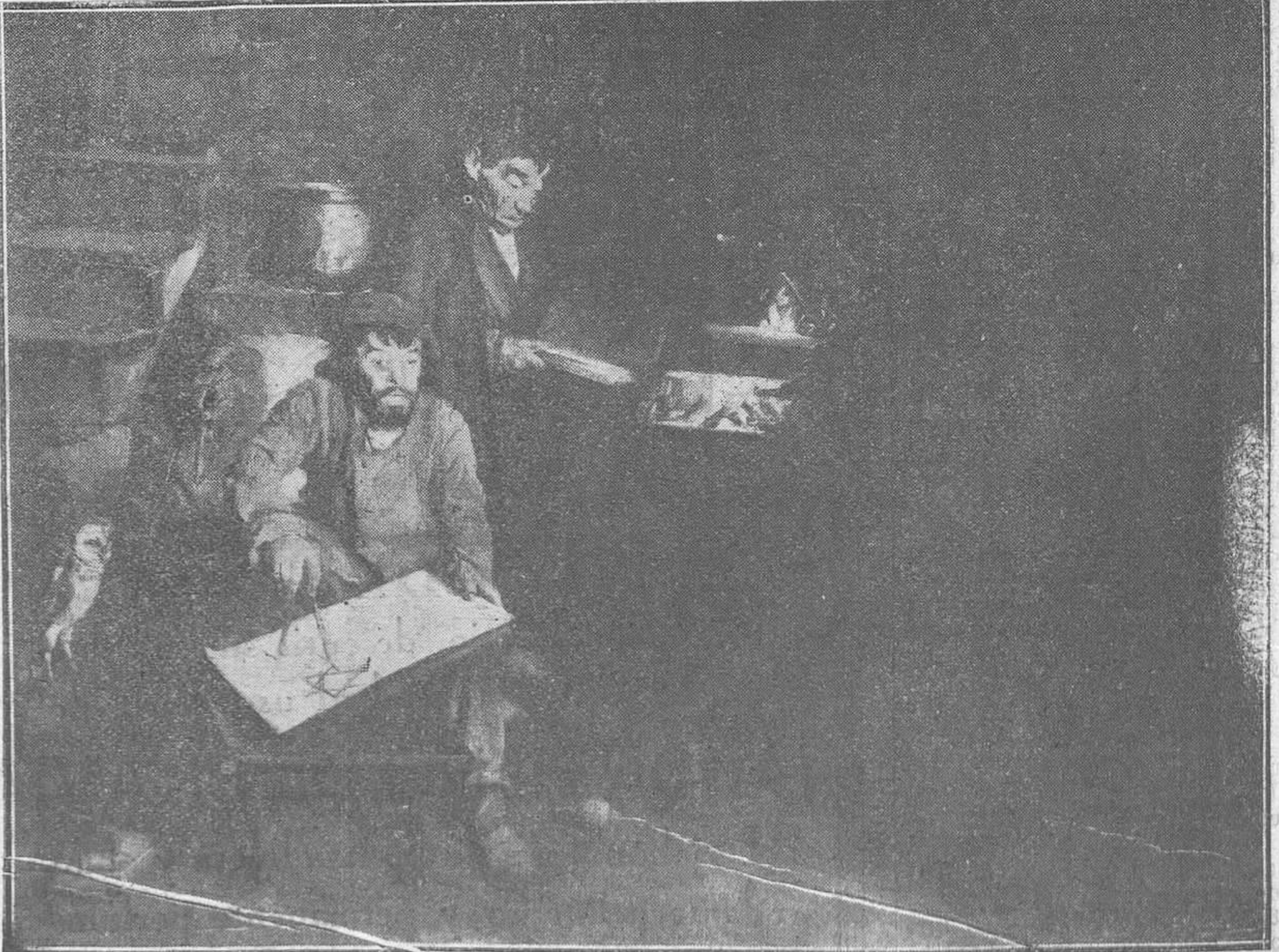
MADRID: EXPOSICIÓN NACIONAL DE BELLAS ARTES.—"Los gnomos", por Luis Menéndez Pidal.