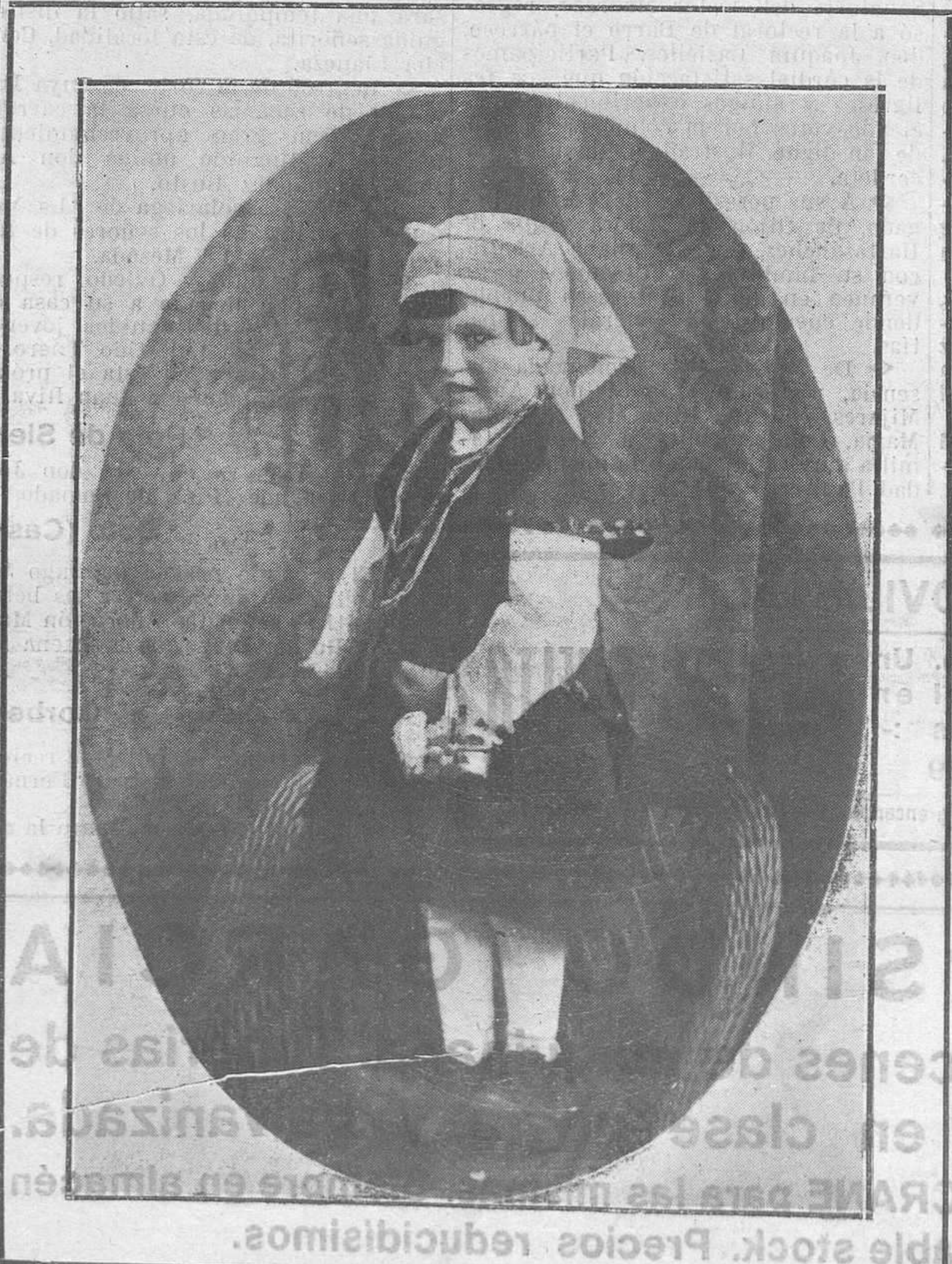
LA BELLEZA INFANTIL ASTURIANA: POLA DE LAVIANA.—Hermosa niña vistiendo el típico traje del país

Por muy fino, ingenioso y simpático que sea un joven, si te consta que los vicios corren su alma, no admitas su amistad. Toda la elegancia, la gallardía, el donaire, la gentileza y cortesía con que se presenta en sociedad, no deben hacerte olvidar que esa desgraciado tiene el corazón podrido.