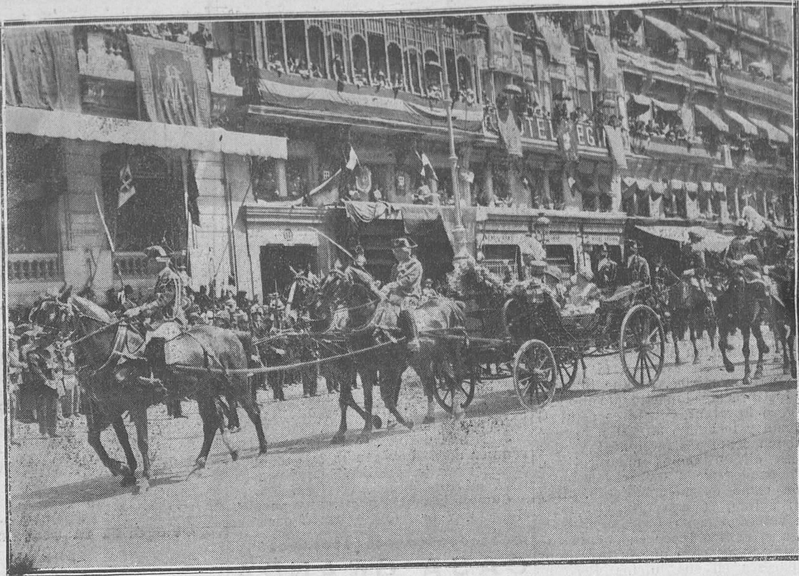
LA LLEGADA DE LOS REYES DE ITALIA A MADRID.—El coche de las Reinas y de los príncipes herederos.