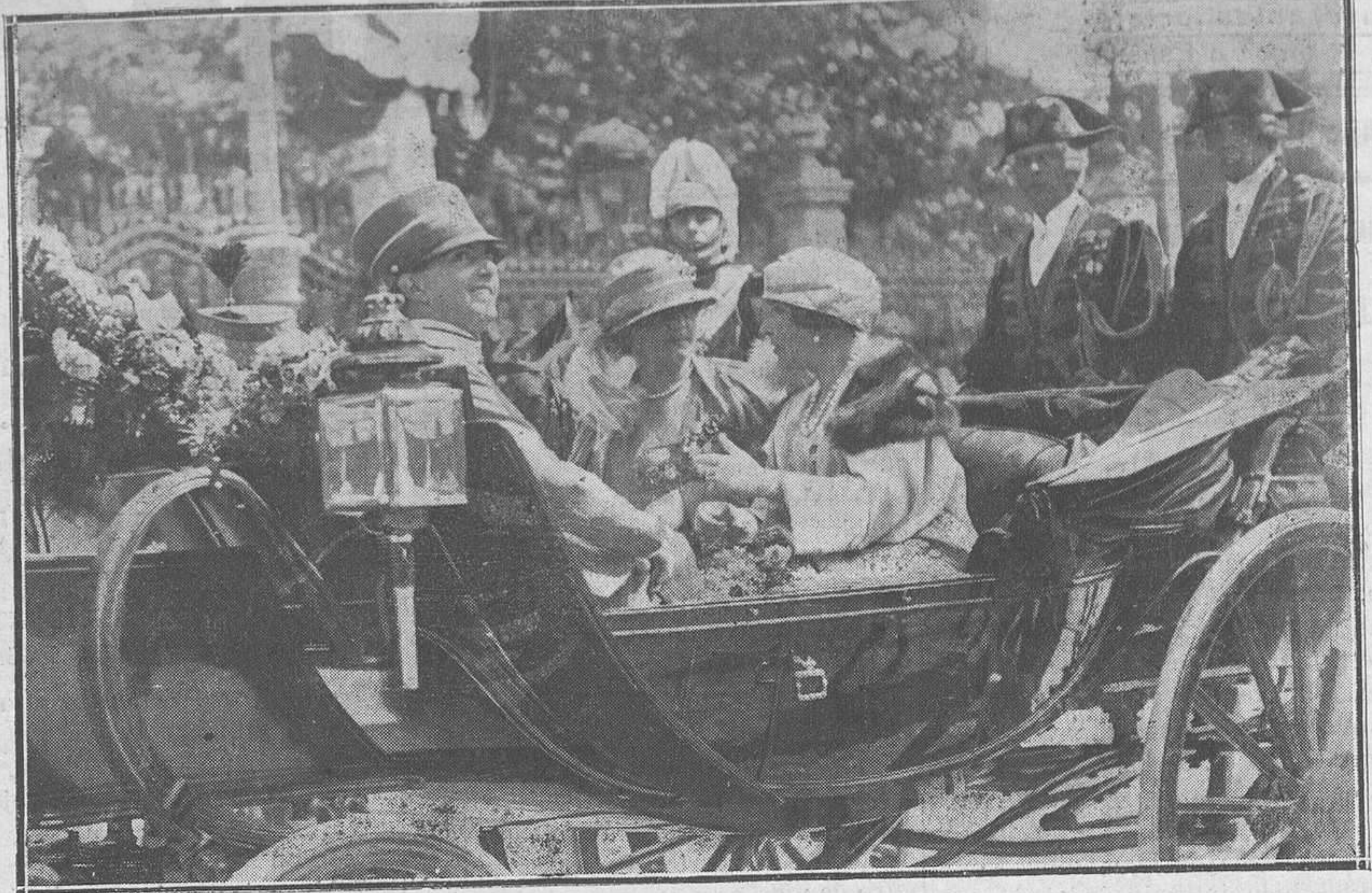
LA LLEGADA DE LOS REYES DE ITALIA A MADRID.—El coche que conduce a las dos Reinas y a los príncipes herederos, al pasar por la calle de Atocha.

◇ Con unas lucidas notas aprobó el tercer curso de Bachillerato, el alumno del Colegio de Agustinos de Tapia,