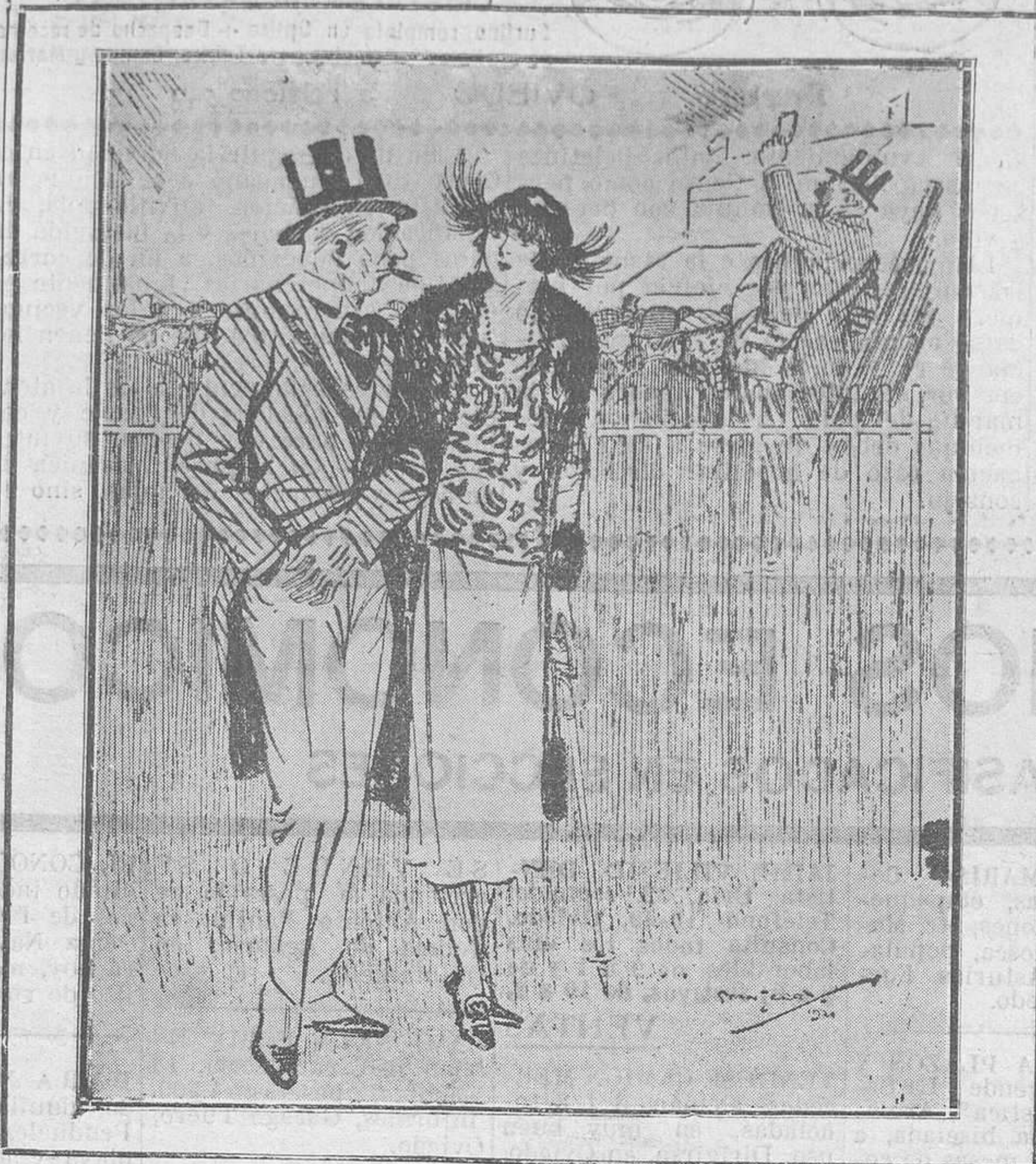
EN LAS CARRERAS

El.—Mira, déjame apostar a ese caballo. Tengo seguridad de que he de ganar, y además, te prometo que será la última vez que juego.