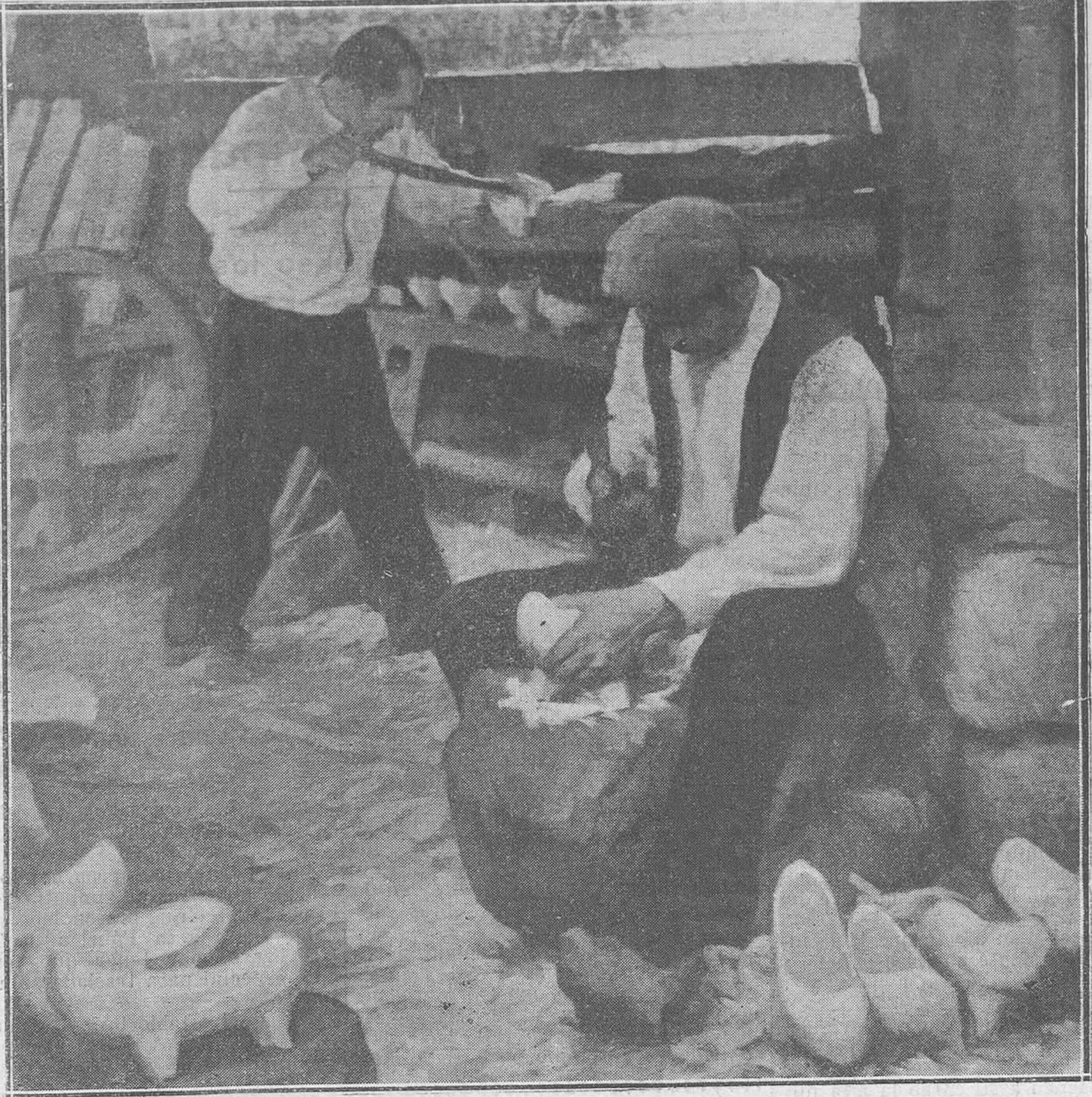
MADRID: EXPOSICIÓN NACIONAL DE BELLAS ARTES.—"Madreñeros", por Zaragoza.

El notable artista valenciano Antonio Peyró, muy conocido en el Ministerio de Educación, Cultura y Deporte