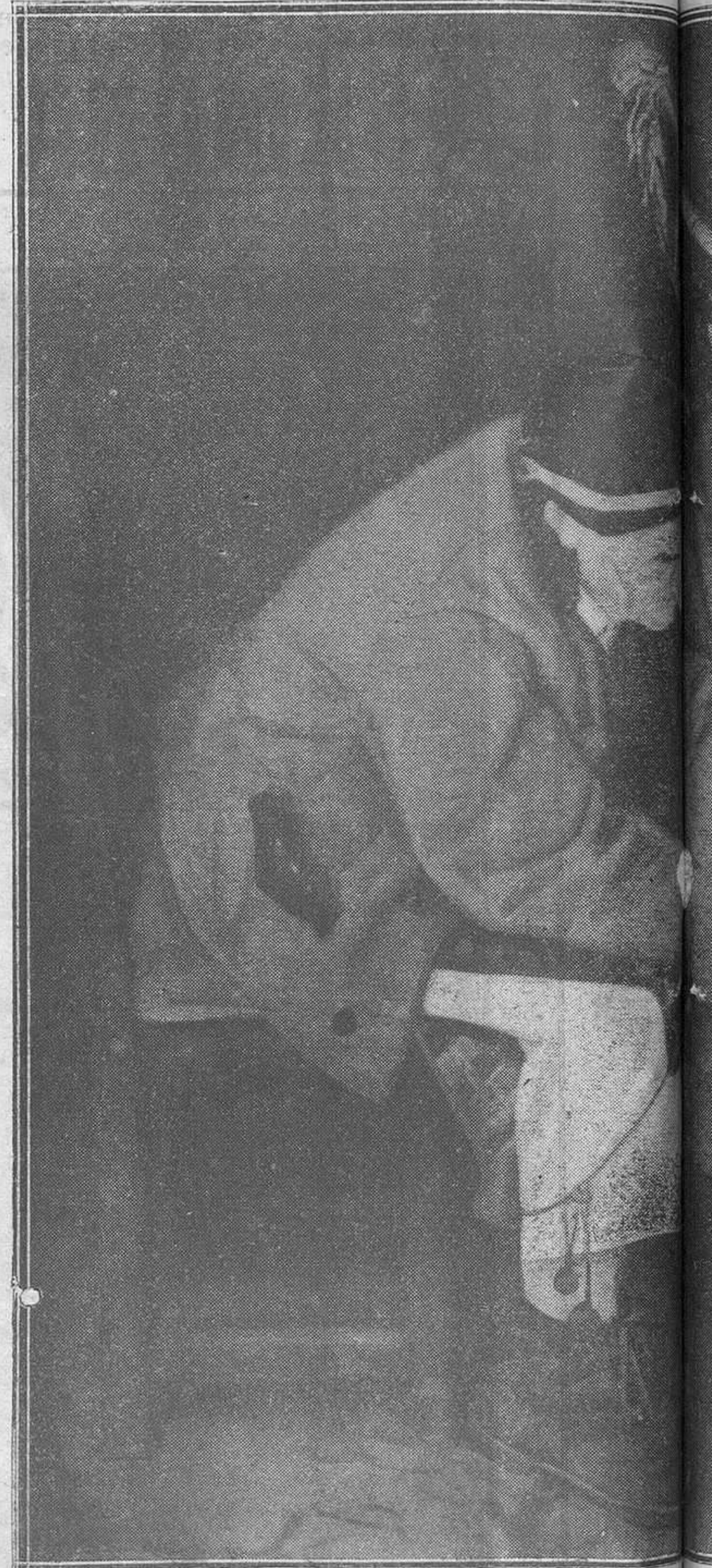
MADRID: EXPOSICIÓN NACIONAL DE BELLAS ARTES

de su aldea como podía pintar un bienaventurado las cosas del cielo. Esto, como es natural, impregna todas sus obras de un perfume tan aromático de una dulce placidez, que hace sentir al que ve sus obras anhelo de abandonar las poblaciones del vicio y del pecado y buscar en aquellos valles risueños y tranquilos, momentos de quietud y dicha. Por eso la obra de este pintor se destaca de la mayoría de los que concurren a la Exposición. Piñole debe vivir siempre en la aldea y pintar mucho, porque su obra es sana, es un calmante para las almas inquietas. Sería doloroso que, por querer saber más, perdiera esa hermosa senda que dentro del arte ha sabido encontrar.