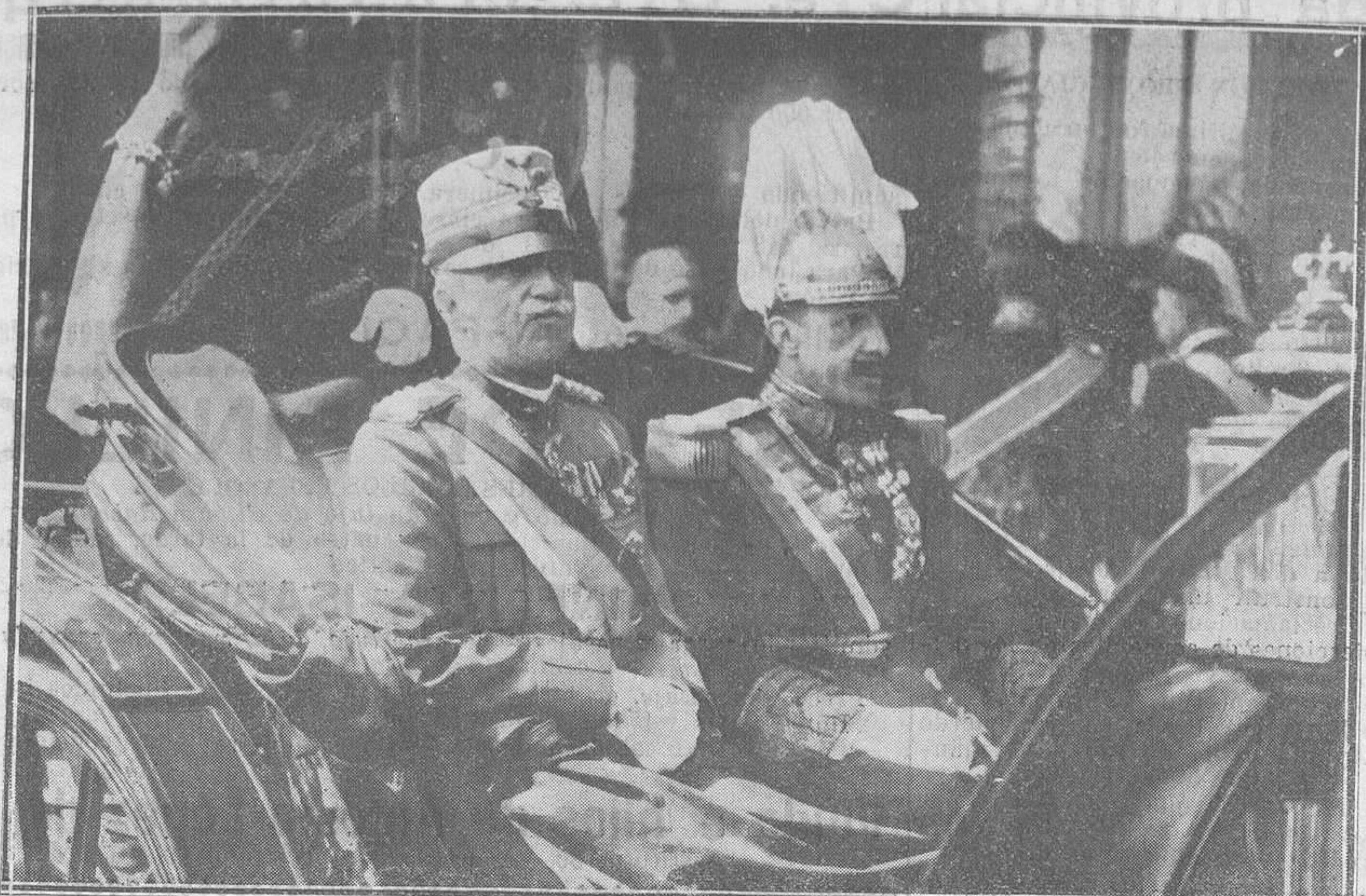
LA LLEGADA DE LOS REYES DE ITALIA A MADRID.—Los Reyes de España e Italia al salir de la estación del Mediodía.

No fiarse de corredores que digan en las estaciones que no hay habitaciones.