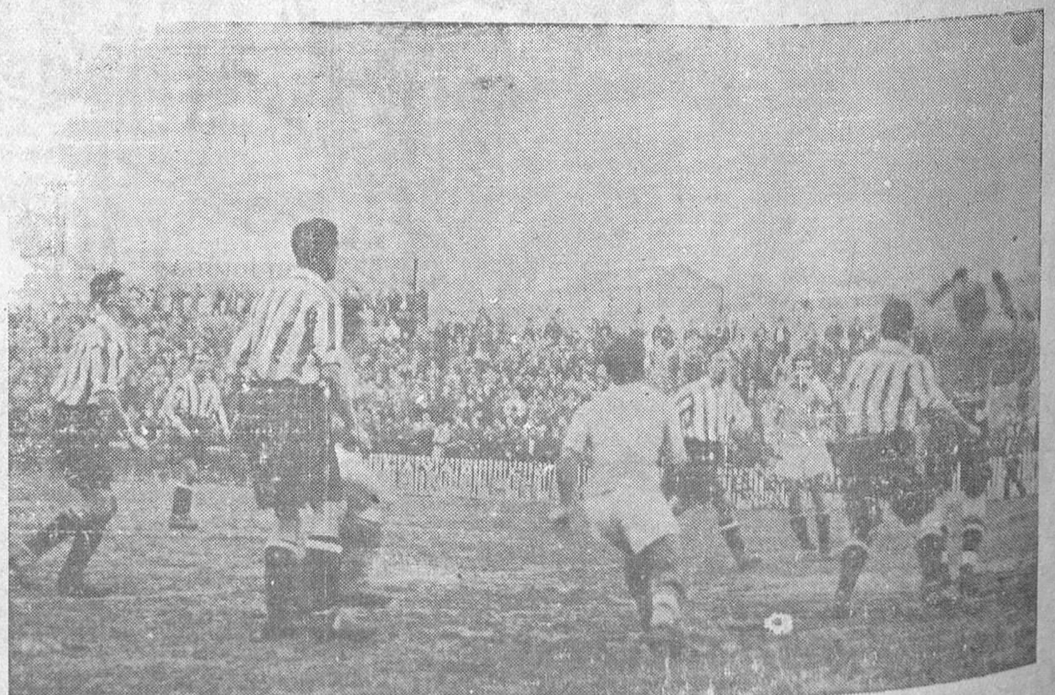
OVIEDO-ATHLETIC DE BILBAO.-Primer corner contra el Athletic, sacado por Emilín.

Administración y talleres: Foncalada, 5 Teléfono 2462 OVIEDO