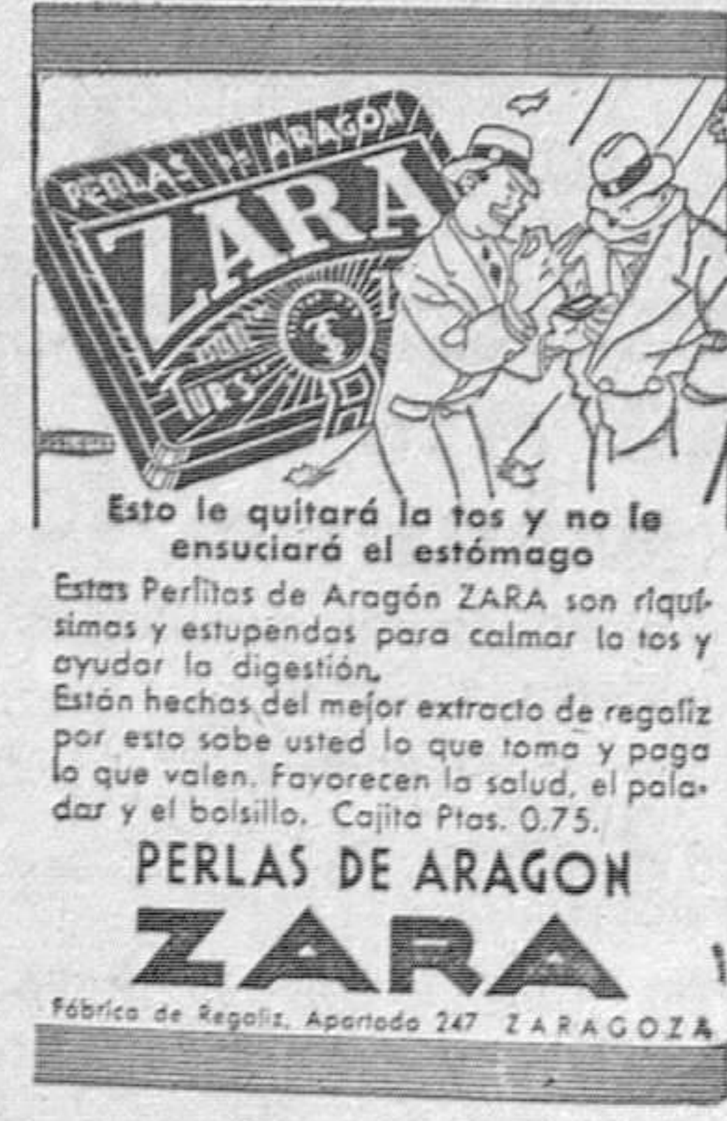
Fábrica de Regaliz, Apartado 247 ZARAGOZA

Redactarán un manifiesto dirigido al país, en el cual se enjuiciará el momento político actual.