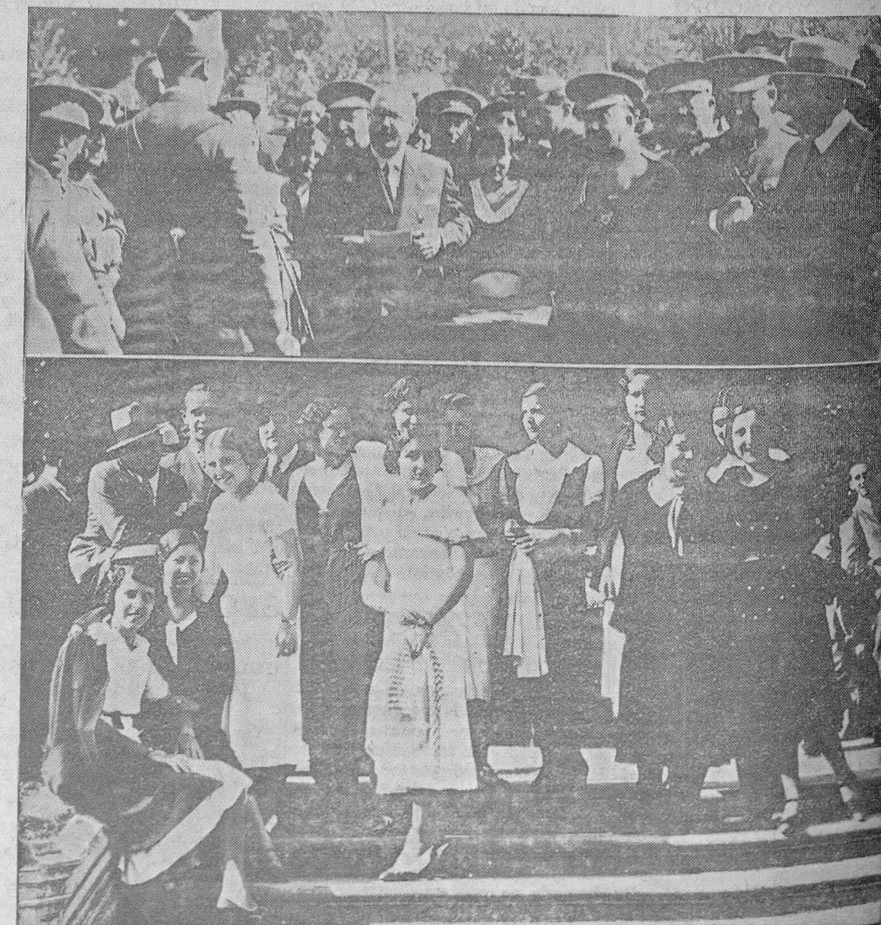
DE LOS ACTOS DE AYER EN GRADO.—Arriba; El gobernador civil, con los jefes del Ejército y representaciones, durante el reparto de premios a los soldados de mejor conducta. En la parte inferior: Un grupo de señoritas «mosconas» cuya belleza, muestra por decirlo así de las mujeres gradenses, justifica una movilización general del Ejército y el elogio de todos los paisanos.

Este cursillo, completamente gratuito, es sin duda alguna de gran interés general en esta provincia.