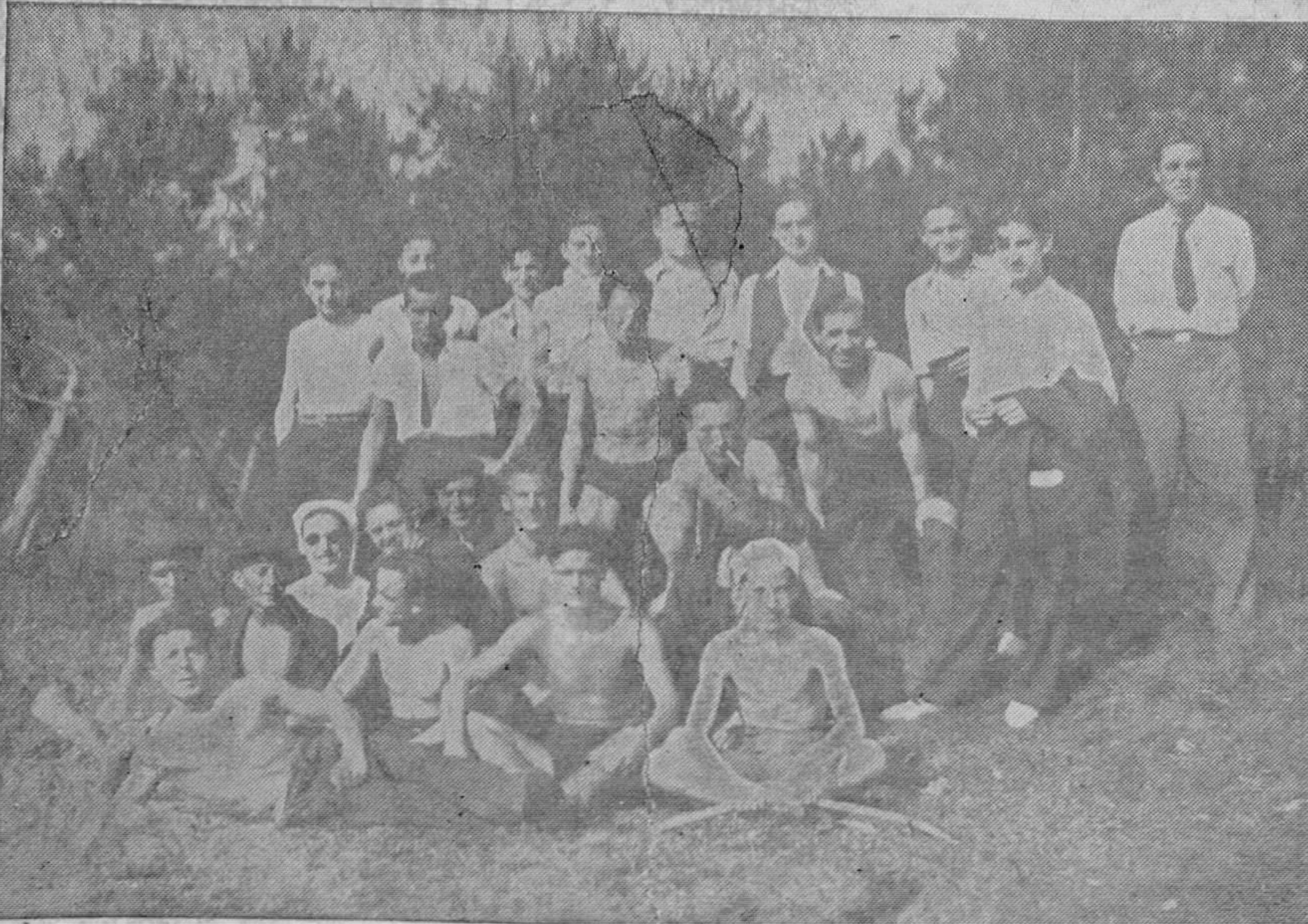
EN EL NARANCO.—Grupo de jóvenes ovetenses a quienes sorprendió el fotógrafo cuando se encontraban en uno de los pintorescos lugares de la cumbre del Naranco tomando baños de sol