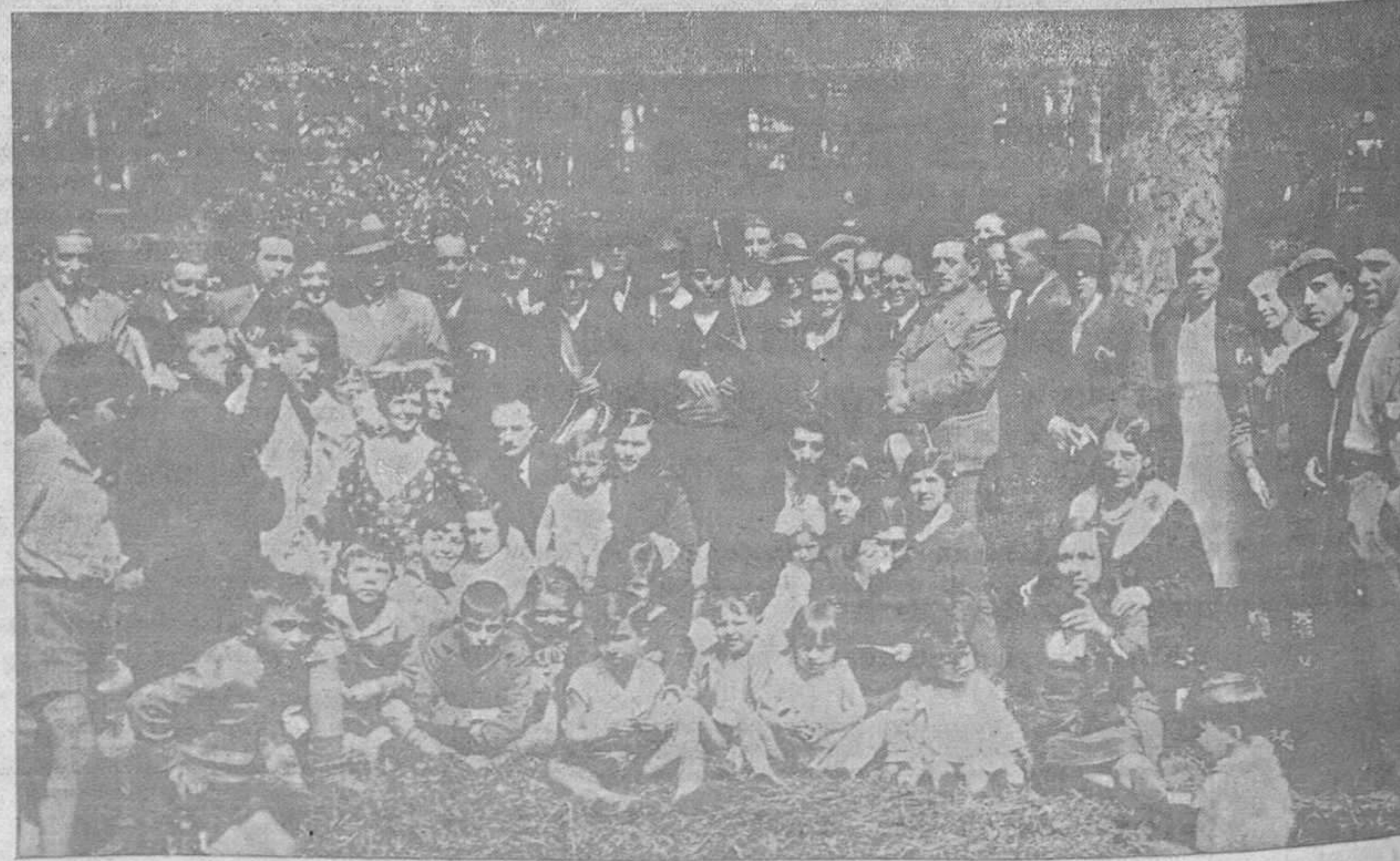
EL «MARTES DEL BOLLU».—Uno de los numerosos grupos que se formaron en el hermoso Campo de San Francisco para celebrar la clásica fiesta, de la que tan bellos recuerdos guardan los viejos ovetenses, amantes de las tradiciones de la ciudad y sus defensores más entusiastas.