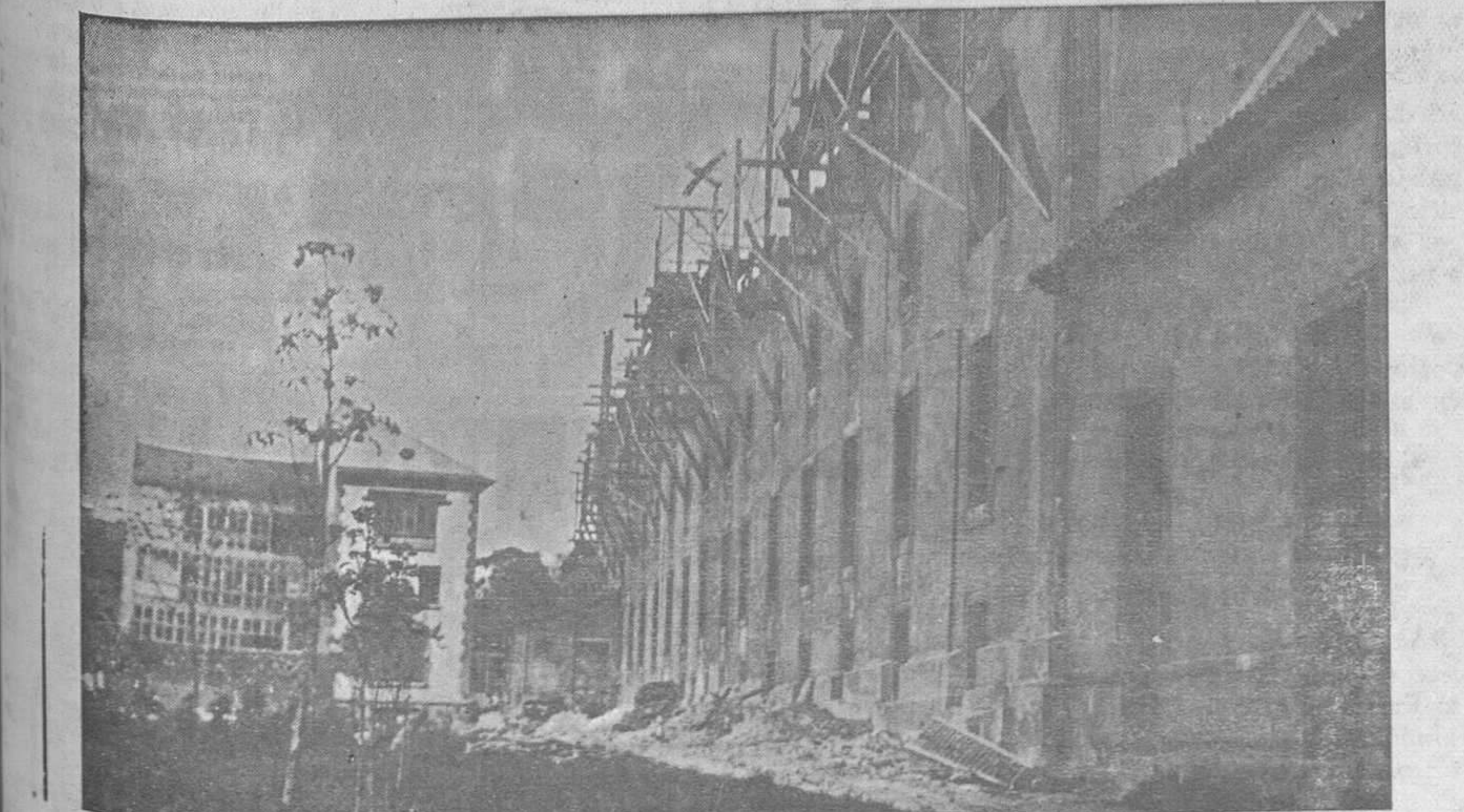
DEL GRAVE ACCIDENTE DEL TRABAJO DE AYER.-El pabellón de la Residencia provincial de niños donde ocurrió el tan sensible accidente que produjo tres víctimas y punto preciso (X) en que se produjo el hundimiento de andamios

La tranquilidad en La Felguera es completamente normal, y en los demás servicios de la empresa se trabaja como siempre.