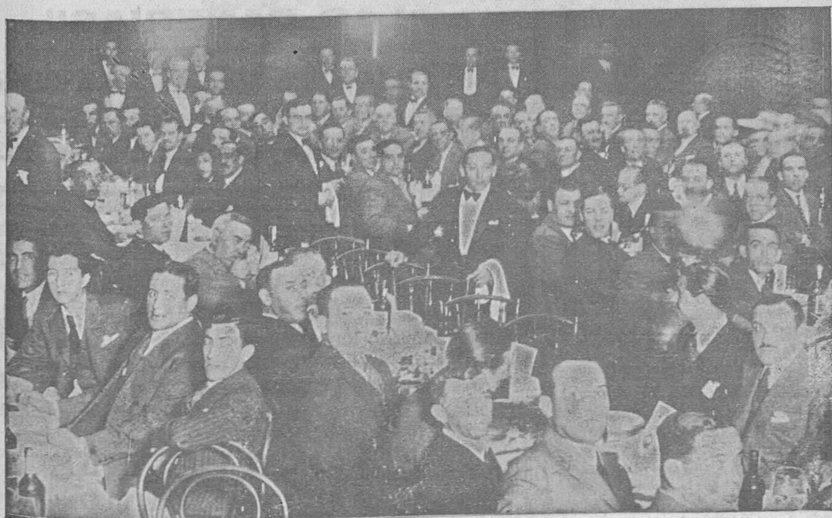
EL BANQUETE DEL DOMINGO.—Aspecto que ofrecía el comedor del Hotel durante el banquete popular con que fueron obsequiados los elementos directivos del Oviedo F. C., los del Stadium y los técnicos y constructores del nuevo magnifico campo de Buenavista

Es ciertamente una disposición de ánimo muy digna de consideración, ya que revela que todos se dan cuenta de lo difícil del momento y que no nos encontramos ante un fenómeno de entusiasmo, como ocurrió en los primeros momentos del triunfo de la República, sino que serenos los ánimos y salvadas las diferencias políticas entre algunas de las fracciones políticas republicanas, es hora de pensar en una obra de esfuerzo común para salvar nuestro crédito municipal, bastante caído, como se observa en la lucha que viene sosteniendo la Corporación para que se retiren las obligaciones del empréstito de cultura y agua.