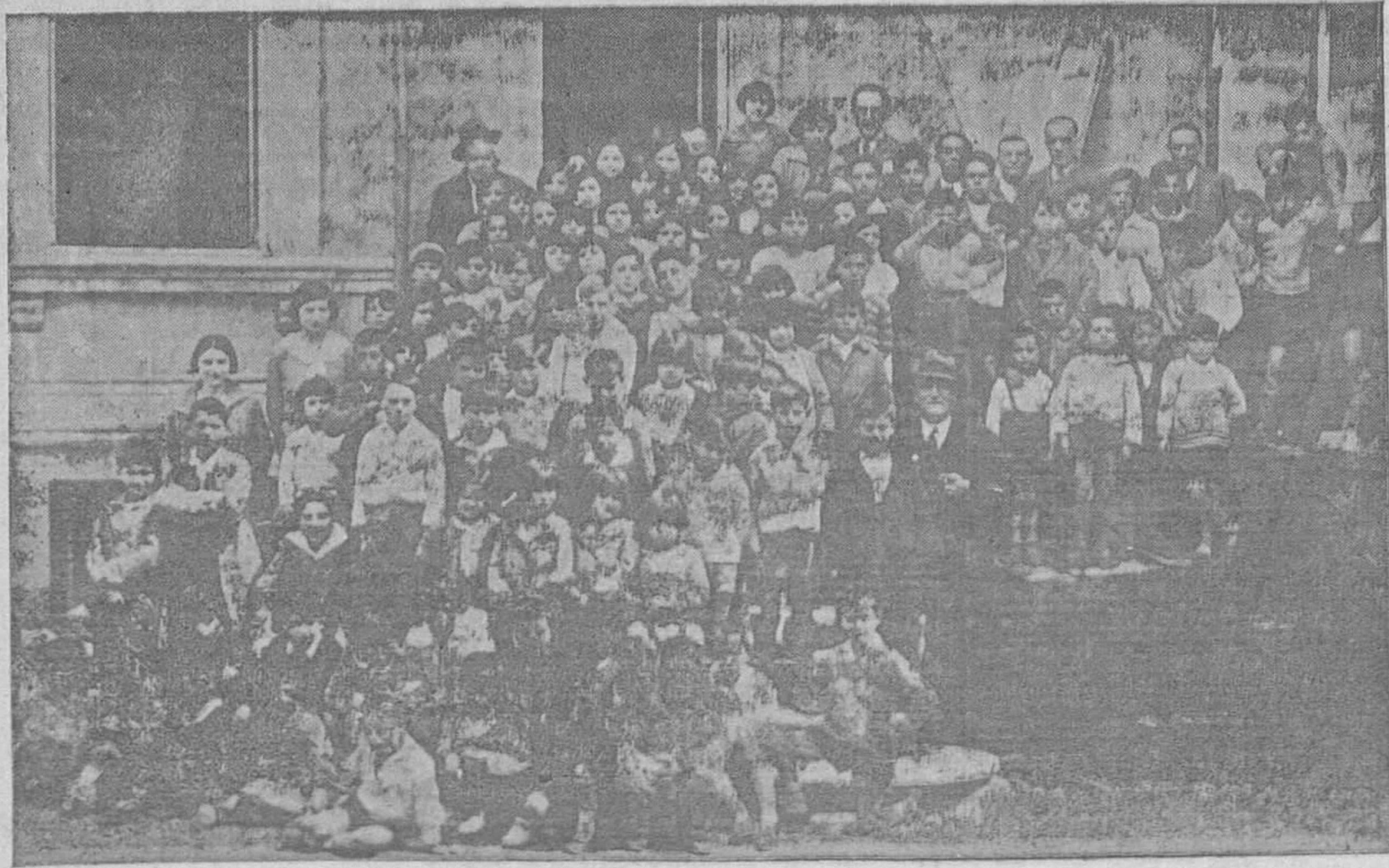
LOS COMEDORES ESCOLARES DEL MUNICIPIO OVETENSE.—El domingo se verificó la inauguración de los nuevos comedores, asistiendo los niños que figuran en este grupo fotográfico.

Con motivo de la huelga que los estudiantes de Bellas Artes tienen planteada, la Asociación de Estudiantes Industriales (F. U. E.) ha enviado, con fecha 30 del pasado mes, al señor ministro de Instrucción Pública, un telegrama que dice: "Asociación Estudiantes Industriales reclama solución expediente motivo huelga estudiantes Bellas Artes.—Secretario."