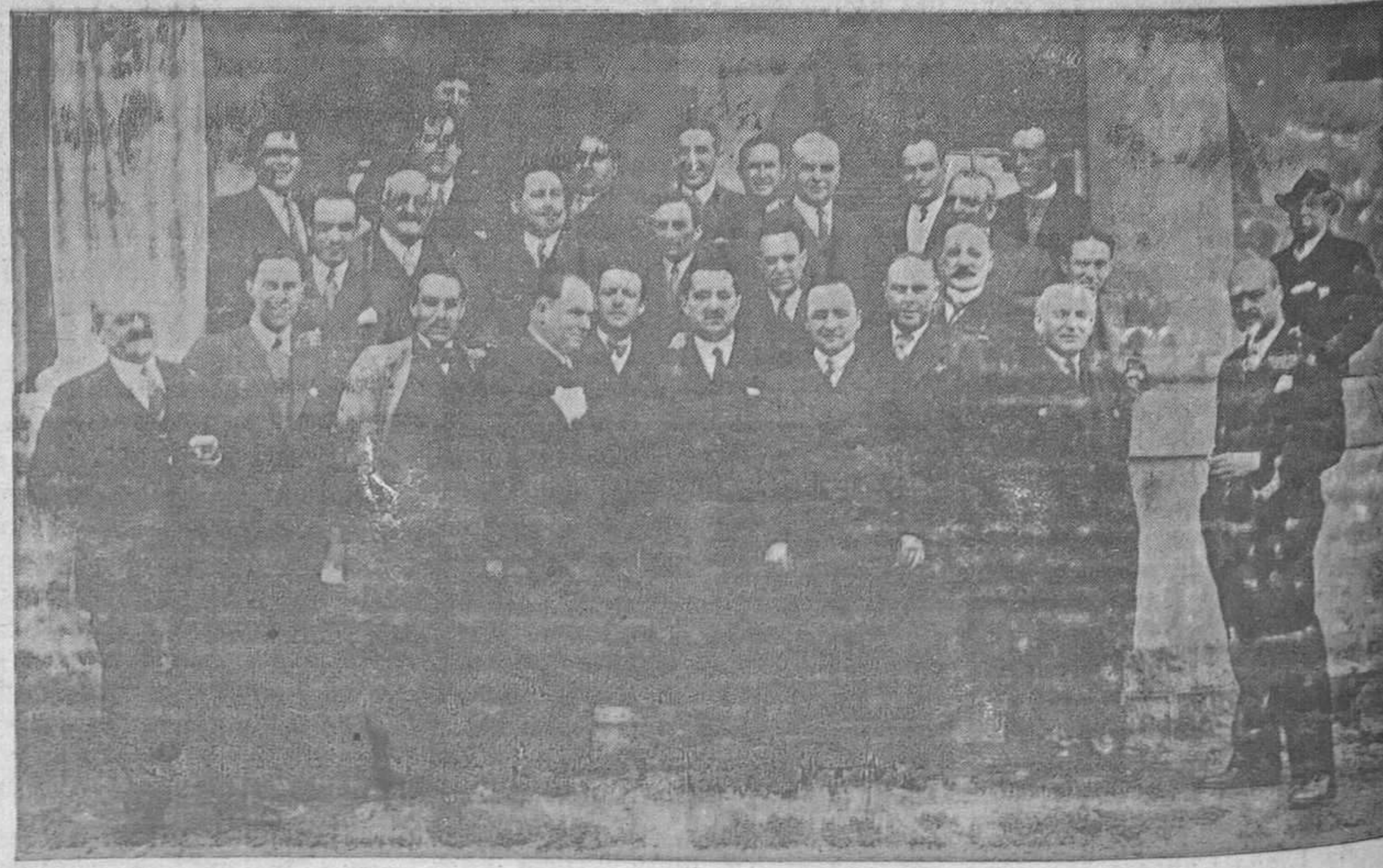
Los procuradores de los Tribunales de Justicia en Asturias.—Ayer celebraron su fiesta anual, inspirada en sentimientos de gran cordialidad, asistiendo representantes de la capital y muchos partidos de la provincia. En la foto figura un grupo de los mismos después del banquete en que estuvieron reunidos