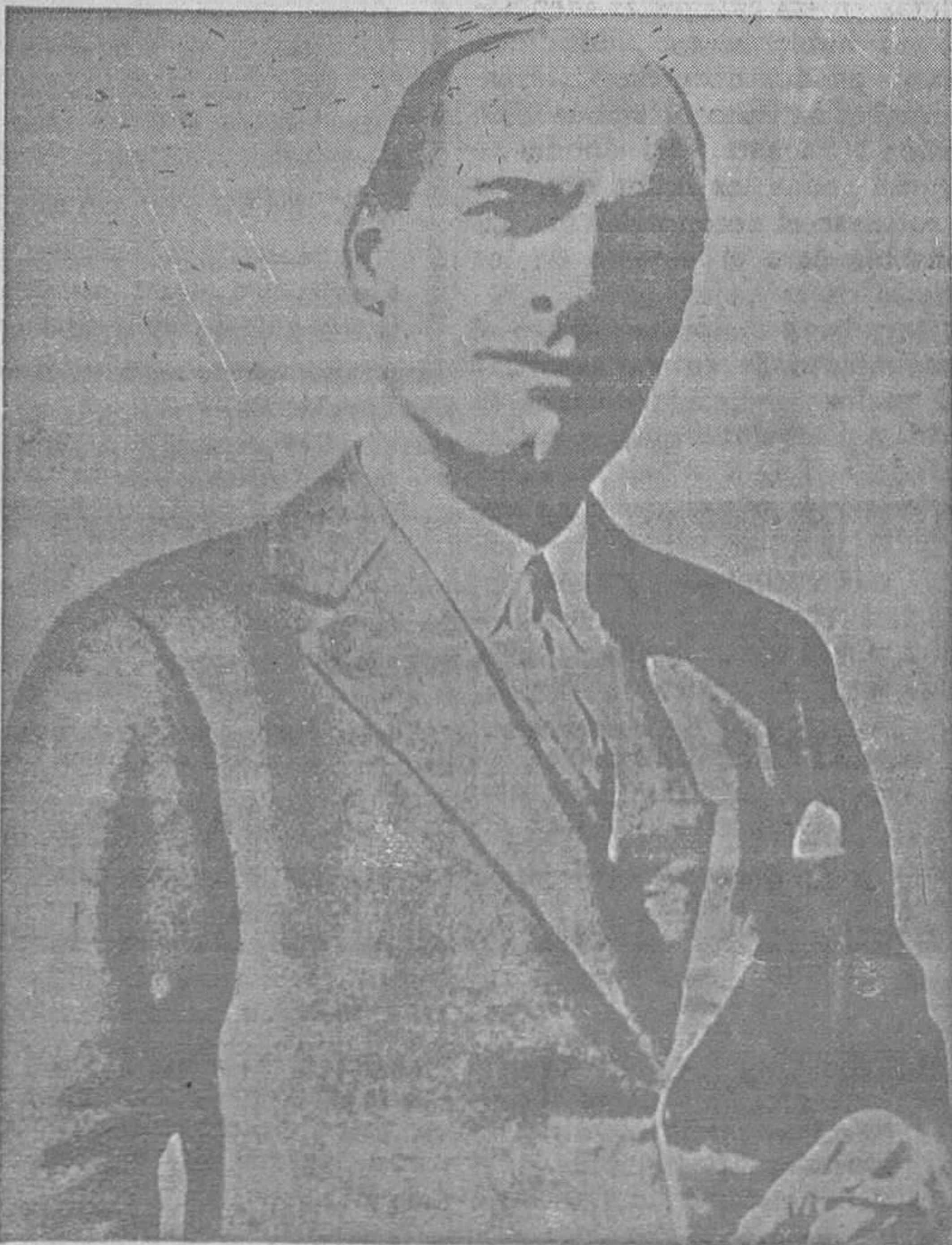
El ilustre pensador español don José Ortega Gasset, que en la mañana de hoy pronunciará en el Teatro Campoamor un discurso, al que se atribuye gran importancia política y por el que existe gran expectación.

En grave estado fué trasladado a un Sanatorio de la capital, una vez que el Juzgado instruyó las oportunas diligencias.