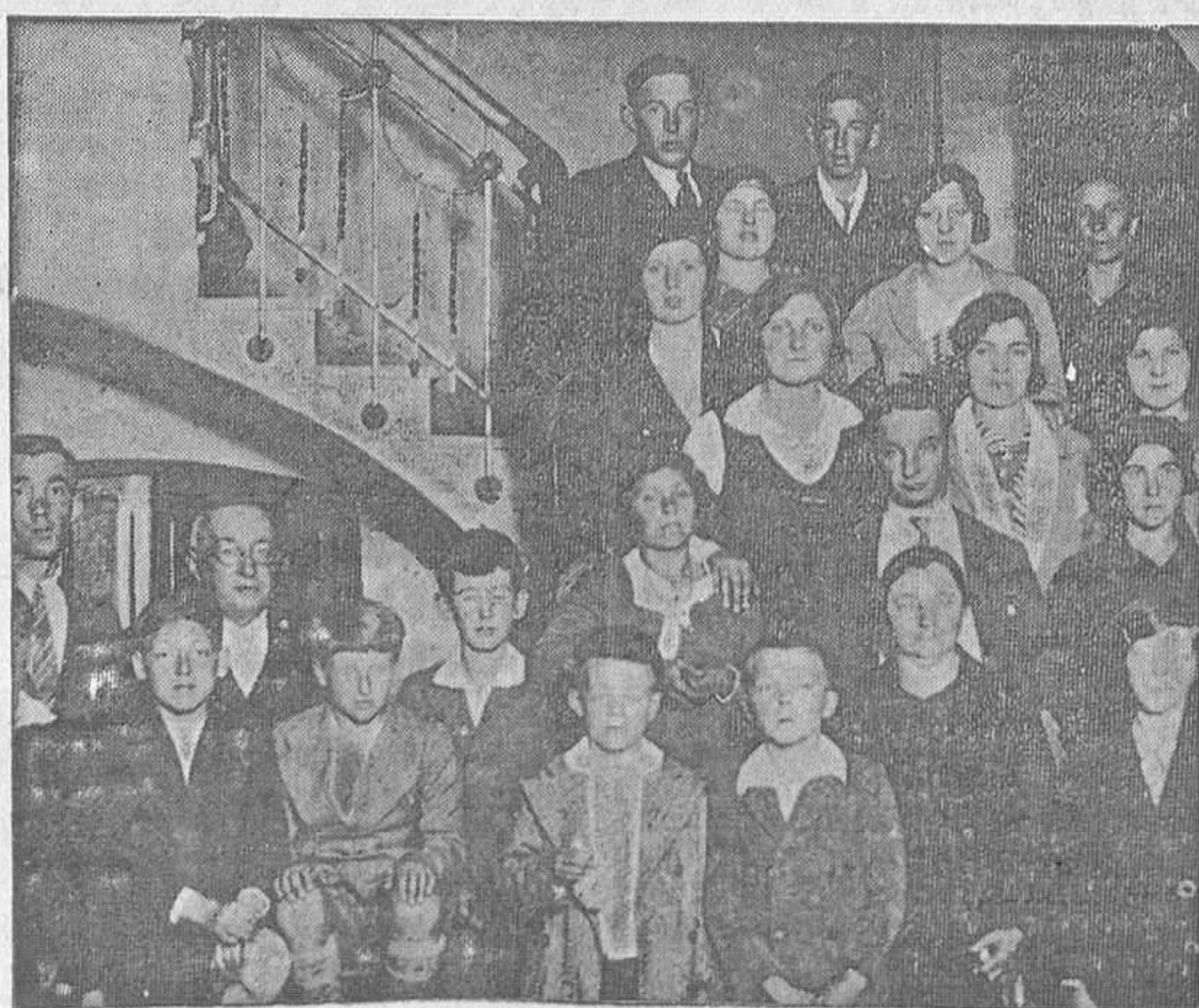
FIESTAS ESCOLARES.—Los alumnos de la escuela de San Vicente, en el concejo de Salas, durante la visita que hicieron a nuestra casa, con sus profesores y algunos convecinos.