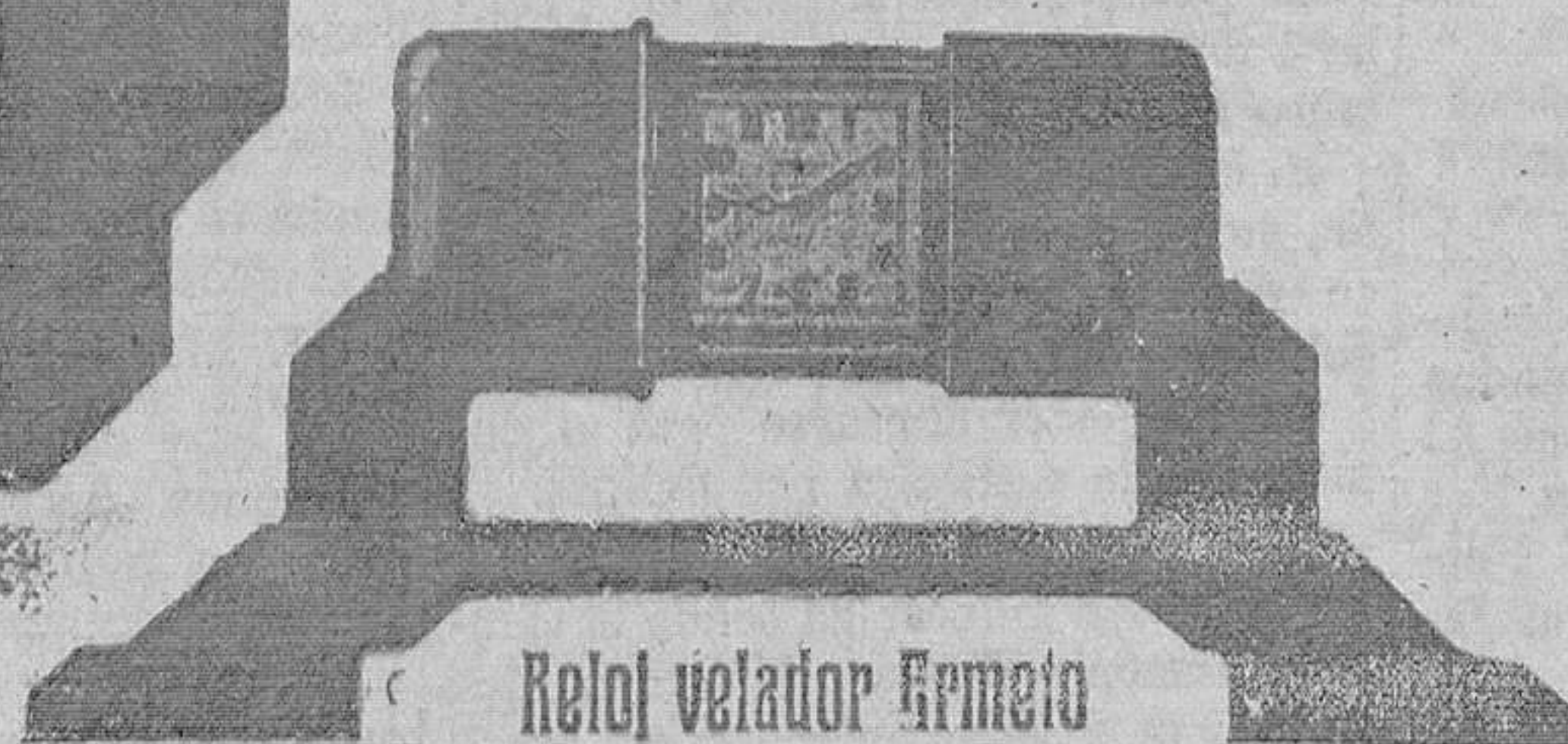
Reloj velador Hermeto