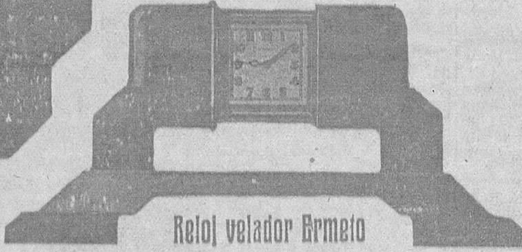
Reloj velador Birmeto