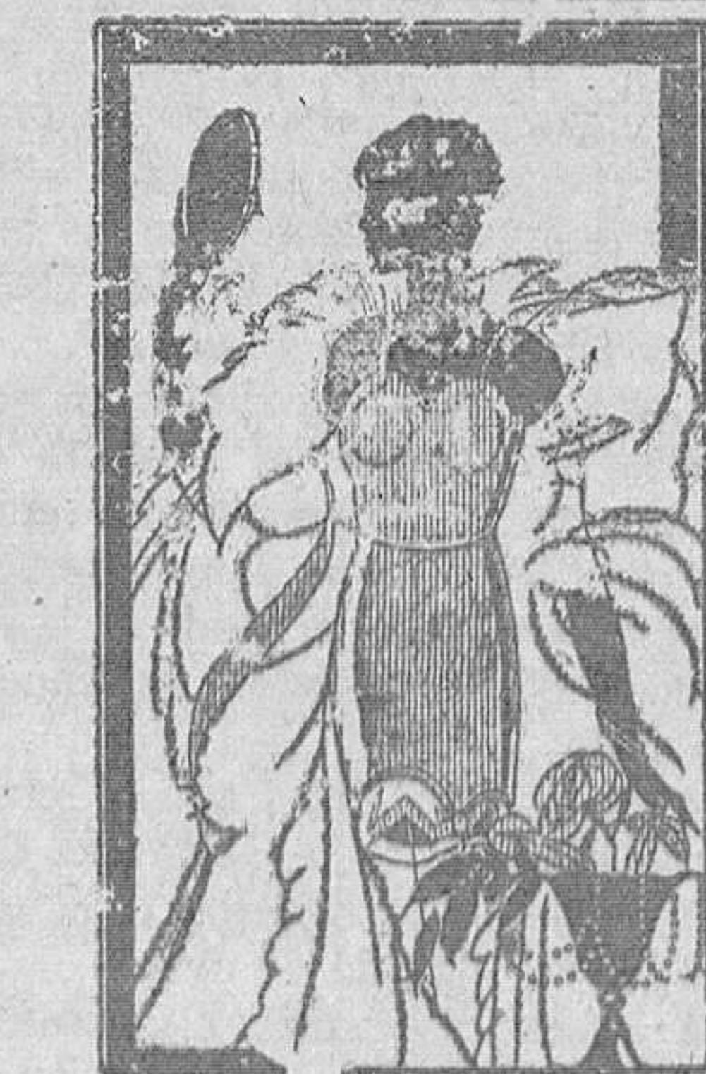
«MADAME X» Fajas para adelgazar Melquíades Alvarez, 6

Covadonga, general, Navia. Pitas, idem, Tapia. Mariari, carbón, San Sebastián. Zubiate, idem, Zumaya. San Ireneo, idem, San Sebastián. Río Segre, general, Santander. M. de Chávarri, carbón, Barcelona.