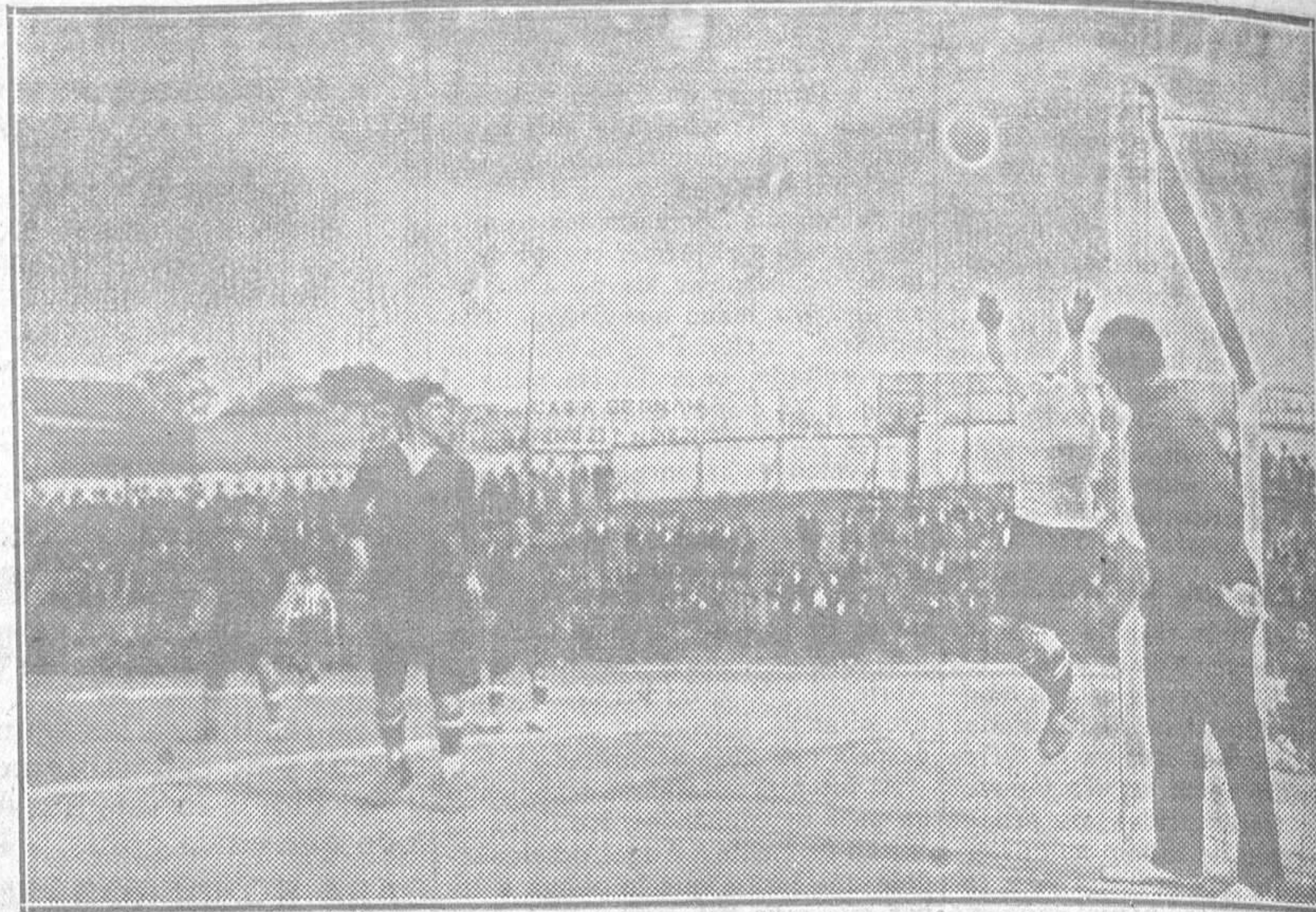
OSCAR RECHAZA UN BALON ALTO