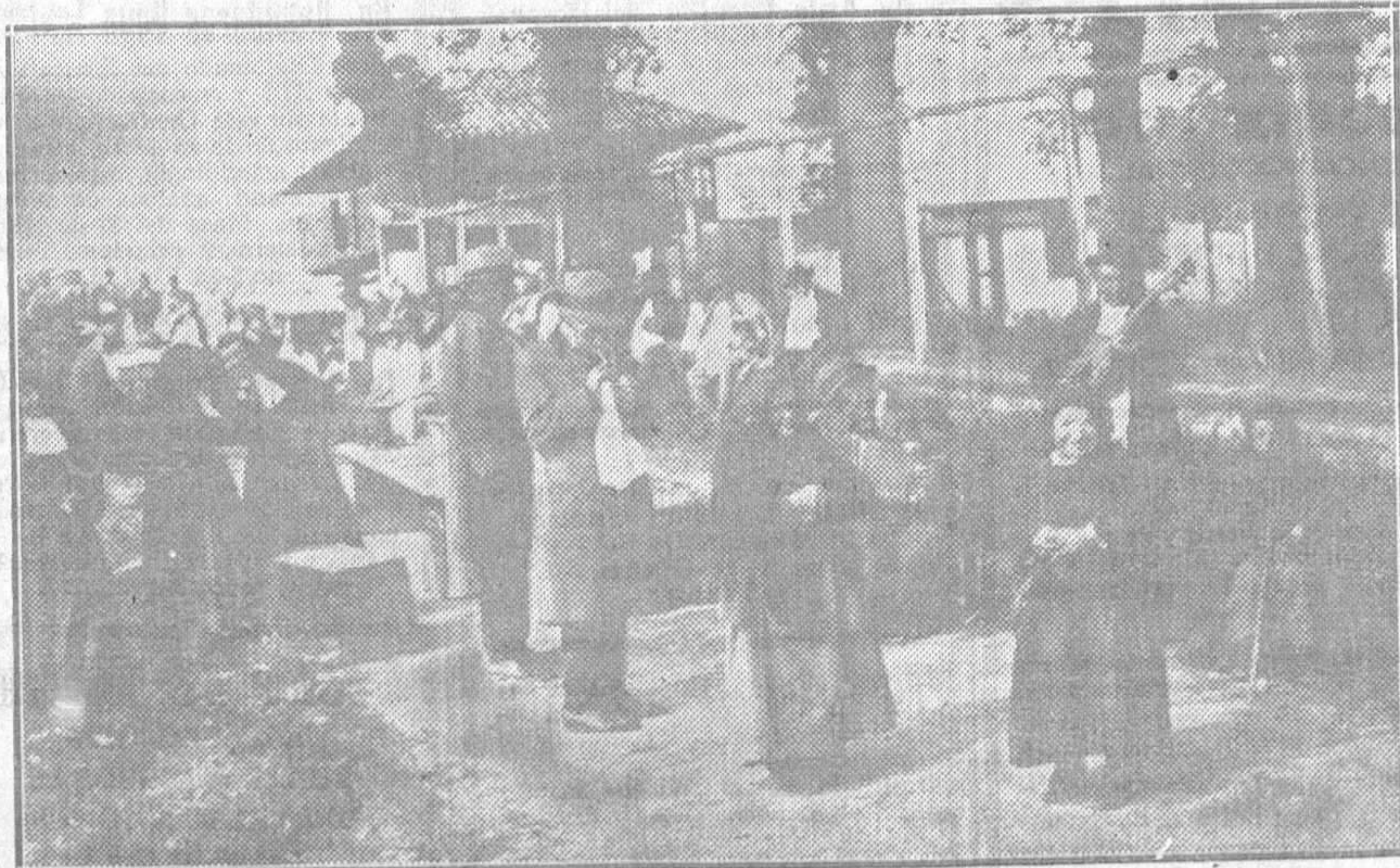
LOS ANCIANOS DESAMPARADOS EN UN DIA DE CAMPO

Málaga.—En el kilómetro 37 de la línea de Sevilla a Málaga descarriló un mercancías, no ocurriendo desgracias personales.