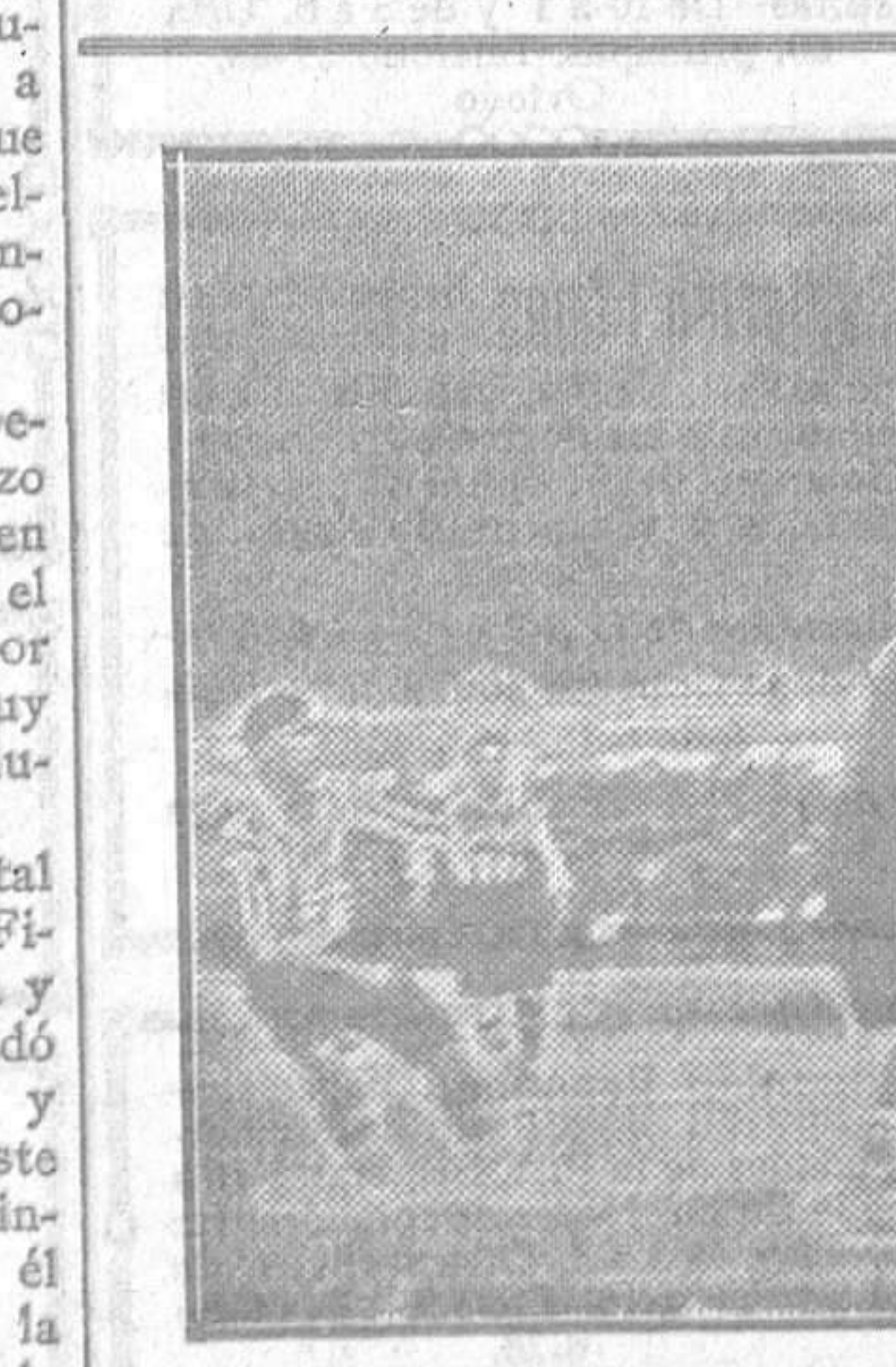
ESPARZA CORTA DE CABEZA UN ATAQUE POR ALTO