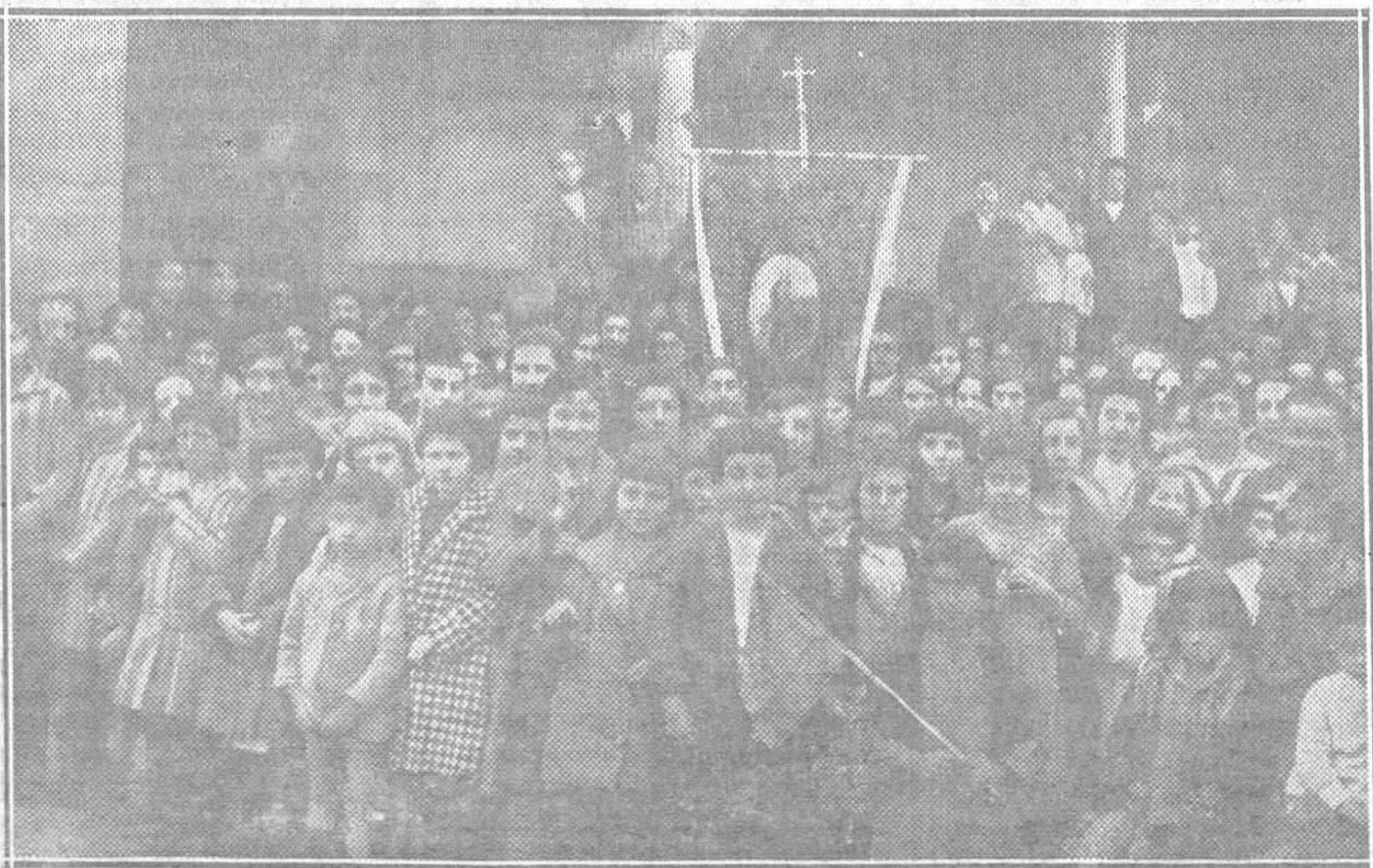
SEVARES-PILONA.—Saliedo de la iglesia para la santa misión de Sorribas