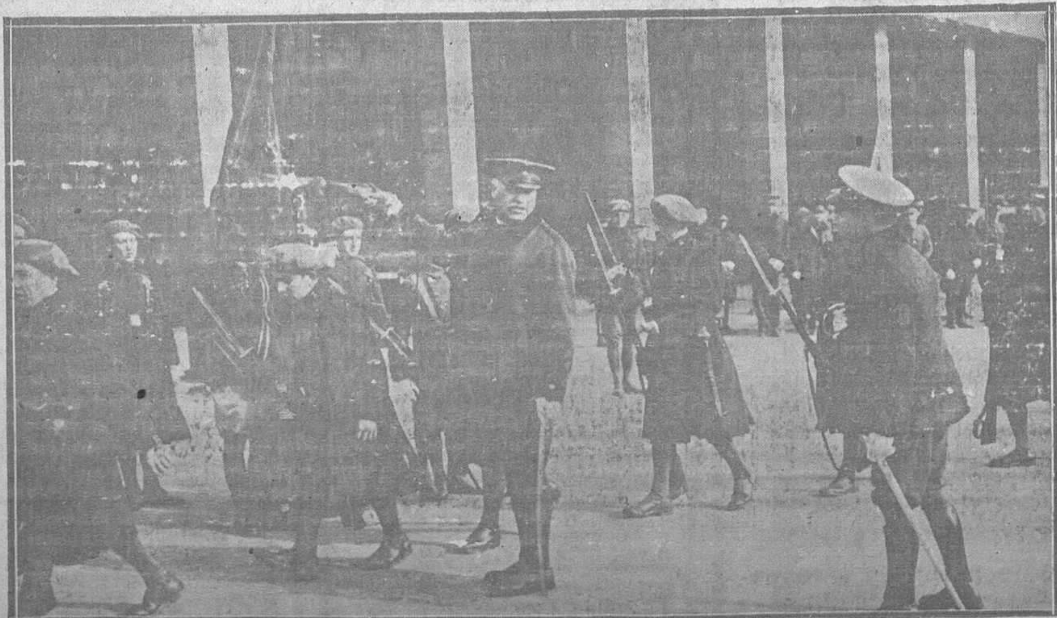
EN EL CUARTEL DELAYO.—Momento en que los soldados del Príncipe, recientemente incorporados, desfilan bajo la bandera después del acto de la jura, verificado ayer mañana con asistencia de las autoridades, como se verificó también por los reclutas del Sexto de Zapadores minadores con el mismo ceremonial.

En Munkden, una catástrofe minera sepultó a un centenar de obreros.