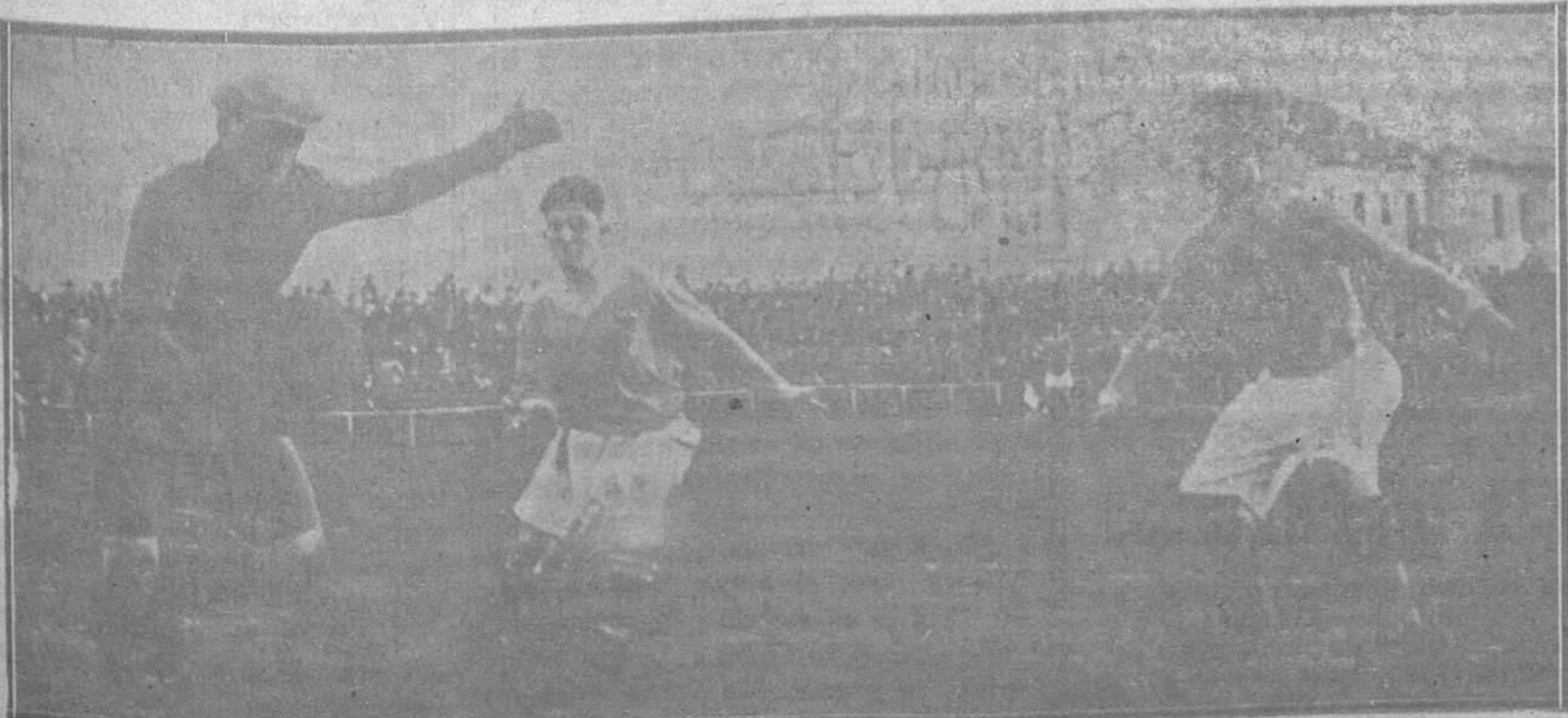
EL PARTIDO SPORTING-OVIEDO, JUGADO EL DOMINGO EN TEATINOS. — El "metamario" del Real Sporting, sortea con el balón al Caramelero y a Polón, en el instante en que éstos pretenden hacerse con la pelota de cuero.

Santa Clara (FRENTE AL CUARTEL DE INGENIEROS) OVIEDO—Teléfono 9-92