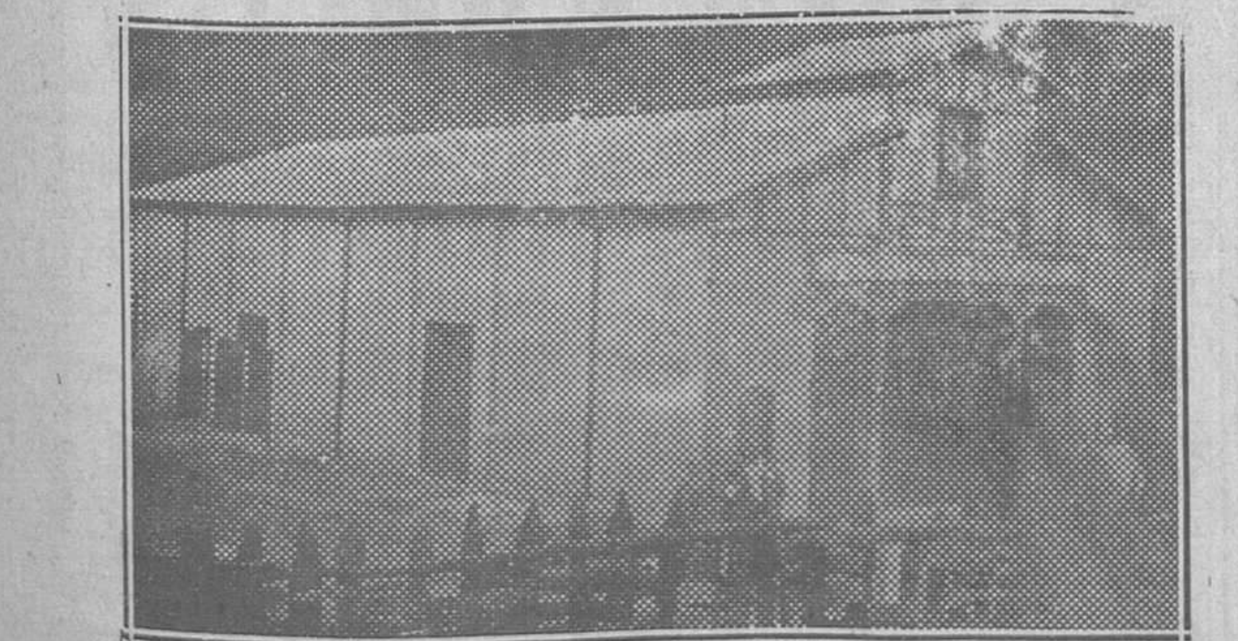
TURÓN.—El nuevo Salón «Froiladela» que se ha inaugurado recientemente y en el cual se celebran todos los actos culturales organizados por el Ateneo Obrero