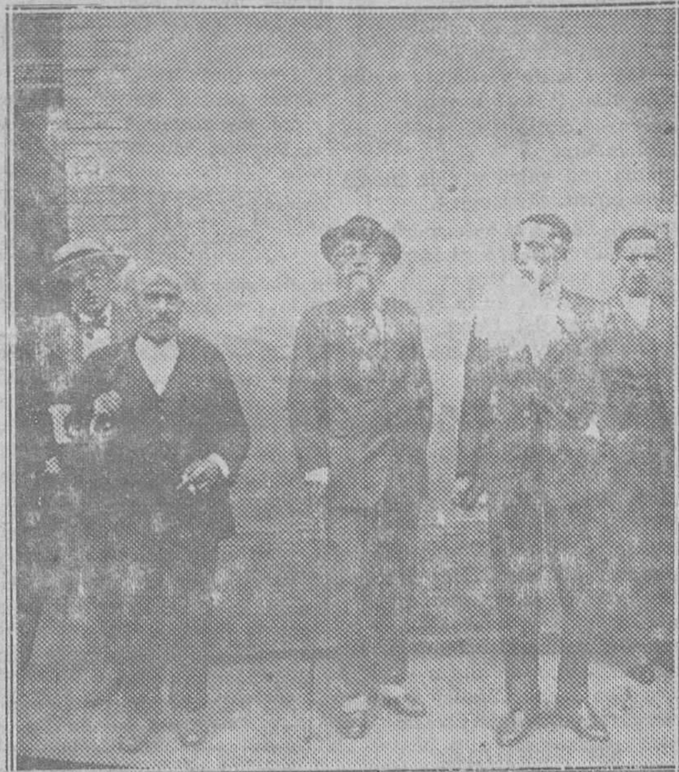
DE LA VISITA DE VALLE INCLAN.—El insigne literato momentos antes de pronunciar su admirable conferencia en el Ateneo Obrero, rodeado de algunos miembros de la Directiva de aquel centro cultural