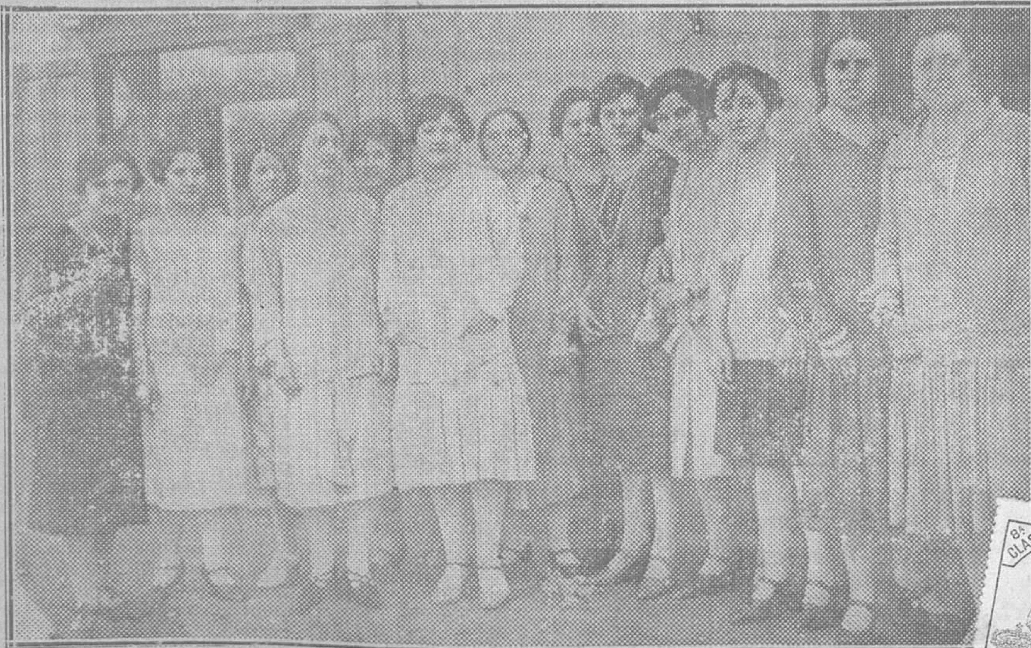
TURÓN.—¿Hay brillantes entre el carbón? Conteste el lector, después de contemplar este pl grupo de mujeres hermosas que el fotógrafo ha sorprendido a la salida de misa