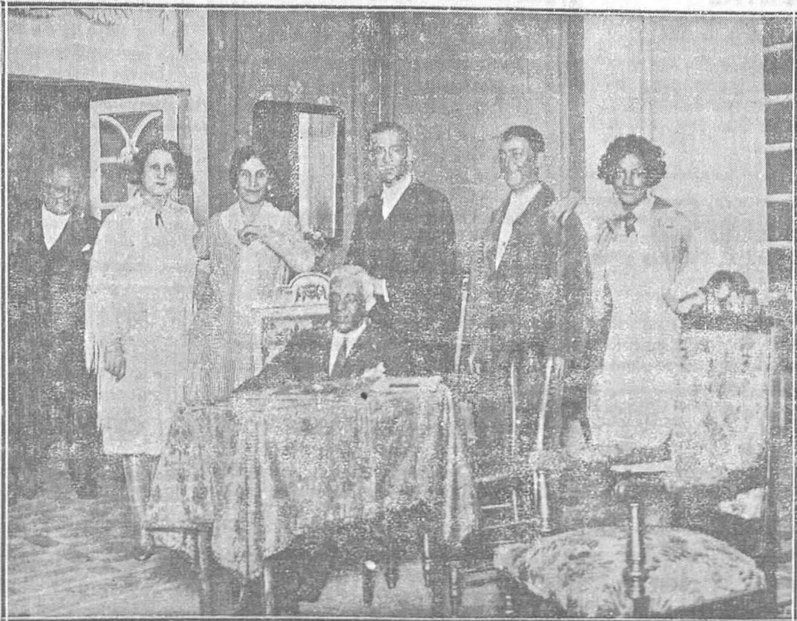
EN EL TEATRO CAMPOAMOR. - Una escena de la comedia de ambiente asturiano «Trece ansas de oro», de Margarita Robles y el señor Delgran, estrenada con gran éxito en el coliseo municipal