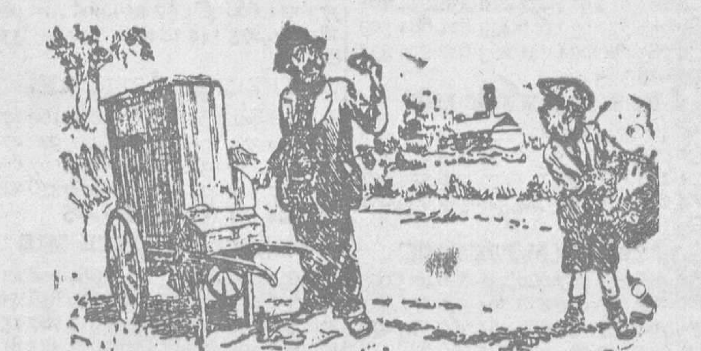
—Pero, ¿por qué toca usted, si aquí no hay ninguna casa? —¡Ya lo sé! Es que yo quiero comer con música.