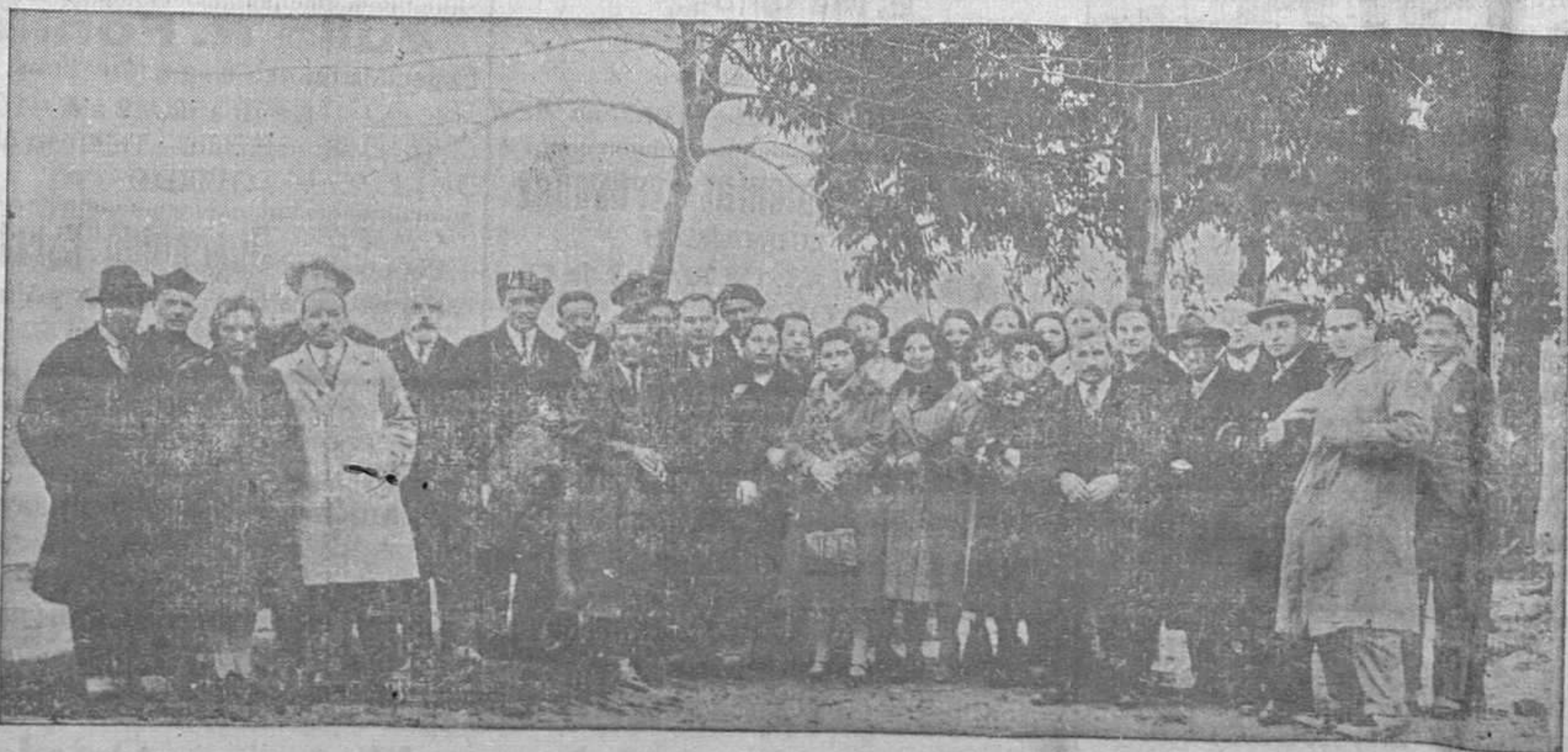
Maestros de los concejos de Colunga, Caravia y Villaviciosa, con sus Profesores, en el Cursillo celebrado en La Isla

La obra gustó y aunque en algunos momentos pesa, es lo cierto que todos los cuadros fueron aplaudidos y que se ovacionó al terminar a todos sus intérpretes.