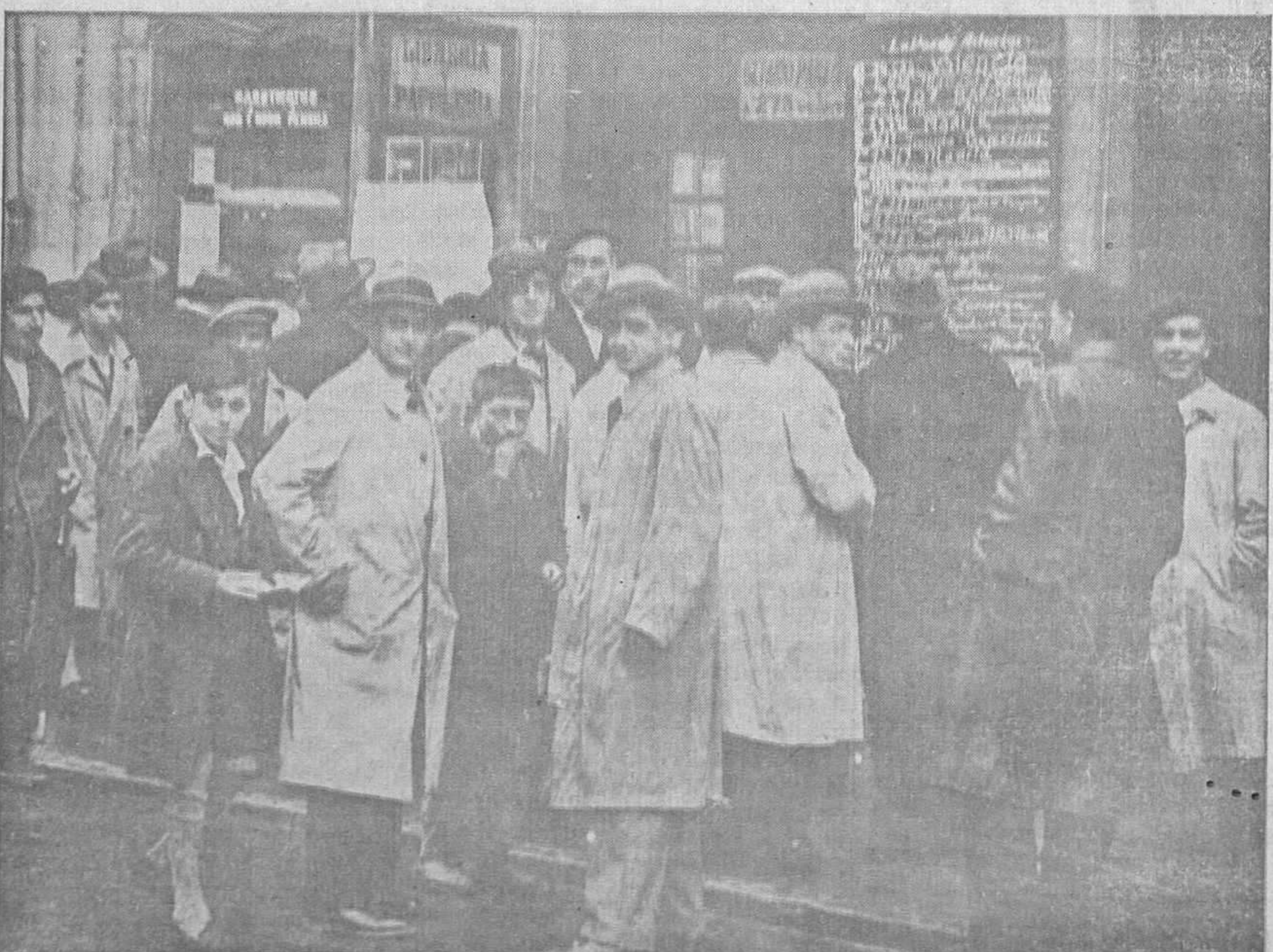
DEL SORTEO DE AYER DE LA LOTERIA NACIONAL.—Grupo de curiosos ante la pizarra de LA VOZ DE ASTURIAS, en que se iba conociendo en Oviedo el resultado del sorteo que se celebraba en Madrid.

La Asociación de la Prensa Diaria Ovetense, en nombre de todos los periodistas de la capital, al hacer público este rasgo altruista de la asamblea federativa, expresa también su gratitud a la gran familia periodística, que así vela y se interesa por la situación de cuantos la integran; y al propio tiempo muestra su satisfacción por haberse restablecido la unidad, formando en la Asociación los redactores de los tres diarios locales.—El presidente de la Asociación,