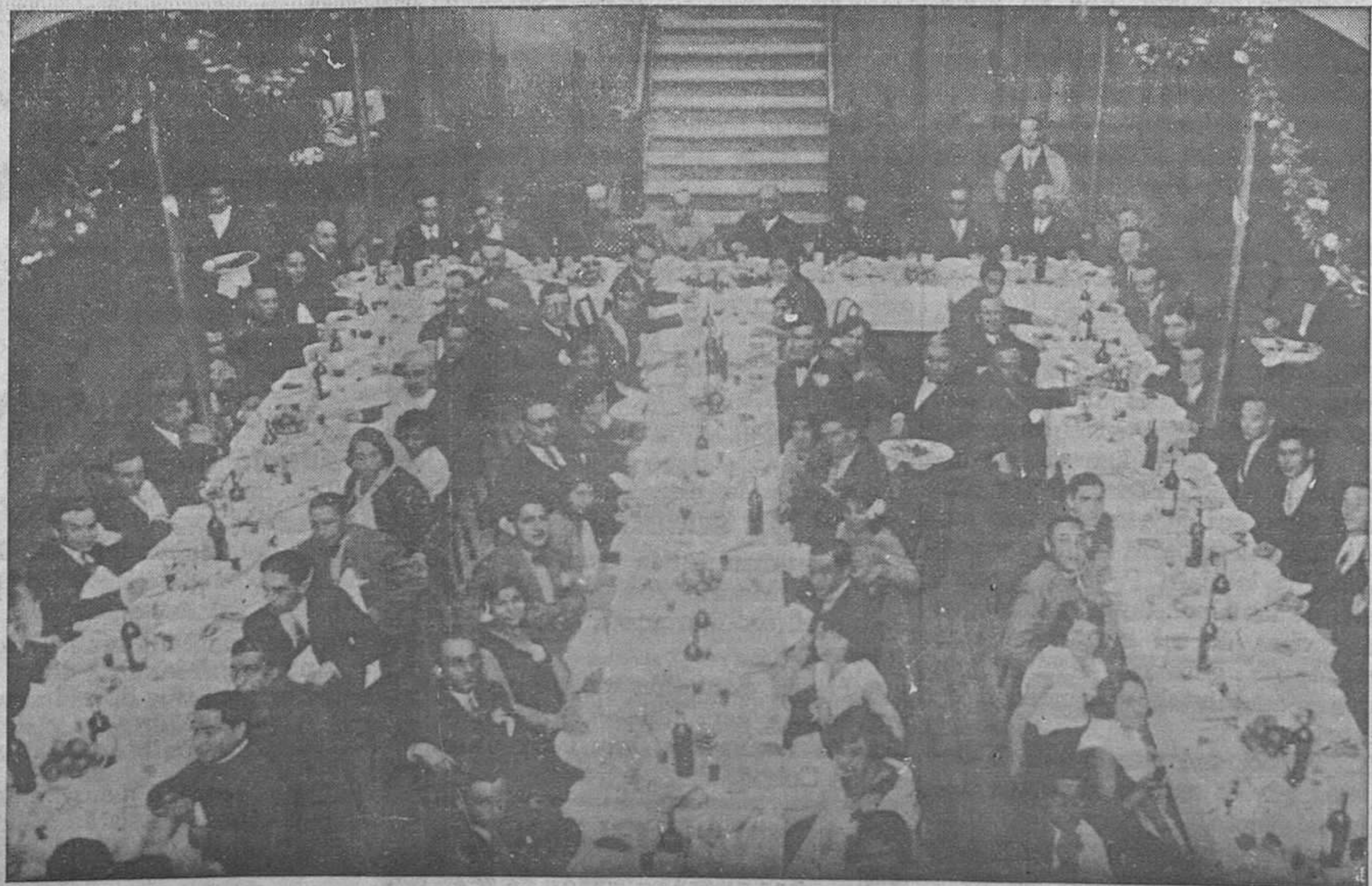
EA FIESTA DE SANTA CECILIA.—Un aspecto del banquete celebrado por la notable Coral Vetusta

Palacio Valdés, 18 y Govadonga, 43 OVIEDO