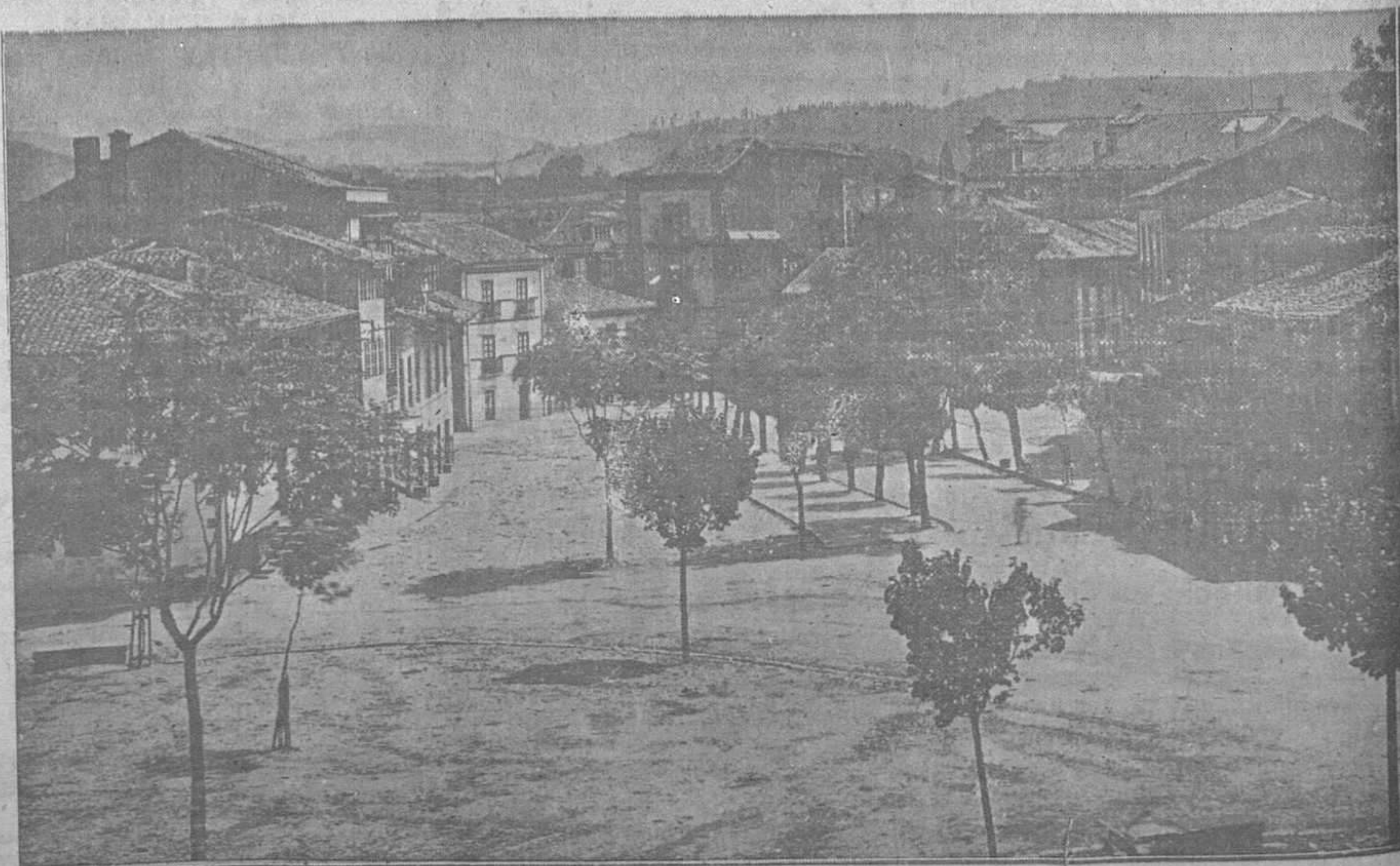
PLAZA DE LAS CAMPAS, DONDE SE CELEBRA EL MERCADO DE GANADOS