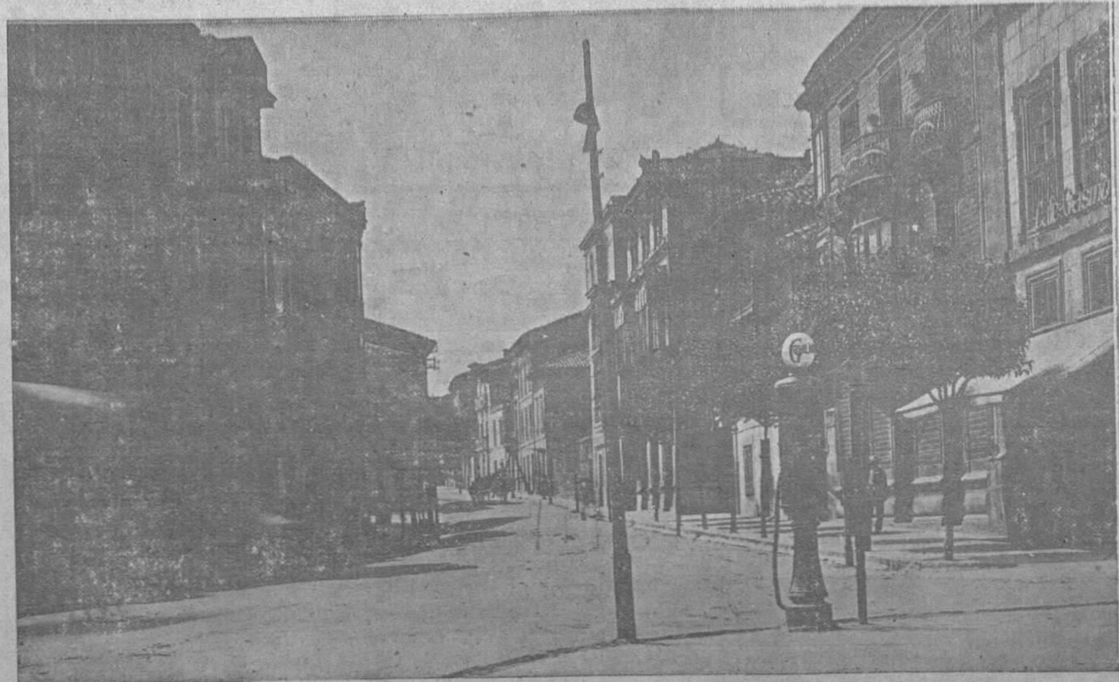
VISTA PARCIAL DE LA CALLE CELLERUELO