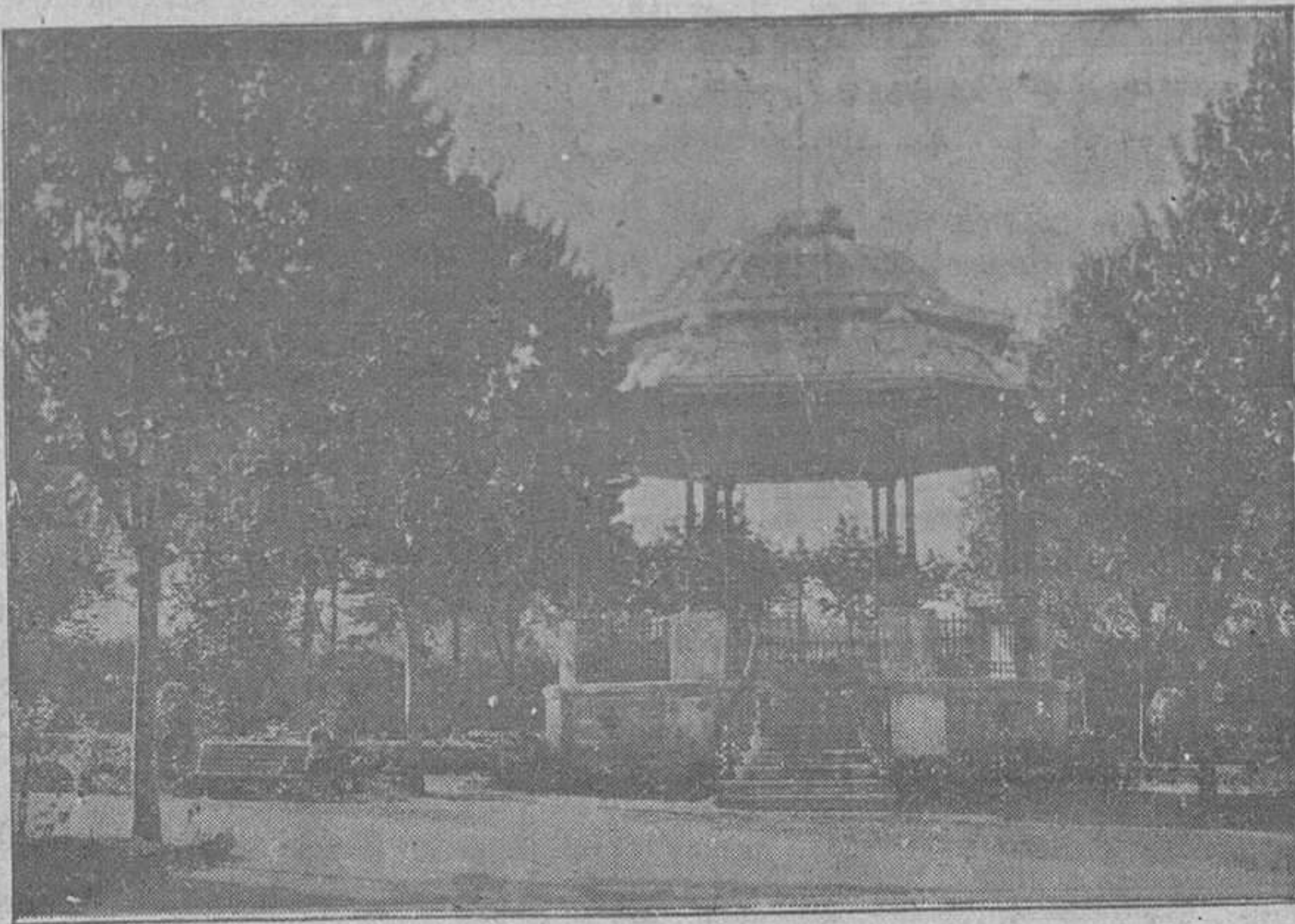
Hermoso parque en que está enclavado el kiosco para la música

acompañadas de aquellas inolvidables carcajadas, tan suyas como simpáticas; ni los discursos entusiastas de Ravachol, arreglaban aquello, nada, que aquel año no