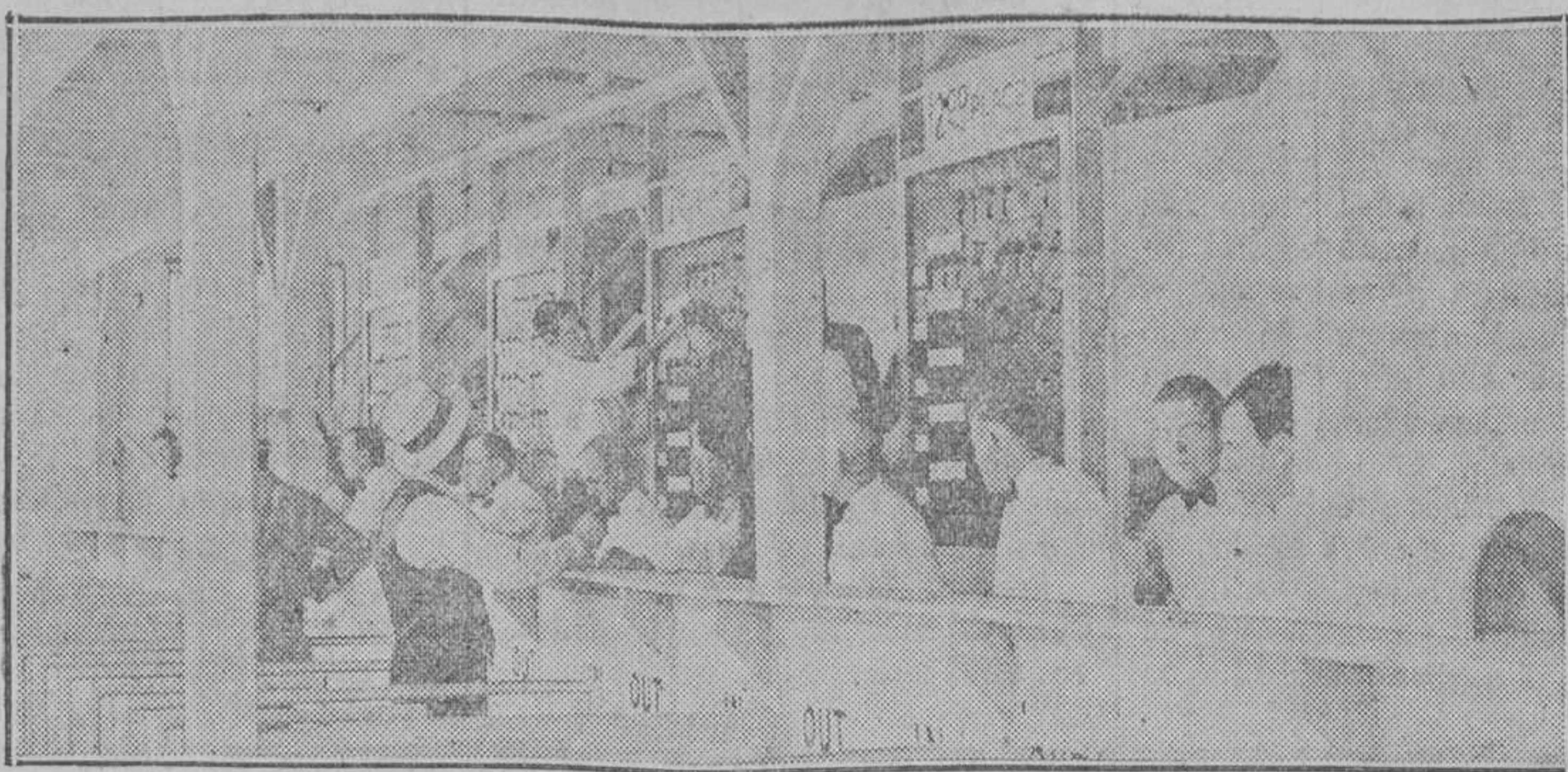
Escena del mostrador del «pari-mutuel» el día en que se inauguraron las apuestas legales en las carreras de caballos en California, que habían estado prohibidas durante mucho tiempo

y no espera tener más de una media comida elegirá un Congreso. A un lado estará un hombre de Estado predicando paciencia, respeto por los derechos adquiridos, estricta observación de la fe pública. Del otro habrá un demagogo declamando sobre la tiranía del capitalismo y de los usureros y permitiendo por qué se ha de permitir que alguien beba champaña y vaya en carruajes cuando hay miles de honrados ciudadanos que carecen de lo indispensable. ¿Cuál de estos dos candidatos será elegido por un obrero que cye a sus hijos llorar por pan?