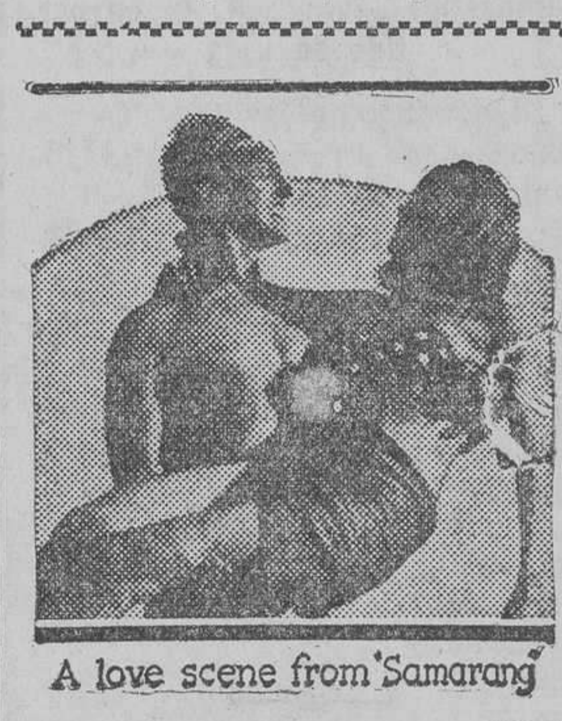
A love scene from 'Samarang'

Spencer Tracy, el artista vibrante y humano, comunicará a todos los espectadores, con el solo milagro de su arte, la vida de dolor, de amargura y de renunciamiento por la que él atraviesa, como un miembro del hampa primero, como un condenado perfecto, después.