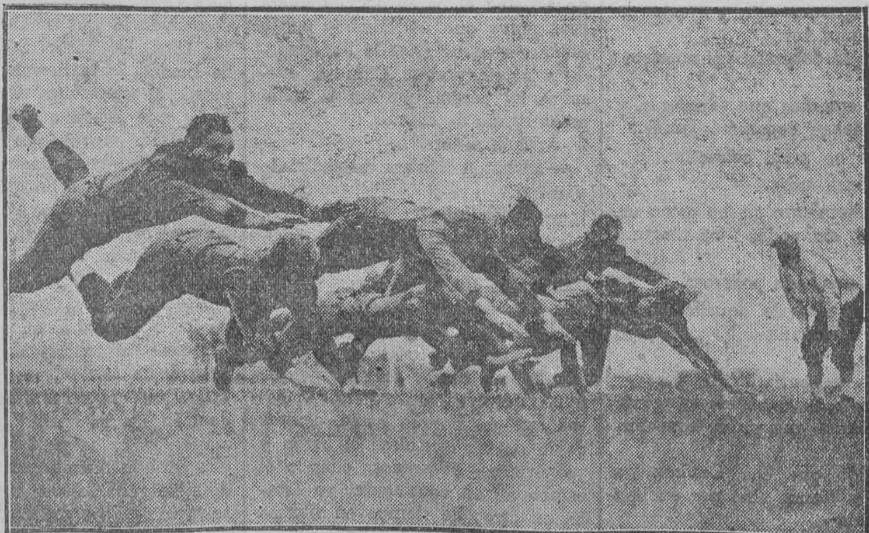
Con la entrada del otoño, el fútbol se apodera prácticamente del campo deportivo en los Estados Unidos. Aquí se ven algunos candidatos que aspiran a un puesto en el equipo de la Universidad de Michigan haciendo una demostración del «tiffing-tackle»