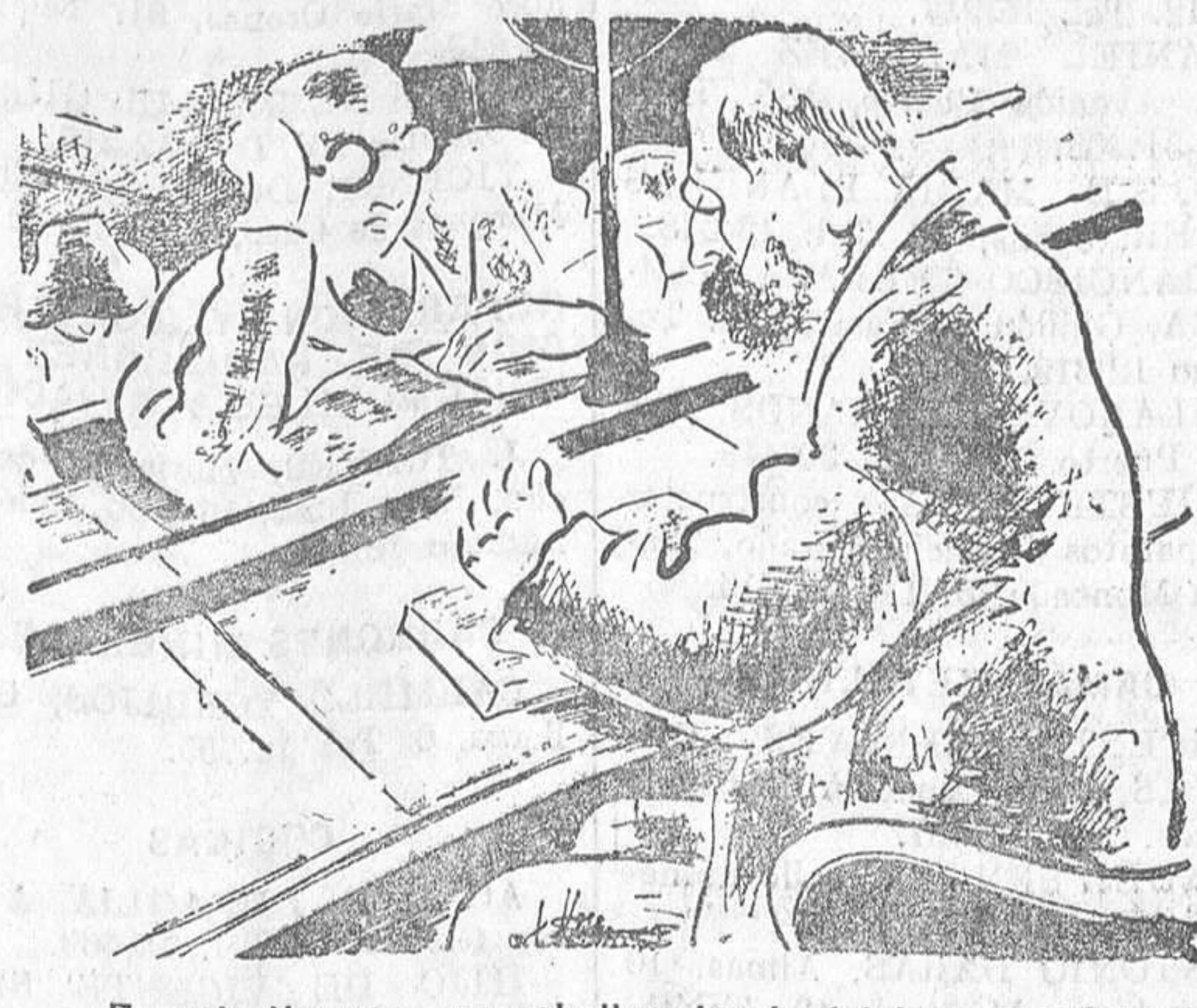
—En mis tiempos, un caballero jamás dejaba a una dama de pie en el tranvía. —En sus tiempos, amigo, todavía no existían los tranvías.