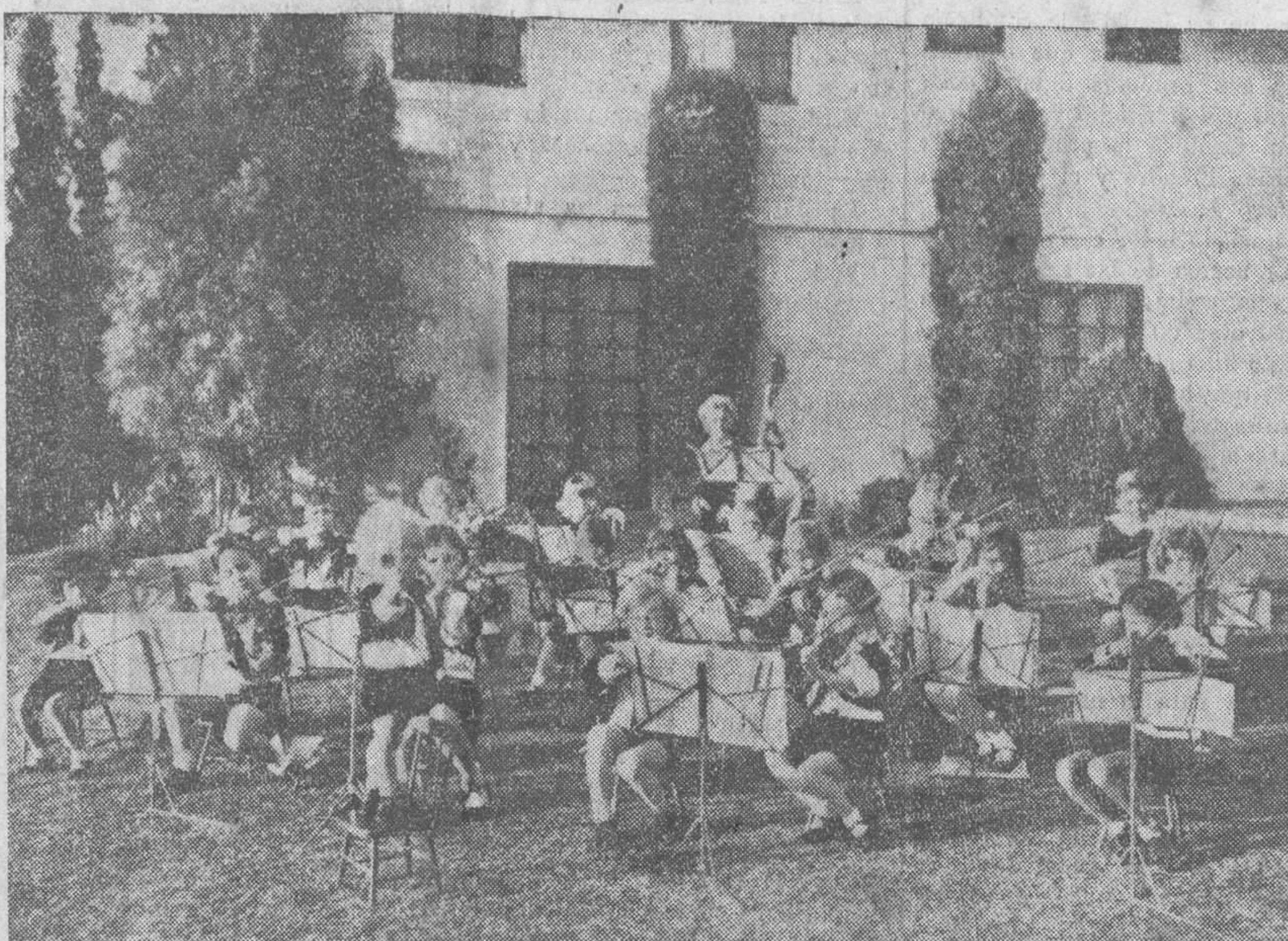
Ha debutado en San Francisco de California y está formada por 35 niños de edad inferior a seis años