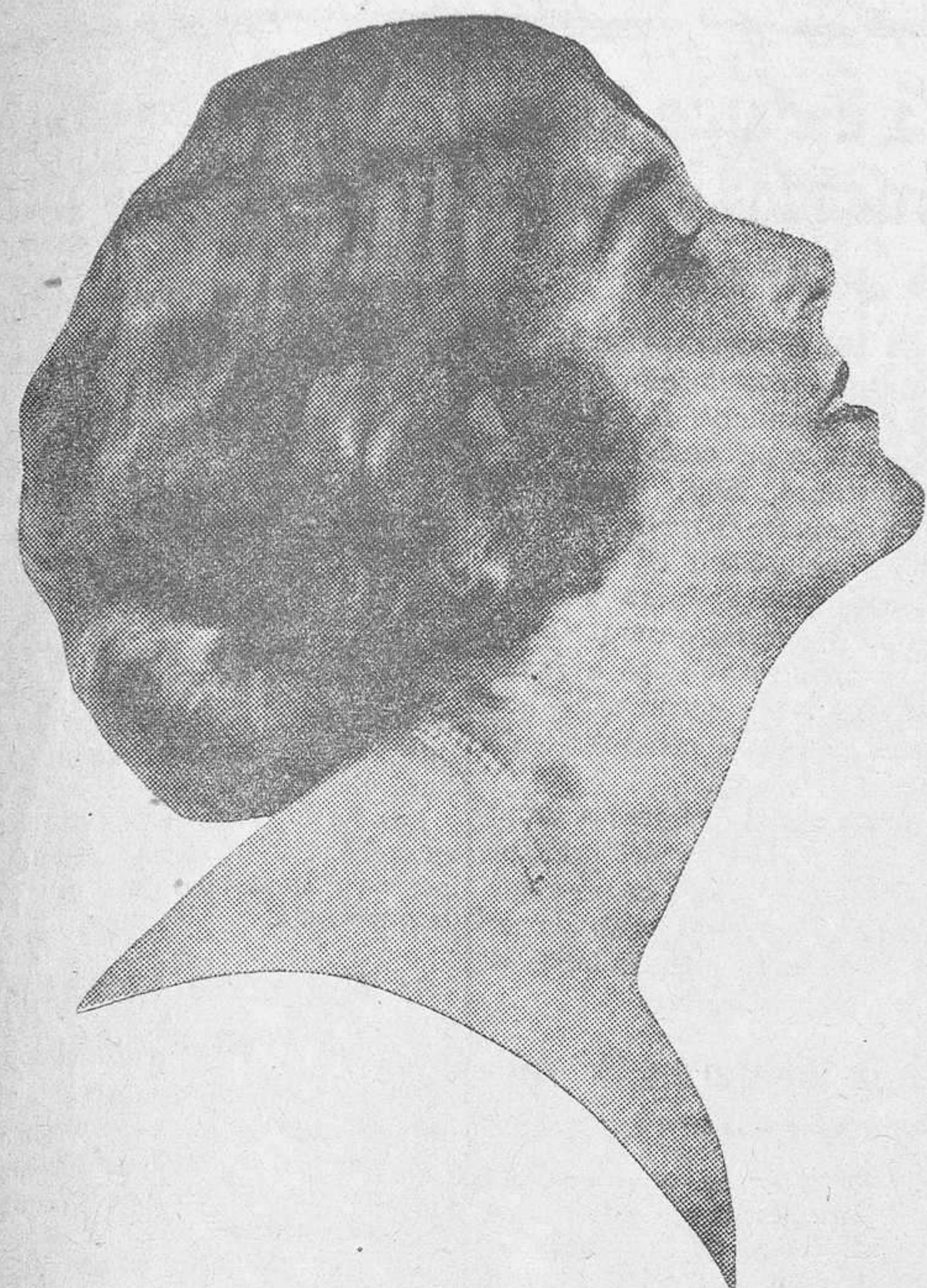
Vilma Banky, bellísima mujer europea y un valor artístico grande, que triunfa en Norteamérica