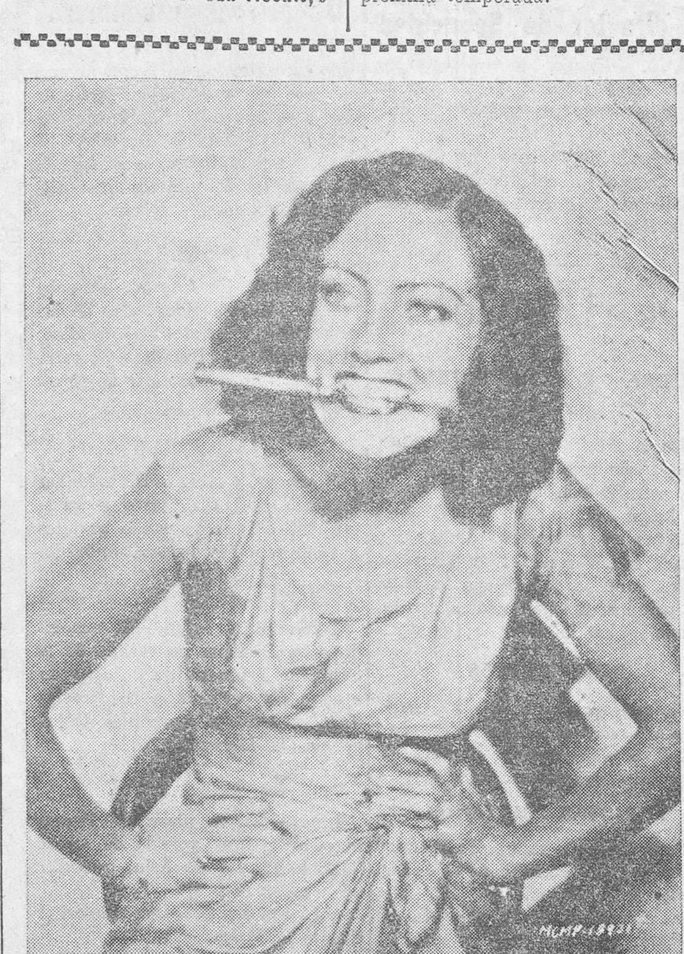
He aquí a Joan Crawford, la encantadora estrella de los estudios de Culver City