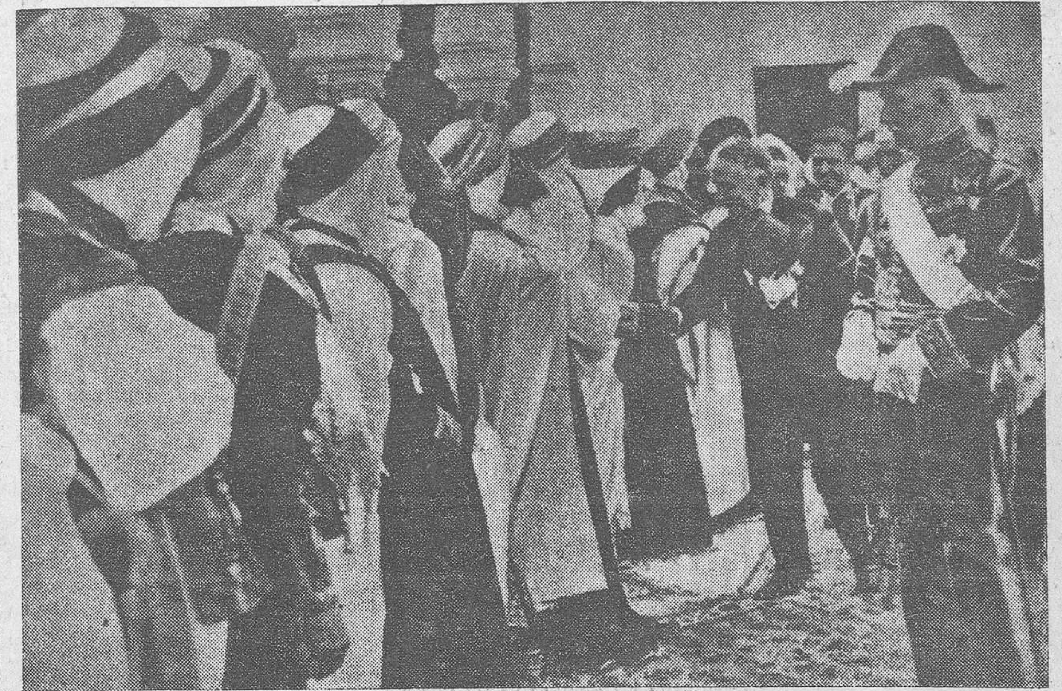
Mister Doumergue saludando a los jefes argelinos a su llegada al palacio del gobernador de Argel