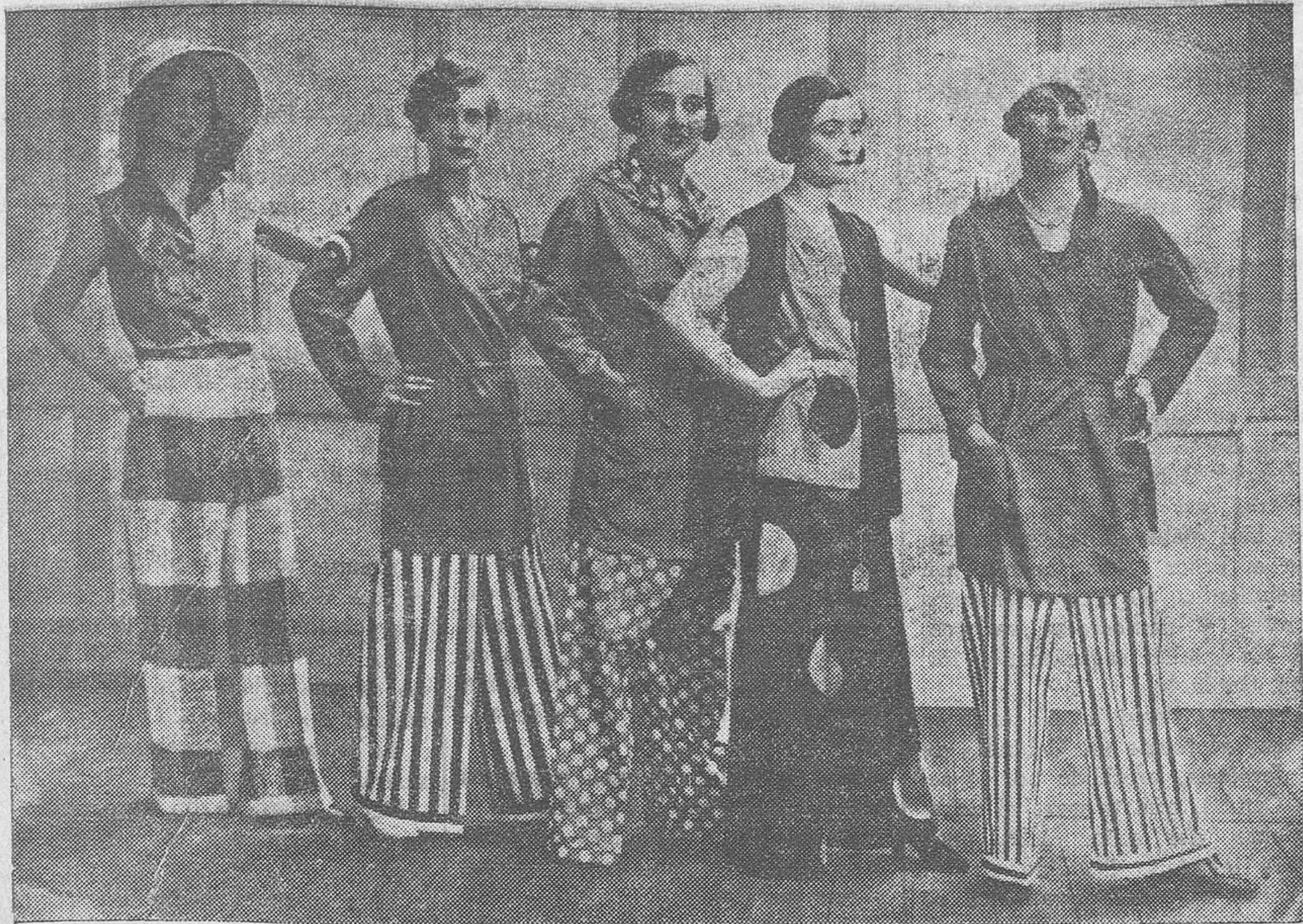
He aquí un panorama de pijamas, la prenda de actualidad en todas las playas de moda, que las elegantes usan antes y después del baño