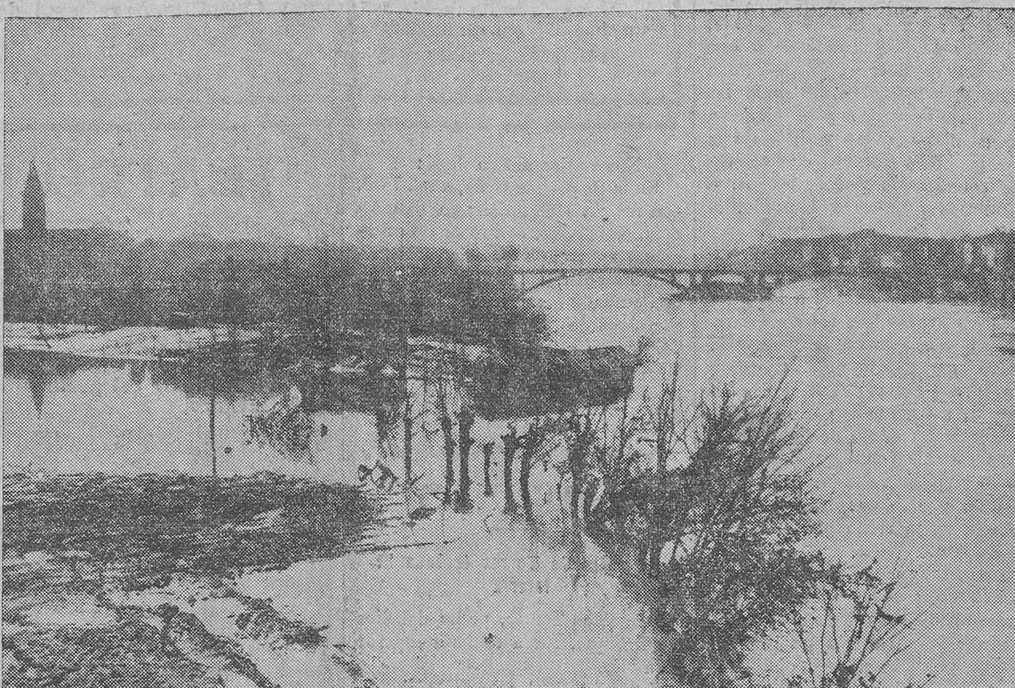
La región de Montauban durante la imponente inundación que ha causado tantas víctimas