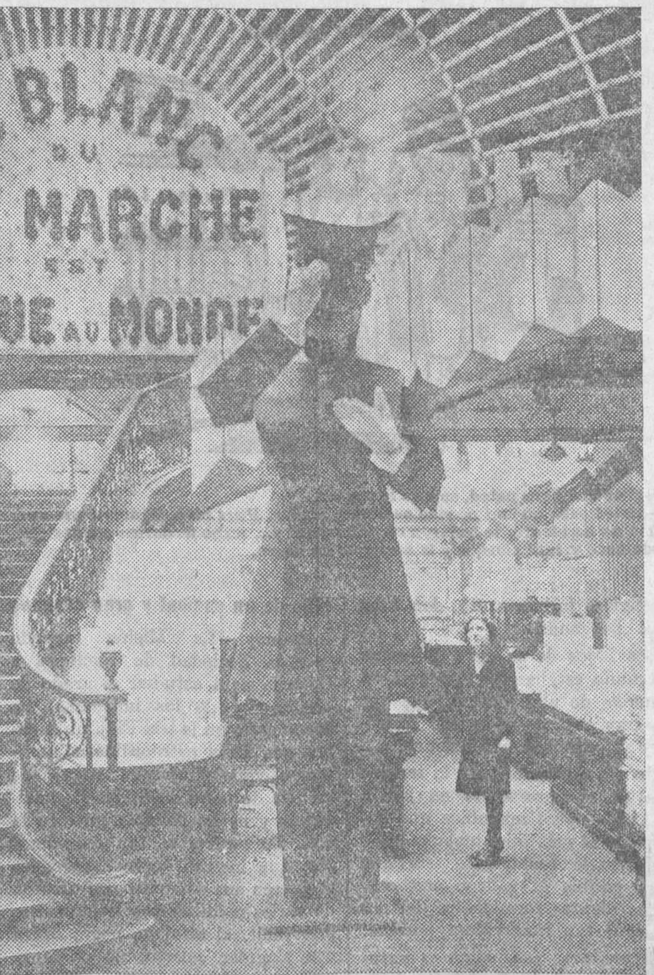
«Pa llamar la atención»—como decía el cuplé—los comerciantes hacen diabluras... y monigotas, como este probó empleado que atrae la vista de los parisienos que pasan ante la exposición de blanco del «Bon marché». (La fotografía, desde luego, es con exposición)

Calle de Cuarte, 11 BORDADOS-PLISADOS-DIBUJOS FIGURINES-VAINICAS FORRERIA DE BOTONES ULTIMAS NOVEDADES PRECIOS ECONÓMICOS