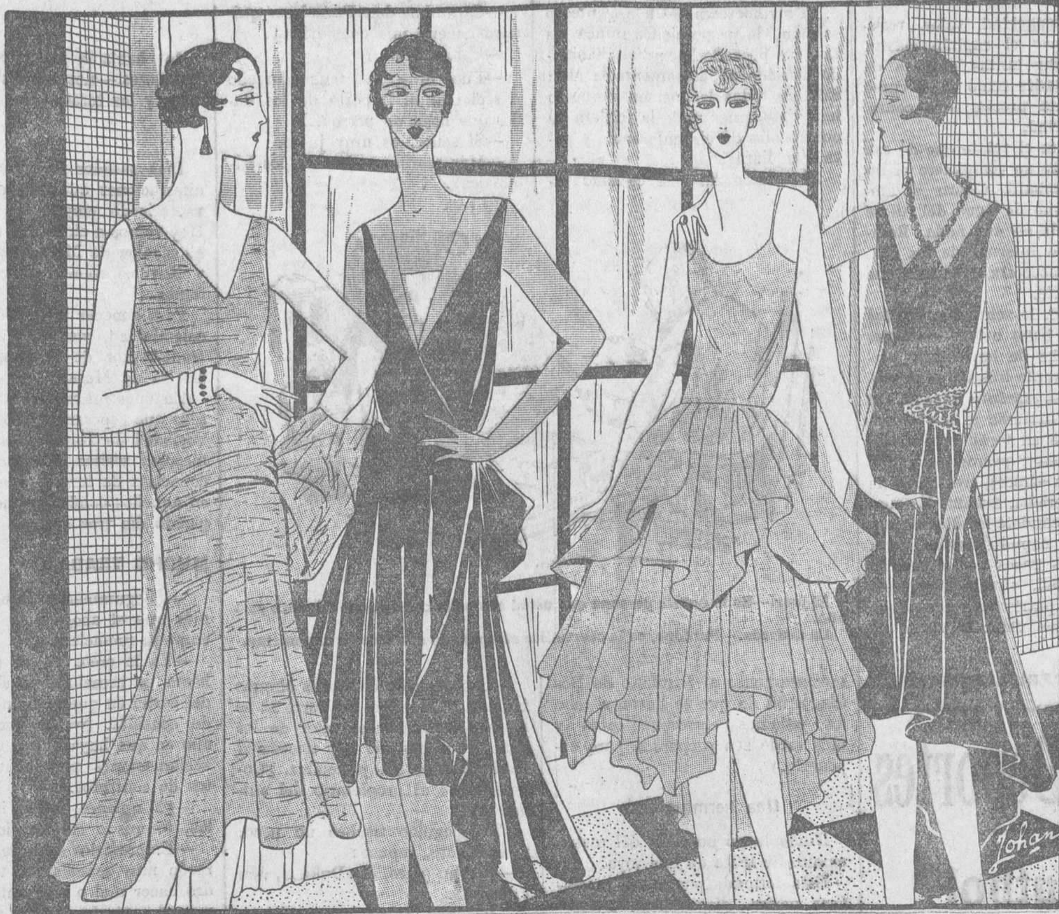
1. Vestido de noche de moaré malva y plata. Cinturón ampliamente drapeado formando un gran nudo en las caderas.—2. Vestido de noche de faya azul vivo, muy recortado y muy amplio. Las solapas son de lamé oro.—3. Vestido de jovencita confeccionado con crespon Georgette color de rosa. En la falda abundan los volantes.—4. Vestido de satén negro, guarnecido de strass y de rubíes. Descote sostenido por un collar de strass y de rubíes

y hasta más tarde, de la época de María Antonieta.