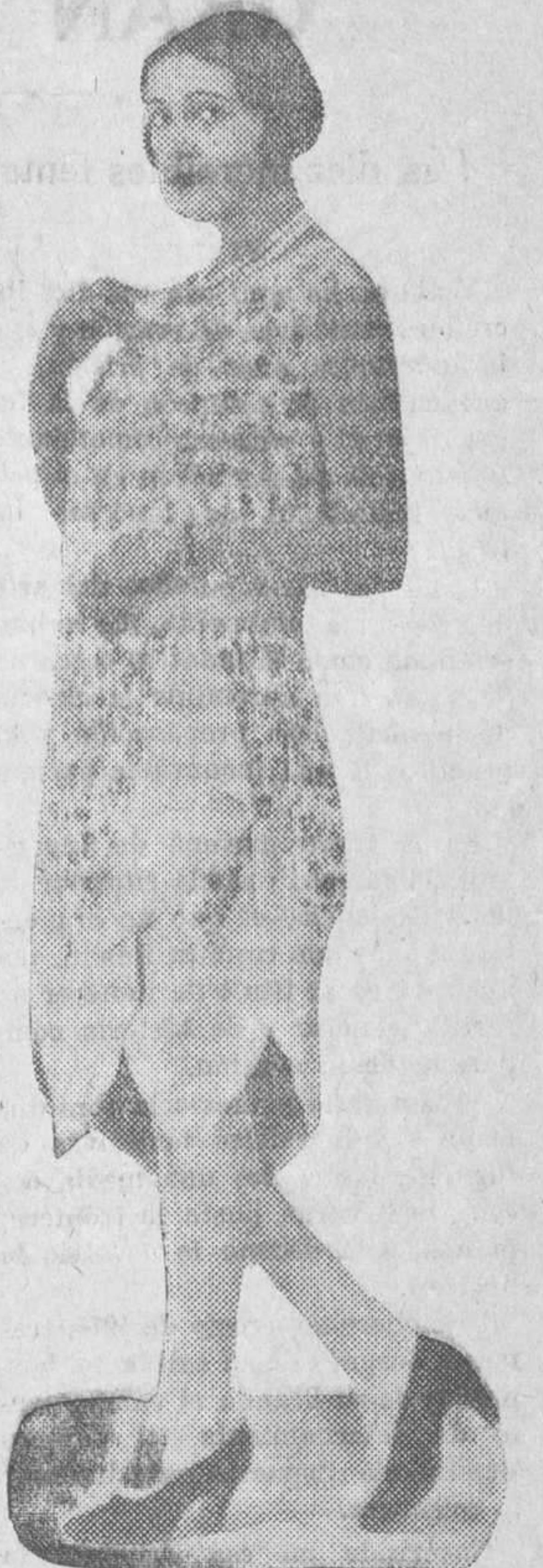
Un modelo de traje, fondo tela cetróna y adornos de encajes

El «chic» es un arte indiscutible y un recurso apreciatísimo para las bolsas modestas.