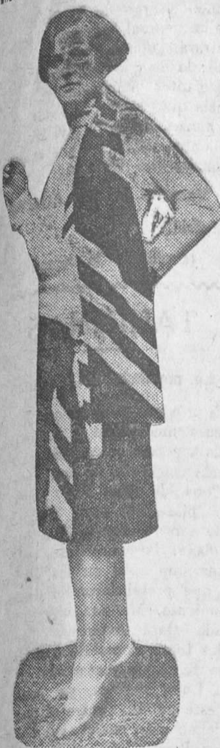
La última novedad en un traje de calle