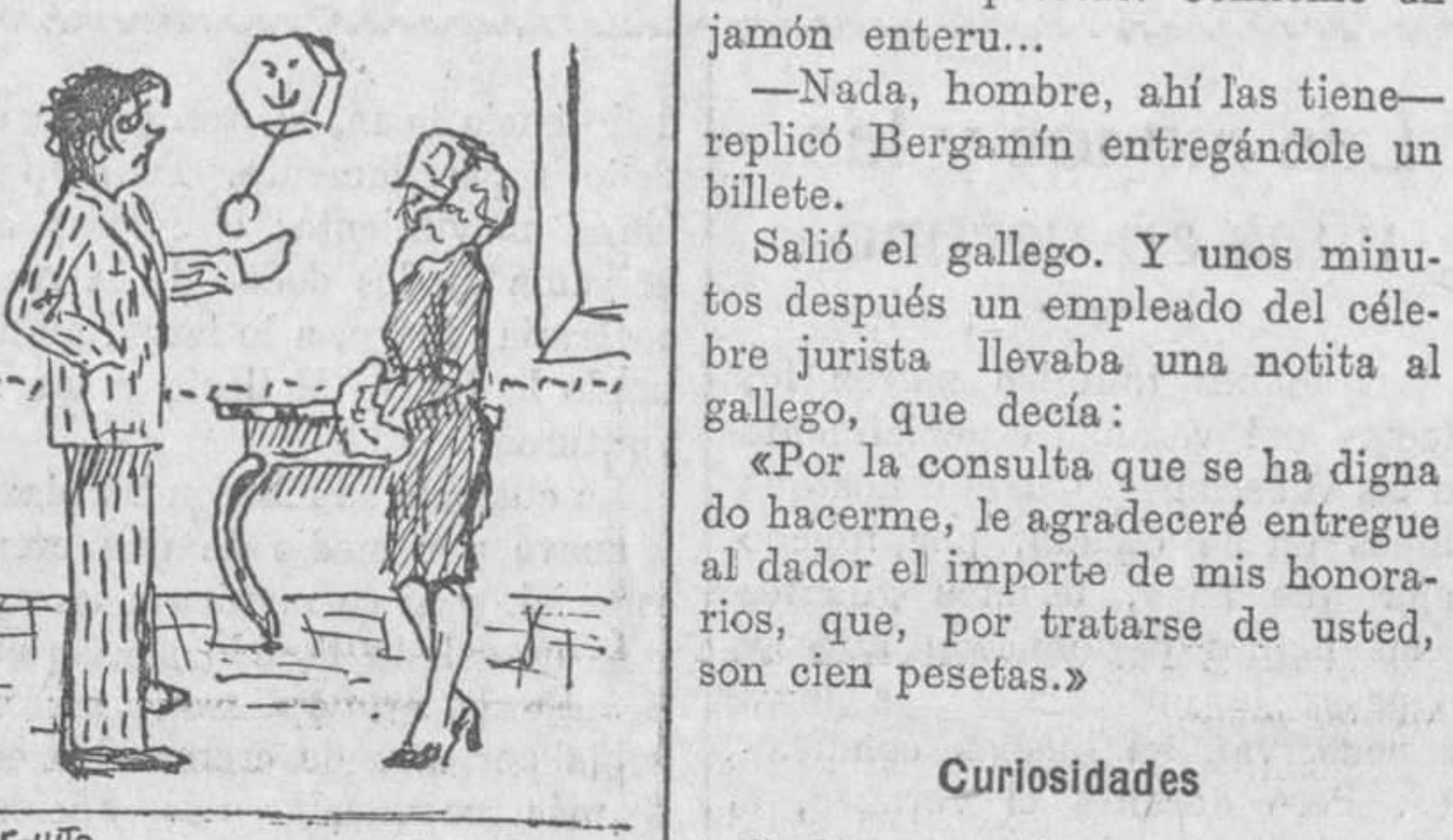
El.—Te dije que hoy estuvieras en casa a las seis, y después de habérmelo prometido, te presentas en casa a las nueve y media. Ella.—¿Me dijiste a las seis? Pues sí yo había entendido a las siete...

Curiosidades Se ha comprobado que en el Pa- cífico existen 17 especies diferentes de tiburones. El uso de los sobres en España empezó en el año 1840. Los penados de las cárceles alemanas solo pueden salir de sus cel- das llevando una máscara, para que no los conozcan los demás presos. En el Sur de Rusia se cultiva el mirasol como podría cultivarse el trigo o el maíz. La planta es útil, pues la semilla da aceite y las hojas forrajes. La mezcla para hacer los fósforos, tales como hoy los usamos, fué descubierta en el año 1872 por un farmacéutico inglés: John Walker.