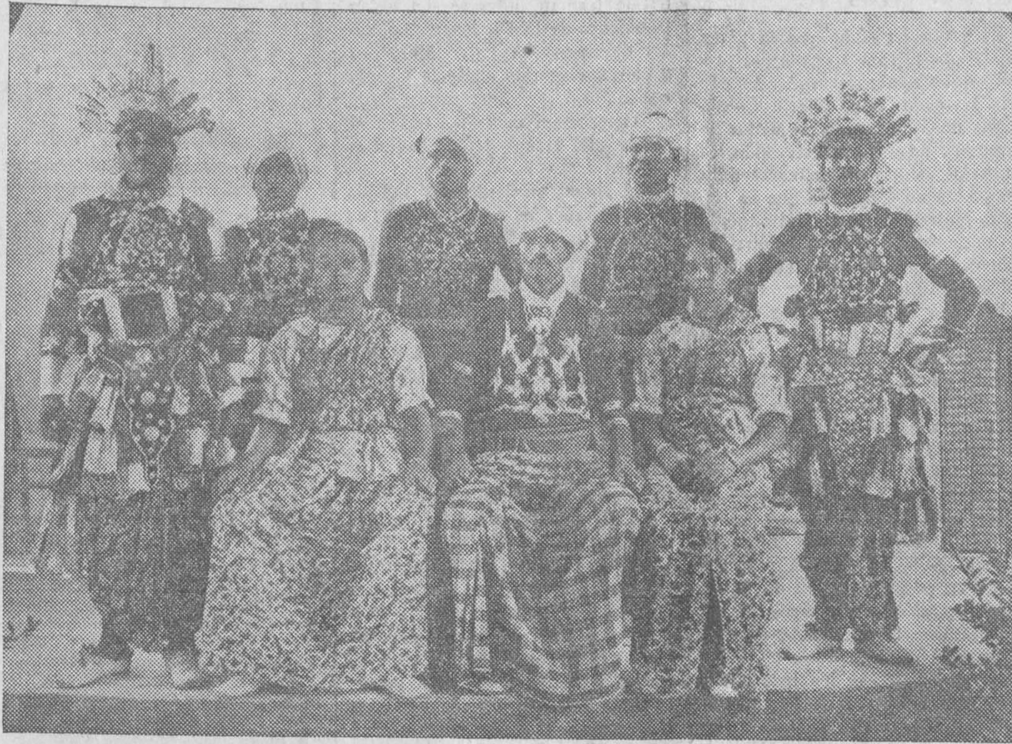
Delegaciones indias en el Pueblo Oriental