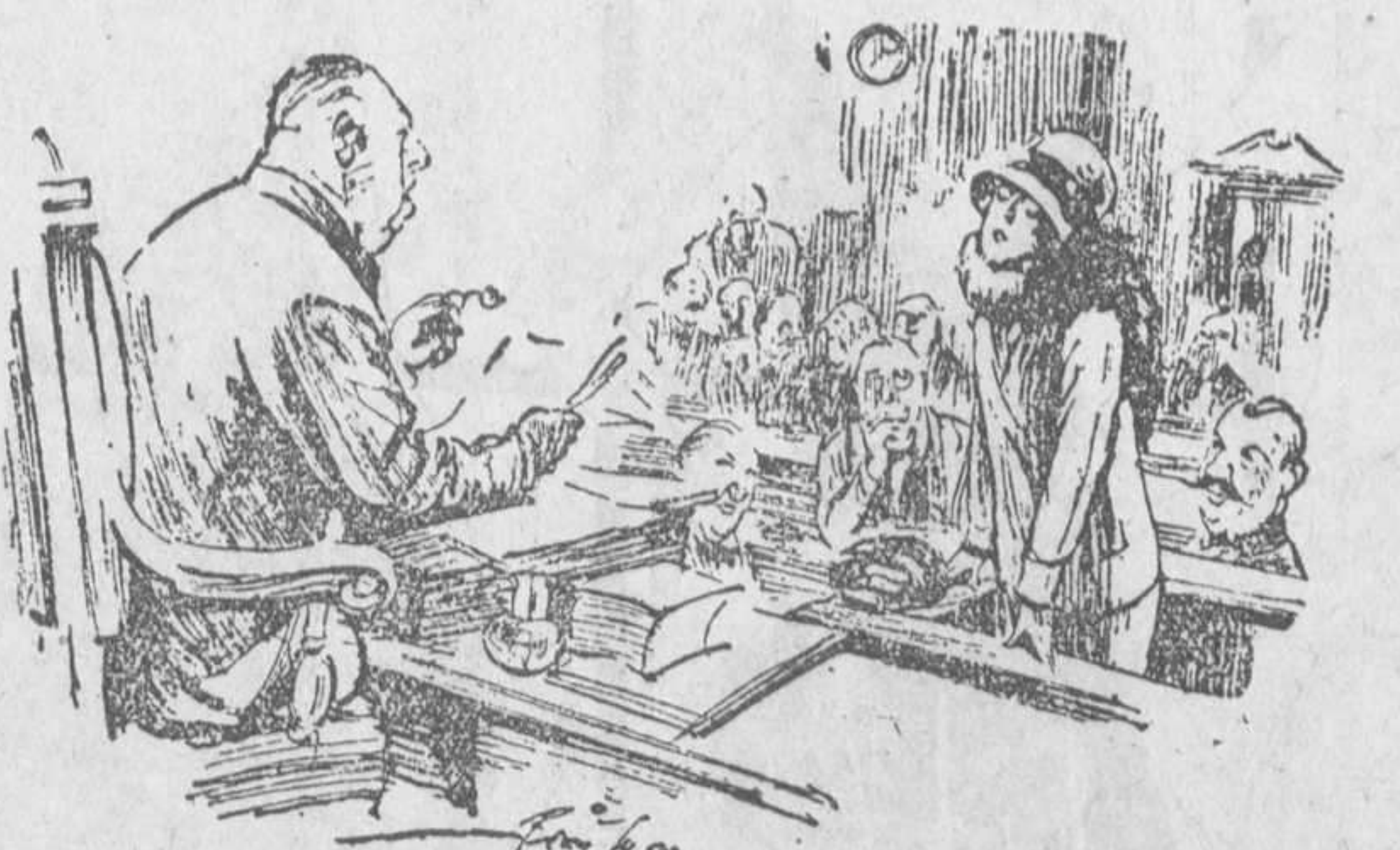
El juez.—Es la quinta persona que usted atropella con su auto durante es t año. La acusada.—Perdone, es la cuarta. He atropellado dos veces a una misma.

Un salmón gigantesco Provincetown.—Un gigantesco salmón, de proporciones nunca vistas, fué pescado hace días, habiendo llamado poderosamente la atención de todas las personas que lo han visto, pues mide la friolera de cuatro pies de circunferencia y pesa cien libras. El salmón ha sido enviado in- —¿Qué hay, vecino?... —Carambu, don Francisco, quisiera hacerle una consulta... —Usted dirá. —Pues mire, ¿yo tengo derecho a reclamar el importe de los daños que haga un perro?... —Sí señor, es muy justo. —¿Más ¿sería preciso ir a los tribunales?... —Eso depende de varias circunstancias. Si el dueño del perro no se niega a satisfacer el valor de los daños causados, no hay necesidad de meterse en los judiciales. ¿Conoce usted al propietario del animal?... El galleguino titubeó un poco, y, sonriendo, repuso: —Fué su perro, el «Dukko», don Francisco. —Hombre, haber empezado por ahí y se hubiera usted ahorrado mucho... ¿En cuánto estima el valor de los daños?... —Por tratarse de usted, le pondré solo 50 pesetas. Comiome un jamón entero... —Nada, hombre, ahí las tiene—replicó Bergamín entregándole un billete. Salió el gallego. Y unos minutos después un empleado del célebre jurista llevaba una motita al gallego, que decía: «Por la consulta que se ha digno hacerme, le agradeceré entregue al dador el importe de mis honorarios, que, por tratarse de usted, son cien pesetas.»